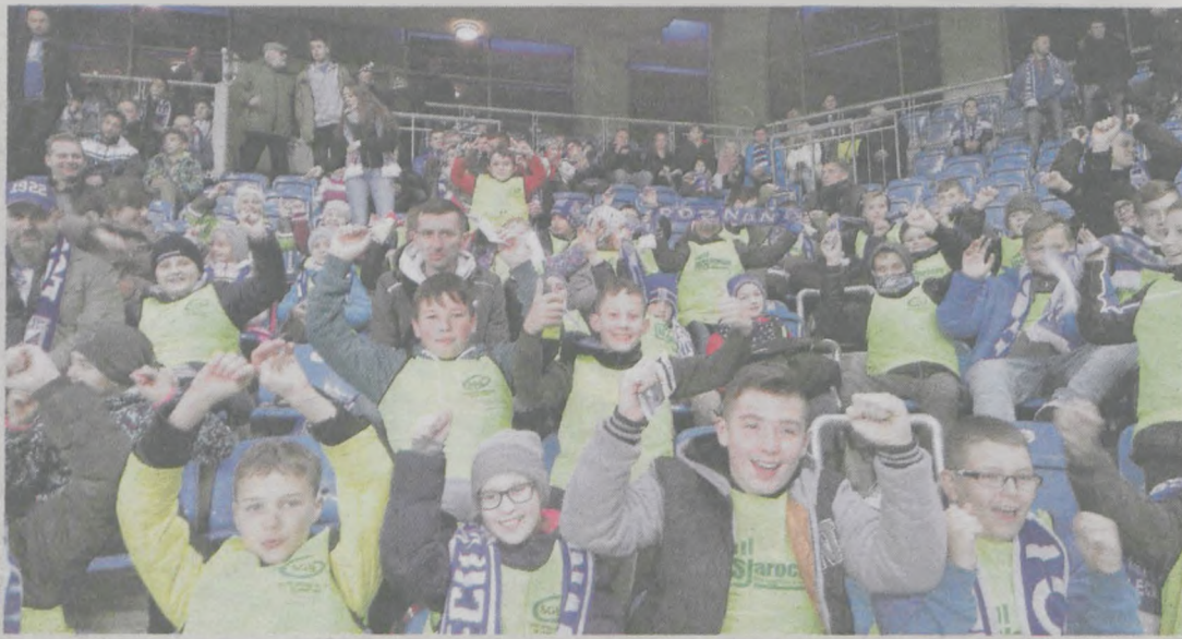
Większość uczestników wyjazdu po raz pierwszy kibicowała piłkarzom Lecha Poznań „na żywo”