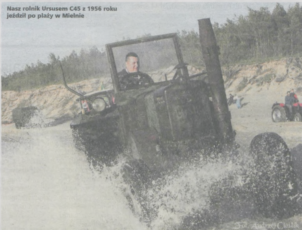
Nasz rolnik Ursusem C45 z 1956 roku jeździł po plaży w Mielnie