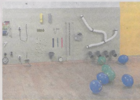
Ściana sensoryczna to prawdziwy raj dla małych odkrywców

Więcej informacji można znaleźć na fanpage'u „Źródło Wyobraźni”.