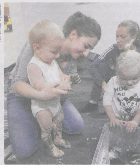
Zajęcia testowe z masami sensorycznymi były dla dzieci nowym doświadczeniem

Dzieci będą miały okazję bawić się sensorycznymi masami, mąką, makaronami, ale twórcy zajęć przygotowali też zabawy muzyczne i tzw. sensoryczną ścianę. - Znajdują się na niej m.in. kontakty, gniazdko, telefon, klawiatura od komputera, a także różnego rodzaju zamki, suwaki i inne rzeczy, których nie chcemy dać dziecku w domu, a u nas będą mogły one ich dotknąć,