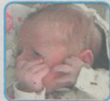
ALEKSANDER SZYDŁOWSKI ur. 17 listopada o godz. 8.40 waga 2.860 g, wzrost 53 cm