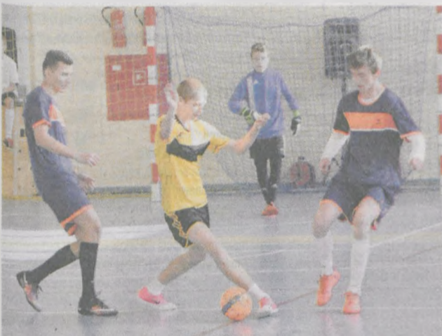
Jarociniacy (w żółtych koszulkach) z meczu na mecz grali coraz lepiej