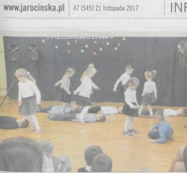
Najbardziej spodobal się twist w wykonaniu przedszkolaków