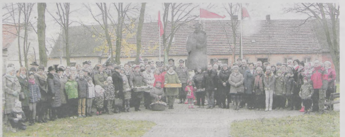
Po oficjalnych uroczystościach pod pomnikiem gen. Stanisława Taczaka wszyscy stanęli do pamiątkowego zdjęcia