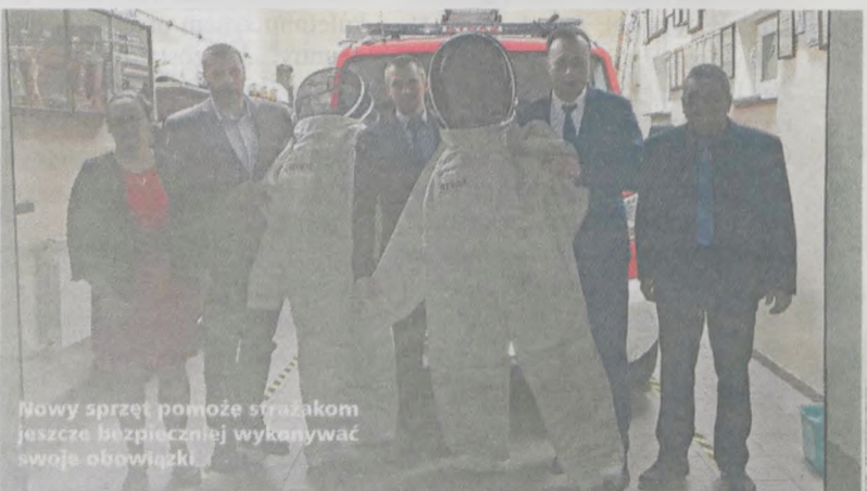
Nowy sprzęt pomoże strażakom jeszcze bezpieczniej wykonywać swoje obowiązki.