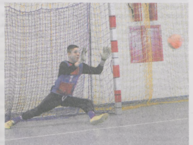
Zwycięzców w kilku meczach musiały wyłonić rzuty karne