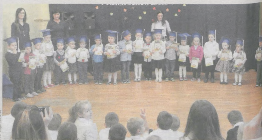
Wspólne zdjęcie maluchów z dyrektorką szkoły i wychowawczyniami