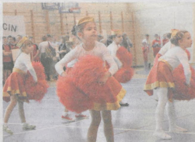
Otwarcie uświetnił występ żerkowskich mażorettek