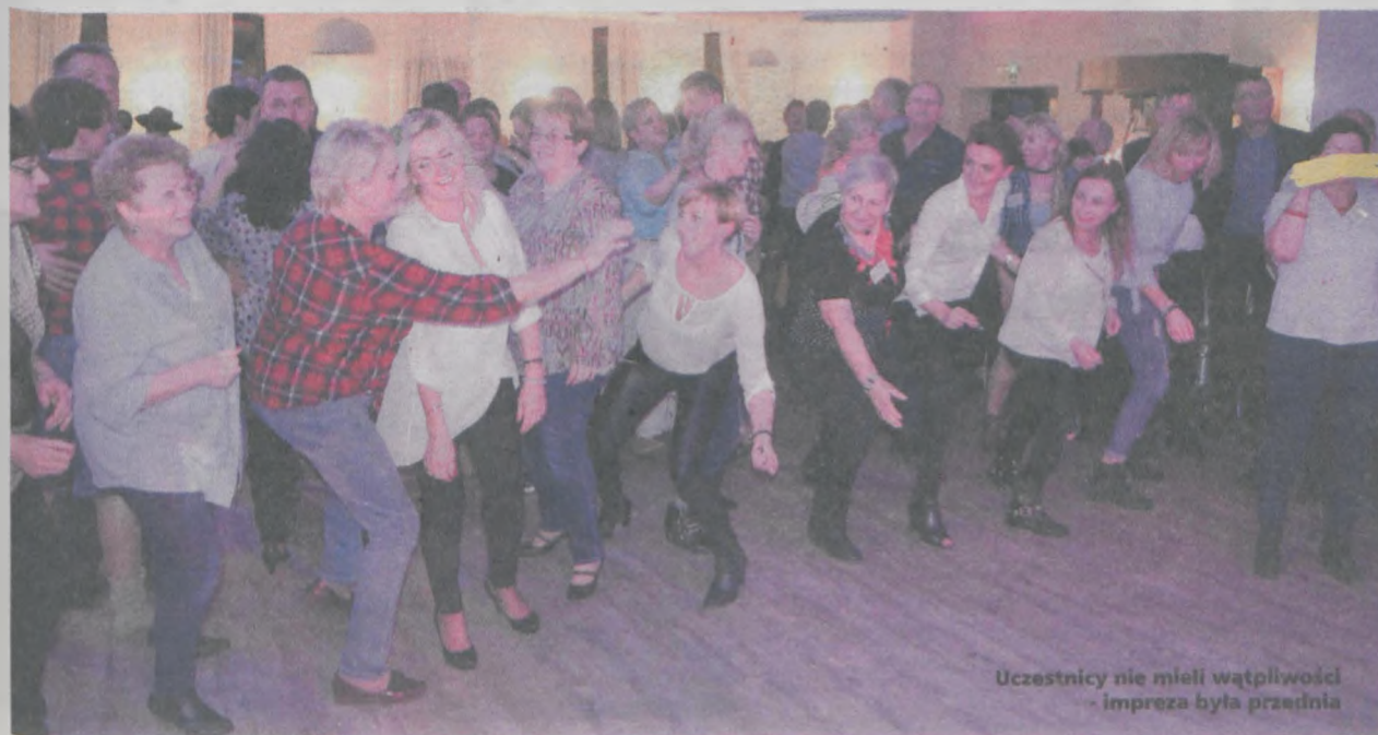
Uczestnicy nie mieli wątpliwości - impreza była przednia