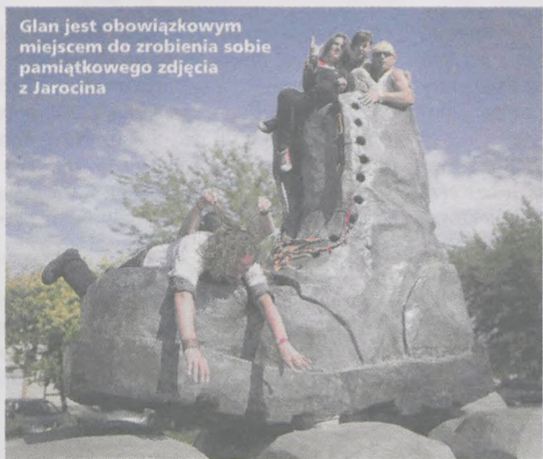
Glan jest obowiązkowym miejscem do zrobienia sobie pamiątkowego zdjęcia z Jarocina

Rzeźbę zaprojektował Jakub Bogatko wraz z Małgorzatą Kruk. But jest wy-