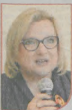
BEATA KEMPA minister w kancelarii premiera

NAJLEPSZE DRUŻYNY TURNIEJU I. Ośrodek Kuratorski Siemianowice Śląskie II. Ośrodek Kuratorski Wieluń III. Poznań Ośrodek Kuratorski nr 1 IV. Ośrodek Kuratorski Jarocin