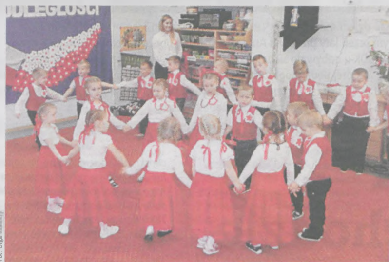
Biało-czerwone stroje przedszkolaków z Mieszkowa wpisywały się w patriotyczny charakter przedstawienia, które zaprezentowały