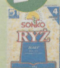
Ryż Sonko kartonik 4 x 100g (5,25zł/kg)