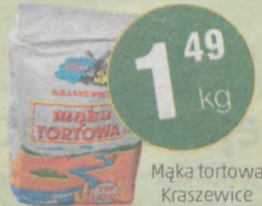
Mąka tortowa Kraszewice