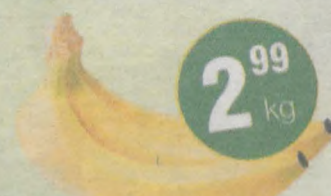
Banan Kraj pochodzenia Kuba