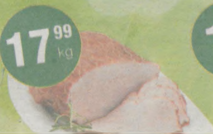
Szynka zrazowa Kasztelan