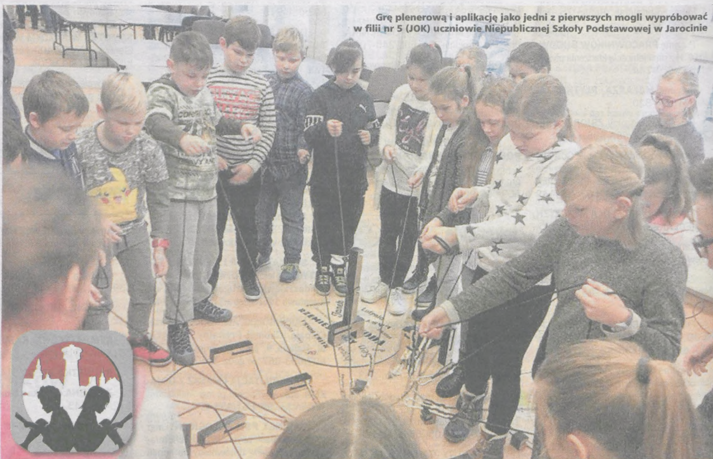
Grę plenerową i aplikację jako jedni z pierwszych mogli wypróbować w filii nr 5 (JOK) uczniowie Niepublicznej Szkoły Podstawowej w Jarocinie

Ten tydzień może być początkiem długo oczekiwanych zmian w sferze finansowej. Zastanów się nad pomysłami na pomnożenie gotówki. Szukaj sposobów na zarabianie. Słuchaj każdy grosz. Pozwól, by na dłuższą gościł na Twoim koncie. Nadmiar energii wykorzystaj na sprawy domowe. Remont czy generalne porządki - wszystko w domu się przyda. Przygotuj dom przed zimą, bo podobać ma być sroga.