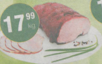
Szynka z pieca Nowak