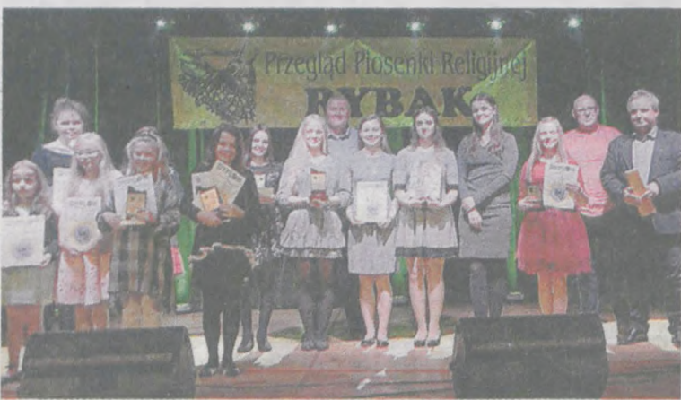
Nagrodzeni wraz z jury stanęli do wspólnego zdjęcia w sali Gminnego Ośrodka Kultury w Jarzewie, gdzie odbył się przegląd