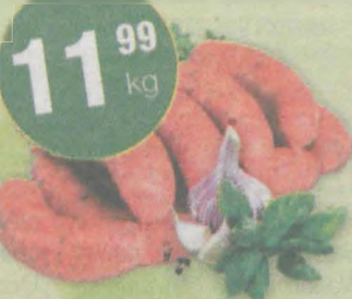
Kielbasa śląska JBB