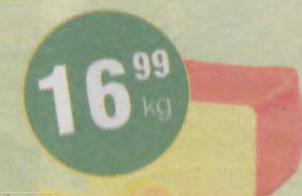
Ser Edamski Mlekovita