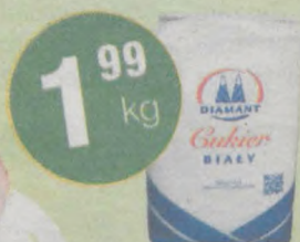
Cukier kryształ Diamant