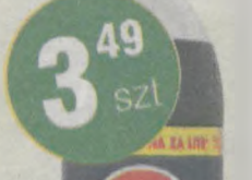
Pepsi 2,25l (1l/1,55zł)