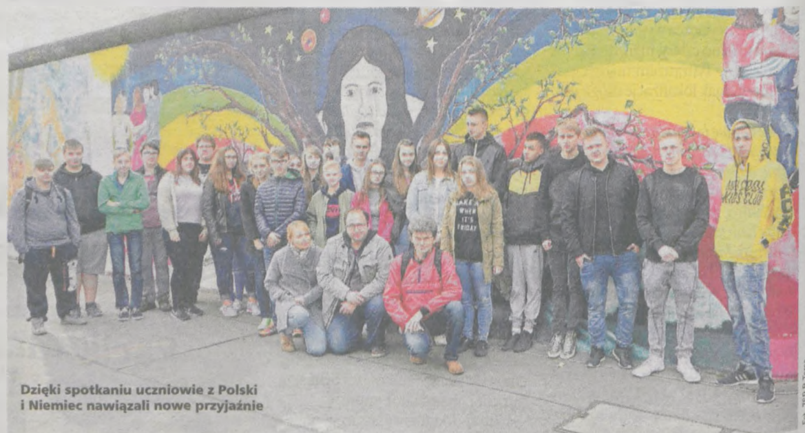
Dzięki spotkaniu uczniowie z Polski i Niemiec nawiązali nowe przyjaźnie