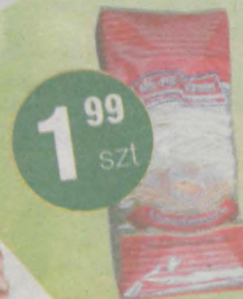
Makaron Arc-Pol Czaniec Krajanka 4-jajeczna 250g (7,96zł/kg)