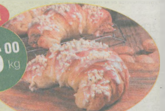
Rogale Marcińskie z piekarni Vogt