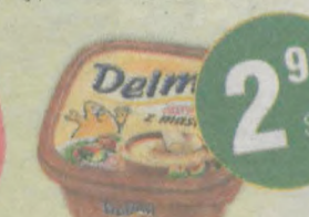
Delma Extra z masłem 450g (1kg/6,44zł)