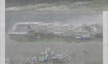
Oprócz wielkich statków wycieczkowych i transportowych po Jangcy pływają małe łodzie turystyczne, na rzece i w jej okolicy toczy się też zwyczajne życie