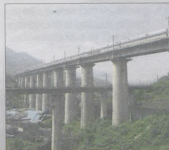
Kolejowa krzyżówka w górach