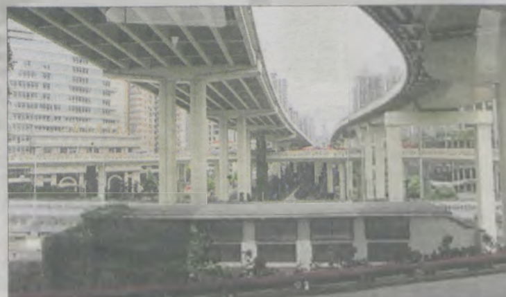
Shanghai, na rondzie na trzecim poziomie