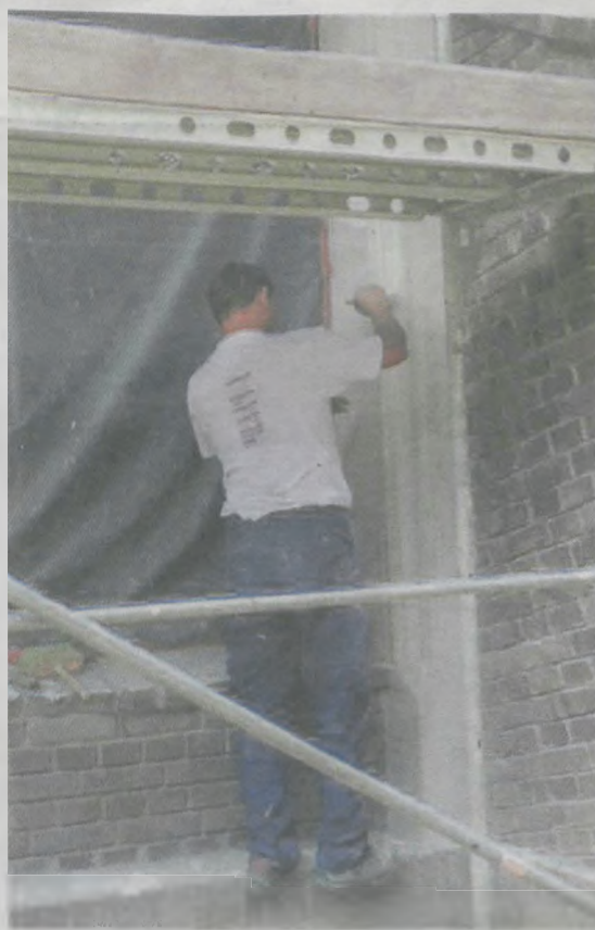
Przy renowacji pałacu Radolińskich w upalne dni pracuje się bardzo ciężko