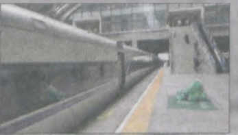
W wyznaczonym miejscu śmieci czekają na wyniesienie. Peron pusty, bo podróżni wpuszczani są dopiero przed odjazdem pociągu i tylko za okazaniem ważnego biletu

Komu kojarzy się podróż pociągami z ogólnym brudem i klejącą się podłogą? Tu spędziłam 9 godzin w pojeździe na szynach, przez korytarze którego co godzinę przechodziły służby porządkowe z plastikowymi workami i zbierały od pasażerów śmieci. Za nimi podążała osoba myjąca podłogę. Worki na każdej stacji były odbierane przez kolejne służby, czekające na skraju peronu na baczność - jedna osoba przy jednym wejściu do wagonu. Pociąg zatrzymywał się na stacji idealnie w określonym miejscu.