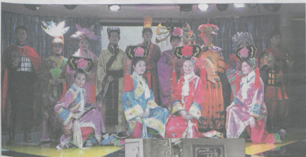
Zaloga statku rejsowego musi być także uzdolniona artystycznie, bo daje się tam przedstawienia dla podróżnych