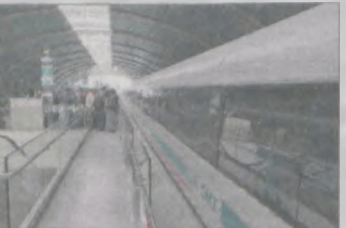
Wsiadamy do magleva (zwróćcie uwagę na błyszczący czystością peron)