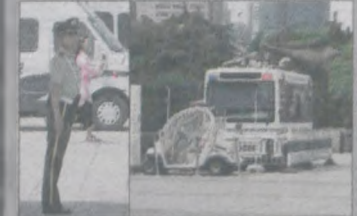
Policjant na służbie na placu Tian'anmen w Pekinie. Obok - posterunek policji na shanghaijskim deptaku

Znak stopu po chińsku. Oznaczenia uliczne są standardowe - tylko te „krzaczkami”