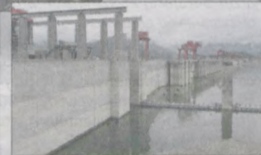
Przy tamie na Jangcy zaczynają albo kończą trasę rejsy wycieczkowe

zienkę i wiele innych udogodnień, czego brakowało na wsi. Budowa tamy miała przyczynić się także do śmierci kilkudziesięciu tysięcy osób. - Ilu naprawdę ludzi tu zginęło? - pytamy. Linda III milczy. Po chwili dodaje: - To tajemnica państwowa.