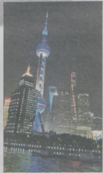
„Otwieracz” czyli Financial Center oraz Shanghai Pearl Tower, czy jak nazywają ją inni „Perła Orientu”, konkurują z nową wieżą już tylko kształtami, zachwycając zwłaszcza podczas wieczornych wycieczek. Tu podświetlone na niebiesko, na prawo od „Otwieracza” widać Shanghai Tower