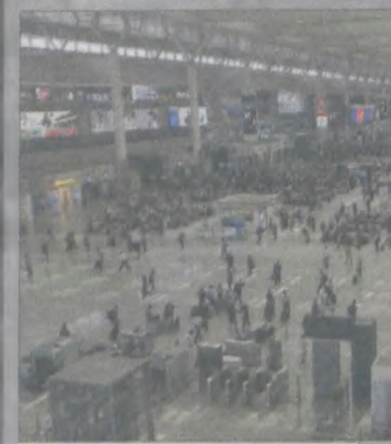
Hol dworca kolejowego w Shanghaiju jest wielkości stadionu. Po przejściu przez ochronę i bramki tu czeka się na pociąg

Są też minusy takiej „opieki” - w Chinach kontroluje się internet, Google i Facebook nie działa, a jak się chcesz załogować do ogólnodostępnego Wi-Fi, musisz podać swoje dane - stąd nasze próby łączenia się ze światem poległy już na starcie przy pierwszym pytaniu zadanym w „krzaczkach”. Co ciekawe - Chińczycy mają w komórkach alfabet facjiński, ale pod tymi ikonkami kryją się ich znaki. Z internetu korzystaliśmy w hotelach, działając na WhatsAppie. Jarocinska.pl też chodziła :)