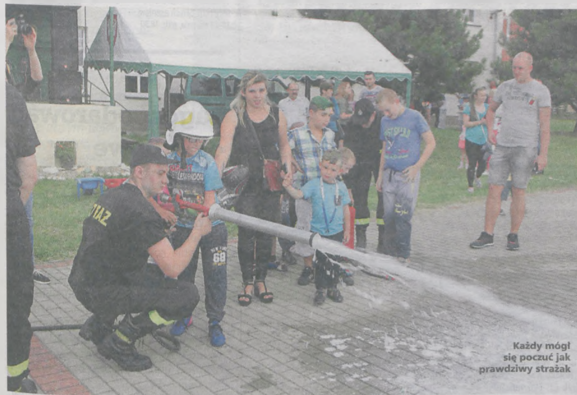
Każdy mógł się poczuć jak prawdziwy strażak