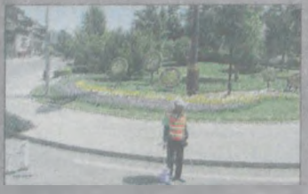
Nie dziwne, że wszystkie skwerki są tak zadbane, skoro mają „aniola stróża”