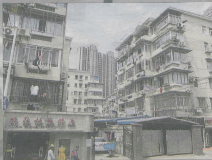
Nowoczesne bloki rosną obok starych kamienic