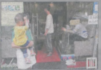
Z przymrozaniem oka: dba się tutaj także o higienę osobistą. Na zdjęciu lokal, w którym można skorzystać z peelingu stóp... rybkami!

Komu kojarzy się podróż pociągami z ogólnym brudem i klejącą się podłogą? Tu spędziłam 9 godzin w pojeździe na szynach, przez korytarze którego co godzinę przechodziły służby porządkowe z plastikowymi workami i zbierały od pasażerów śmieci. Za nimi podążała osoba myjąca podłogę. Worki na każdej stacji były odbierane przez kolejne służby, czekające na skraju peronu na baczność - jedna osoba przy jednym wejściu do wagonu. Pociąg zatrzymywał się na stacji idealnie w określonym miejscu.