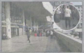
Piąta rano na dworcu....

Pierwszy spacer na chińskiej ziemi - po shanghaijskiej promenadzie, tzw. Bundzie, i spostrzeżenia: jak tu czysto! Trudno się jednak temu dziwić. Poszczególne odcinki ulic opiekują się oddziały sprzątaczy, które każdego ranka wymiatają liście i papierki, a chodniki i deptaki (tuwaga!)... myją na mokro mopami.