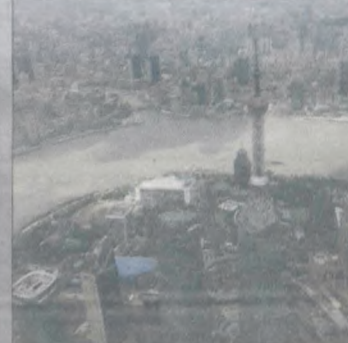
Zapierający dech w piersiach widok na 25-milionowe miasto otulone... smogiem

Shanghai Tower - najwyższy budynek Chin, drugi na świecie. Ma 632 m wysokości i jest udostępniony dla turystów od sierpnia 2016 r. Bije wszelkie rekordy: najwyższa restauracja na świecie (na 120. piętrze), najwyższy hotel na świecie (na 110. piętrze), najwyższy basen na świecie (na 84. piętrze), najszybsza winda (18 m/sek. - czego oczywiście nie odczuwasz, poza tym, że zatykają się uszy) i najwyższa platforma widokowa, znajdująca się na 546. metrze. Budynek został tak skonstruowany, aby zmniejszyć nacisk wywierany przez wiatr, umożliwić zbieranie deszczówki oraz generowanie energii przez turbiny wiatrowe. Kosztował ponad 2 mld dolarów.