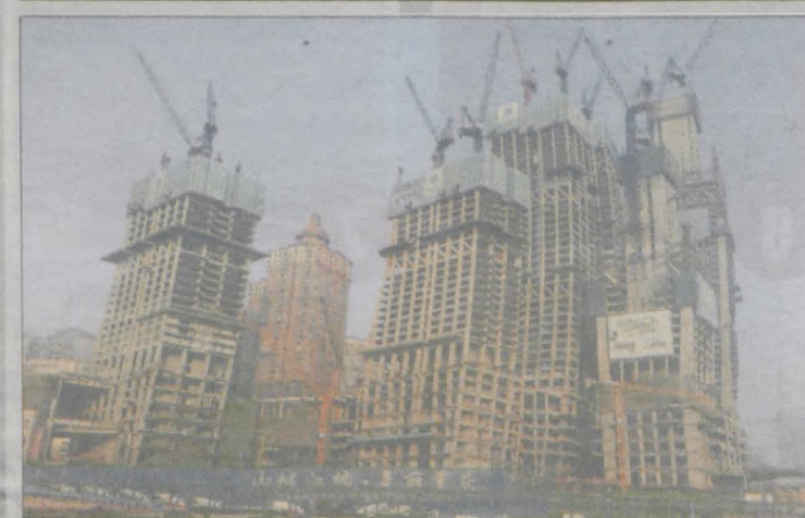
Chongqing. Jak budować, to od razu kilka wieżowców naraz