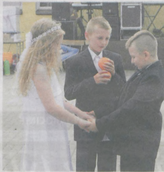
Dzieciaki odtworzyły teledysk zespołu AFTER PARTY