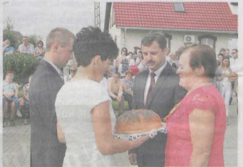
Życzę Wam, aby chleba w Waszych domach zawsze było pod dostatkiem. Szanujmy go i szanujmy tych, dzięki którym go mamy - podkreślała pani sołtys