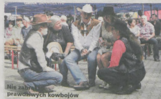
Nie zabrakło prawdziwych kowbojów