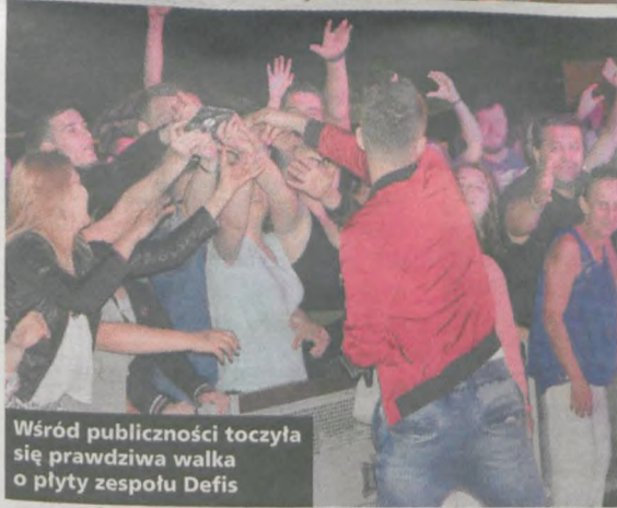
Wśród publiczności toczyła się prawdziwa walka o płyty zespołu Defis