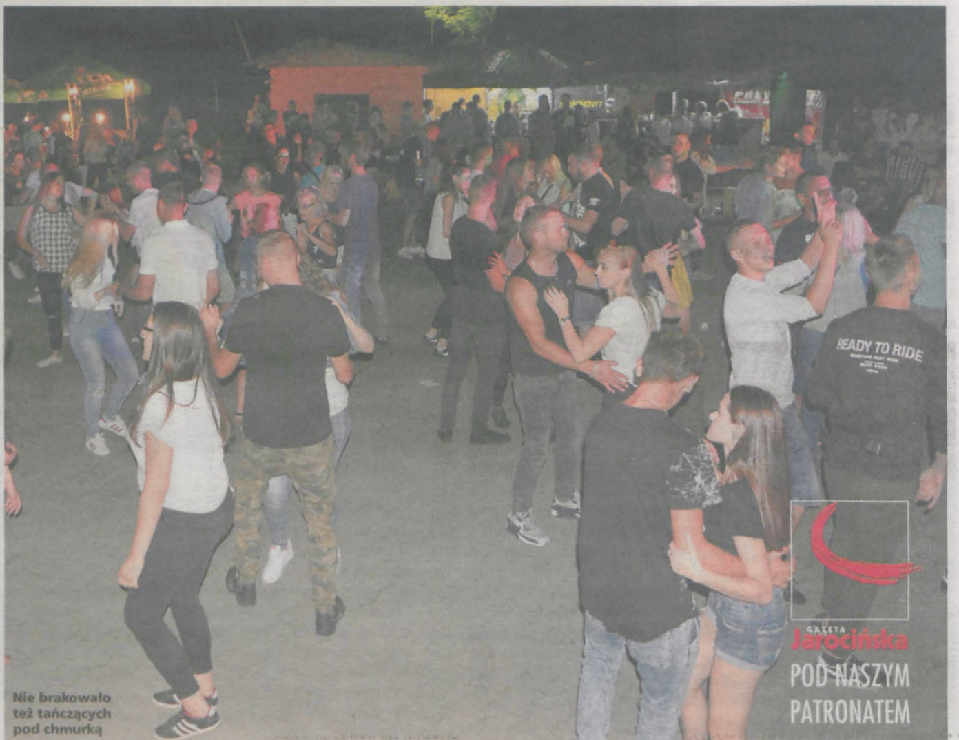
Nie brakowało też tańczących pod chmurką