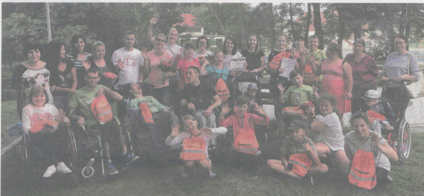
Na zakończenie obozu zorganizowano ognisko. Wszyscy uczestnicy otrzymali dyplomy oraz upominki od firmy Bridgestone