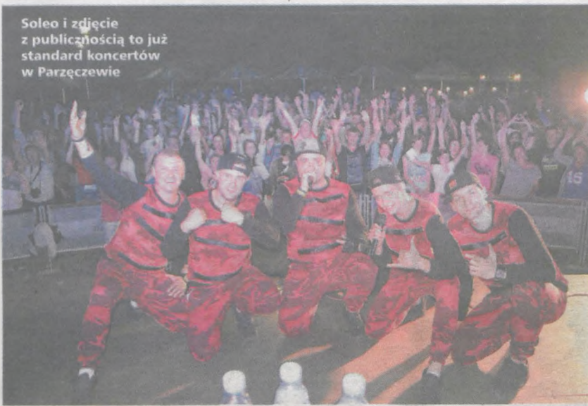
Soleo i zdjęcie z publicznością to już standard koncertów w Parzęczewie