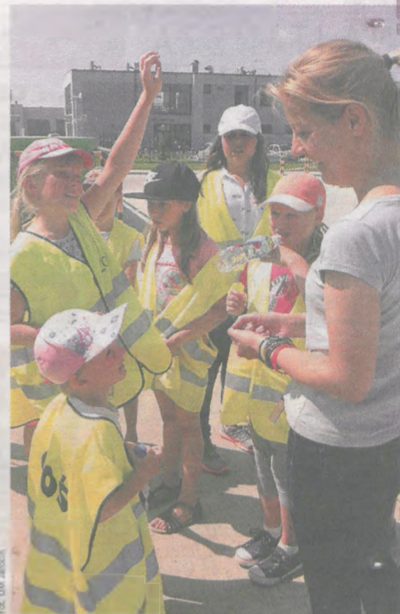
Pytaniom na temat przetwarzania odpadów nie było końca