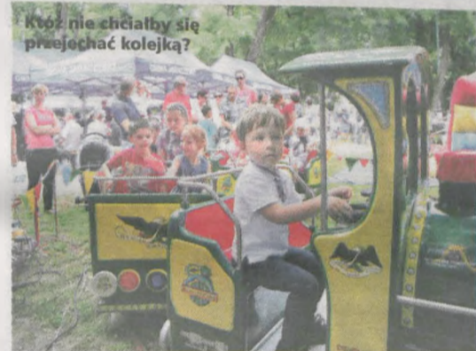
Ktoż nie chciałby się przejechać kolejką?