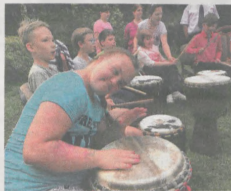
Wszystko wskazuje na to, że przy Fundacji „Ogród Marzeń” powstanie grupa bębniarska