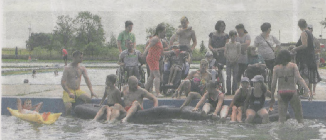
Mimo że pogoda w tym roku nie była najlepsza, pierwszego dnia udało się skorzystać z basenu w Żerkowie. Uczestnicy odwiedzili również aquapark w Jarocinie