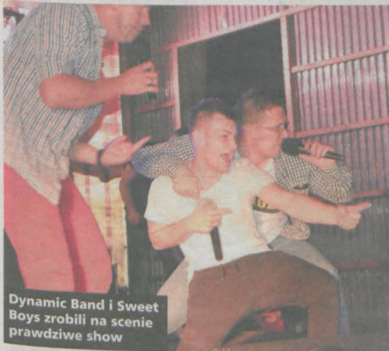
Dynamic Band i Sweet Boys zrobili na scenie prawdziwe show