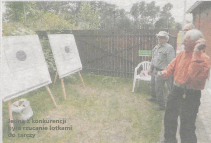
Jedną z konkurencji było rzucanie lotkami do tarczy