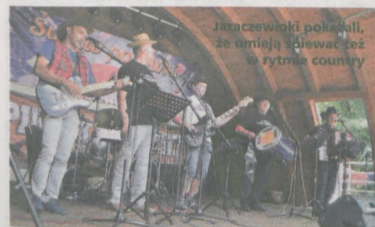
Jaraczewiaki pokazali, że umieją śpiewać też w rytmie country