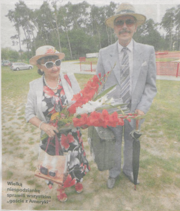
Wielką niespodzianką sprawili wszystkim „goście z Ameryki”

Ok. 60 osób bawiło się na pikniku emerytów zorganizowanym na strzelnicy żerkowskiego bractwa kurkowego. Byli wśród nich „goście z Ameryki”.