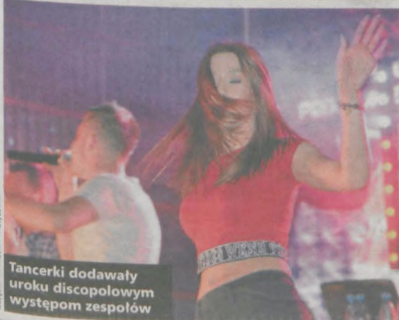
Tancerki dodawały uroku discopolowym występom zespołów