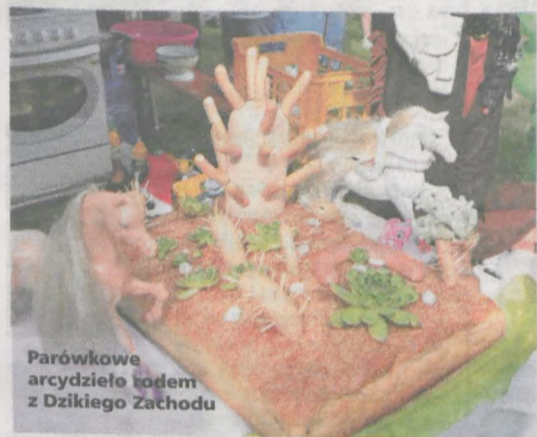
Parówkowe arcydzieło lodem z Dzikiego Zachodu