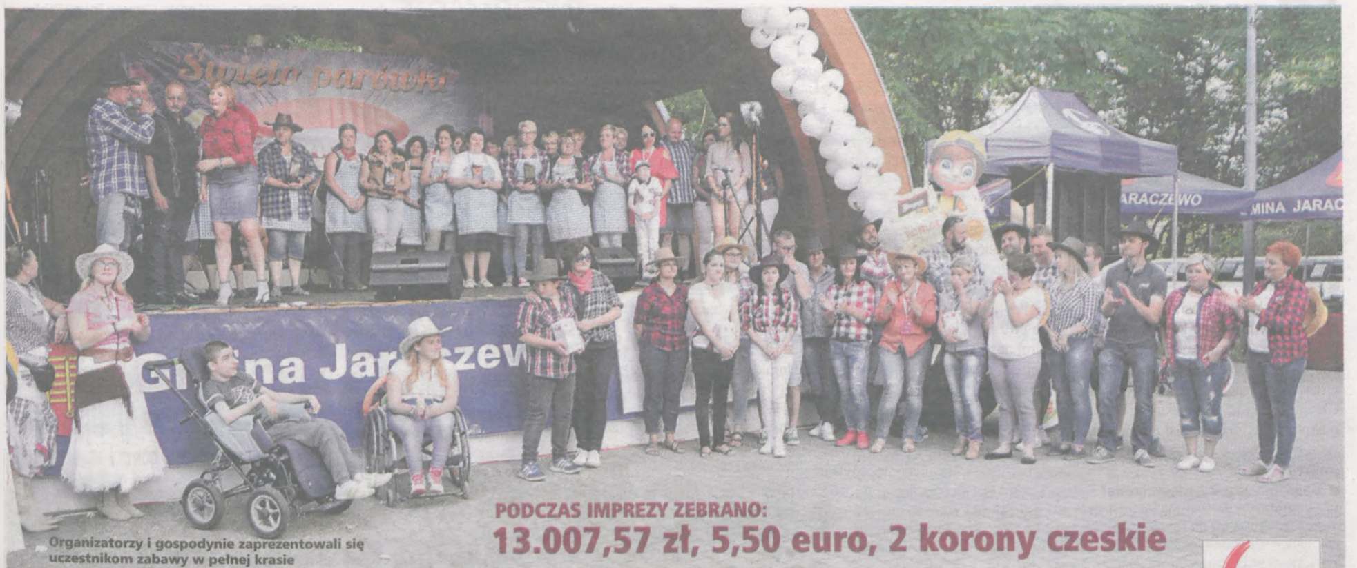
Organizatorzy i gospodynie zaprezentowali się uczestnikom zabawy w pełnej krasie

PODZAS IMPREZY ZEBRANO: 13.007,57 zł, 5,50 euro, 2 korony czeskie