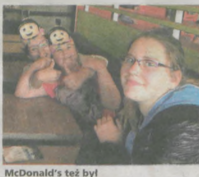
McDonald's też był