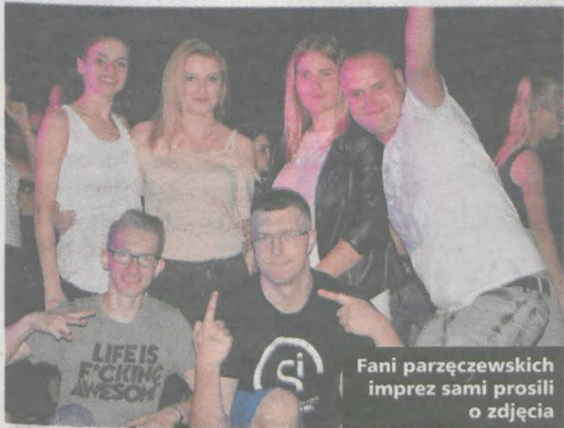
Fani parzęczewskich imprez sami prosili o zdjęcie