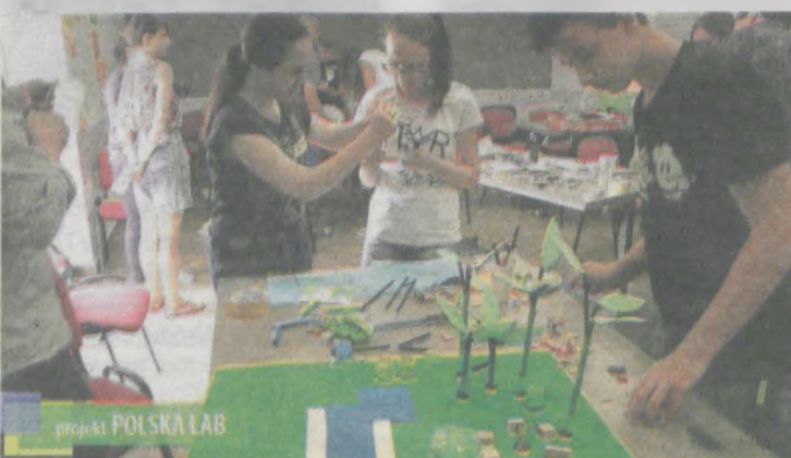
Najpierw młodzież wymyślała, co można zrobić, potem tworzyła makiety, a następnie swoje pomysły przenosiła w wirtualną przestrzeń

„Gazeta Jarocińska” jest patronem medialnym projektu. Będziemy na naszych łamach przedstawiać kolejne etapy jego realizacji. Zachęcamy do udziału w dyskusji. Może ktoś ma jakieś ciekawe przemyślenia, rozwiązania. Czekamy na listy - redakcja@jarocinska.pl