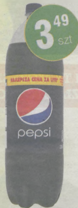
Pepsi 2,25l (1,55zł/l)

Przyjmujemy zamówienia na imprezy okolicznościowe - oferujemy atrakcyjne rabaty!