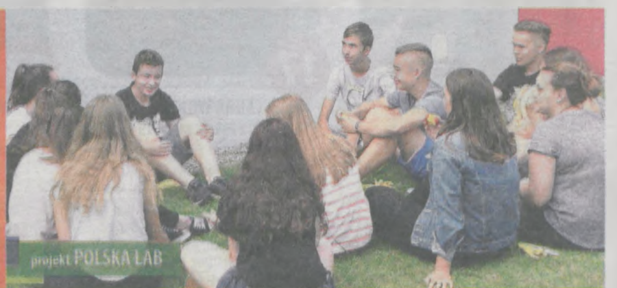
Praca twórcza w plenerze

„Gazeta Jarocińska” jest patronem medialnym projektu. Będziemy na naszych łamach przedstawiać kolejne etapy jego realizacji. Zachęcamy do udziału w dyskusji. Może ktoś ma jakieś ciekawe przemyślenia, rozwiązania. Czekamy na listy - redakcja@jarocinska.pl