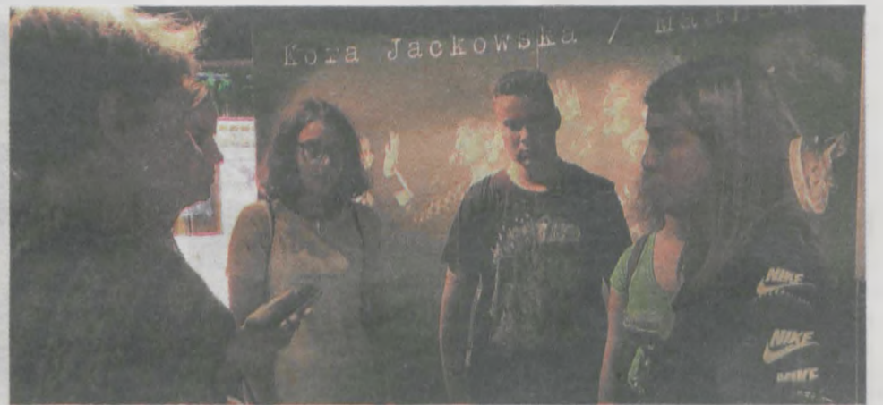
Młodzież odwiedziła Spichlerz Polskiego Rocka. Nakręciła tam spot i zastanawiała się, jak do muzeum przyciągnąć młodych