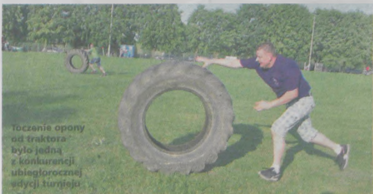
Toczenie opony od traktora było jedną z konkurencji ubiegłorocznej edycji turnieju

Turniej zakończy się grillowaniem dla uczestników zmagania. (era)