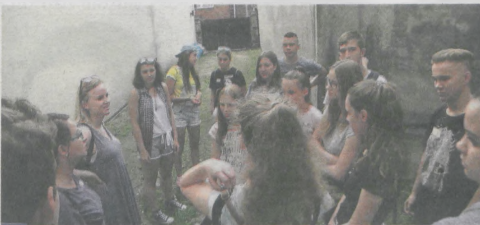
Uczestnicy projektu odwiedzili kamienicę na Rynku, w której ma powstać biblioteka. Mają wiele pomysłów, co mogłoby pojawić się tutaj dla młodych