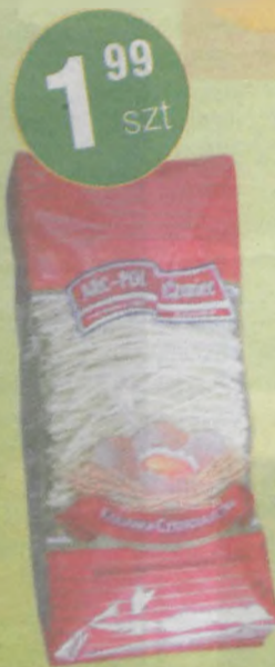
Makaron Czaniecki czerwony