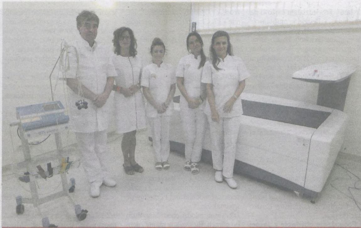
AKCJA DLA MIESZKAŃCÓW POWIATU JAROCIŃSKIEGO