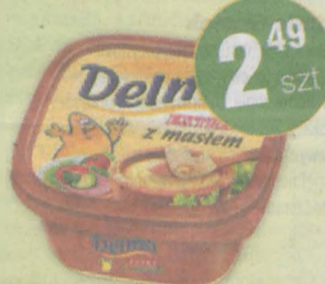
Delma Extra 450g