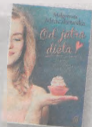
„Od jutra dieta!” Zapiski niedoskonałej pani domu” Wydawnictwo Czwarta Strona Poznań 2017