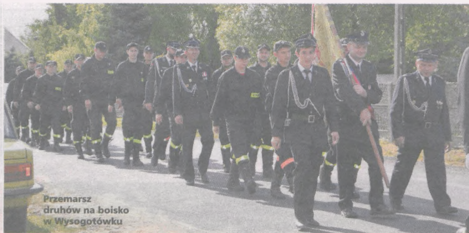
Przemarsz druhow na boisko w Wysogotówku

► 50-LECIE ŚWIĘTOWAŁA JEDNOSTKA OSP W WYSOGOTÓWKU