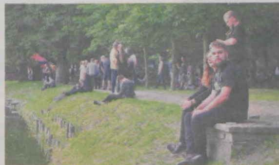
W tym roku „Rów” był nad stawem. Była tu nie tylko darmowa scena, ale też foodtrunki