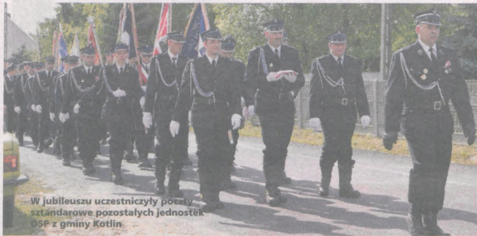
W jubileuszu uczestniczyły posady sztandarowe pozostałych jednostek OSP z gminy Kotlin