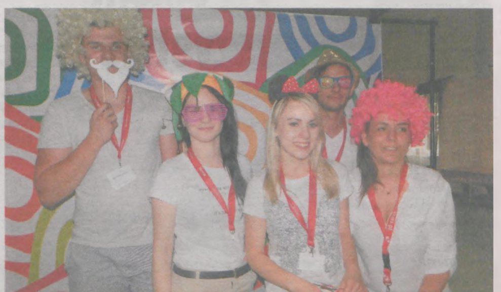
Jedną z atrakcji była fotobudka