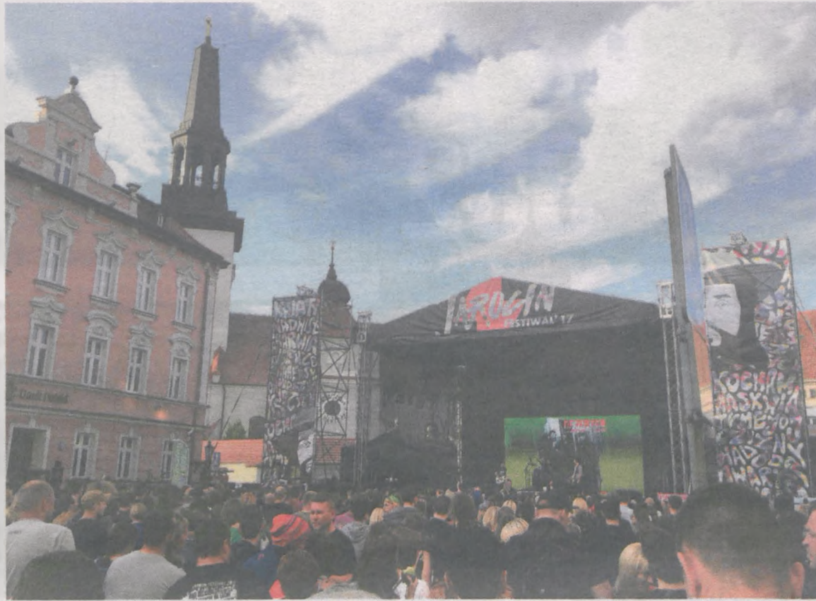
Scena na Rynku podkreślała urok naszej starówki. Znajomi mojej koleżanki wiele razy byli na jarocińskim rynku, dopiero teraz jednak zachwycili się jego pięknem. Scena więc powinna pozostać, ale może mogłaby być bezpłatna.

„To już nie ten sam festiwal”, „Koniec festiwalu” - czytam komentarze w internecie na temat tegorocznego Jarocin Festiwalu. Trudno się z tym nie zgodzić. Narodził się nowy festiwal i dobrze.