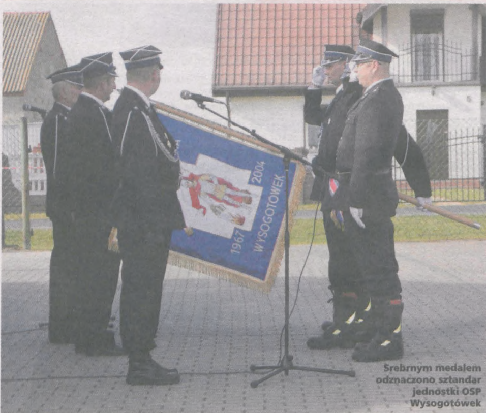
Srebrnym medalem odznaczono sztandar jednostki OSP Wysogotówek