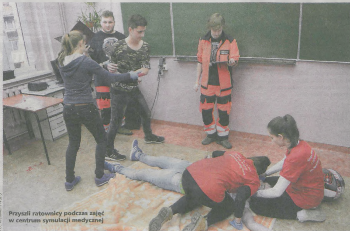
Przyszli ratownicy podczas zajęć w centrum symulacji medycznej

Uczelnia wykształciła najwięcej pielęgniarek i położnych spośród wszystkich niepublicznych placówek w kraju, a jej oferta edukacyjna sprawia, że absolwenci nie mają problemu ze znalezieniem pracy po zakończeniu kształcenia. - Jako jedyna placówka niepubliczna w kraju posiadamy wysoko wyspecjalizowane centrum symulacji medycznej, które znajduje się w Dąbrowie Górniczej, ale jest jak najbardziej dostępne dla naszych studentów w innych miej-