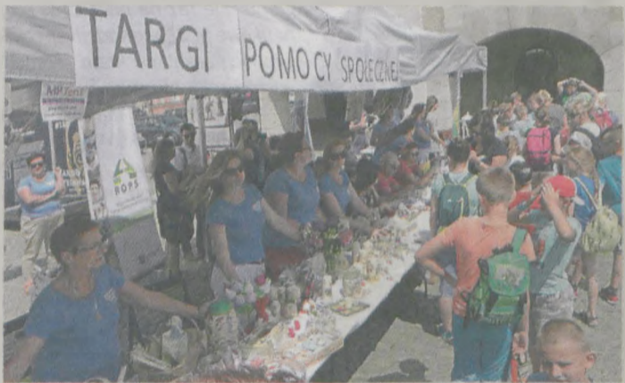
Na jarocińskim rynku zaprezentowały się między innymi Dom Pomocy Społecznej w Kotlinie, Środowiskowy Dom Samopomocy w Jarocinie, Warsztat Terapii Zajęciowej w Jarocinie, Kluby Samopomocy w Mieszkowie i Golinie, Centrum Integracji Społecznej w Jarocinie oraz Miejsko-Gminny Ośrodek Pomocy Społecznej w Jarocinie

Przedsięwzięcie współfinansowane było ze środków Wojewódzkiego Funduszu Ochrony Środowiska i Gospodarki Wodnej w Poznaniu. (ann)