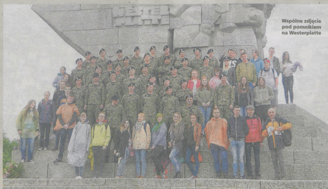
Wspólne zdjęcie pod pomnikiem na Westerplatte