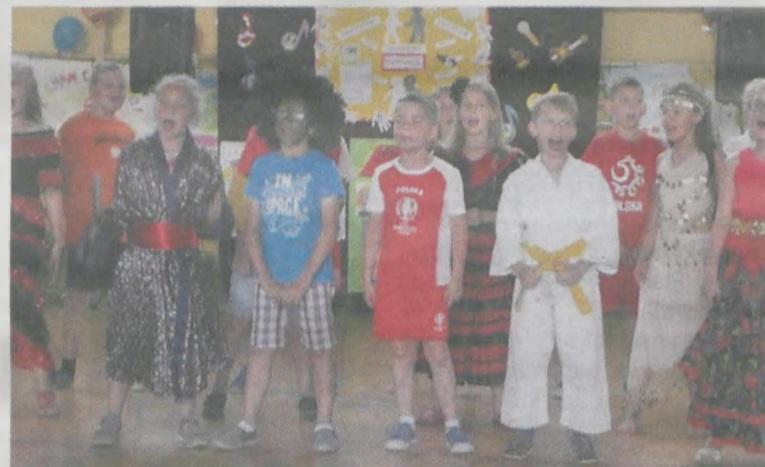
Niektóre zespoły postawiły na kolorowe stroje i specjalną charakterystykę