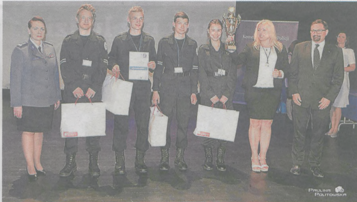
Uczniowie z pucharem za zajęcie trzeciego miejsca