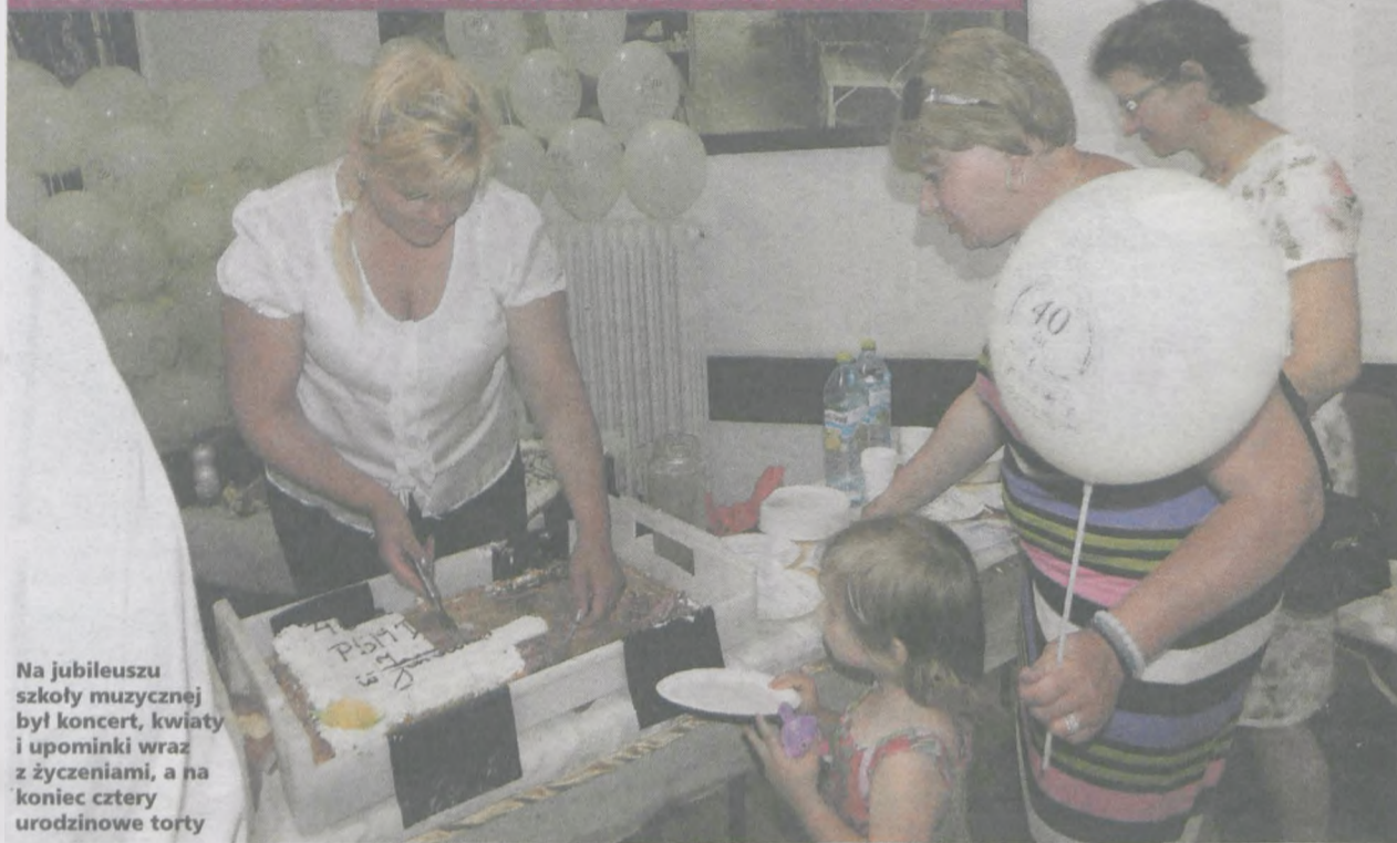
Na jubileuszu szkoły muzycznej był koncert, kwiaty i upominki wraz z życzeniami, a na koniec cztery urodzinowe torty