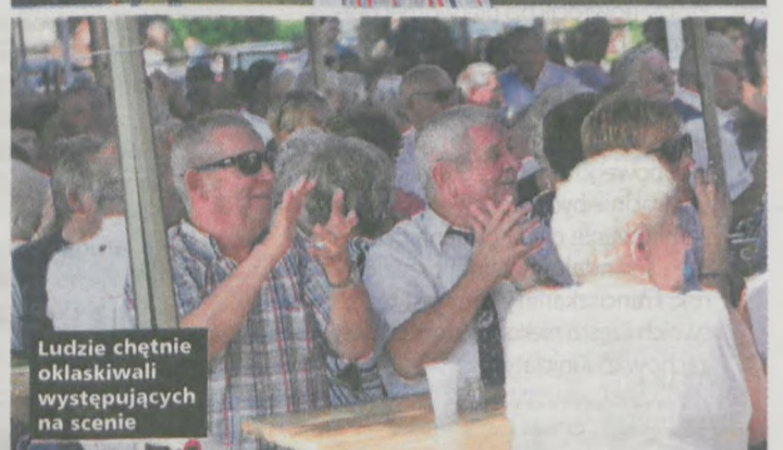
Ludzie chętnie oklaskiwali występujących na scenie