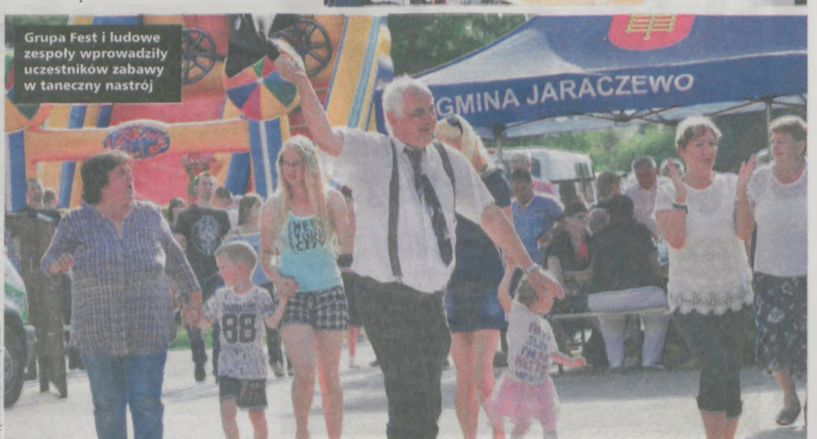
Grupa Fest i ludowe zespoły wprowadziły uczestników zabawy w taneczny nastrój