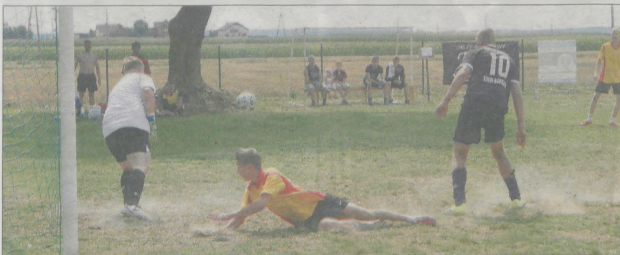
W ubiegłym roku odbył się tylko turniej. Teraz będzie również festyn