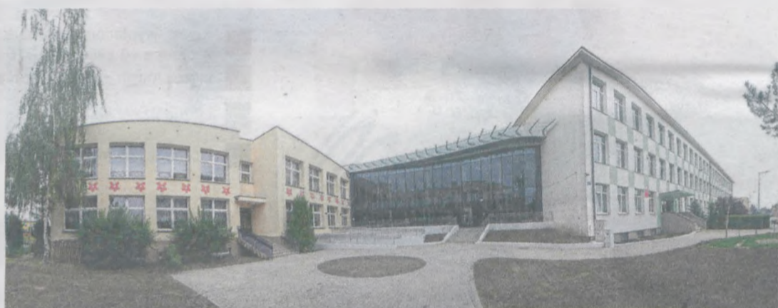
Dzięki rozbudowie szkoła nr 4 i przedszkole „Bajeczka” uzyskały zupełnie nowy wygląd, a dzieci znacznie lepsze warunki do nauki