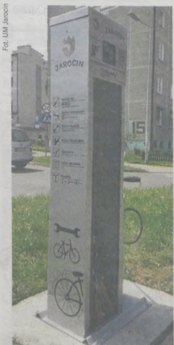
Jeśli pierwsze w Jarocinie samoobsługowe stacje naprawy rowerów zdadzą egzamin, planowane są następne

Dwie stacje samoobsługowej naprawy rowerów powstały w Jarocinie. Jedna znajduje się przy ul. Powstańców Wielkopolskich - przy świetlaku vis a vis marketu Intermarche, a druga zlokalizowana jest na os. Konstytucji 3 Maja - między blokiem Bema 37 a ul. Solidarności.