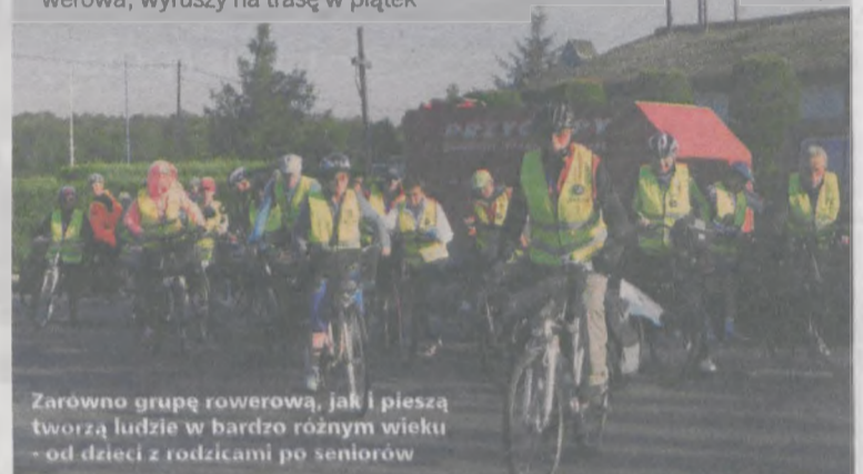
Zarówno grupę rowerową, jak i pieszka tworzą ludzie w bardzo różnym wieku - od dzieci z rodzicami po seniorów