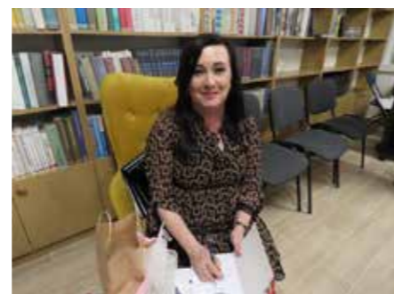
fol. Grodziska BP

Grodziska Biblioteka Publiczna w Grodzisku Wielkopolskim