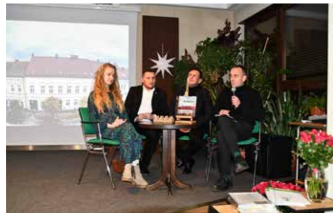
fol. MIPBP Nowy Tomyśl