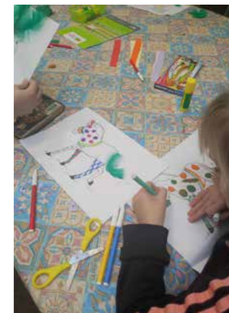
fol. BPM Gniezno