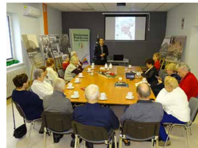
fol. BPG Grodziec