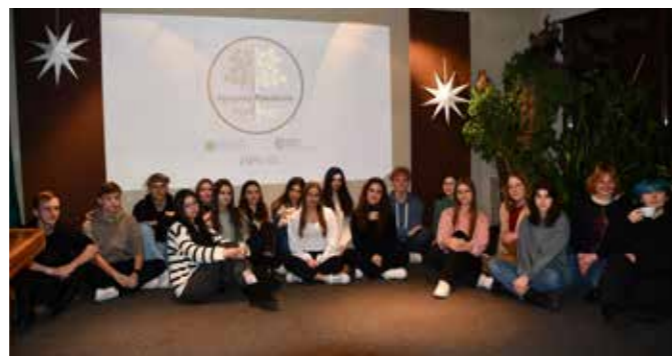
fol. MIPBP Nowy Tomyśl