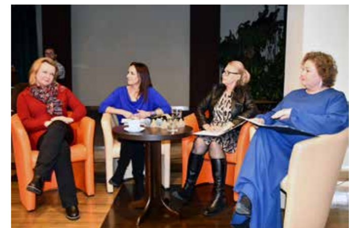
fol. MIPBP Nowy Tomysłu