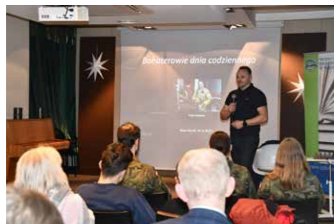
fol. MIPBP Nowy Tomysłu