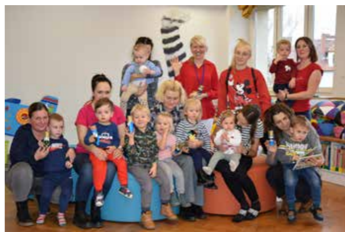
fol. Krotoszyńska BP