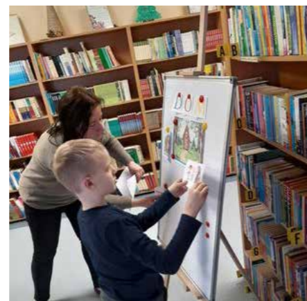
fort. GBP Zdziechów

Uczestniczyły także w przeróżnych zadaniach związanych z bohaterami bajek (np. dopasowywały postacie z bajek do tytułów),