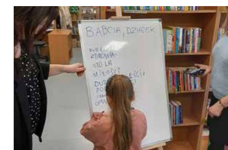
fort. GBP Zdziechów

Gminna Biblioteka Publiczna w Zdziechowie