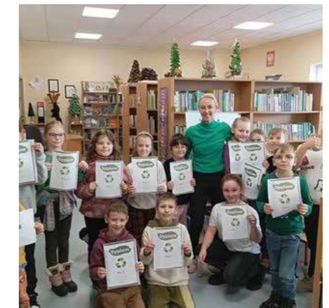
fol. GBP Zdziechów