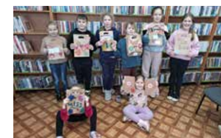
fort. MiBPB Nowy Tomysz

Miejska i Powiatowa Biblioteka Publiczna w Nowym Tomyszu