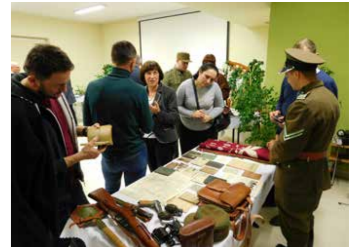
fol. GBP Trzcinić