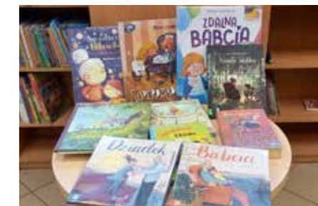
fort. MiBPB Nowy Tomysz

Miejska i Powiatowa Biblioteka Publiczna w Nowym Tomyszu