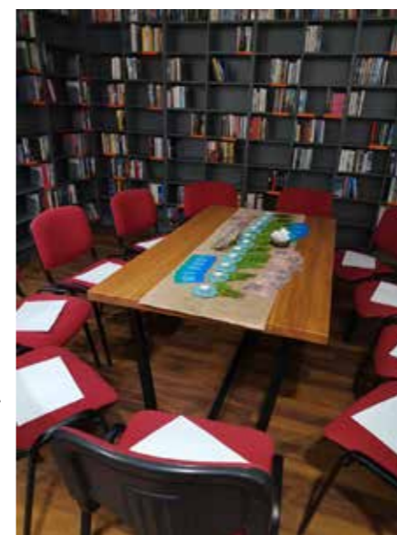
fol. BFMiG Wolsztyn