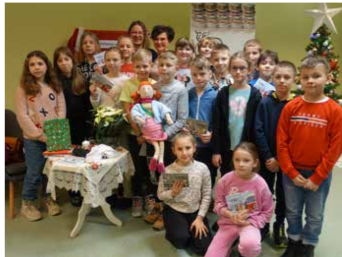
fol. MBP Wągrowiec