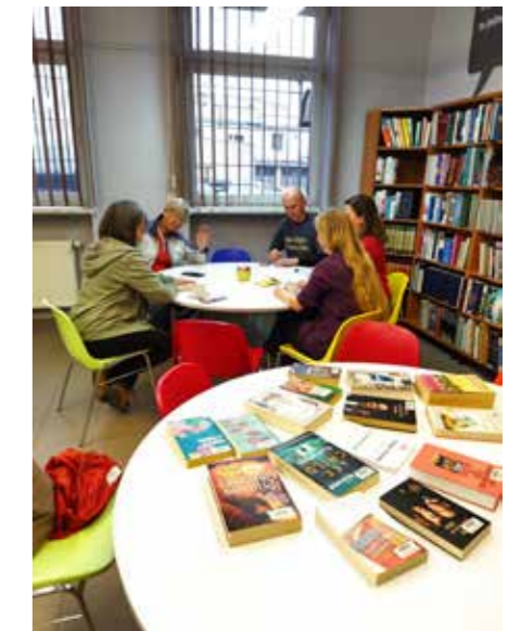
fol. BPM Gniezno