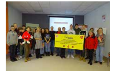
fol. BPG Grodziec