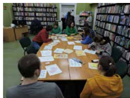
fol. PBP Wągrowiec