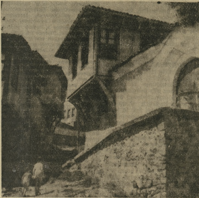
Płowdiw. Stary dom przy ul. Pylden 3.

Dojeżdżamy do Płowdiwu, drugiego co do wielkości miasta w Bułgarii. Z daleka już widać wysokie, nowoczesne budynki. Jest ich o wiele więcej niż kilka lat temu, gdy zwiedzałem to miasto. Ten rozmach budownictwa może wzbudzić zainteresowanie każdego, kto interesuje się nowoczesną architekturą. Ale na urok miasta składa się również dużo innych czynników. Jak wiele racji mają ci, którzy chcą poznać krajobraz, dzieje i dzień współczesnej Bułgarii nie tylko na podstawie wrażeń znanego Morza Czarnego. Plaże w Warnie, Drużbie czy Złotych Piaskach są piękne, ale źle postępują przybyłe czynniki z nich jedyny punkt obserwacyjny.