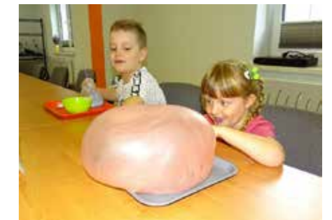
fol. BPG Grodziec

Magiczne chwile spędzone podczas letnich warsztatów w Grodzieckiej Bibliotece okazały się prawdziwym festiwalem kreatywności i wspólnych odkryć! Przy współpracy z firmą Brick4Kidz przekształciliśmy bibliotekę w królestwo klocków LEGO i robotyki. Mario i Luigi – nieustraszeni hydraulicy z charakterystycznymi czapkami i wąsami, przenieśli dzieci z gminy Grodziec w fascynujący świat kultury gry komputerowej. Wspólnie tworzyliśmy trójwymiarowe postaci, nadając im życie poprzez programowanie. To była niecodzienna okazja, by zdobyć umiejętności, rozwijać wyobraźnię