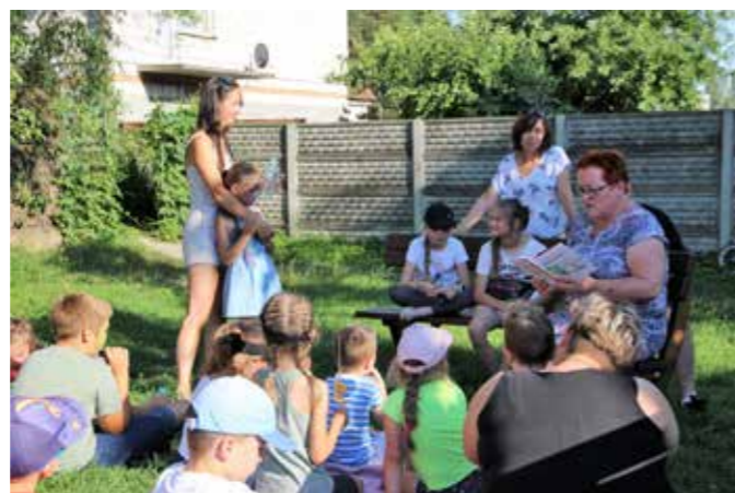
fol. MiBPB Nowy Tomysl

Już po raz trzeci filia Miejskiej i Powiatowej Biblioteki Publicznej w Nowym Tomyslu wraz z Soltysiem i Radą Solecką w Jastrzębsku Starym zaprosila rodziny na plenerowe zabawy z książką. Mieszkańcy Jastrzębska, jak i czytelnicy z okolic, mieli okazję zrelaksować się i poczuć ideę imprezy zawartą w haśle: „Wszyscy jesteśmy równi, a książka łączy każdego!” Wśród wielu atrakcji pikniku znalazły się: strefa „Zaczytana kawiarenka pod Wierzbą”