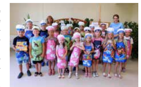
fol. GBP Trzciny