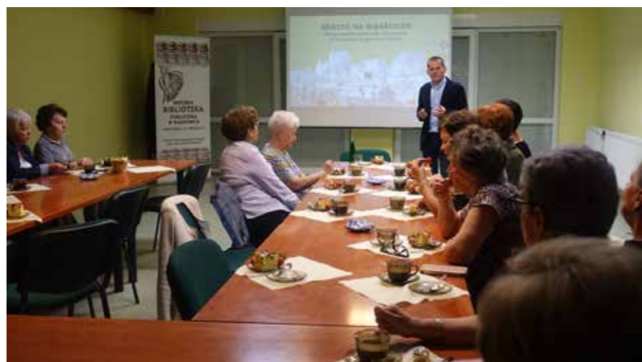
fol. MBP Wągrowiec

Elżbieta Chojnacka, Miejska Biblioteka Publiczna w Wągrowcu