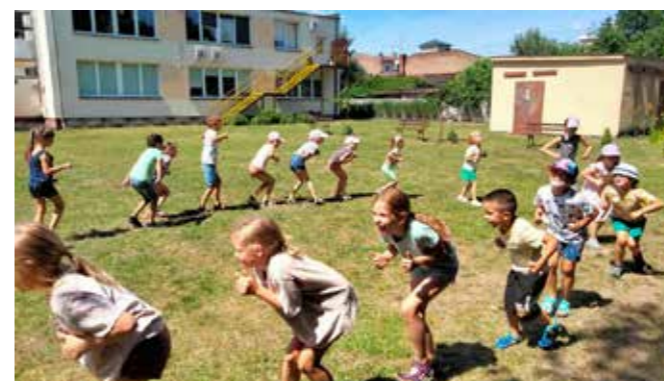
fol. GBP Rakoniewice

Gminna Biblioteka Publiczna w Rakoniewicach