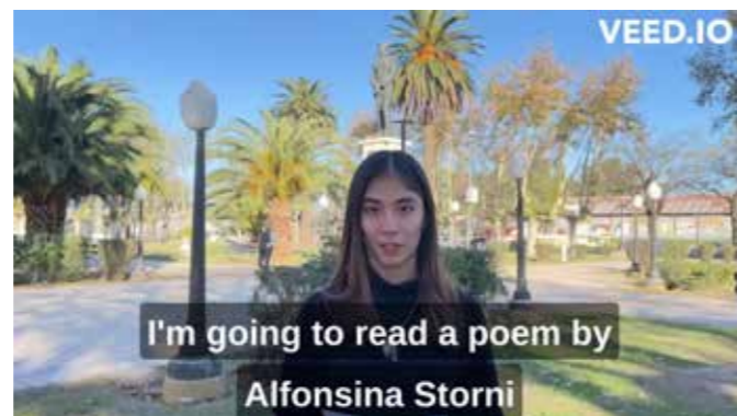
fol. MiPBP Nowy Tomyśl