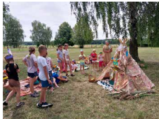
fol. BPMiG Wolsztyn