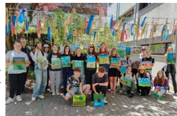
fol. MiBPB Nowy Tomysl

Miejska i Powiatowa Biblioteka Publiczna w Nowym Tomyslu