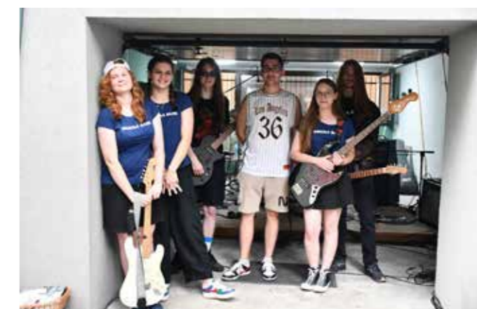
fol. MiPBP Nowy Tomyśl