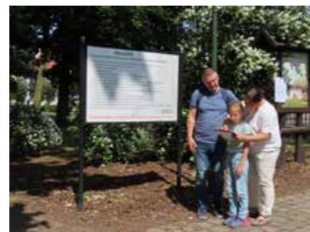
fol. Grodziska BP

tylko otrzymali ciekawą lekcję historii, poznali miasto i jego architekturę, ale mieli możliwość