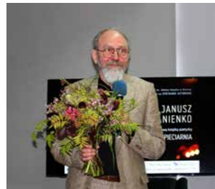
fol. MBP Kalisz

Miejska Biblioteka Publiczna im. A. Asnyka w Kaliszu