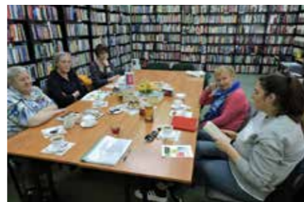
fol. BPP Wągrowiec

W czerwcowe popołudnie dyskutowaliśmy na temat powieści „Pod słońcem” Julii Fiedorczuk. Jest to opowieść o życiu codziennym zwyczajnych ludzi, trudnych czasach wojny, ale też o szczęściu, jakie daje otaczający nas świat. To saga o ludziach, którym przyszło żyć w trudnych czasach. Lektura pobudza do refleksji nad ludzkim losem, przemianami i tym, co po nas zostaje. Wciągająca i wyjątkowa książka, którą warto przeczytać.