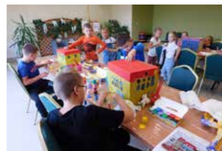
fol. GBP Trzcinica