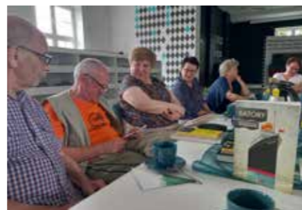
fol. BPMIG Wolsztyn

Z okazji jubileuszu klubowicze otrzymali na pamiątkę drobny upominek i książkę oraz życzenia zdrowia i jeszcze wielu dobrych lektur.