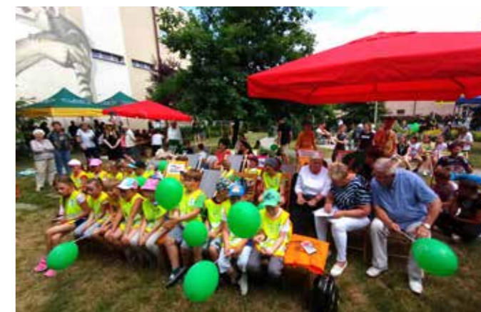
fol. Krotoszyńska BP

wskazówek prowadzącej. Dzieci przystąpiły do pracy z zapalem, dzięki czemu już po chwili ogród zyskał barwny, kwiecisty akcent.