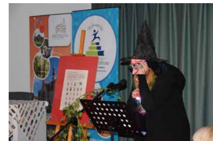
fol. Krotoszyńska BP