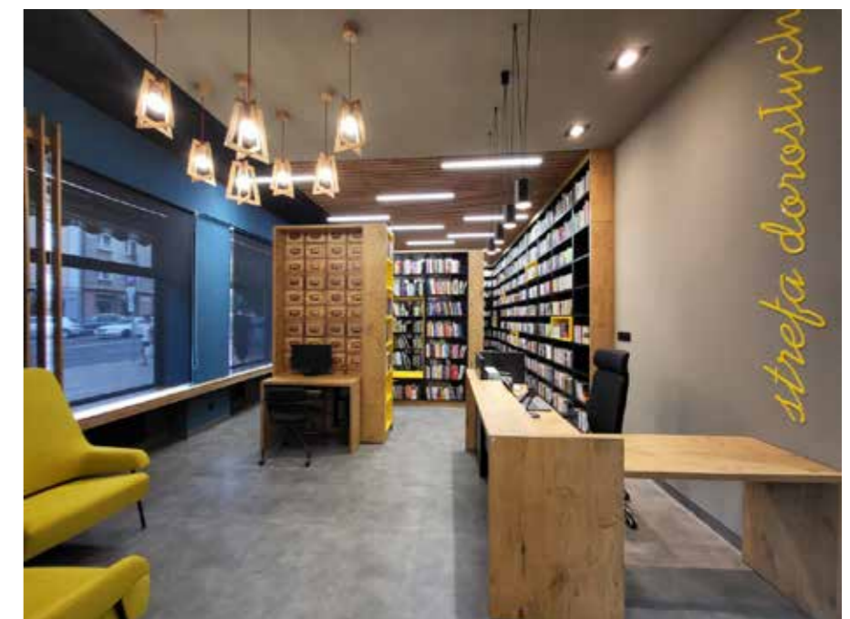
fol. MBP Kalisz