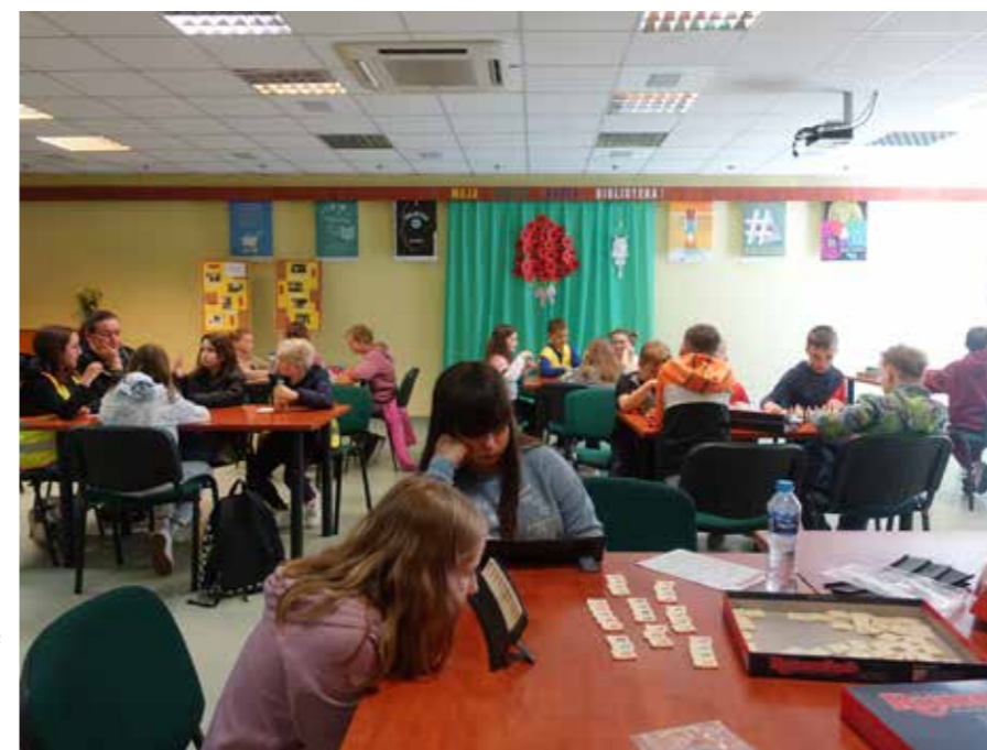
fol. MBP Wągrowiec