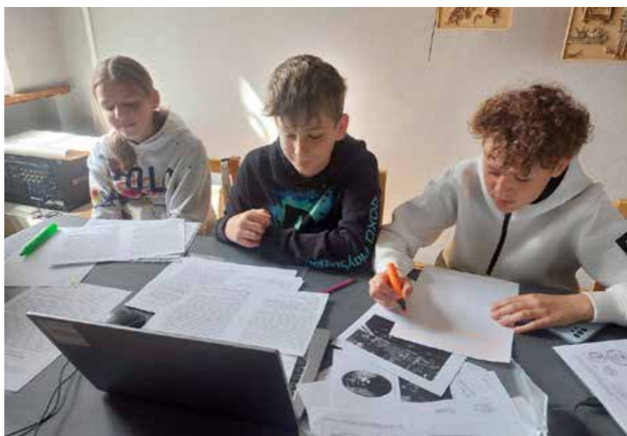
fol. MBP Kalisz