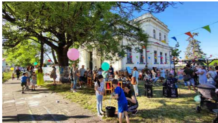
fol. MBP Kalisz

Dalsza część bibliotecznej imprezy przeniosła się w plener, gdzie na gości czekała moc atrakcji, z których wszystkie cieszyły się szalonym powodzeniem. Do malowania twarzy przez animatorki z kaliskiego Studium Animatorów Kultury ustawiły się kolejki, podobnie jak do fotościanki z Szalonym Kapelusznikiem i stoiska z planszówkami, na które zapraszał klub CUBUS z Filii nr 2. Metry przezroczyściej folii rozwiniętej pomiędzy drzewami szybko pokryły się pięknymi malunkami, chodnik przed biblioteką – kredowymi rysunkami, a balony skrócone w najróżniejsze kształty fruwały w powietrzu na przemian z mydlanymi bańkami. Upust energii można było dać podczas zabaw ruchowych i zespołowych z płachtą