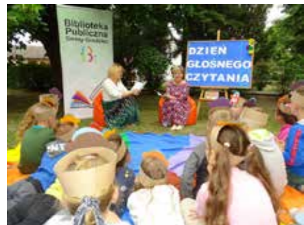
fol. BP Gminy Grodziec

„Książka jest jak ogród” to hasło XXII Ogólnopolskiego Tygodnia Czytania Dzieciom, do którego co roku dołącza grodziecka biblioteka. OTCD jest częścią kampanii społecznej „Cała Polska czyta dzieciom”, mającej na celu promowanie codziennego czytania w domach oraz placówkach kulturalnych.