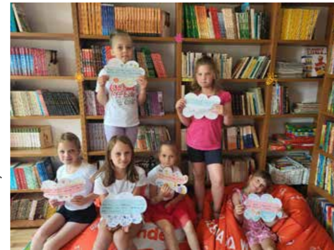
fol. BPMiG Wolsztyn

Biblioteka Publiczna Miasta i Gminy Wolsztyn im. St. Platery