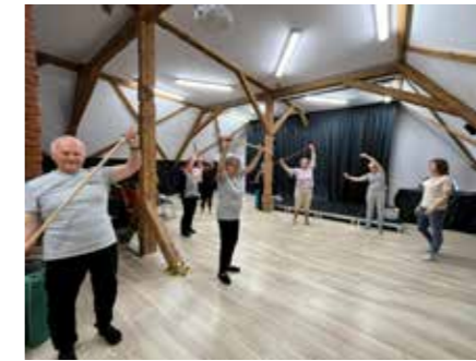
fol. BPGiM Zduny

sami seniorzy mówią „spotkania w bibliotece to najlepsza forma psychoterapii”. Cieszymy się, że Biblioteka Publiczna w Zdunach pełni ważną rolę w społeczności zdunowskiej, a mieszkańcy coraz chętniej biorą udział w proponowanych wydarzeniach.