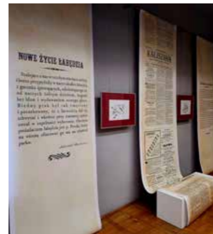
fol. MBP Kalisz