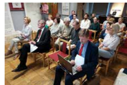
fol. MBP Kalisz