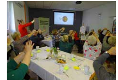
fol. BPG Grodziec