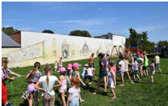
fol. Krotoszyńska BP