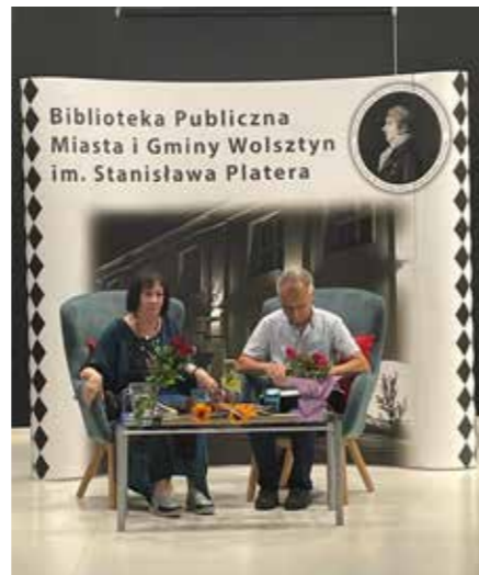
fol. BPMiG Wolsztyn

Biblioteka Publiczna Miasta i Gminy Wolsztyn im. St. Platery