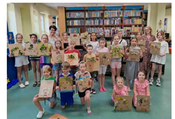
fol. Filia nr 7 Ostrow Wilkp.