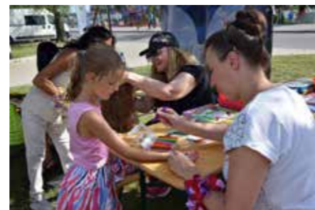
fol. Krotoszyńska BP

Krotoszyńska Biblioteka im. Arkadego Fiedlera