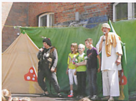
Dzień Kultury - spektakl dla dzieci

To tytuł spotkania z aktorką Zofią Kucówną, które odbyło się 17 czerwca w Galerii na Regale Biblioteki Miejskiej w Luboniu. Podczas blisko dwugodzinnego spotkania Pani Zofia w ciepły i bardzo ciekawy sposób przybliżyła licznie zebranym gościom swoją sylwetkę. Opowiadała o Skolimowie, o swoim aktorstwie, o marzeniach i o książkach, które pisze. Chętnie odpowiadała na zadawane pytania. Jest bardzo życzliwą i otwartą osobą, która potrafi w oka mgnienia stworzyć wrażenie bliskości, kogoś „z sąsiedztwa”. Na zakończenie spotkania każdy mógł zakupić książkę oraz otrzymać pamiątkowy autograf.