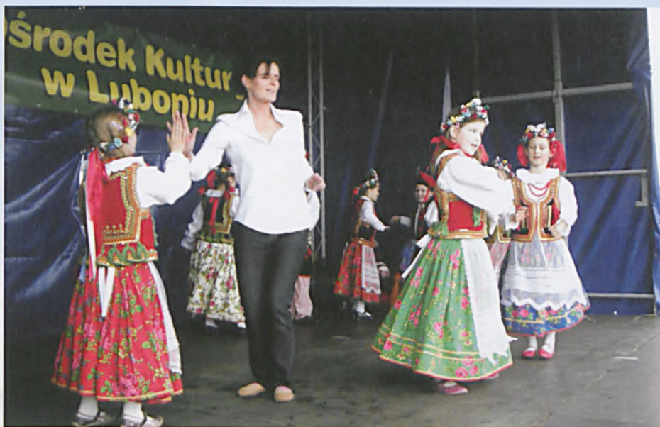
Występ Lubońskiego Zespołu Tańca Ludowego z OK