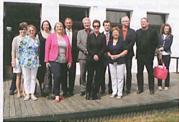
Koordynatorzy projektu w Ośrodku Kultury w Luboniu

Wizyta Studyjna, która odbyła się 22.05.2013 miała na celu prezentację dotychczasowej pracy, różnorodnych form promocji projektu oraz bezpośredni kontakt z doradcami 55+. Organizatorami spotkania (Urząd Marszałkowski), koordynatorów projektu, lubońskich doradców 55+, gościliśmy w Ośrodku Kultury. Po dyskusji na te-