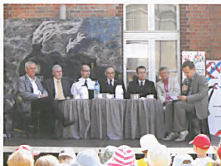
Dzień Kultury - czytanie