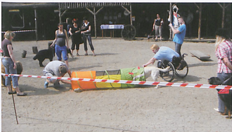
Celem imprezy była zbiórka psiej karmy i artykułów zoologicznych potrzebnych w schronisku

16 czerwca 2013 roku odbyła się charytatywna wystawa psów „Nasz Wierny Przyjaciel”, zorganizowana w kowbojskim miasteczku w Luboniu na rzecz schroniska w Przyborówku. Impreza wolontarystyczna odbyła się dzięki członkom i sympatykom Western City Luboń. Celem była zbiórka psiej karmy i artykułów zoologicznych potrzebnych czworonogom w schronisku. Zachęcaliśmy właścicieli do przekazywania niepotrzebnych rzeczy na schronisko, które w okresie zimowym mogą być bardzo potrzebne psiom w przytulisku.