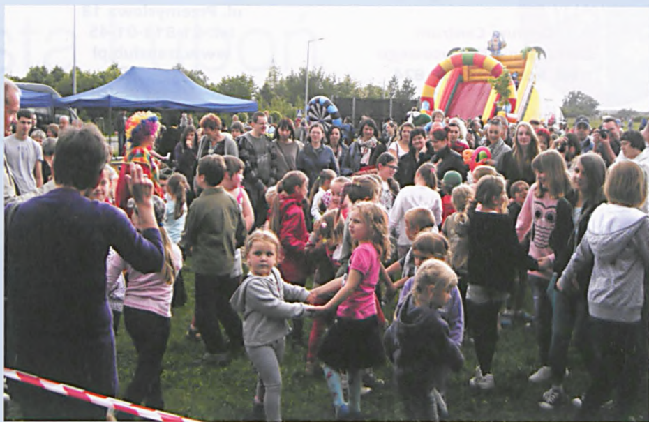
Wspólna zabawa pod sceną