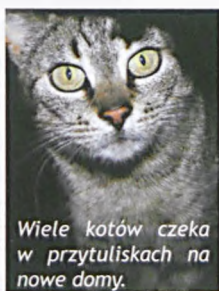
Wiele kotów czeka w przytuliskach na nowe domy.