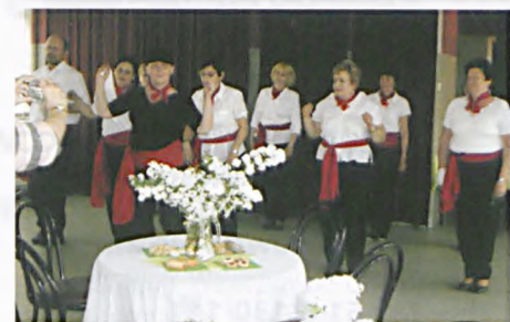
Majówka słuchaczy LUTW w Ośrodku Kultury

skiego Uniwersytetu Trzeciego Wieku w ramach zajęć Sekcji Turystyki Pieszej odwiedzili Park Sołacki w Poznaniu. Spotkaliśmy się przy zabytkowej, drewnianej poczekalni tramwajowej tzw. Zielonej budce, ustawionej w 1913 roku na północnym skraju Parku Sołackiego. Jest on jednym z parków publicznych w Poznaniu, położony w willowej dzielnicy Sołacz. Park został wybudowany na terenie podmokłej doliny Bogdanki w krajobrazowym stylu angielskim. Teren osuszono, utworzono sztuczne zbiorniki wodne, wytyczono aleje i posadzono około 3 tysiące drzew i 12 tys. krzewów różnych gatunków. Uczestnicy spaceru zapoznali się z historią powstania parku i jego dziejami w okresie ponad stu lat istnienia. Dowiedzieli się o roślinach i zwierzętach występujących na terenie parku. Przeszli po alejach i mostkach, podziwiając stare drzewa i sztuczne stawy z pływającymi na nich ptakami wodnymi. Z parku zaszliśmy aż na stadion Olimpii, gdzie odbywały się zawody lekkoatletyczne, by dotrzeć do jeziora Rusalka. Pogoda i humory dopisały, a wizyta w pobliskiej kawiarni Francuski Łącznik zakończyła sobotni spacer. Do zobaczenia na kolejnych zajęciach po wakacjach.