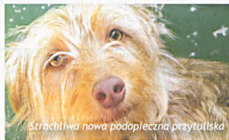
Strachliwa nowa podopieczna przytuliska