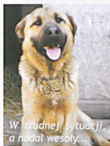
W trudnej sytuacji, a nadal wesoty...

Zachęcamy do dalszego wspierania finansowego, rzeczowego, wolontariatu, ODPOWIEDZIALNEJ ADOPCJI (w tym adopcji wirtualnej). Szczegółowe informacje o zwierzętach do adopcji uzyskują