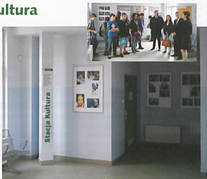
D. Glowacki x2

Zapraszamy do zwiedzania naszej małej galerii jaką jest poczekalnia dworca PKP w Luboniu. Została ona wykorzystana na przestrzeń artystyczną (wystawienniczą) służącą promocji naszego miasta i twórczości jego mieszkańców. Mamy nadzieję, że będzie to również ciekawa forma spędzenia czasu w oczekiwaniu na pociąg. Dla artystów i autorów prac jest to pewna możliwość dotarcia do szerszej rzeszy odbiorców. Nasza galeria pełni również rolę informacyjną. Jest miejscem dystrybucji Informatora Miasta Luboń, do lektury którego zachęcamy. W gablocie obok znajdują się również istotne informacje dotyczące miasta Luboń. Opiekę nad galerią sprawuje Ośrodek Kultury w Luboniu. Galeria powstała dzięki uprzejmości Zarządu Polskich Kolei Państwowych. Galeria rozpoczęła swoją życie 4 czerwca 2013 od prezentacji fotografii uczniów z Gimnazjum nr1. Wystawa jest efektem współpracy uczniów Gimnazjum nr 1 w Luboniu z Ośrodkiem Kultury w Luboniu. M.B.