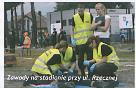
Zawody na stadionie przy ul. Rzecznej

wzięło udział 15 drużyn reprezentujących Gminy Powiatu Poznańskiego. Jak do tej pory były to najliczniej obsadzone zawody w historii. Nasza drużyna udowodniła, że umie walczyć, zadania wykonała z wielkim zaangażowaniem i ambicją. Poziom przygotowania drużyn był bardzo zbliżony. Niestety obiektywne trudności, przyczyniły się do przekroczenia limitu czasowego. W konsekwencji zostaliśmy ukarani utratą 100 punktów i ostatecznie zajęliśmy 15 lokatę. Zawodnicy zadeklarowali, że wynik zmotywuje ich do jeszcze bardziej wyężo-