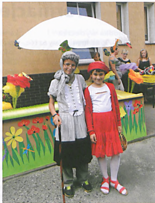
Bajkowy świat na festynie w SP

Drugiego dnia przyjechali do nas prawdziwi Zbójcy! Dzięki nim poznaliśmy historię Polski. Uczyliśmy się także sztuki wytwarzania sieci i łowienia ryb. Tak jak nasi przodkowie lepiliśmy naczynia z gliny. Mogliśmy spróbować swoich sił w strzelaniu z łuku i rzucie oszczepem. Strasznie fajne było pentanie jeńców wojennych i przeciąganie liny, kiedy to