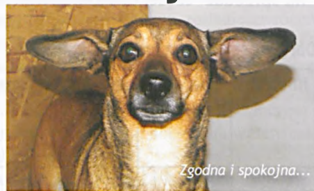
Zgodna i spokojna...