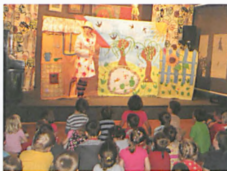
Spektakl dla dzieci

27 maja odbyło się kolejne spotkanie sek-