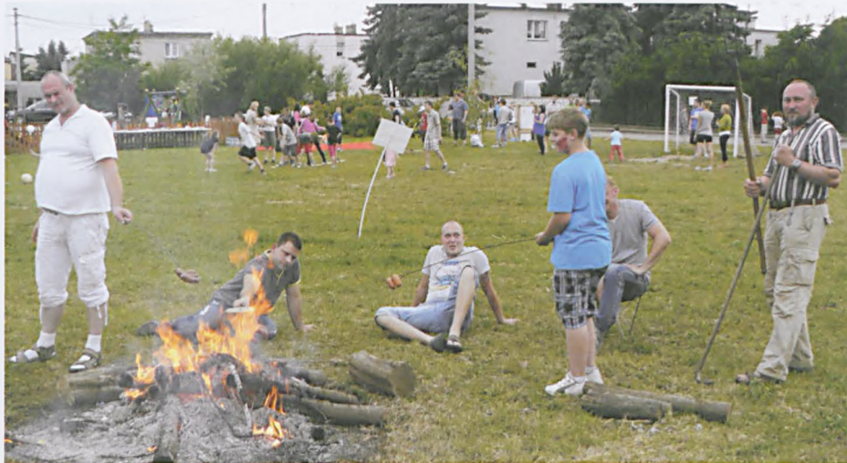
Jubileuszowy piknik „Autostradowej Dolinki”

W sobotę, 15 czerwca świętowaliśmy pierwszą rocznicę powstałego z inicjatywy społecznej, przy ul. Chopina placu zabaw „Autostradowa Dolinka”. Z tej właśnie okazji wspólnymi, sąsiedzkimi siłami zorganizowaliśmy jubileuszowy piknik. Atrakcji było co nie miara. Raczylimy się „staropolskim żurem”, domowymi wypiekami oraz kiełbaskami przy ognisku. Rodziny nie tylko z naszego osiedla (ulice Chopina, Dożynkowa i północny odcinek Armii Poznań) brały udział w licznych konkursach i grach plenerowych. Lokalna społeczność kolejny już raz zdała egzamin celująco. Udana impreza przy dobrej muzyce, wypuszczanych do nieba lampionach i żarze dogasającego ogniska trwała do późnej nocy.