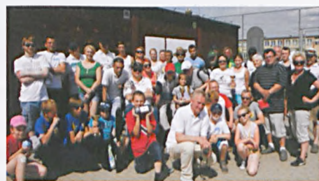
Uczestnicy III turnieju NYSLC w boules

poczęstunek. Dużym powodzeniem cieszył się domowy placek z rabarbarem. W porze obiadowej zaserwowano kiełbaski z grilla.