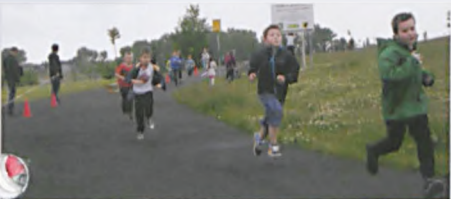
Najmłodszy uczestnicy VIII Biegu Lubońskiego