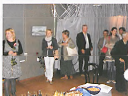
Podróże male i duże