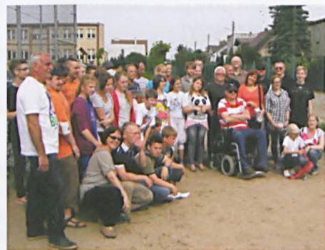
Uczestnicy czerwcowego turnieju w boules