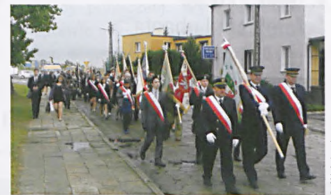
Przemarsz ulicami miasta.