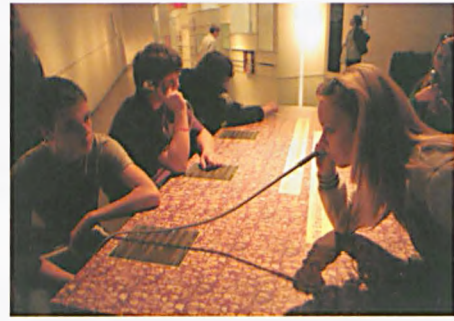
wyjazd do Berlina uczniów biorących udział w projekcie „To co ludzie ludziom stworzyli - przeszłość jest nauką na przyszłość”

Uczestnicy projektu „To co ludzie ludziom stworzyli – przeszłość jest nauką na przyszłość” brali udział w pobycie studyjnym w Chełmnie nad Nerem – pierwszej fabryce śmierci z okresu II Wojny Światowej. Podczas tej wyprawy nasi uczniowie gromadzili materiały do dalszej pracy. Projekt jest realizowany we współpracy z Muzeum Martyrologicznym w Żabikowie. Badawcze pasje naszych uczniów zaprowadziły uczestników projektu do źródeł zjawiska holokaustu. Udali się oni do Berlina, gdzie w Domu Konferencyjnym w Wanssee poszukiwali odpowiedzi na pytanie co skłoniło Niemców do poparcia poglądów Fuhrera. W Centrum Informacji Pomnika Pomordowanych