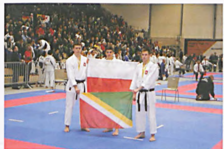
Na Mistrzostwach Europy w karate

Wszyscy uczestnicy zawodów z 26 państw prezentowali bardzo wysoki poziom sportowych umiejętności. Niestety, pomimo wszelkich starań i ogromnego wysiłku włożonego w program przygotowań, naszym zawodnikom nie udało