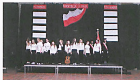
Uczniowie występujący w przedstawieniu z okazji Święta 3 Maja