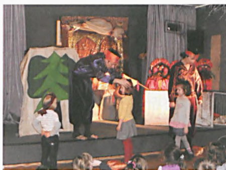
Goście ze stolicy