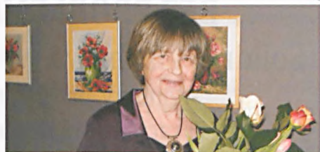
Wiosna kwieciami malowana