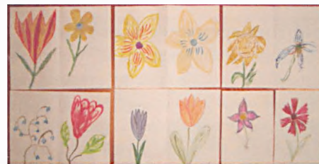
Próby zastosowania wiedzy teoretycznej o symbolice koloru w praktyce

21 maja odbyły się ostatnie teoretyczne zajęcia dla słuchaczy Lubońskiego Uniwersytetu III Wieku, które dotyczyły zja-