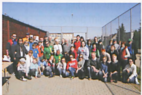
Uczestnicy kwietniowego turnieju w boules

Następne turnieje z cyklu „NYSLC” odbędą się 16 i 30 czerwca 2013 r..