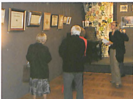
„Inny, ten sam świat”