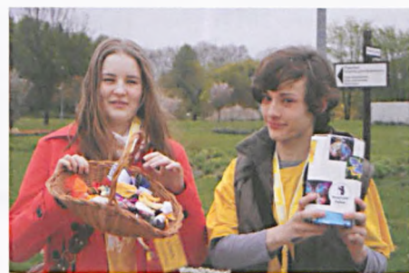
Szkolni wolontariusze w Ogrodzie Botanicznym