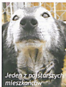
Jeden z najstarszych mieszkańców

Zachęcamy do dalszego wspierania finansowego, rzeczowego, wolontariatu, ODPOWIEDZIALNEJ ADOPCJI (w tym adopcji wirtualnej). Szczegółowe informacje o zwierzętach do adopcji uży-