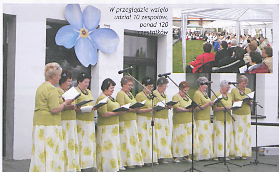
W przeglądzie wzięło udział 10 zespołów, ponad 120 uczestników