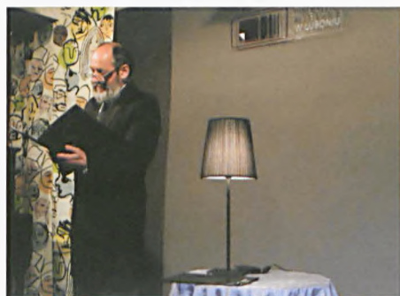
Spotkanie ze Zbigniewem Walerysiem