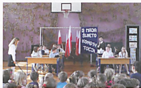
Święto Konstytucji 3 Maja