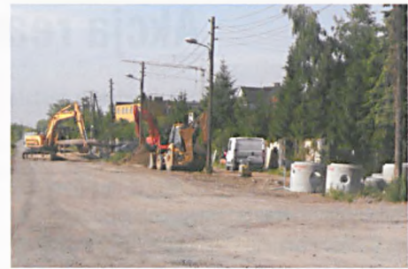
Prace na ulicy Dworcowej