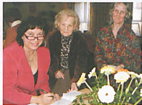
Opowieść o żołnierzu