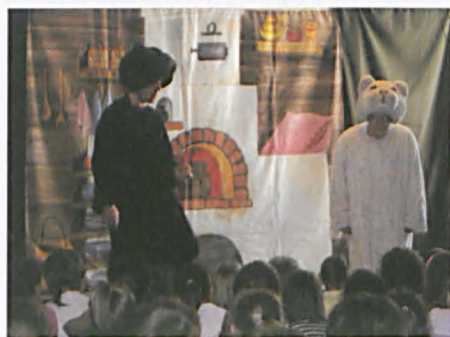
„Przygody kota Filona”