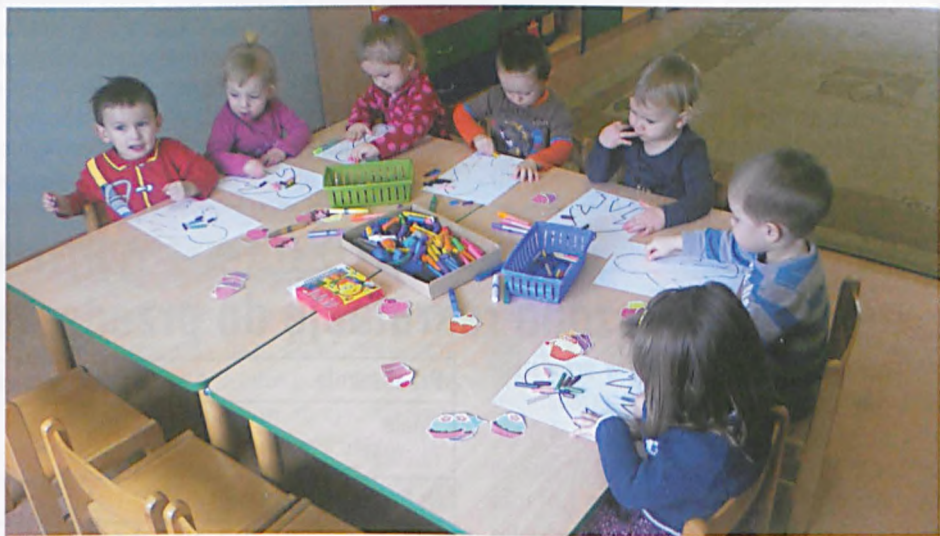
Najmłodsze dzieci podczas zajęć plastycznych

Kolejną kwietniową atrakcją był „Rozśpiewany kwartecik”. Aktorzy z Klubu Małego Muzyka zaprezentowali nam swoje wokalne umiejętności. Uczestniczyliśmy w mini koncercie, wspólnie tańcząc i śpiewając. Podrygując przy muzyce, słuchaliśmy znanych piosenek w aranżacji gospel. Nawet nie zauważyliśmy upływu