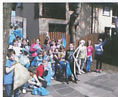
Dzień Ziemi w klasie 3d