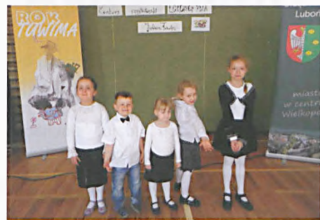
Laureaci konkursu recytatorskiego wierszy Juliana Tuwima