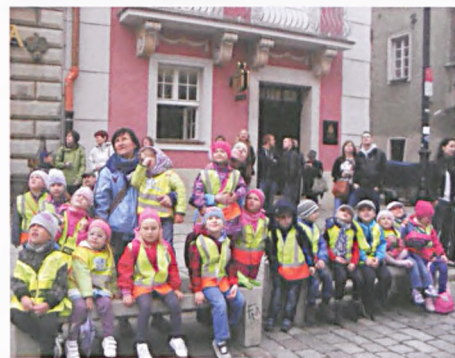
Na Starym Rynku

22 kwietnia obchodziliśmy Dzień Ziemi. Starszacy – Motyle i Biedronki sprzątały tereny przylegające do przedszkola. Na końcu wszyscy wykonali grupowe prace plastyczne, które przedstawiały schemat segregacji odpadów. Dzieci poznały metody redukcji ilości odpadów, działała na rzecz ekologii i podały wiele własnych pomysłów dotyczących tej słusznej sprawy.