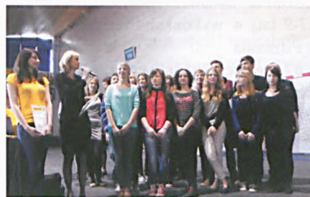
Odebranie nagrody za zwycięstwo w konkursie edukacyjnym