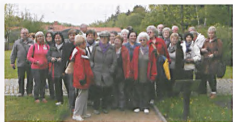
Wiosna w Ogrodzie Botanicznym - uczestnicy

i przyrodniczych. Oglądaliśmy rośliny rosnące w naturalnych i sztucznych zbiornikach wodnych, występujące na wydmach, w lasach liściastych, rośliny łąkowe i szuwarowe oraz pochodzące z Karpat i gór Azji. Podziwialiśmy kwitnące piwonie, irysy, kosańce, kolekcje lilaków i różaneczników, paprotniki, tulipany i zawilce oraz wiele innych. Wokoło było czuć zapach wiosny. Przyroda zachwycała soczystą zielenią, gamą barw i zapachów rozwijających się roślin. Spacer na świeżym powietrzu pozwolił nam odpocząć i zrelaksować się. Na zakończenie, chętni mogli odwiedzić Pawilon Ekspozycyjno-Dydaktyczny z wystawą fotografii przyrodniczej oraz mieszczącą się w nim przytulną kawiarenkę. Kolejne spotkanie Sekcji Turystyki Pieszej LUTW odbędzie się 15 czerwca o godz. 10:00 w Parku Sołackim w Poznaniu. Zbiórka przy drewnianej poczekalni tramwajowej tzw. Zielonej budce przy ul. Malopolskiej. Serdecznie zapraszamy.