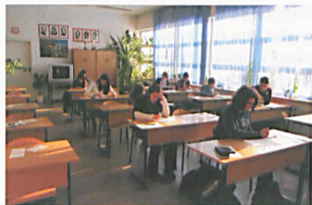
Uczniowie zmagają się z zadaniami językowymi