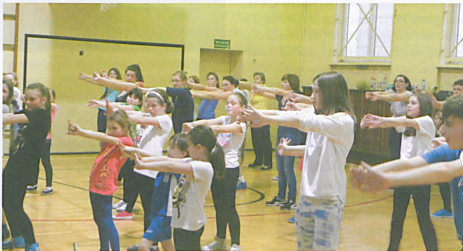
Zajęcia ZUMBY dla dzieci, rodziców, nauczycieli i pracowników szkoły