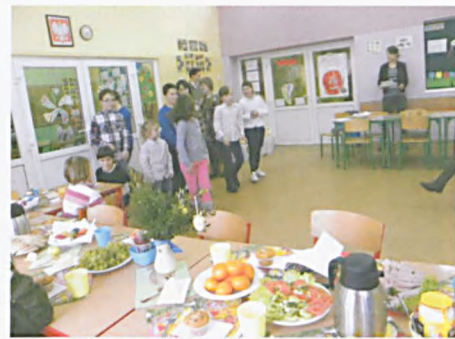
Wielkanoc w świetlicy opiekuńczo - wychowawczej