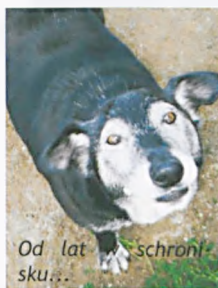
Od lat w schronisku...

Zachęcamy do dalszego wspierania finansowego, rzeczowego, wolontariatu, ODPOWIEDZIALNEJ ADOPCJI (w tym adopcji wirtualnej). Szczegółowe informacje o zwierzętach do adopcji uży-