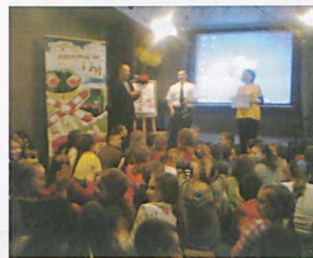
Uczniowie na prelekcji w ramach społecznej kampanii pod nazwą: Bezpieczny przejazd – „Zatrzymaj się i żyj”

Z naszej szkoły uczniowie klas 2a, 3a i 3b czynnie brali udział w spotkaniu z przedstawicielami kolei. Nauka przez zabawę okazała się najlepszym sposobem kształtowania prawidłowych zachowań