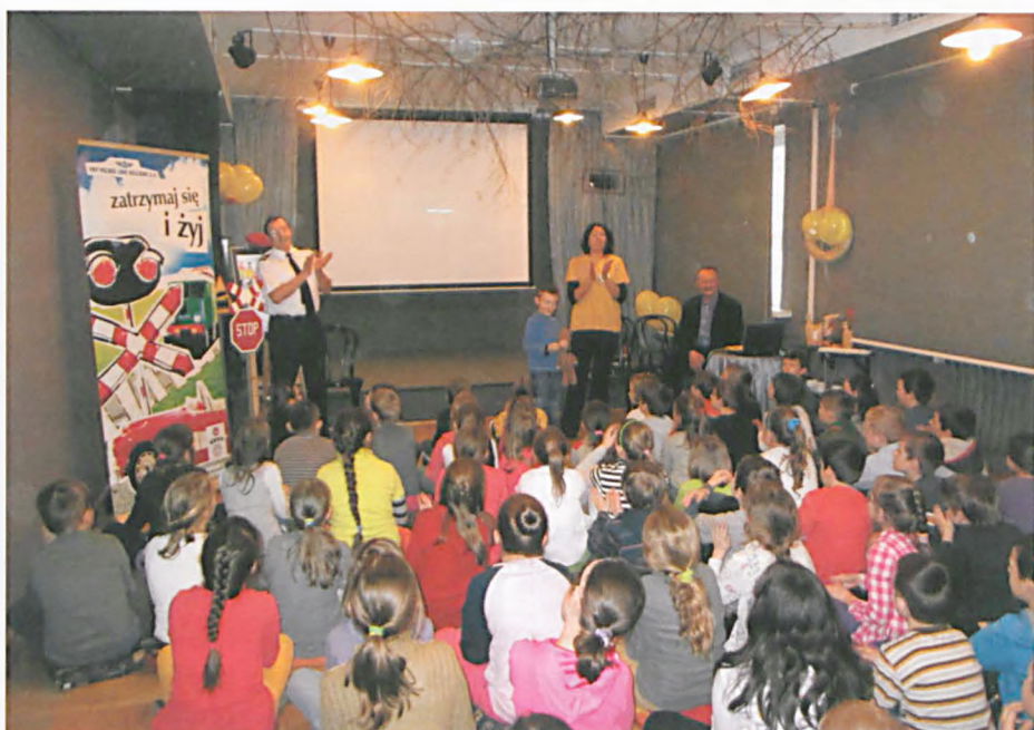
Spotkanie dla dzieci pt. „Zatrzymaj się i żyj. Bezpieczny przejazd”