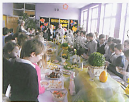
Przy wspólnym wielkanocnym stole w SP3

21 marca 2013 roku po raz kolejny w naszej szkole odbył się Międzynarodowy Konkurs „Kangur matematyczny”. Udział w konkursie miał charakter