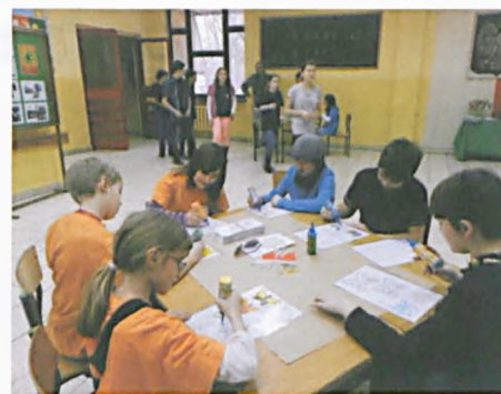
Dzień wrażliwości w Cieszkowiance

kl. 5 – 6 z Cieszkowianki po raz czwarty już przystąpili do Konkursu Ojczyzny Polszczyzny.