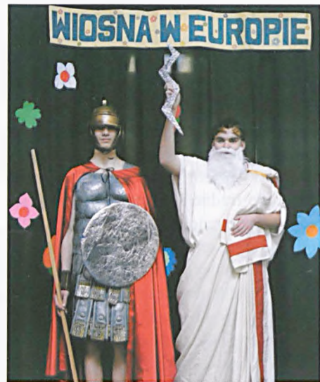
Dzień Wiosny po europejsku