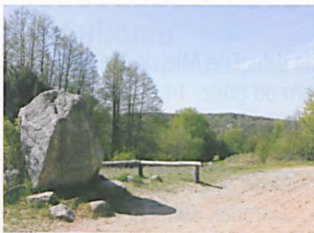
Wielkopolski Park Narodowy - punkt widokowy „Głaz Wł. Zamoyskiego”

Mosinie-Pożegowie. Pośród wyszczególnionych w operacie pozostałych 14 punktów widokowych najchętniej odwiedzanymi są: punkt widokowy przy głazie Zamoyskiego, z którego rozciąga się widok na oz za jeziorem Budzyńskim oraz punkt widokowy nad jeziorem Góreckim. Do najciekawszych spośród kilkunastu wyszczególnionych ciągów widokowych należą m.in.: ciąg wzdłuż wschodniego brzegu jeziora Góreckiego czy ciąg bie-