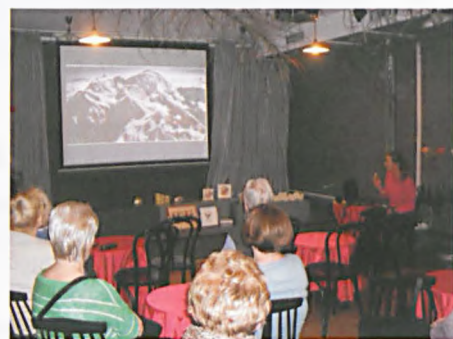
Świat na wyciągnięcie ręki