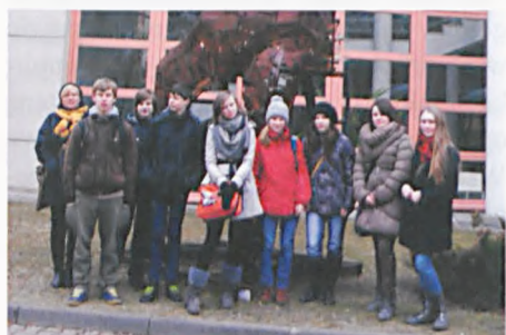
Na konferencji „Filozofia zmienia świat!”