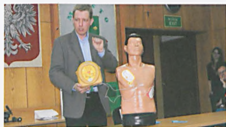
Pokaz działania defibrylatora

AED, czyli Automatyczne Elektryczne Defibrylatory są skuteczne, proste w obsłudze i mogą uratować życie w momencie zatrzymania akcji serca, kiedy to szanse na udzielenie skutecznej pomocy maleją z każdą minutą o 7 - 10 %, a karetka pojawi się za mniej więcej 8 minut. Stan nagłego zatrzymania krążenia jest odwracalny jeżeli w ciągu kilku minut od wystąpienia zapaści naczyń zostanie przeprowadzona defibrylacja. „Cieszę się, że mogę uczestniczyć w działaniach firmy wspierających społeczności lokalne” – mówi Tomasz Sikora, biathlonista i olimpijczyk, ambasador Natural Pharmaceuticals, który w ramach projektu uczestniczył w szkoleniu przeznaczonym dla pracowników urzędu. „Mam jednak