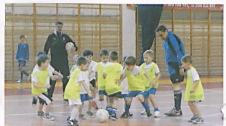
Domisie i Małe Talenty

Podczas oficjalnego zakończenia turnieju