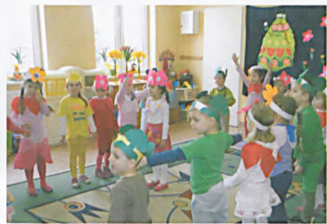
Powitanie wiosny przygotowane przez grupę „Śnieżynki”

Edukacja przyrodnicza dotyczy poznawania zwierząt i roślin także w ich naturalnym środowisku (hasło: Lepiej dotknąć i zobaczyć niż wierzyć na słowo). Dzieci w Pogodnym Przedszkolu hodują patyczaki, ryby, wiosną często obserwują kijanki. W sali Kropelki wisi kodeks Prawdziwego Przyjaciela Przyrody, którego niektóre hasła dzieci wymyślały