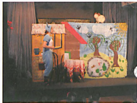
„Jak Ania złośnica została zajączkiem wielkocnym”