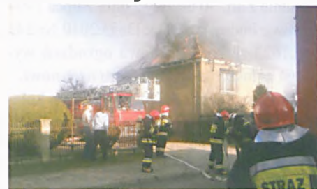
16. 04 Pożar domu przy ulicy Rivoliego w Luboniu

żar samochodu osobowego, 07.03 – Poznań, ul. Opolska – pożar baru mieszkalnego, 16.03 – Luboń, ul. Sikorskiego – pożar krzesel i elewacji na balkonie, 17.03 – Poznań, ul. Samotna – pożar altany na ogródkach działkowych, 18.03 – Poznań, ul. Kowalewicka – wypadek trzech samochodów osobowych, w którym ranne zostały trzy osoby, 23.03 – Usuwanie sopli z dachu Szkoły Podstawowej nr 2 w Luboniu, 23.03 – Luboń, ul. Żabikowska – sprawdzenie przyczyny podtrucia tlenkiem węgla trzech osób, w celu pomiaru stężenia tlenu