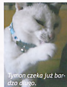
Tymon czeka już bardzo długo.