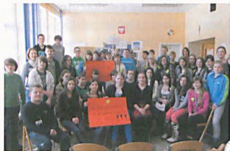
Uczestnicy debaty proekologicznej