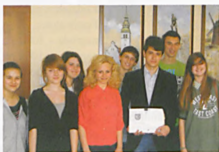
Młodzieżowa Rada Miasta w magistracie

Wśród ostatnich lat młodzież oceniła na "+" zintegrowanie komunikacji w tym całotygodniową komunikację nocną, nowe boiska rekreacyjne