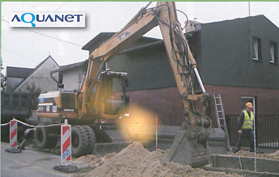
Prace związane z budową kanalizacji na ulicy Sobieskiego

Dużym zainteresowaniem mieszkańców cieszy się oczekiwana w Lasku kanalizacja tej części miasta. Piszą Państwo do nas o problemach komunikacyjnych, które daje się na bieżąco usuwać, czy też o swoich spostrzeżeniach o tempie prac i ich harmonogramie. Przypomnijmy, że kanalizacja Lasku nie była