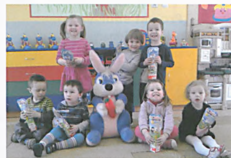
Maluszki z zajęciami

W marcu odwiedzili nas aktorzy z teatru „Arlekin” przedstawiając bajkę o 12-tu miesiącach. Spektaklowi towarzyszyła muzyka klasyczna Antonio Vivaldiego.