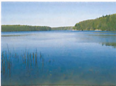
Fragment rynny glacjalnej z jeziorem Góreckim

Obszar wysoczyzny morenowej rozcinają wyłobione przez lądolód bruzdy, tzw. rynny polodowcowe. Rynny wypełnione są jeziorami rynnowymi: jezioro Jarosławieckie (pierwsza rynna), jeziora: Góreckie, Kociołek, Budzyńskie (druga rynna) i jezioro Łódzko-Dymaczewskie (trzecia rynna).