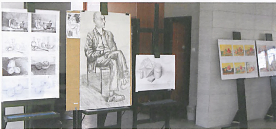
Wystawa eksponowana jest w wyremontowanym holu Ośrodka Kultury do 9 kwietnia br.