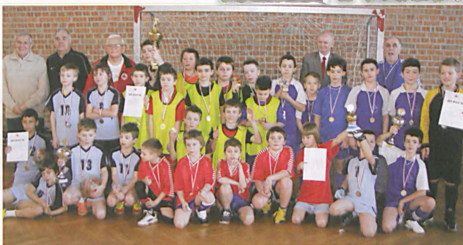
Honorowi krwiodawcy na sali gimnastycznej Szkoły Podstawowej nr 1 w Luboniu