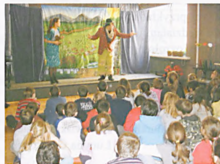
Czarnoksiężnik z Krainy Oz