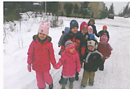
Najstarsza grupa pilnuje maluszków podczas zabaw na śniegu

Zimowa pogoda nie powstrzymuje przedszkolaków przed spacerami, a świeżo spadły, puszysty śnieg zachęca do zabawy. Starszaki pomagają naszym 2-latkom ubrać się ciepło i razem wychodzą do ogrodu. Najstarsza grupa z przejściem pilnowała bezpieczeństwa maluszków podczas zabaw na śniegu. Z pomocą nauczycielki dzieci wspólnie ulepiły bałwana. W „Chat-