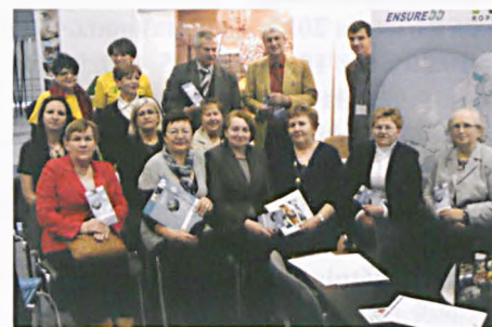
Spotkanie na terenie Targów Poznańskich

Szczegóły na: http://lubon.kylos.pl/3wiek/