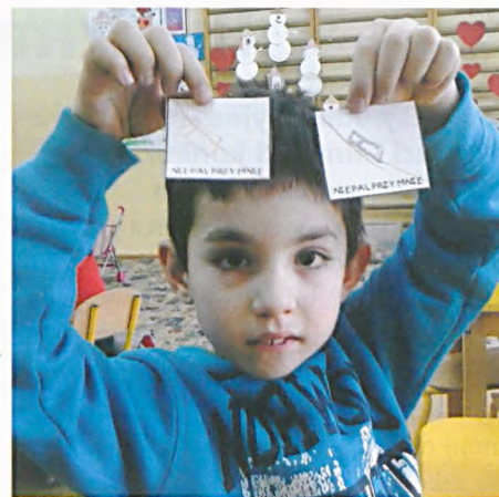
Program antynikotynowy „Czyste powietrze wokół nas”