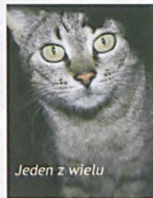
Jeden z wielu