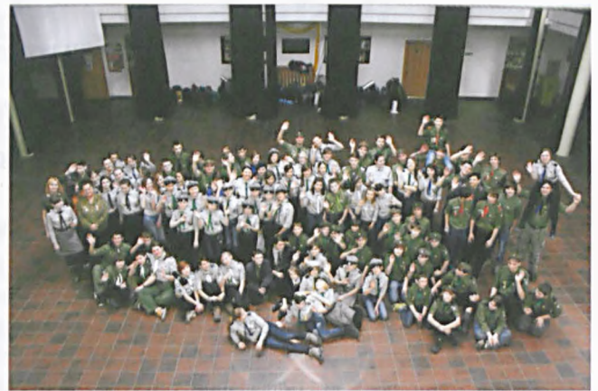
Spotkanie w w Gimnazjum nr 2 im. Jana Pawła II w Luboniu

Sobotnie popołudnie tym razem spędziliśmy pod znakiem warsztatów organizowanych przez najstarszych harcerzy. Dotyczyły one udzielania pierwszej pomocy, tańca, podstaw aikido, gier i zabaw, odbyły się warsztaty plastyczne oraz warsztaty słowa. Niedzielny poranek spędziliśmy