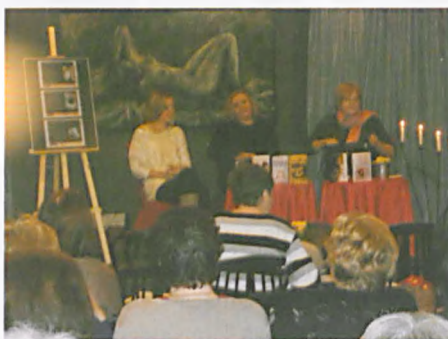
Wiosenny piknik z książką