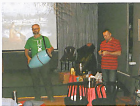
Indie na wyciągnięcie ręki