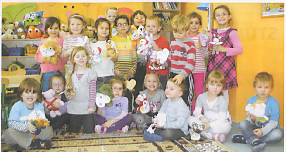
Zabawki dla afgańskich dzieci

Wiek przedszkolny to najlepszy czas na kształtowanie dobrych nawyków i postaw.