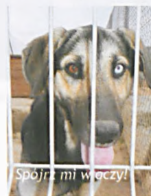
Spojrzyj mi w oczy!