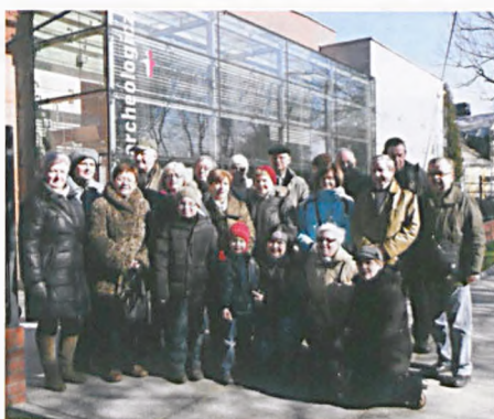
LUTW - uczestnicy wycieczki przed Budynkiem Rezerwatu Archeologicznego na Ostrowie Tumskim

W sobotni poranek studenci LUTW w ramach Zajęć Sekcji Turystyki Pieszej wybrali się do rezerwatu archeologicznego położonego na Ostrowie Tumskim w Poznaniu. Naszym oczom ukazały się fragmenty wałów i średniowiecznej zabudowy Ostrowa Tumskiego z X wieku. Była to wędrowka w czasie, którą rozpoczęliśmy od Sali kinowej z technologią 3D, gdzie obejrzelśmy film o początkach Państwa Polskiego. W salach ze szklanymi