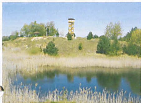
Zagospodarowanie dawnych wyrobisk cegielniarnych w Pożegowie, gm. Mosina

można presję urbanistyczną w postaci nowych, nie zawsze kontrolowanych inwestycji (np. zabudowa mieszkaniowa - rekreacyjna wokół linii brzegowych jezior). Parkowi towarzyszą ciągi tras komunikacyjnych, nasypy i wykopy dróg kołowych i kolejowych, naziemne niezorganizowane składowiska odpadów, odkrywki po dawnej eksploatacji surowców mineralnych – niektóre zagospodarowane, inne objęte naturalną sukcesją roślinności.