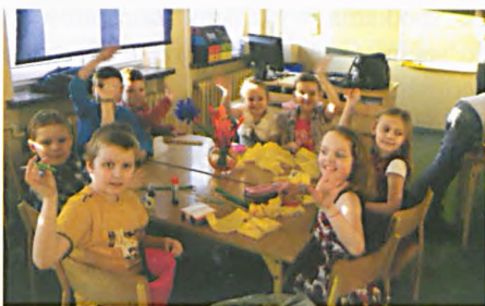
Drzwi Otwarte w „Czwórcę”