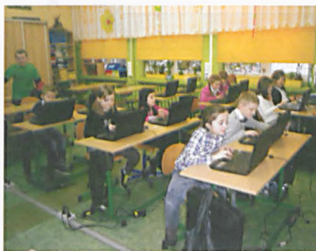
Drzwi Otwarte w SP3