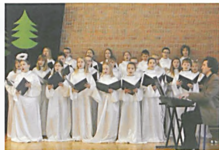
Jaselka w Cieszkowiance