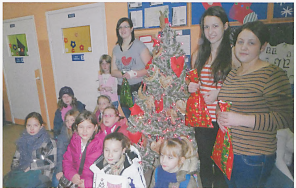
Razem przy choince