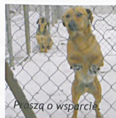
Proszę o wsparcie.