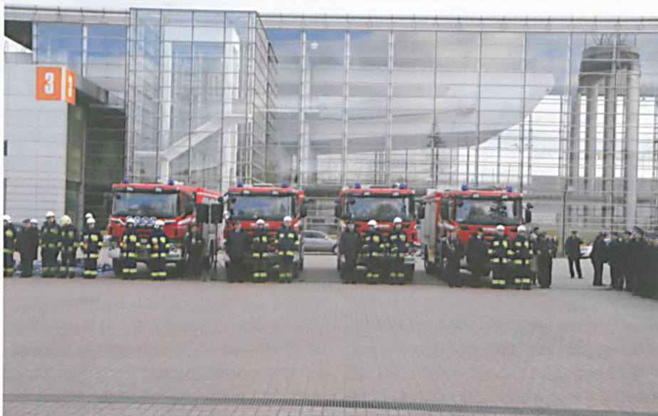
Zakupiono: 45 samochodów, 23 motopompy i 32 zestawy do ratownictwa technicznego. Nigdy wcześniej jednorazowo nie udało się przekazać tak dużej ilości sprzętu ratującego ludzkie życie

Sobota, 5 stycznia 2013 roku, była niezwykle ważnym dniem dla strażaków ochotników z województwa wielkopolskiego. Tego dnia przekazano im bowiem sprzęt warty 13 mln 671 tys. zł. Za te pieniądze udało się zakupić: 45 samochodów, 23 motopompy i 32 zestawy do ratownictwa technicznego. Nigdy wcześniej jednorazowo nie udało się przekazać tak dużej ilości sprzętu ratującego ludzkie życie.