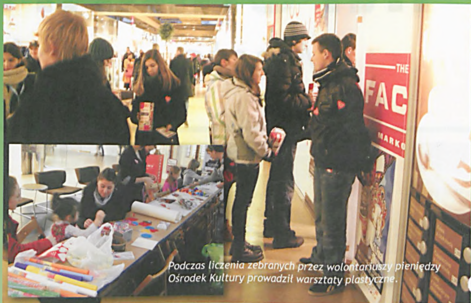
Podczas liczenia zebranych przez wolontariuszy pieniędzy Ośrodek Kultury prowadził warsztaty plastyczne.