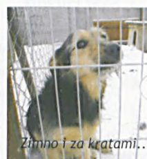
Zimno i za kratami...