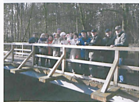
Spacer do Wielkopolskiego Parku Narodowego

każdy z nas musi się z nimi zgadzać, ale podumać warto!