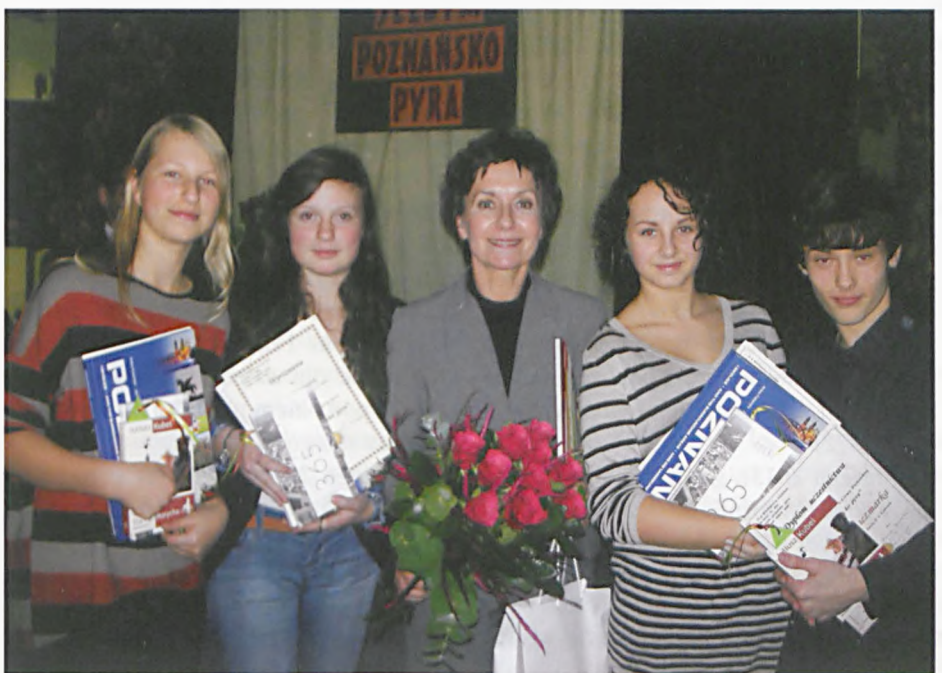
Nagrodzeni uczniowie w konkursie gwary