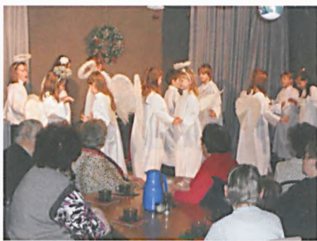
Jaselka w Promyku