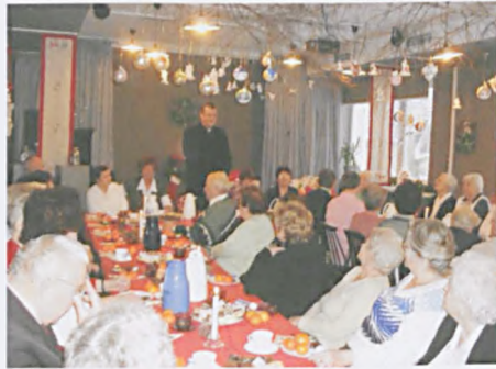
Wigilia w Promyku