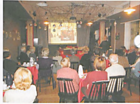
Od widelca do wizytówki