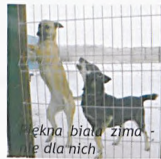
Błęka biała zima - nie dla nich