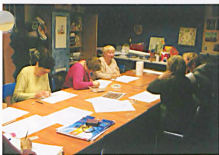
Próba odtworzenia wnętrz naszych domostw

Omówienie podczas prezentacji podstawowych zasad i stylów urządzania wnętrz było uzupełnieniem zajęć praktycznych.