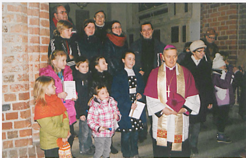
Flażoleciści z Ośrodka Kultury w katedrze z biskupem Grzegorzem Balcerkiem