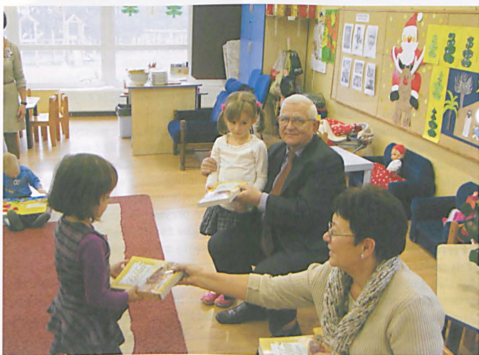
Spotkanie oplatkowe w przedszkolu Weseli Sportowcy