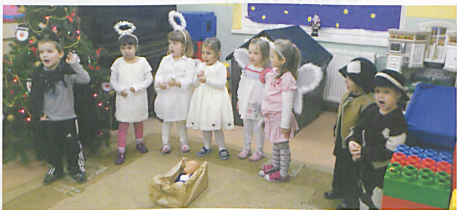
Dzieci przedstawiają Jasełka

Ale to nie koniec grudniowych niespodzianek! Nauczycielki „Chatki Skrzatka” przygotowały kolejną atrakcję dla swoich wychowanków, jaką niewątpliwie było nocowanie w przedszkolu. Tym razem był to Kurs na Pomocników Świętego Mikołaja. Dzieci zmagaly się z przeróżnymi zadaniami: uczyły się w trybie ekspresowym zakładać strój Świętego Mikołaja, pokonać świąteczny tor przeszkód, w którego skład wchodziło wdrapanie się po drabinie i przejście przez komin, nie obyło się bez wyścigów na ślizgach i