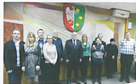
Laureaci I konkursu meldunkowego z burmistrzem

Na podstawie znowelizowanej niedawno ustawy o ewidencji ludności i dowodach osobistych uproszczeniu do minimum uległy procedury związane z obowiązkiem meldunkowym. Szybciej gdyż aby się zameldować lub wymeldować wystarczy jedna wizyta w urzędzie. Uproszczeniu ulega procedura wymeldowania się. Nastąpi to samoczynnie podczas zgłoszenia meldunku w urzędzie właściwym dla nowego miejsca pobytu. Do 30 dni został wydłużony termin na dokonanie obowiązku meldunkowego. Zniesiono również sankcje karne za niedopełnienie tych formalności. Nowelizacja ustawy zakłada zniesienie obowiązku meldunkowego do 1 I 2016 r.