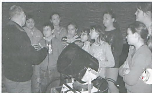
Uczniowie w ruchomym Planetarium Nieba Północnego