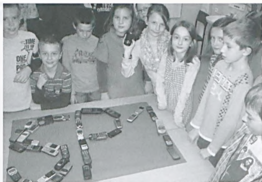
Zbiórka starych telefonów w ramach akcji Ekoszkola

3 grudnia do Szkoły Podstawowej nr 1 zawitało ruchome Planetarium Nieba Północnego, dzięki któremu uczniowie zostali zabrani w kosmiczną podróż w czasie od wielkiego wybuchu do narodzin gwiazd i planet. Już sama kopuła planetarium niewątpliwie wzbudzała w uczniach ciekawość, gdyż wyglądała jak dom, którego nie