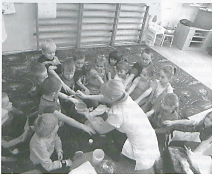
Dzieci z SP4 poznają zawód kosmetyczki