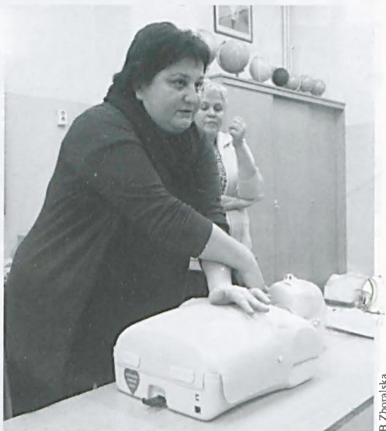
Nauka udzielania pierwszej pomocy w SP 4