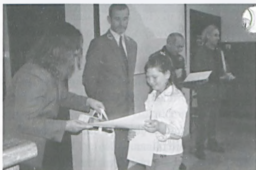
Jedna z laureatek konkursu plastyczno-przyrodniczego „Las i jego mieszkańcy”