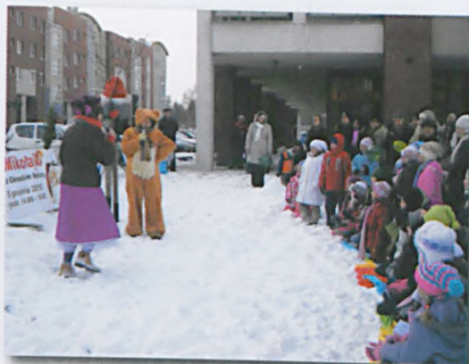
Zabawa na śniegu i występ Dobrego Teatru