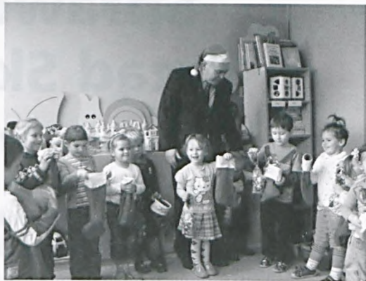
Słodkie upominki dla przedszkolaków

Prawie 600 dzieci z lubońskich przedszkoli 6 grudnia otrzymało z rąk Świętego Mikołaja i jego pomocników słodkie upominki. Już po raz czwarty odwiedzam lubońskie przedszkola, powiedział Święty Mikołaj, w którego rolę wcielił się Burmistrz Miasta Luboń. Jak co roku dzieci pięknie przygotowały się na moją wizytę, wysłuchałem wielu piosenek i wierszy o tematyce zimowej. Wzruszające jest to, że przedszkolaki pamiętały o prezencie dla mnie. Piękne rysunki przez ko-