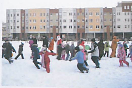
J. Gryczyńska x2

6 grudnia na placu przy ulicy Wschodniej w Luboniu obchodziliśmy Mikołajki. Był świąteczny elf w zielonym kubraczku, a także laleczka i miś – bożonarodzeniowe prezenty. Wspólnie śpiewaliśmy świąteczne piosenki, oglądaliśmy teatrzyk i rozgrzewaliśmy zmarznięte nogi biorąc udział w korowodach tanecznych i zabawach. Nie zabrakło też najważniejszego gościa, Świętego Mikołaja, który częstował wszystkie dzieci i ich rodziców słodkościami. Wszyscy uczestnicy wrócili do domów z kolorowymi balonami. ■