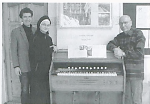
Fisharmonia dla „Cieszkowianki” od Zgromadzenia Sióstr Służebniczek w Luboniu

23 listopada 2010r. odbyła się wycieczka do siedziby policji konnej w Kiekrzu. Uczestniczyła w niej klasa 6b. Ciekawie opowiedziano nam o koniach. Dowiedzieliśmy się między innymi w ja-