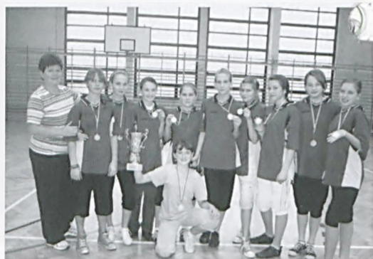
Zwycięska drużyna z SP2