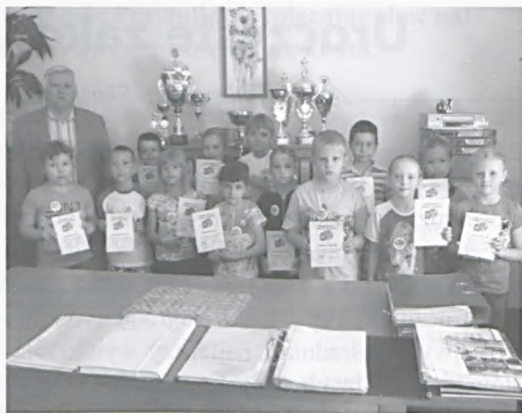
Uczniowie wyróżnieni w konkursie „Super Uczeń”

W minionym roku szkolnym w klasie 1b w SP1 miał miejsce konkurs na „Super Ucznia”. Polegał on na zbieraniu tzw. Super-ów, punktów otrzymywanych za zachowanie oraz wyniki w nauce. Pod koniec roku wyróżnienie z rąk dyrektora naszej szkoły otrzymało aż czteremastu uczniów. Zwycięzcom serdecznie gratuluję, jednocześnie mam nadzieję, że nadchodzący rok szkolny sprawi, iż lista „Super Uczniów” powiększy się, czego pozostaję uczniom szczerze życzę.