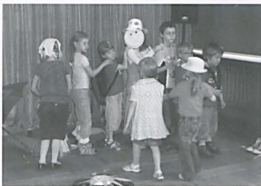
Zabawa w teatr

Taki tytuł nosił wernisaż, który odbył się 25