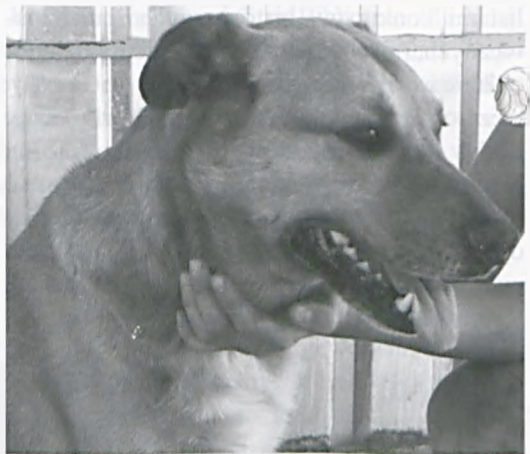
Pies Brutus w Przytulisku

Niestety bardzo często spotykamy się też z drastycznymi przypadkami okrucieństwa wobec