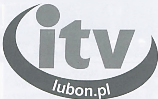
Logotyp telewizji z Lubonia

Zachęcamy uczestników miejskich wydarzeń do poszukiwania siebie, swoich bliskich lub znajomych w relacjach z imprez.