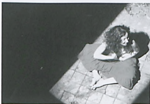
Hiszpański klimat w spektaklu „NosotroSolIE”

Pierwsze pomysły realizacji spektakli teatralnych na terenie Lubonia powstały na przełomie 2008 i 2009 roku po spotkaniu z panem Lechem Raczakiem, dyrektorem artystycznym Międzynarodowego Festiwalu Teatralnego Malta. Udało nam się przekonać związanego ze stolicą Wielkopolski reżysera do naszej idei prze-