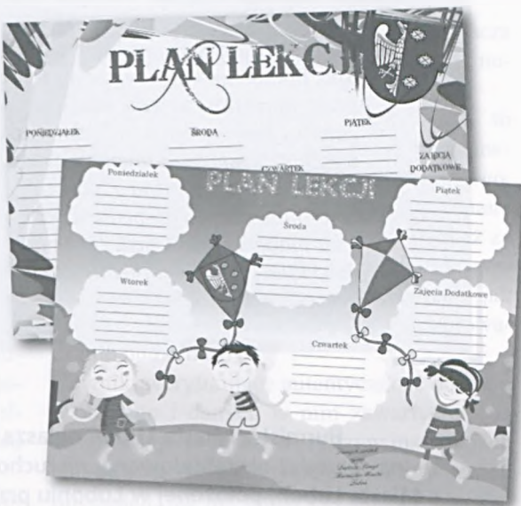
■ Plany lekcji dla lubońskich uczniów

Na dobry początek roku szkolnego, wszyscy uczniowie lubońskich szkół podstawowych i gimnazjów otrzymają od Burmistrza Miasta Luboń plany lekcji. Kolorowe projekty opatrzone herbem Miasta zostaną przekazane 1 września bieżącego roku podczas uroczystości rozpoczęcia roku szkolnego.