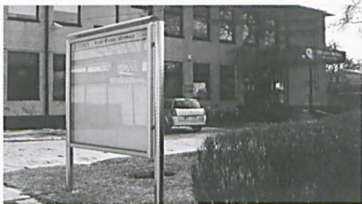
Tablica przy Ośrodku Kultury

Na terenie Ośrodka Kultury w Luboniu, przy ulicy Jana III Sobieskiego 97, w okolicach drogi dojazdowej do poczty, pojawiła się nowa gablota ogłoszeniowa. Regularnie będą w niej wywieszane informacje, wszelkie aktualności i najnowsze wydarzenia dotyczące Lubonia i instytucji związanych z miastem. Zachęcamy mieszkańców do zapoznawania się z treścią ogłoszeń.