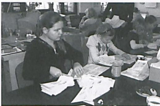
Praca w fundacji Redemptoris Missio