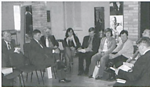
Radni powiatowi w Muzeum Martyrologicznym

Podjęwane przez Miasto Luboń działania z zakresu kultury i sportu stały się wiodącym tematem Komisji Promocji, Rozwoju i Integracji Europejskiej Rady Powiatu Poznańskiego, która odbyła się 22 marca bieżącego roku w Muzeum Martyrologicznym w Żabikowie. Poznańscy Radni podczas spotkania mieli możliwość obejrzenia