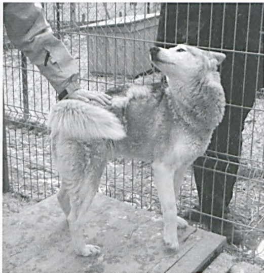
Pies husky z Lubonia

Problem bezdomności zwierząt to także zbyt wysoka ilość rodzących suczki na wsiach. Nie-