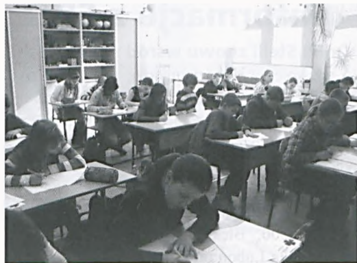
Konkurs na najlepszego ekologa „Trójki”

Marzec, mimo opóźniającego się przedwiośnia, rozpoczęliśmy na sportowo. W naszej szkole odbyły się Mistrzostwa Lubonia w piłce nożnej o puchar Dyrektora Szkoły „Trójka Cup” dla uczestników roczników 1998 i 2000. Pierwsze miejsca zajęła Szkoła nr 1, drugie Szkoła nr 2, trzecie Szkoła nr 3 a czwarte Szkoła nr 4. Miej-