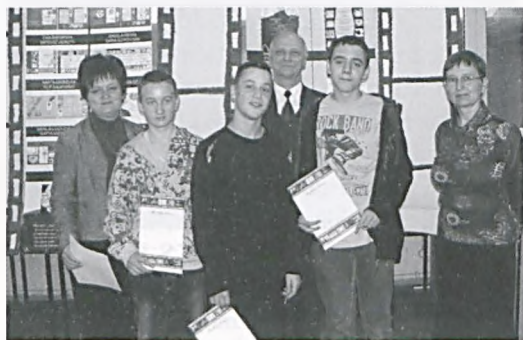
Portret mojej szkoły

5 marca 15 gimnazjalistów wyruszyło na zwie-