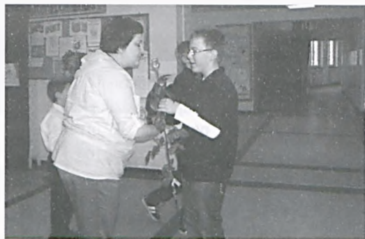
8 marca w SP4

Z okazji Dnia Kobiet klasy IIIa i IIIb pojechały do kina na film pt „Alicja w krainie czarów” w reżyserii Tima Burtona. W filmie, który obejrzelśmy w wersji 3D, udaliśmy się razem z Alicją do magicznego świata. Spotkaliśmy tam zawadiacką Popielicę, zwariowanego Ka-