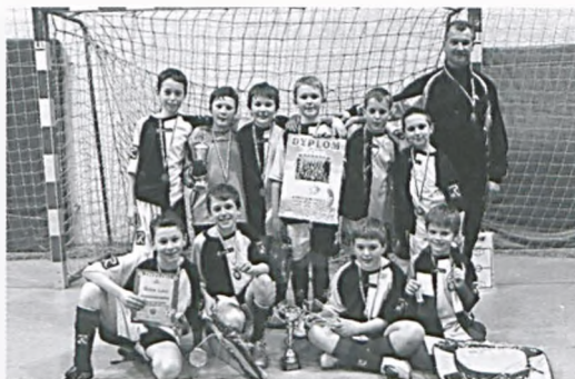
Orliki Stelli Luboń z medalami i pucharami