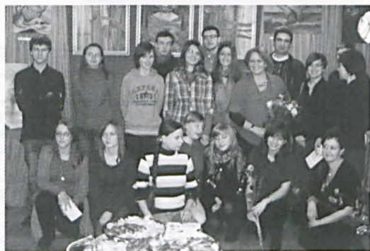
Piątków ciąg dalszy

Zapraszamy na naszą stronę internetową: www.biblub.com