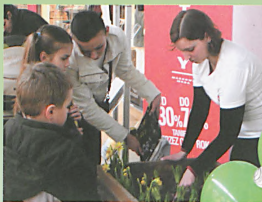
Akcja zamiany zużytych baterii na sadzonki kwiatów

W ramach akcji „Wymień trzy paluszki na wiosenne kwiatuszki” zorganizowanej przez Miasto Luboń wszystkie osoby, które 21 marca odwiedziły centrum handlowe Factory Outlet i zgłosiły się na stoisko miejskie z co najmniej trzema zużytymi bateriami miały możliwość ich wymiany na cebulkę kwiatową. Celem tej