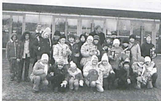
Dzień Kobiet w kinie