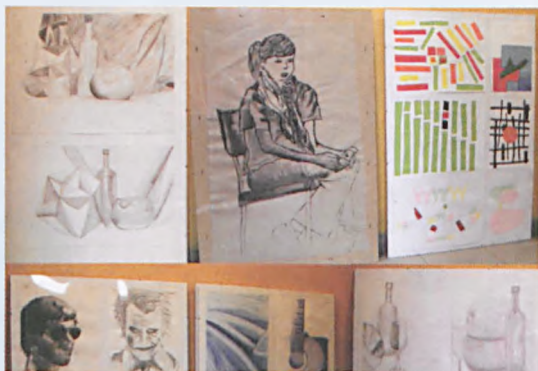
Niektóre z prac prezentowanych na wystawie