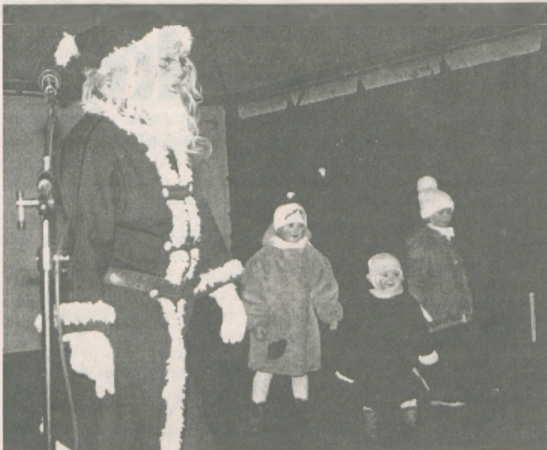
Sylwester na Starym Rynku