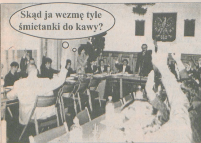
Z obrad Rady Powiatowej w Środzie.