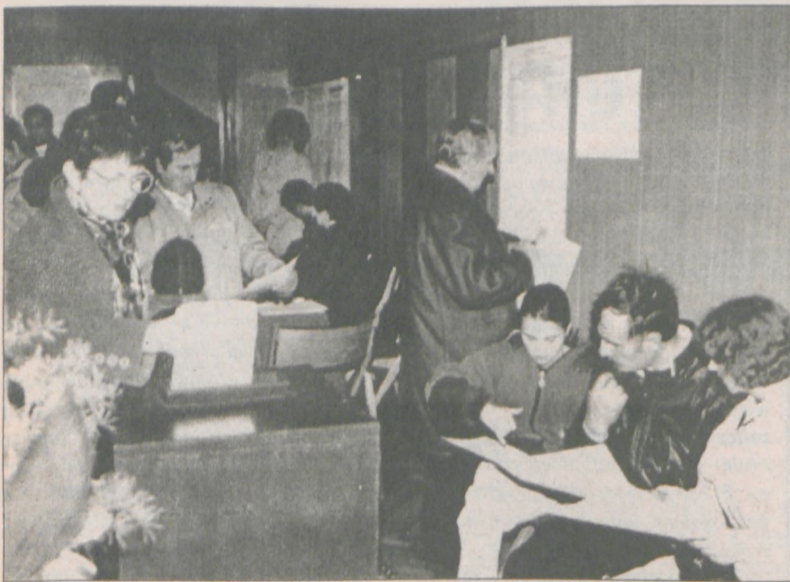
11.10. - wybory samorządowe do Rad Gmin, Powiatowych i Sejmiku Wojewódzkiego

nienia Zespołu Szkół Zawodowych w Środzie.