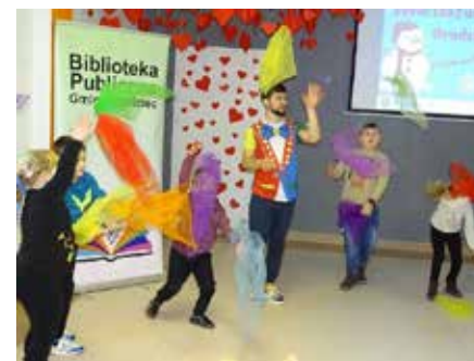
fol. BPG Grodziec

„Z nami nuda się nie uda!” – pod takim hasłem w Bibliotece Publicznej Gminy Grodziec przygotowano interesującą, różnorodną ofertę zajęć oraz warsztatów. Z oferty biblioteki skorzystało prawie 200 osób. Najmłodszy mieszkańcy Grodzca i okolic chętnie brali udział w licznych zajęciach artystycznych, sportowych czy twórczych.