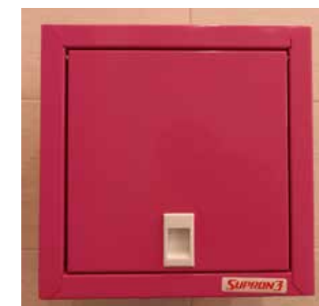
fol. BPMiG Wolsztyn

Biblioteka Publiczna Miasta i Gminy Wolsztyn im. St. Platęra