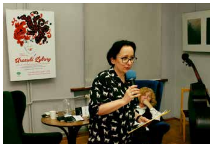
fol. MBP Kalisz