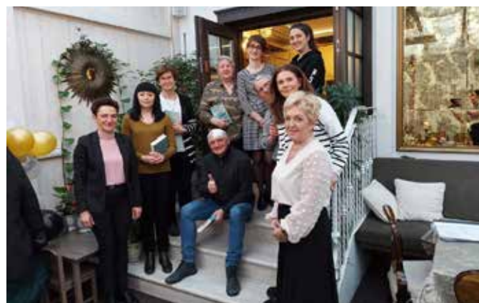
fol. PBP Wągrowiec