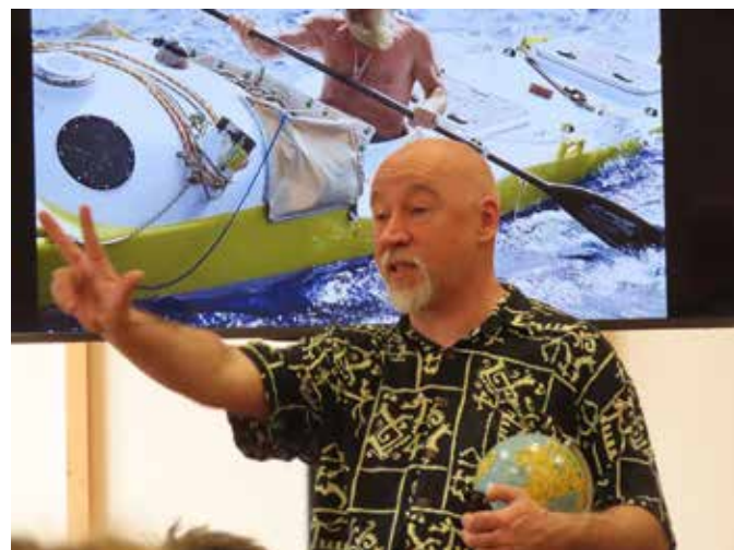
Grodziska Biblioteka Publiczna w Grodzisku Wielkopolskim

za udział w konkursach organizowanych przez bibliotekę szkolną. Gorąco zachęcał też do aktywności. „Wystarczy wstać i zrobić parę kroków... Kiedy ruszysz przed siebie, na pewno spotka Cię coś ciekawego...” – mówił. Zacytował też słowa Aleksandra Doby, który mówił: „Nie lękajmy się marzyć, stawiać sobie ambitne cele; a potem... próbujmy je realizować”.