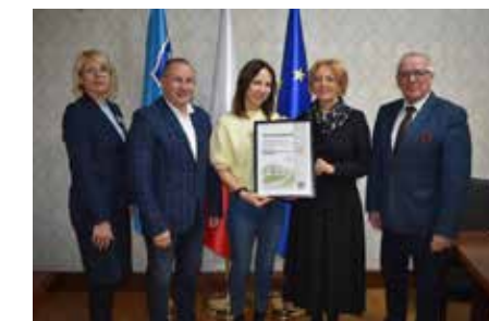
fol. UM Krotoszyn