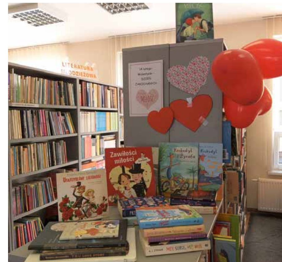
fol. BPMiG Wolsztyn

Biblioteka Publiczna Miasta i Gminy Wolsztyn, filia w Obrze