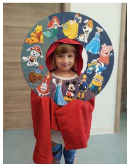
Biblioteka Publiczna Miasta i Gminy Wolsztyn – filia w Obrze