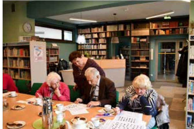
fol. MIPBP Nowy Tomysz