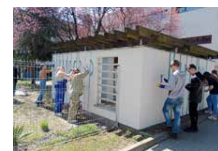
fol. MiPBP Nowy Tomysz

Do „Bibli(o)grodu” dotarł „HORYZONT”, czyli 12. Drużyna Starszoharcerska. Grupa młodych harcerzy pomogła w pracach porządkowych, dokończyła malowanie ogrodzenia oraz przygotowała częściowo szkic muralu przy użyciu projektora. W kolejnym etapie prac, Grupa Inicjatywna również zaplanowała działania z udziałem młodzieży. Tym razem, zaprosimy lokalną młodzież do udziału w warsztatach