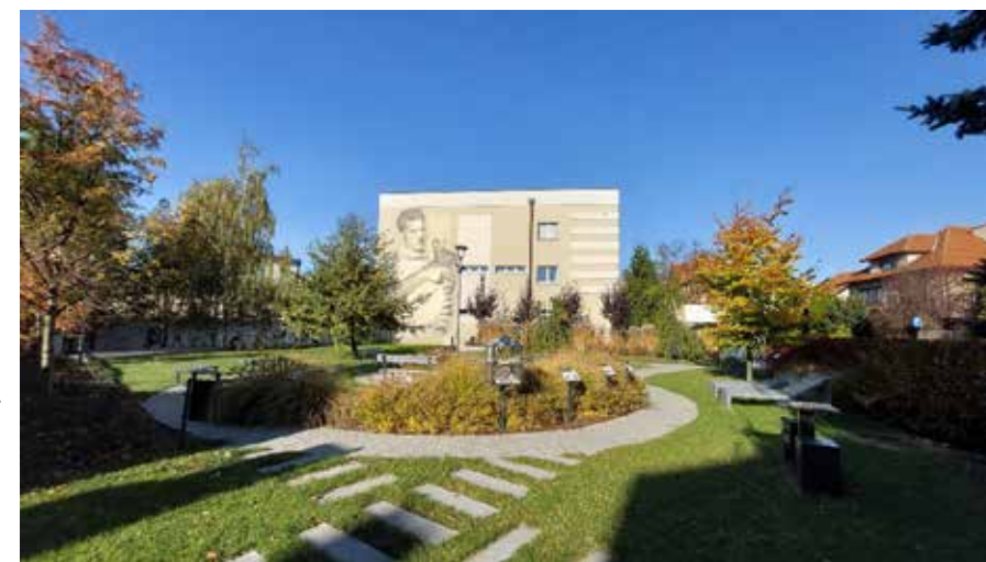
fol. BpMiC Wojsztyn