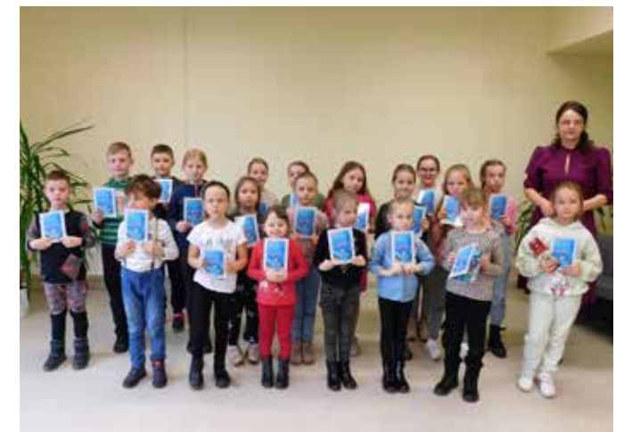
fol. GBP Trzcinica