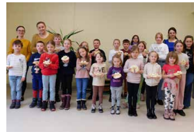
fol. GBP Trzcinica