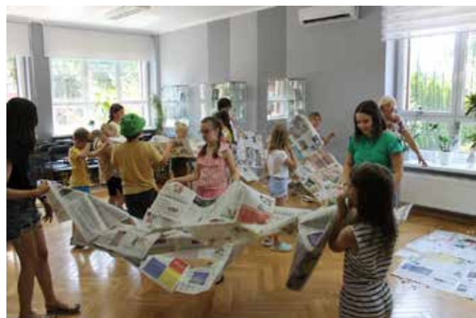
fol. BPMiG Ostrzeszów