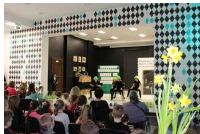
fol. BPMiG Wolsztyn

W Bibliotece Publicznej Miasta i Gminy Wolsztyn im. St. Platera odbyły się dwa ciekawe konkursy. Pierwszy z nich to I Gminny Konkurs Mitologiczny. Konkurs był przeznaczony dla uczniów szkół podstawowych klas piątych i szóstych. Oprócz rozgrywek uczniowie z SP 2 przygotowali przedstawienie. Na scenie zaprezentowali swobodną interpretację mitów. W scenie rodzajowej pojawiła się Afrodyta,