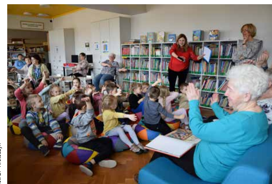
fol. BP Krotoszyn