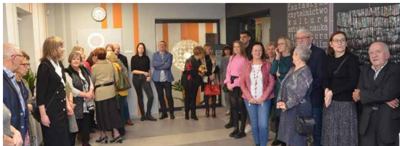
fol. BP Bolewice