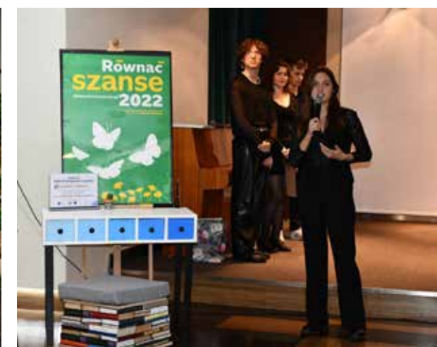
fol. MIPBP Nowy Tomysł