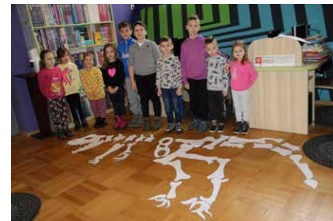
fol. MIPBP Nowy Tomysz