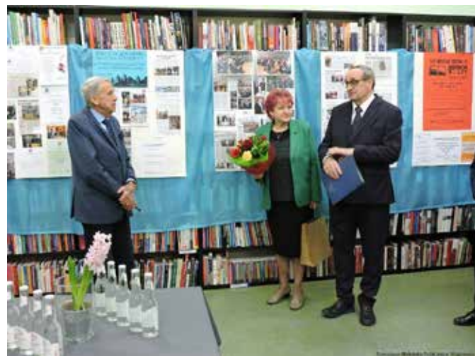
fol. PBP Wągrowiec