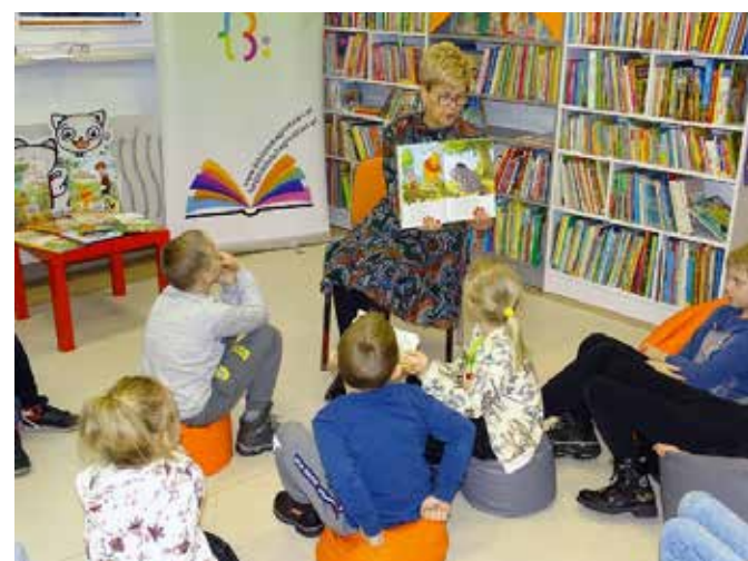
fol. BPG Grodziec