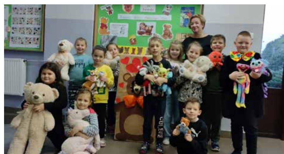
fol. BPMiG Wolsztyn

Dzień Pluszowego Misia jest obchodzony na całym świecie. Wszędzie tam, gdzie pojawiają się dzieci, następuje prawdziwa celebrowanie tego sympatycznego święta. Również w bibliotece w Starym Widzimiu obchodziliśmy to miłe Święto. W tym dniu praktycznie wszystkie dzieci przyniosły ze sobą swoje ulubione maskotki – przytulanki. Biblioteka wraz z nauczycielami ze szkoły przygotowali dużo atrakcji z okazji tego Święta dla klas I-III i dla Przedszkola i Zerówki. Były więc bajki, wiersze o misiach, piosenki i tańce z misiami. Były również zagadki, opowieści o pluszowych maskotkach, gry i zabawy. Atrakcją była Foto Budka – Miś (wykonana przez panię z biblioteki), gdzie było można zrobić zdjęcie, z czego dzieci bardzo skrzętnie korzystały. Jak przystało na Misiowe Święto, nie mogło zabraknąć przysmaku niedźwiadków. Dzieci mogły skosztować