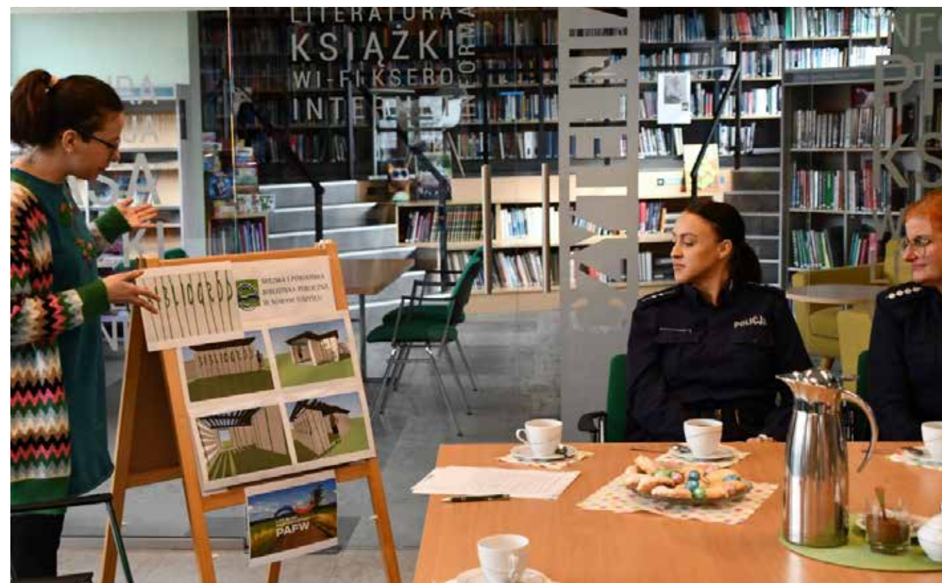
fol. MiPBP Nowy Tomys