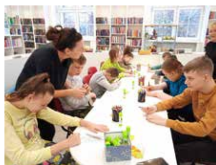
fol. BPMiG Wolsztyn

Ogólnopolski Dzień Biblioterapii odbył się w 2022 roku pod hasłem „Czytanie daje siłę! Biblioterapia w sytuacjach kryzysowych”. W Bibliotece Publicznej Miasta i Gminy Wolsztyn im. St. Platęra miało miejsce spotkanie dla uczniów ze Szkoły Specjalnej nr 4 z Wolsztyna. Tematem przewodnim była jesień wokół nas. Uczniowie zobaczyli teatr Kamishibai, wzięli udział w zajęciach plastycznych i przeglądali księgozbiór Oddziału dla Dzieci. Bibliotekę odwiedziły tego dnia także przedszkolaki z grup 0 z Przedszkola nr 5, które wysłuchały opowieści Pana Poety „Sowa, co bałagan ma w porządku”.