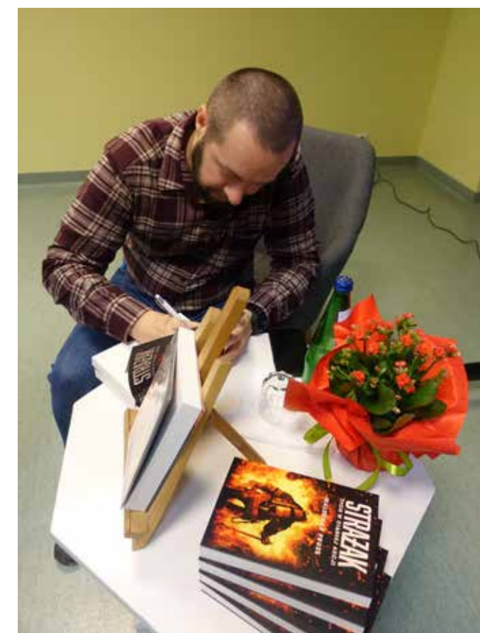
fol. MBP Wągrowiec