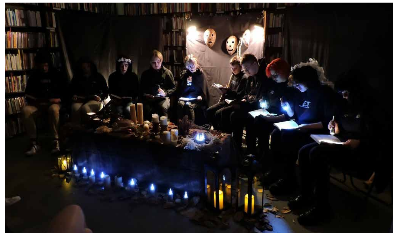
fol. PBP Wągrowiec

Małgorzata Bejm, Powiatowa Biblioteka Publiczna w Wągrowcu