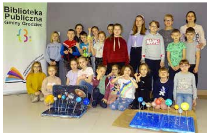
fol. BPMiG Wolsztyn

Biblioteka Publiczna Miasta i Gminy Wolsztyn im. Stanisława Platara