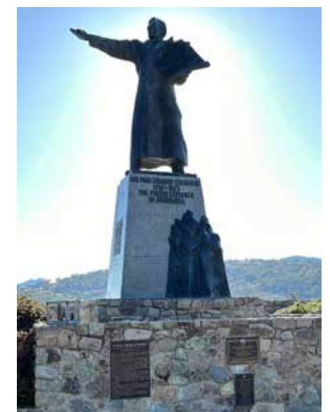
fol. Renata Rychlewska