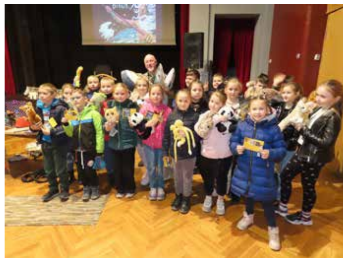
fol. GBP Grodzisk Wilkp