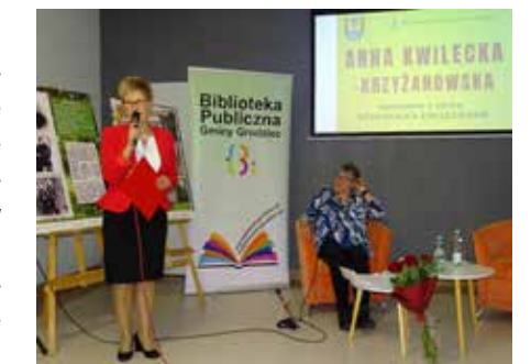
fol. BP Gminy Grodziec