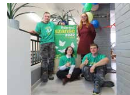
fol. BP Grodzisk Wielkopolski

– Projekt nauczył młodzież działania w grupie, dzielenia się obowiązkami czy planowania przedsięwzięć. Jak wiadomo umiejętności