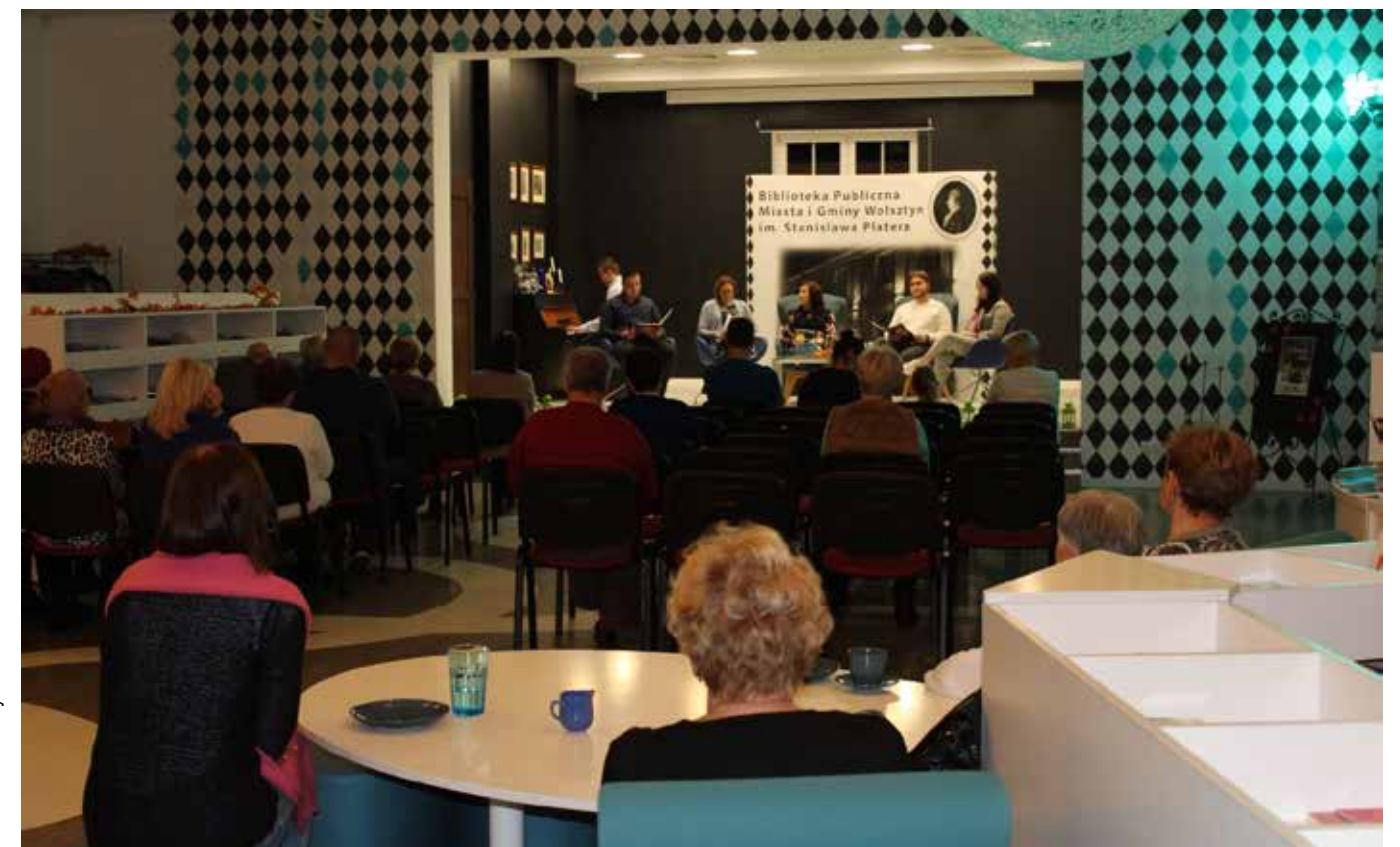
fol. BFMiG Wolsztyn

Biblioteka Publiczna Miasta i Gminy Wolsztyn im. Stanisława Platera