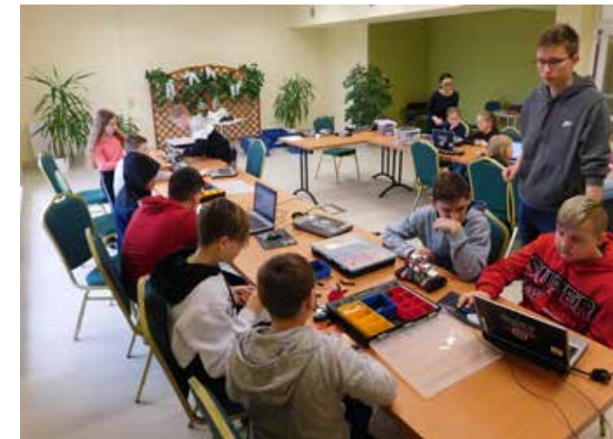
fol. GBP Trzcinica