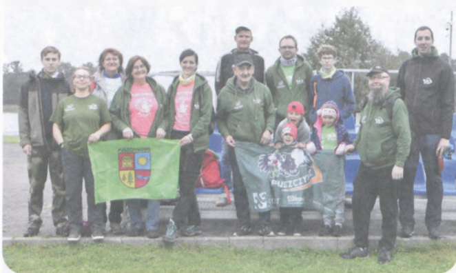
Fot: Małgorzata Maniecka