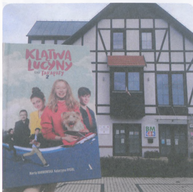
„Kłątwa Lucyny, czyli tarapaty 2”, M. Karwowska, K. Rygiel, il. M. Ruszkowska. Wyd. Agora, Warszawa 2020. Zdjęcie z okładki książki M. Mutor, opracowanie graficzne książki ProDesGraf)