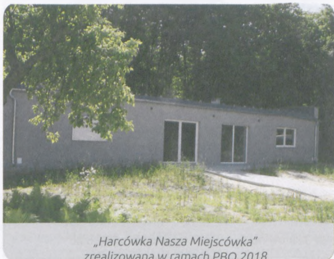
„Harcówka Nasza Miejscówka” zrealizowana w ramach PBO 2018