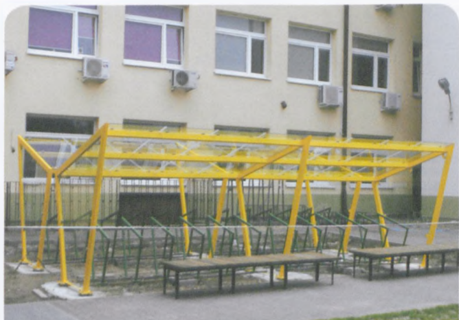
wiata rowerowa przy SP nr 1