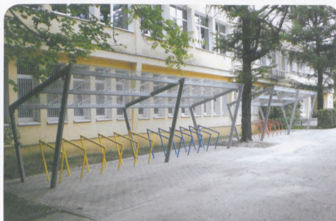
wiata rowerowa przy SP nr 2