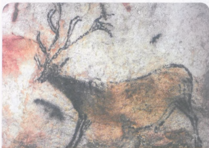
Oryginalne malowidła w Grocie Lascaux /fot. Ray Delvert/ pozostałe fotografie to prace Marii Gostylli-Pachuckiej.