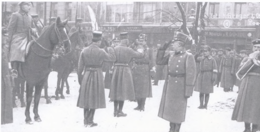
26 stycznia 1919 – dowódca 1 Pułku Strzelców Wielkopolskich generał Daniel Konarzewski raportuje generałowi Józefowi Dowborowi-Muśnickiemu. Widoczny także m.in. generał Filip Stanisław Dubiski (stoi z prawej).

11 stycznia 1919 – bój o Szubin zakończony tryumfem strony polskiej. Znaczenie tej bitwy było duże, ponieważ, w rękach powstańców znalazł się nie tylko Szubin, ale również i Żnin, Łabiszyn, Złotniki. W innych rejonach północnej Wielkopolski także dała się zauważyć