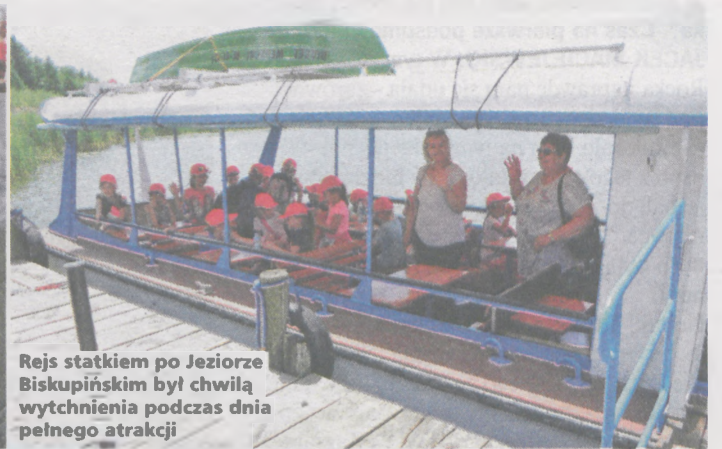
Rejs statkiem po Jeziorze Biskupińskim był chwilą wytchnienia podczas dnia pełnego atrakcji