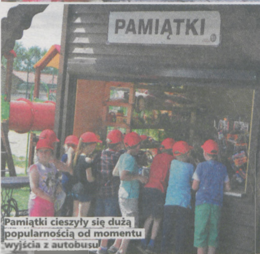
Pamiątki cieszyły się dużą popularnością od momentu wyjścia z autobusu!