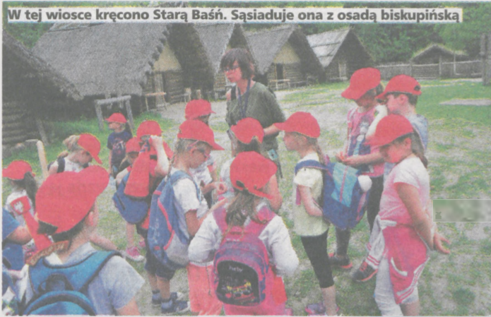
W tej wiosce kręcono Starą Baśń. Sąsiaduje ona z osadą biskupińską