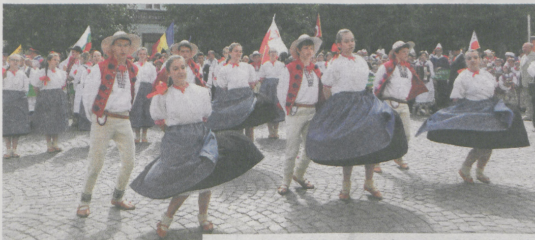
Rodzimy, polski folklor prezentowały zespoły „Ziemia Cieszyńska” z Cieszyna, „Szwajcaria Żerkowska” z Żerkowa (u góry), a także Zespół Śpiewaczy „Dąbrowianki” z Dąbrowy i Zespół Folklorystyczny „Snutki” (u dołu)