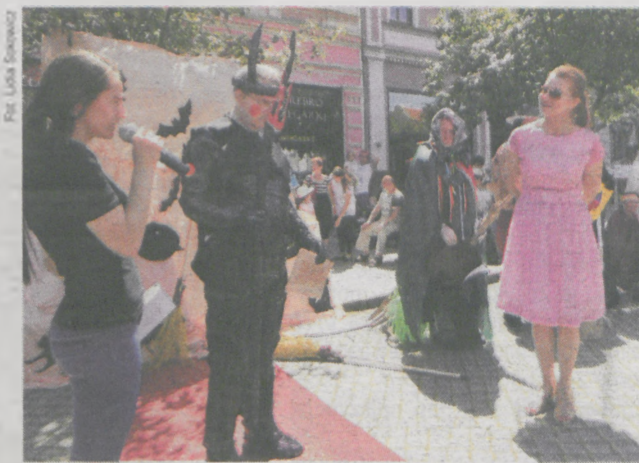
Diabeł przygotowany przez DPS w Raszewach został oceniony najwyżej przez komisję konkursową