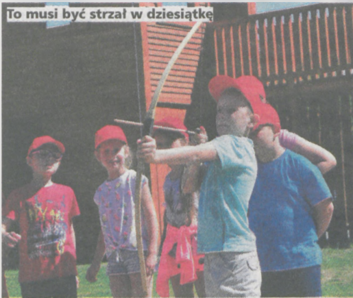
To musi być strzał w dziesiątkę