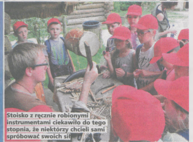
Stoisko z ręcznie robionymi instrumentami ciekawilo do tego stopnia, że niektórzy chcieli sami spróbować swoich sił