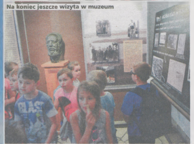
Na koniec jeszcze wizyta w muzeum