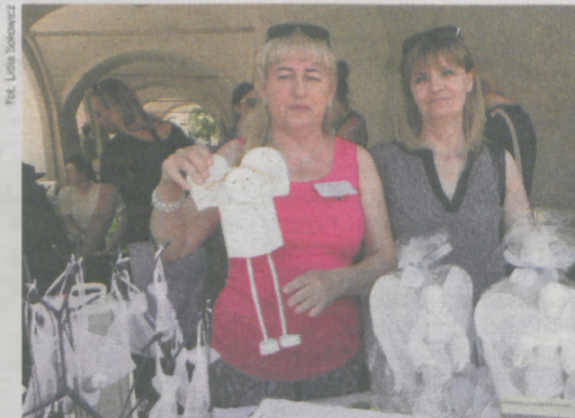
Konkursowi „Coś z niczego” towarzyszył kiermasz rękodzieła. Na zdjęciu stoisko Warsztatu Terapii Zajęciowej w Jarocinie