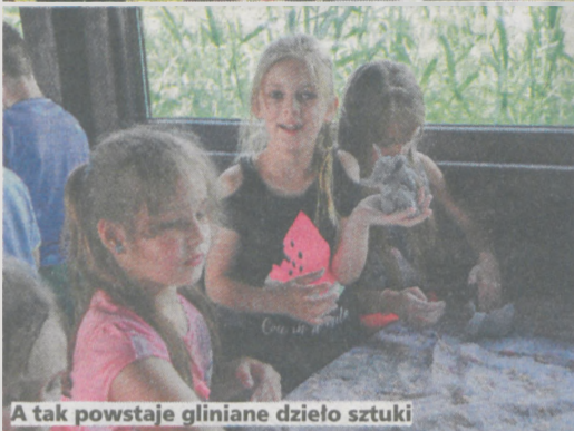
A tak powstaje gliniane dzieło sztuki