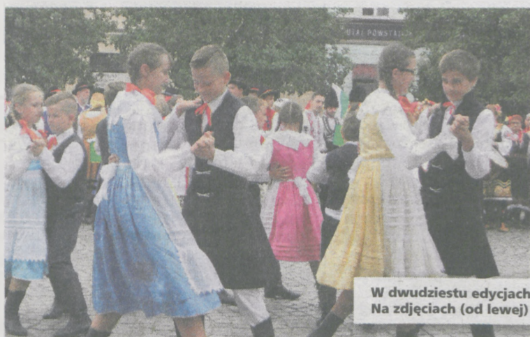
W dwudziestu edycjach spotkań z folklorem wzięły udział 93 zespoły, w tym 54 z zagranicy. Na zdjęciach (od lewej) „Noskowiacy”, „Ilinden” z Macedonii i „Cununita” z Rumunii