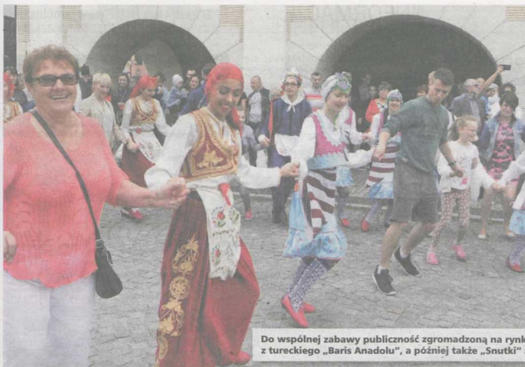
Do wspólnej zabawy publiczność zgromadzoną na rynku wciągnęli najpierw tancerze z tureckiego „Baris Anadolu”, a później także „Snutki” z Potarzycy