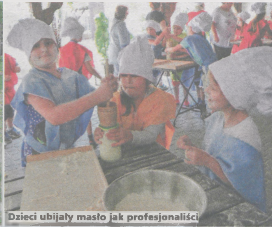
Dzieci ubijały masło jak profesjonalści