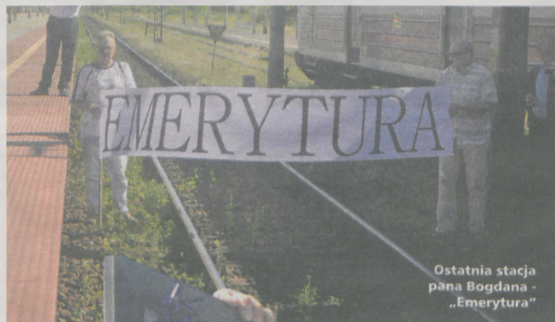
Ostatnia stacja pana Bogdana - „Emerytura”