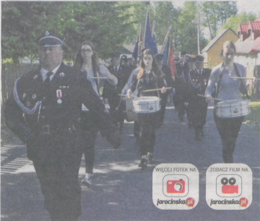
W ramach obchodów 85-lecia strażacy przeszli przez wieś