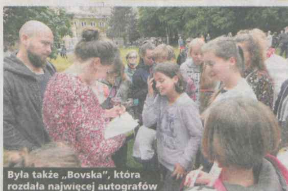
Była także „Bovska”, która rozdała najwięcej autografów