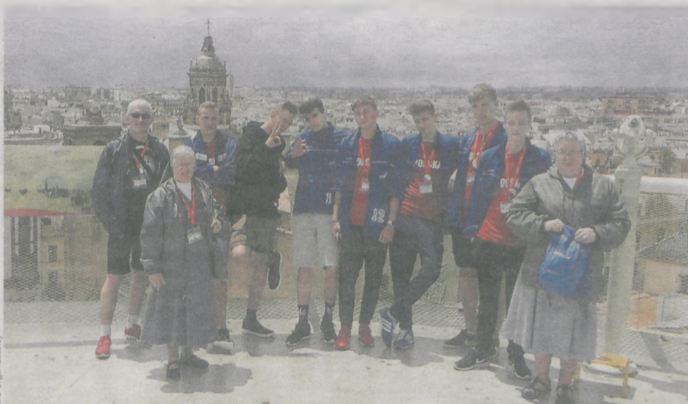
Wyjazd był okazją również do zwiedzenia pięknej Andaluzji