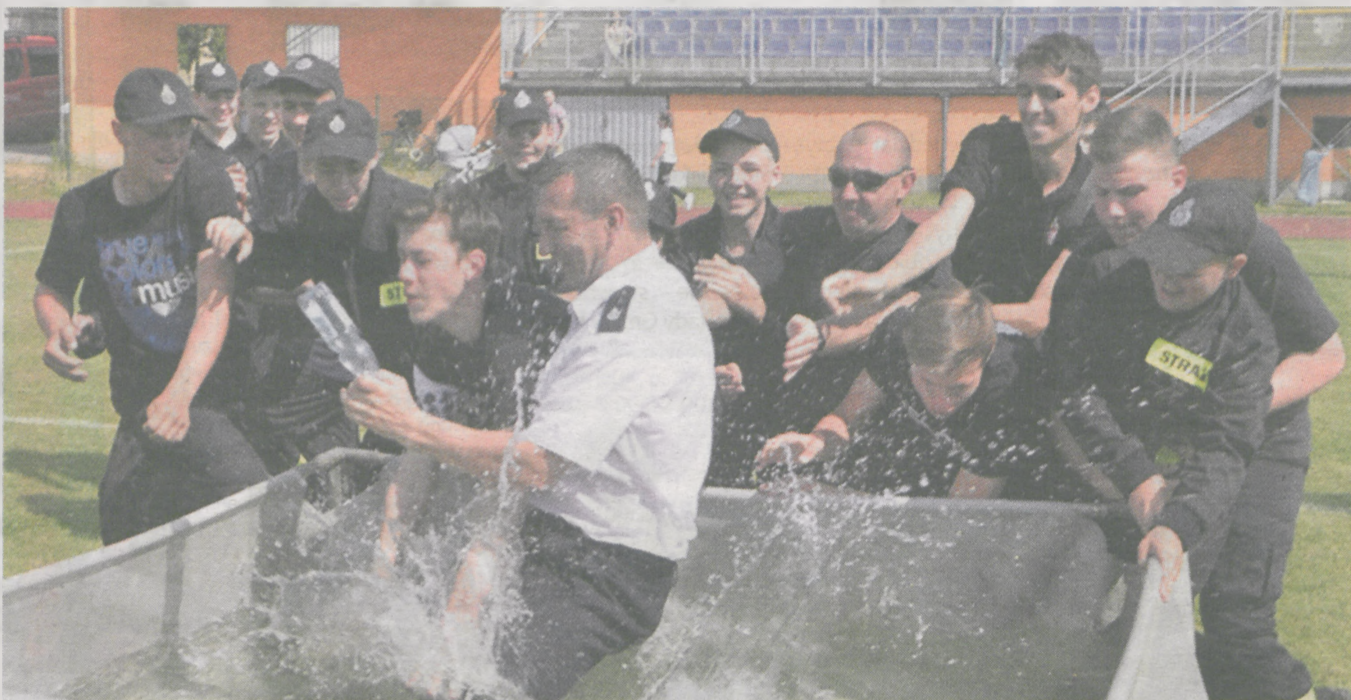
Na zakończenie opiekunowie drużyn młodzieżowych zostali wrzuceni do basenu

1. OSP Cielcza 2. OSP Kadziak 3. OSP Witaszyce