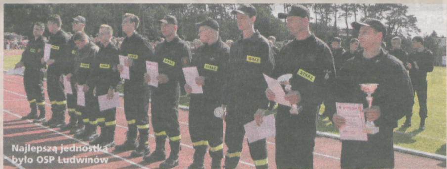
Najlepszą jednostką było OSP Ludwinów

1. OSP Ludwinów I 2. OSP Ludwinów II 3. OSP Ludwinów III