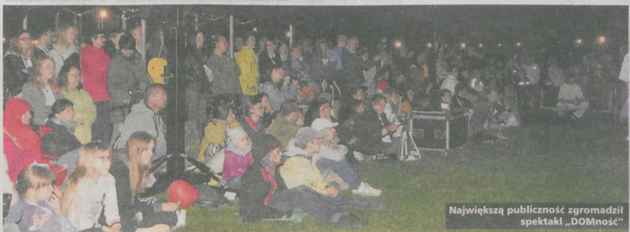
Największą publiczność zgromadził spektakl „DOMność”