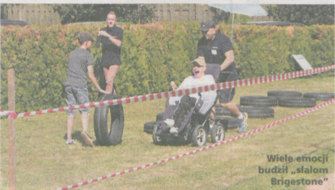
Wiele emocji budził „ślalom Bridgestone”