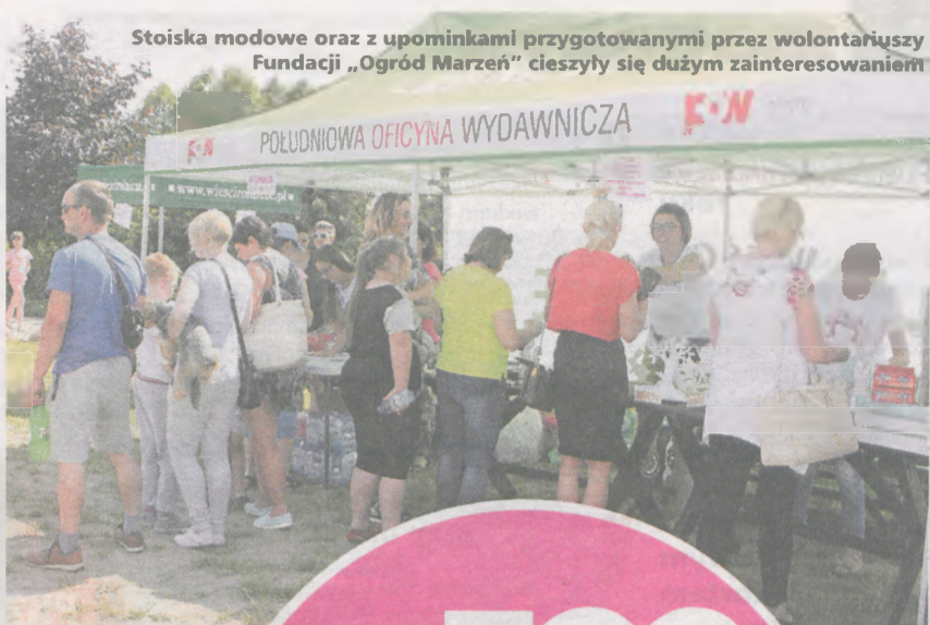
Stoiska modowe oraz z upominkami przygotowanymi przez wolontariuszy Fundacji „Ogród Marzeń” cieszyły się dużym zainteresowaniem