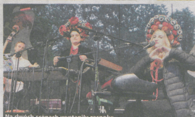
Na dwóch scenach wystąpiły zespoły: „DagaDana” (u góry), „PogoDni” z Jarocina (na dole) i New Day