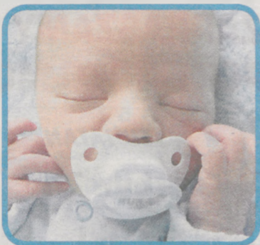
KSAWERY NIEDZWIECKI Z JAROCINA ur. 15 czerwca o godz. 23.21 waga 3.000 g, wzrost 56 cm