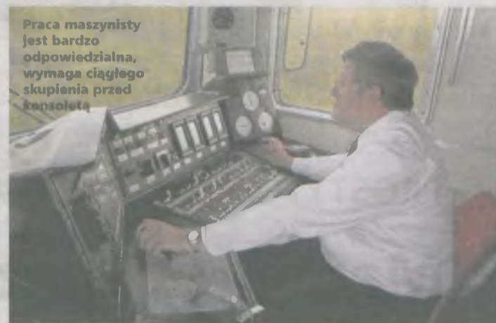
Praca maszynisty jest bardzo odpowiedzialna, wymaga ciągłego skupienia przed konsolą