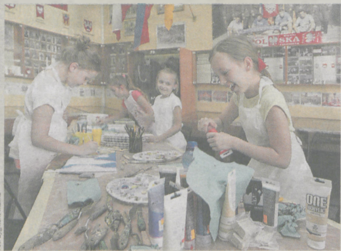
Fot. Zygmunt Malina