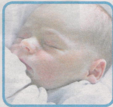
WOJCIECH URBANIAK Z GÓRY ur. 17 czerwca o godz. 18.20 waga 3.150 g, wzrost 53 cm