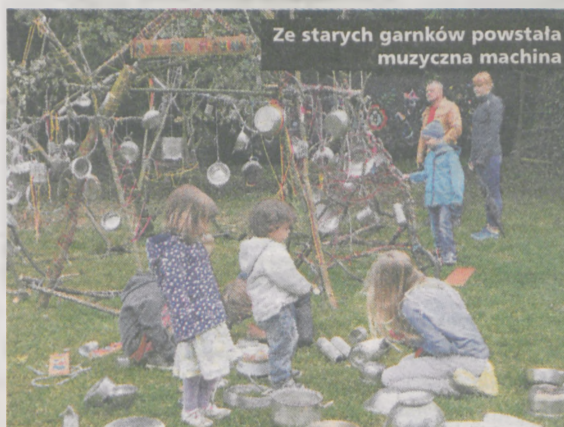
Ze starych garnków powstała muzyczna machina