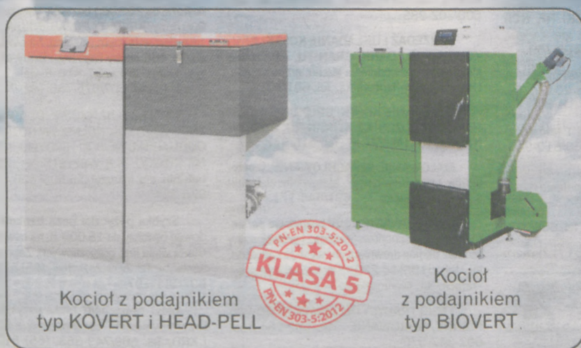
Kocioł z podajnikiem typ KOVERT i HEAD-PELL

509 737 732 Jesteśmy do Twojej dyspozycji