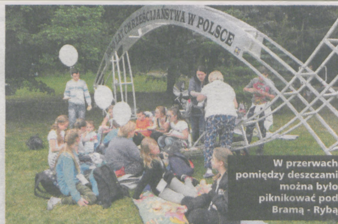
W przerwach pomiędzy deszczami można było piknikować pod Bramą - Rybą