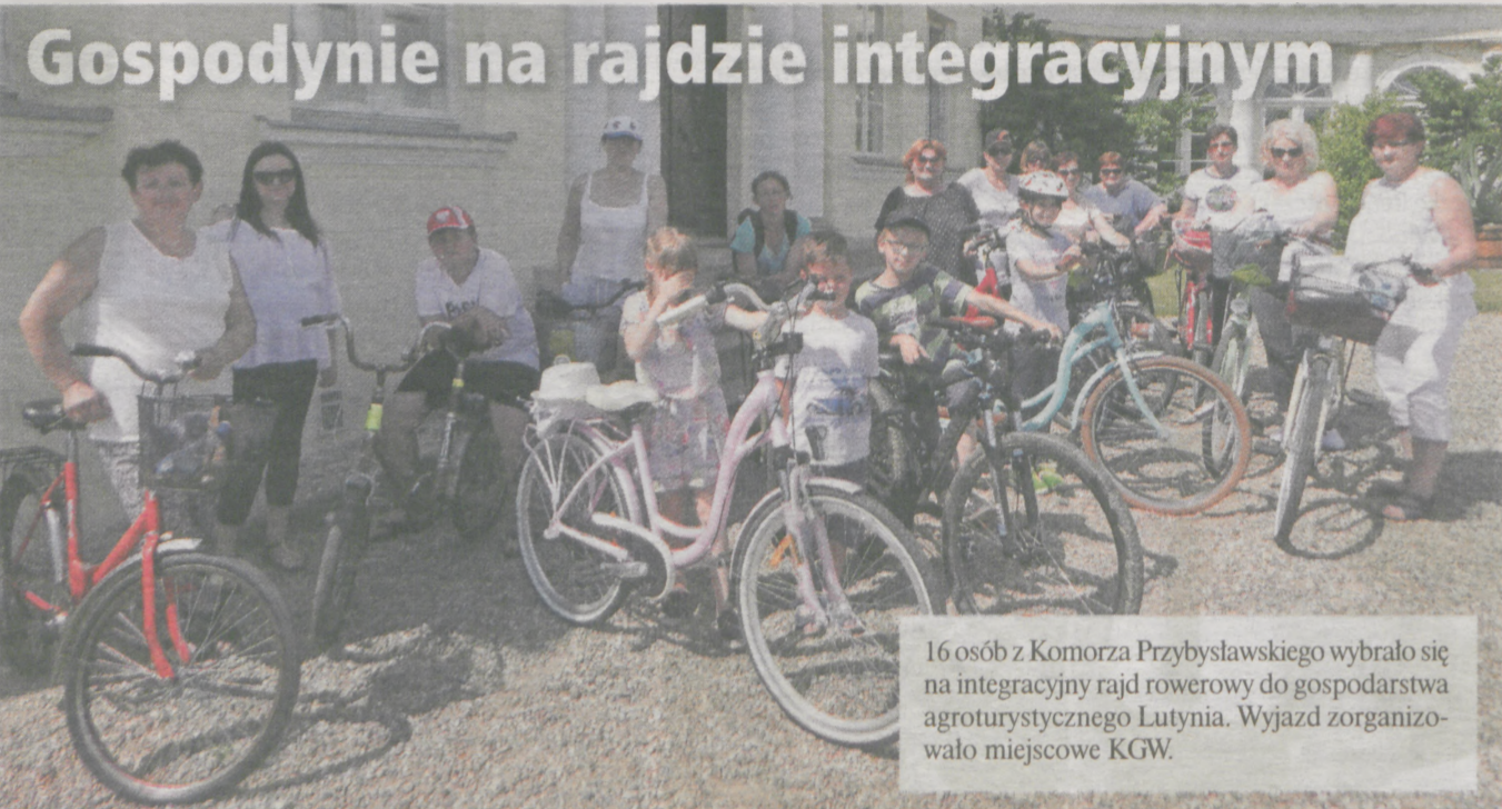
16 osób z Komorza Przybysławskiego wybrało się na integracyjny rajd rowerowy do gospodarstwa agroturystycznego Lutynia. Wyjazd zorganizowało miejscowe KGW.