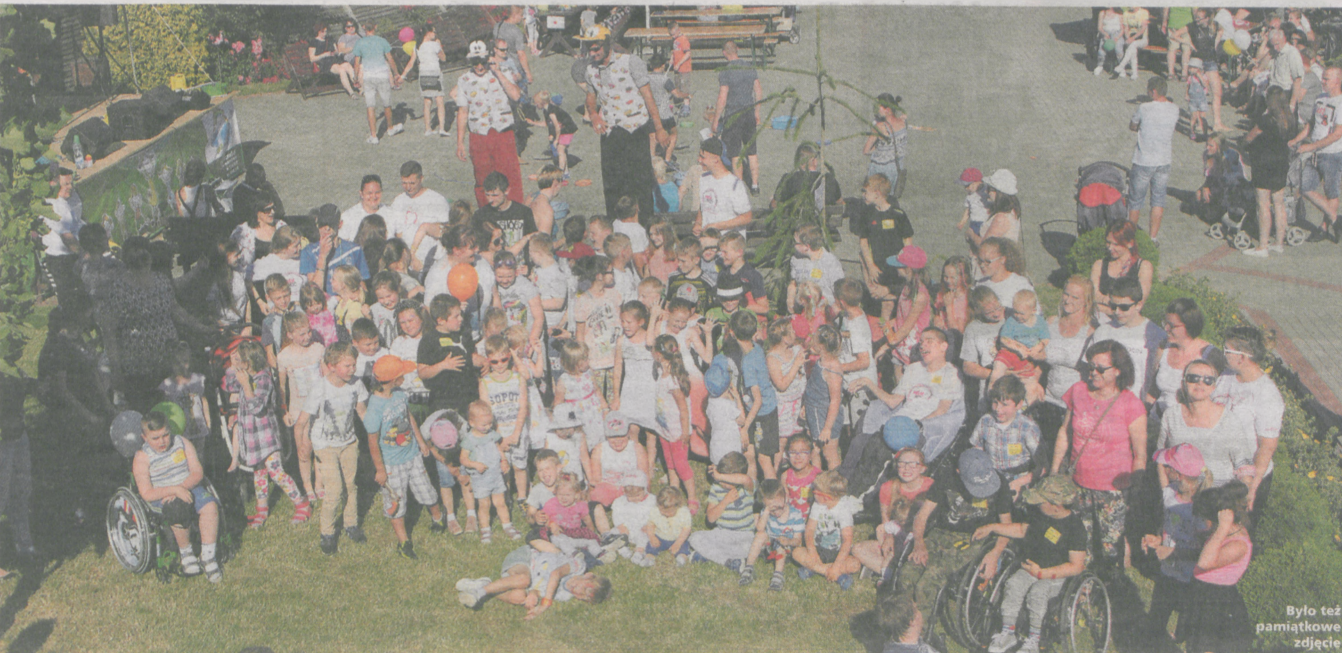
Było też pamiątkowe zdjęcie