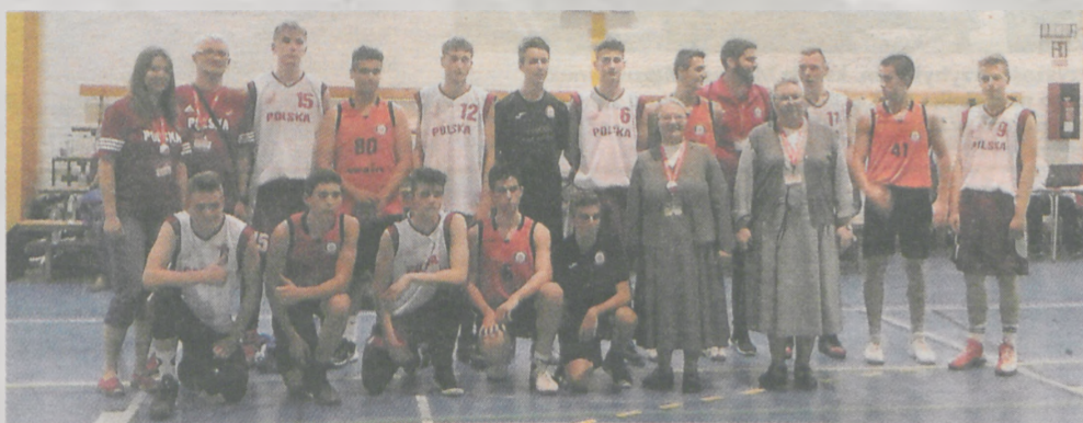
W Igrzyskach w Seville brała udział młodzież z 14 państw, m.in. reprezentacja Polski