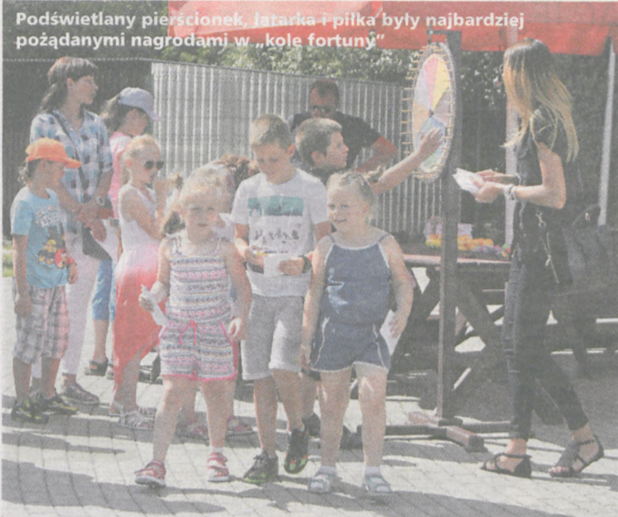
Podświetlany pierścionek, Jatkarka + piłka były najbardziej pożądanymi nagrodami w „kole fortuny”