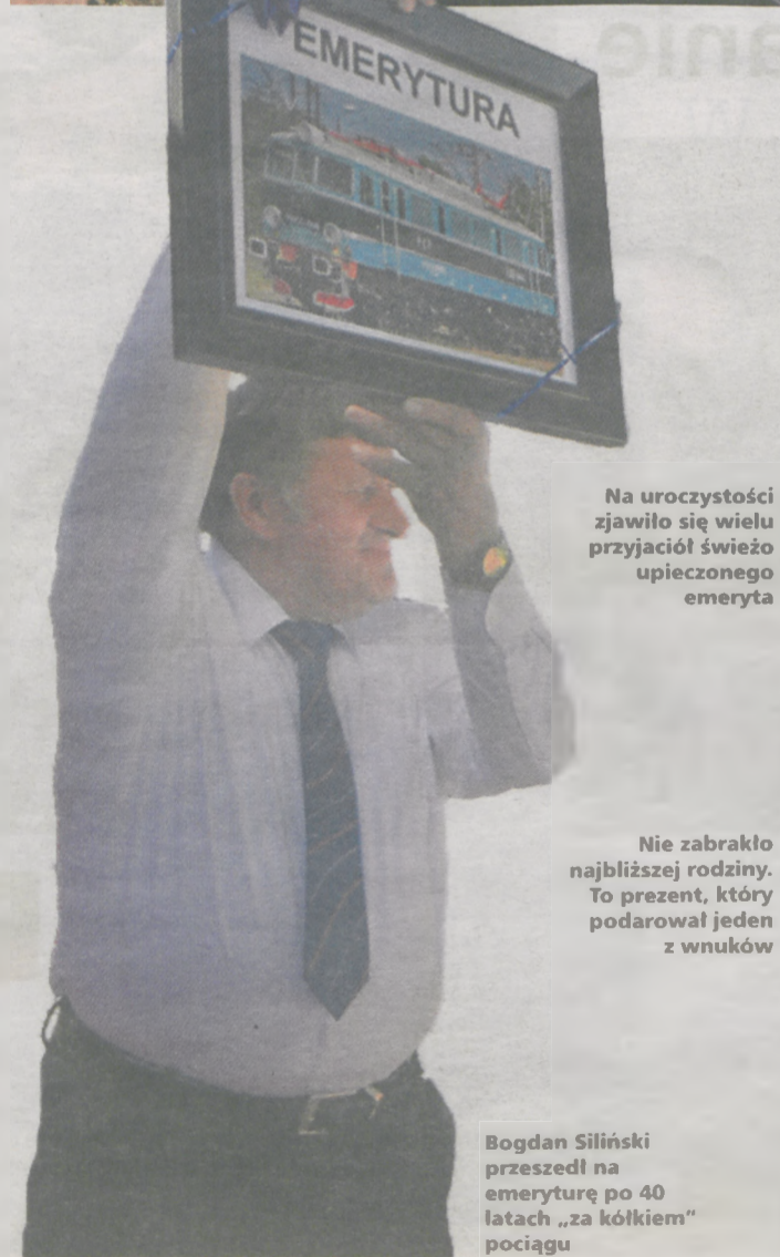
Na uroczystości zjawili się wielu przyjaciół świeżo upieczony emeryta