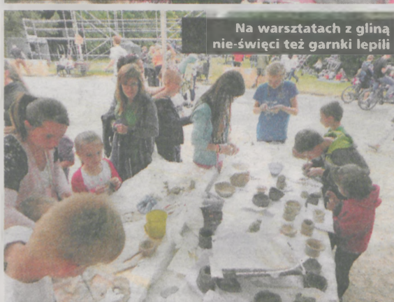
Na warsztatach z gliną nie-święci też garnki lepili

Ta opowieść to kilkadziesiąt różnych warsztatów, kilkanaście koncertów, dwie wystawy, ale i kilkaset bułek, parówek, porcji jajeczniczy. To także glina, farby i ubrudzone ubrania, a nawet wata cukrowa, do której stała kolejka z patykami znalezionymi na terenie parku i muzyczna machina zbudowana z niepotrzebnych garnków oraz starych sprzętów kuchennych. Był to jednak także czas modlitwy i wielu ważnych słów, które zostały wypowiedziane nie tylko w kościele, podczas codziennych mszy św., ale również ze sceny. Dużo trudnych tematów takich jak samotność, odrzucenie, bezdomność, głód, wojny, ale i uświadomienie, że każdy może próbować zmienić ten świat drobnymi gestami życzliwości spotkaniem, rozmową.