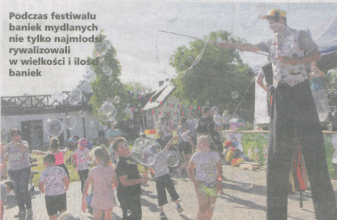
Podczas festiwalu baniek mydlanych nie tylko najmłodsi rywalizowali w wielkości i ilości baniek