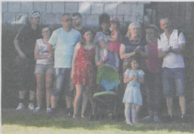
Nie zabrakło także mieszkańców wioski