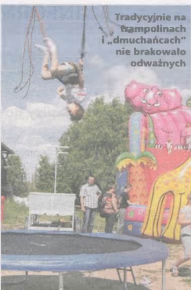
Tradycyjnie na trampolinach i „dmuchańcach” nie brakowało odważnych