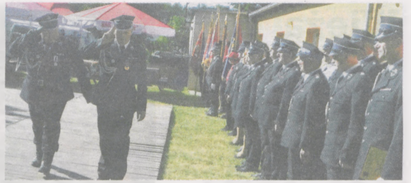
Przed główną częścią uroczystości odbył się oficjalny przegląd