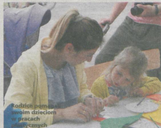
Rodzice pomagali swoim dzieciom w pracach plastycznych