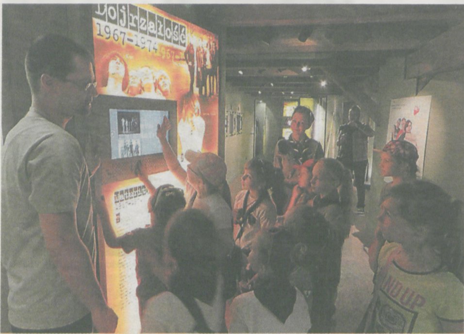
Zajęcia edukacyjne w Spichlerzu Polskiego Rocka cieszą się dużym zainteresowaniem wśród dzieci i młodzieży