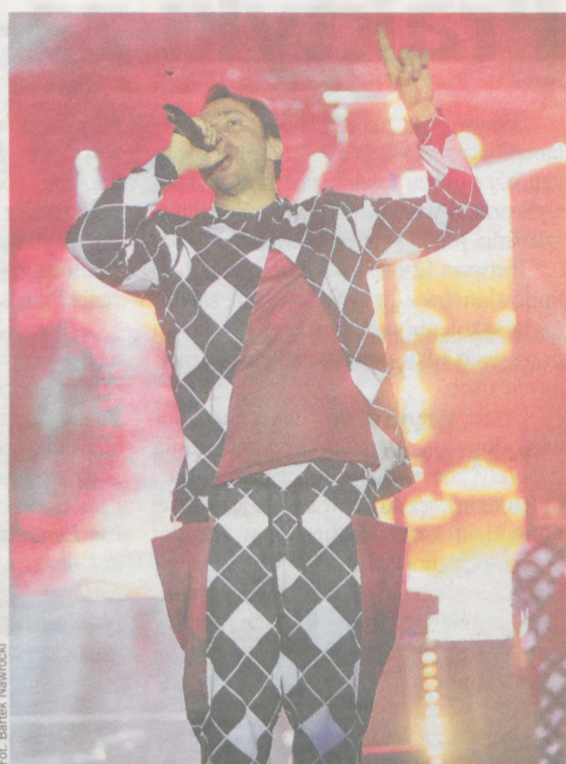
Fot. Bartek Nawrocki