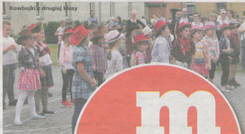
Kowbojki z drugiej klasy