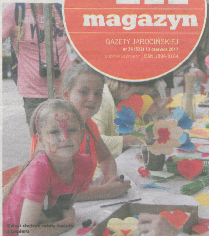
Dzieci chętnie robiły kwiatki z papieru

nr 24 (522) 13 czerwca 2017 CENY BEZPŁATNY | ISSN 1896-8104