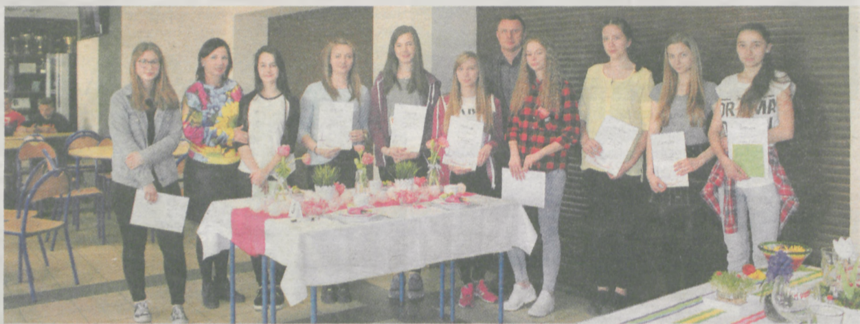
Uczestnicy konkursu, a przed nimi najlepiej nakryty stół