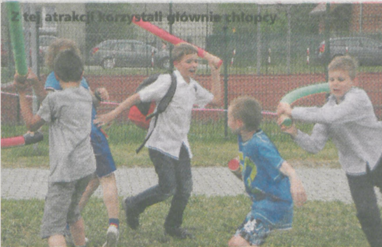
Z tej atrakcji korzystali głównie chłopcy