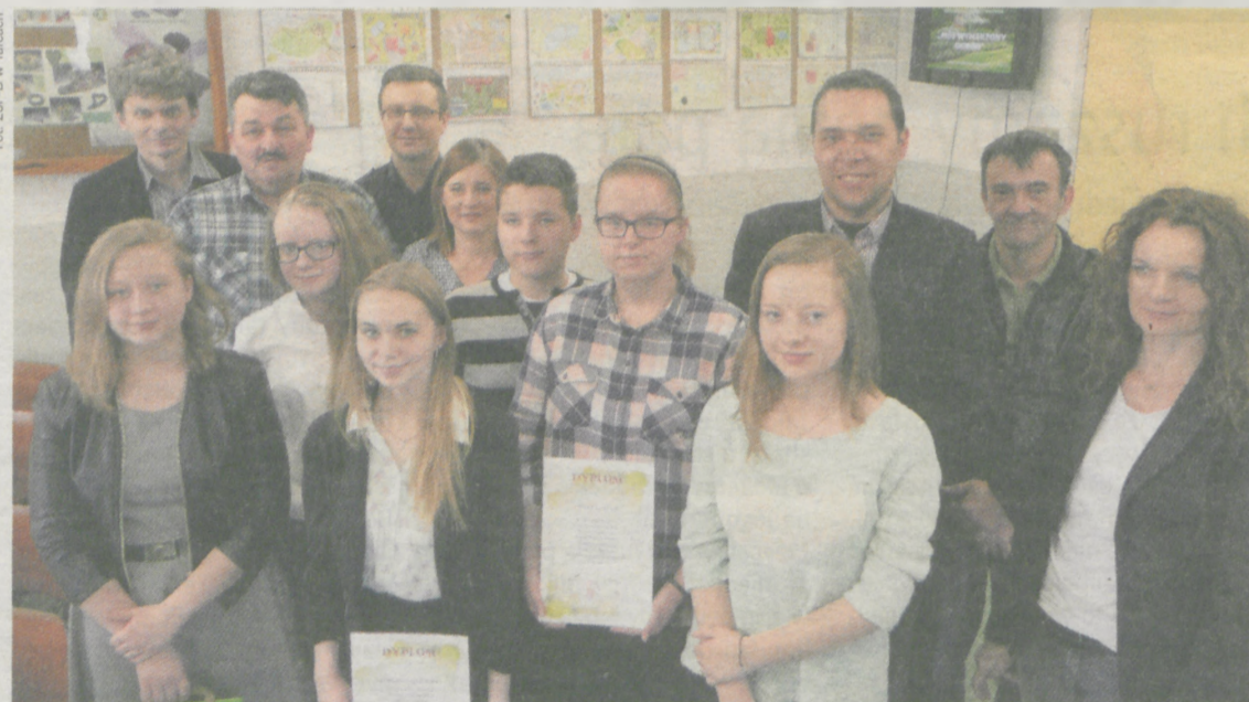
Wręczenie dyplomów, nagród i wyróżnień odbyło się w szkole w Tarcach