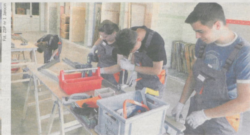
W czasie dwutygodniowego pobytu w Niemczech uczniowie zajmują się zabudową suchą, termoizolacją fasad budynków, poznają różnego rodzaju sposoby mocowania, cięcia, obrabiania i wykańczania ścian za pomocą różnego rodzaju materiałów budowlanych