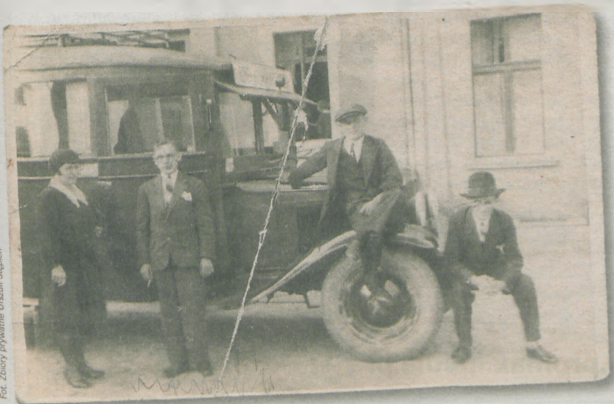
Jej tata miał taksówkę - taką jak na zdjęciu