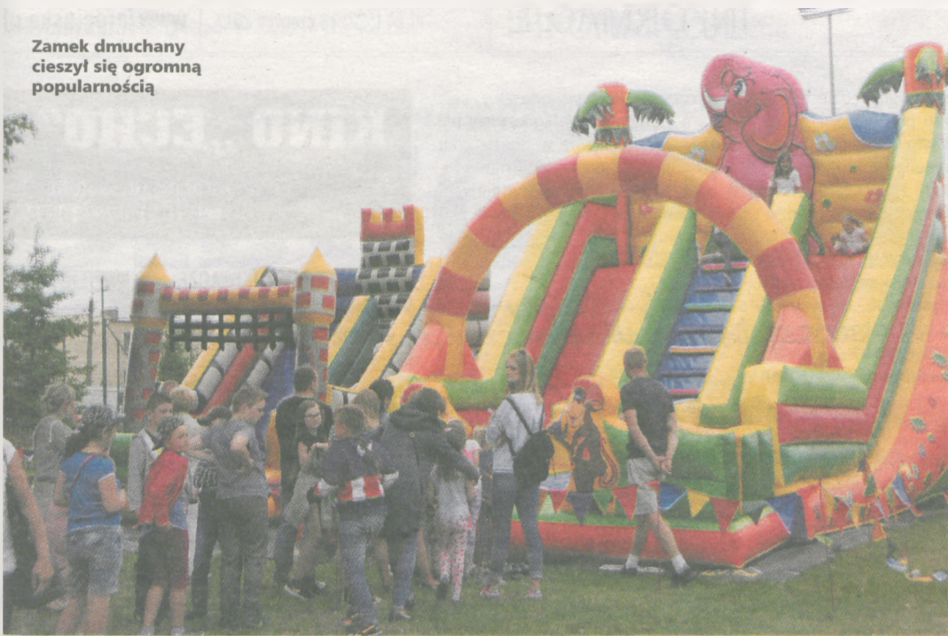
Zamek dmuchany cieszył się ogromną popularnością