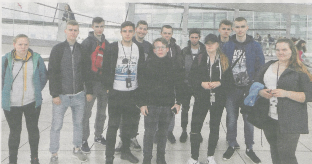
Grupa praktykantów z Jarocina miała okazję zwiedzić Poczdam i Berlin