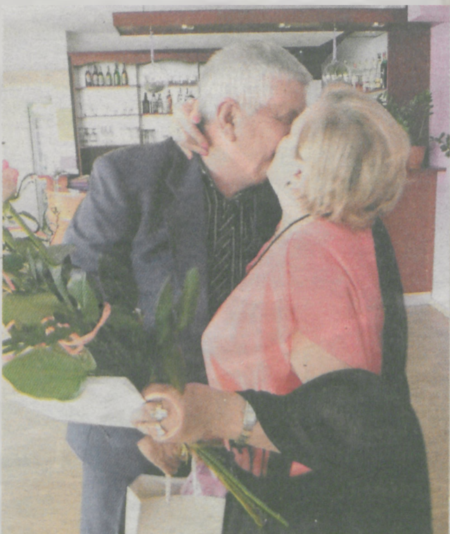
Jak jubilaci odpowiedzi na gromkie okrzyki z sali: - Gorzko! Gorzko!