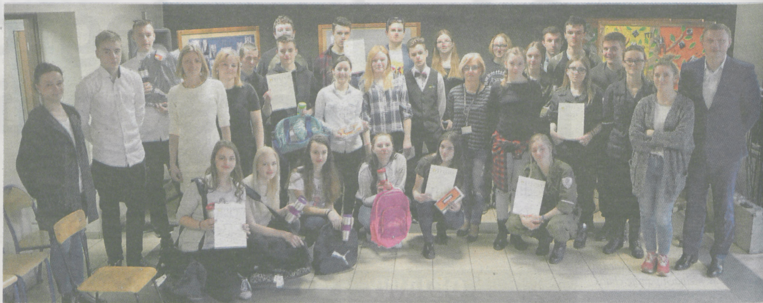
Wszyscy startujący otrzymali dyplomy i nagrody ufundowane przez Starostwo Powiatowe w Jarocinie oraz radę rodziców