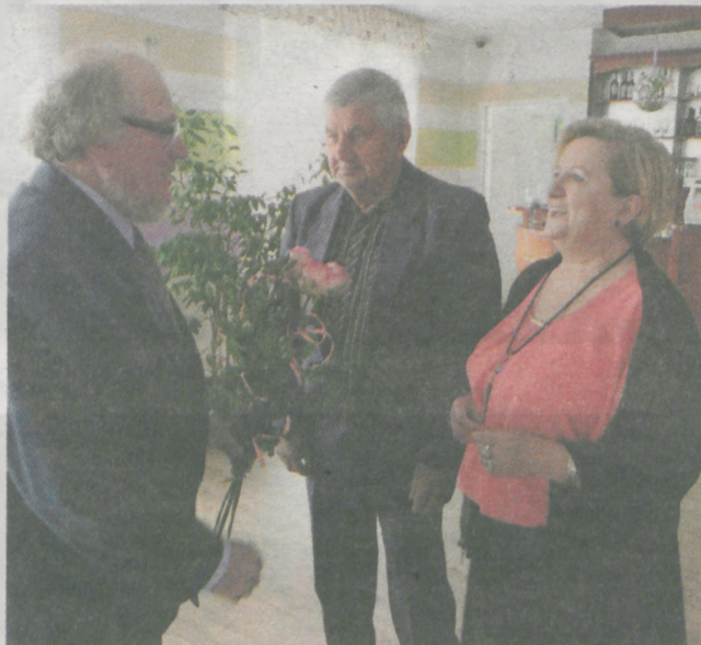
Przewodniczący składa życzenia jubilatkom