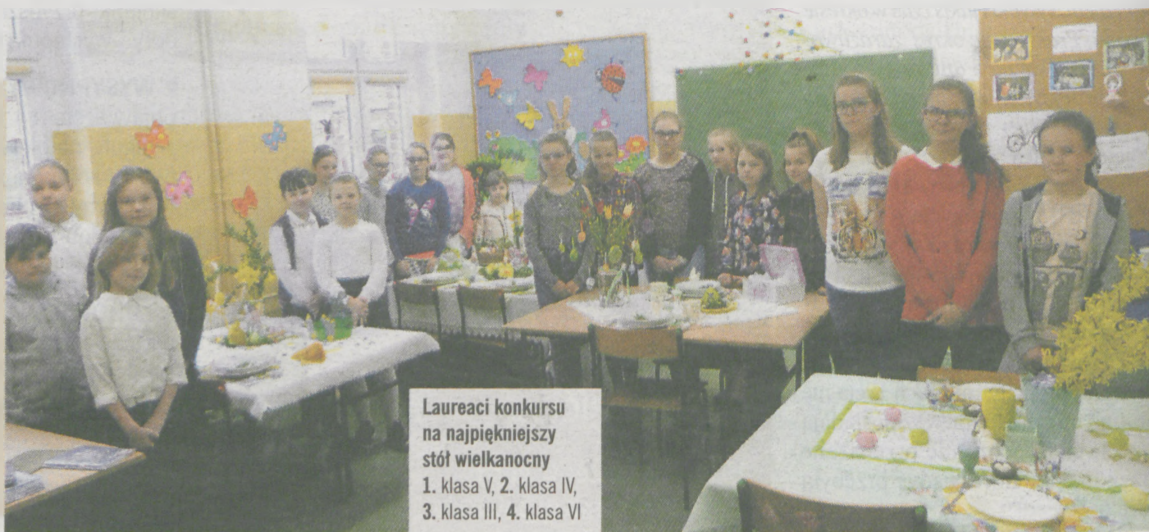
Laureaci konkursu na najpiękniejszy stół wielkanocny 1. klasa V, 2. klasa IV, 3. klasa III, 4. klasa VI

Ich zadaniem było nakrycie i udekorowanie stołu według własnego pomysłu. Wykonali też klasowe palmy, które zostały zawieszane na konkurs na najpiękniejszą palmę wielkanocną zorganizowany przez proboszcza parafii Dębno ks. Jacka Tosia. Później dostarczono je do kaplicy w Chrzanie - tam w Niedzielę Palmową delegacje uczniów z klas III-VI uczestniczyły w uroczystej procesji. W szkole odbył się również kiermasz ozdób wielkanocnych. Można było podziwiać, a także zakupić prace rodziców i dzieci. Oprac. (akf)