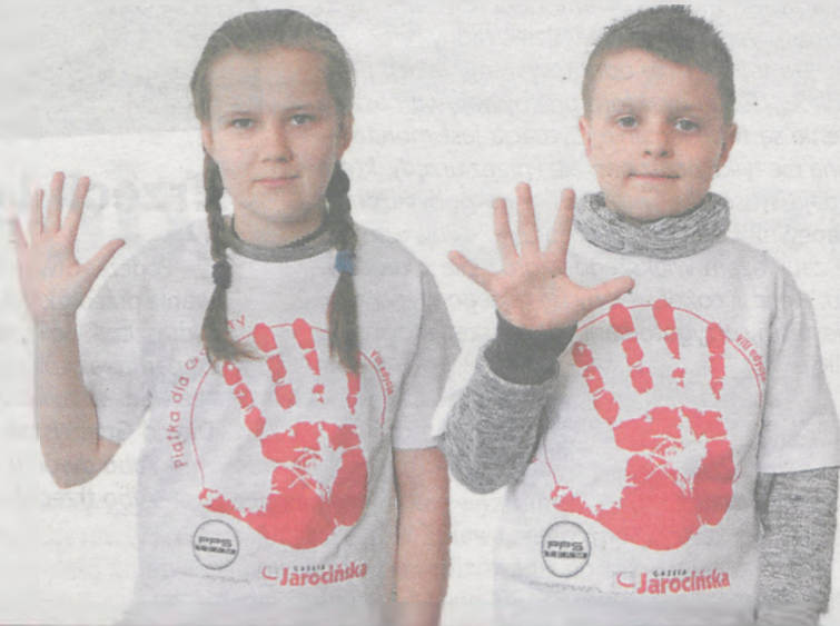
Magda Mańkowska SP w Kotlinie