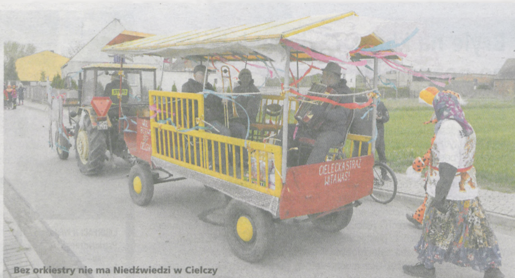
Bez orkiestry nie ma Niedźwiedzi w Cielczy