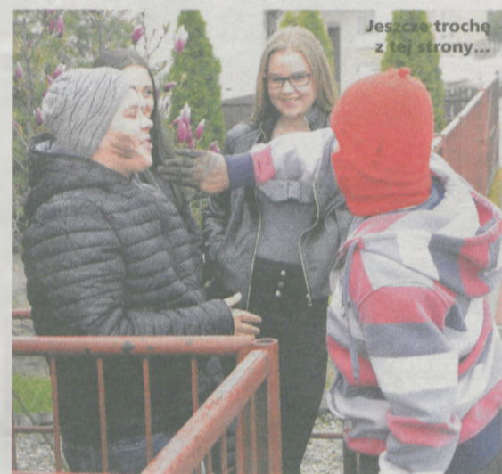
Jeszcze trochę z tej strony...