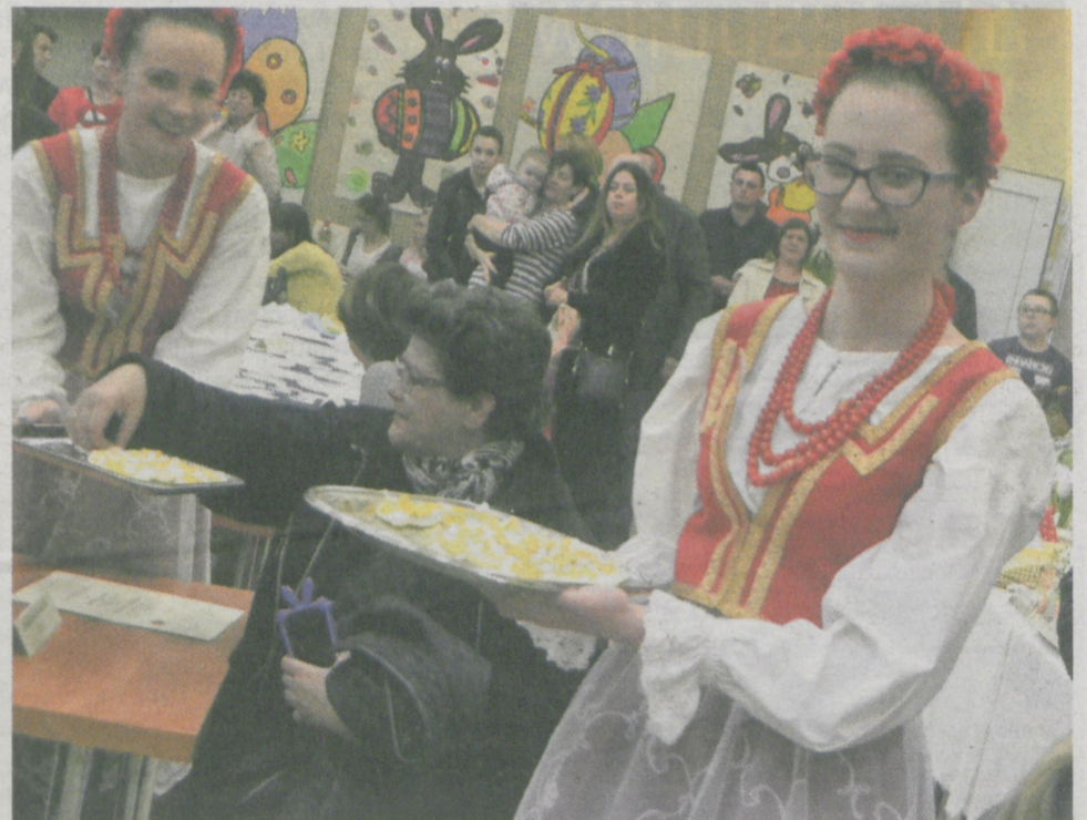
Nie mogło zabraknąć wspólnego dzielenia się jajkiem