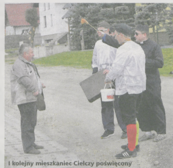
I kolejny mieszkaniec Cielczy poświęcony

Uczestnicy zabawy sami zadbali o muzykę. Na przyczepie ciągnika będącej - jak wskazywała nazwa - „wozem bojowym OSP Cielcza” zasiadała kilkuosobowa orkiestra. Młodzież czasami wtrącała jednak swoje kawalki. W tym roku popularnością cieszyło się disco polo. Nie brakowało też osób, które w deszczu czekały przy drodze, żeby zrobić sobie zdjęcie z przebierańcami.