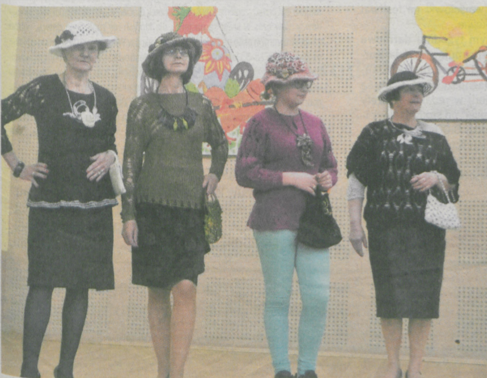
Odbył się także pokaz mody rękodzielniczej