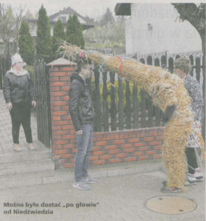
Można było dostać „po głowie” od Niedźwiedzia

Już dzisiaj czekamy na Wasze zdjęcia z pochodu Niedźwiedzi! Wystarczy wysłać je na adres e-mail: niedzwiedzie@jarocinska.pl lub od wtorku przynieść do redakcji „Gazety Jarocinskiej” i portalu jarocinska.pl (Jarocin, ul. Kasprzaka 1a) na nośniku cyfrowym. Zabawa trwa do godz. 12.00 dnia 21 kwietnia (piątek). Szczegóły i regulamin znajdują się na portalu jarocinska.pl .