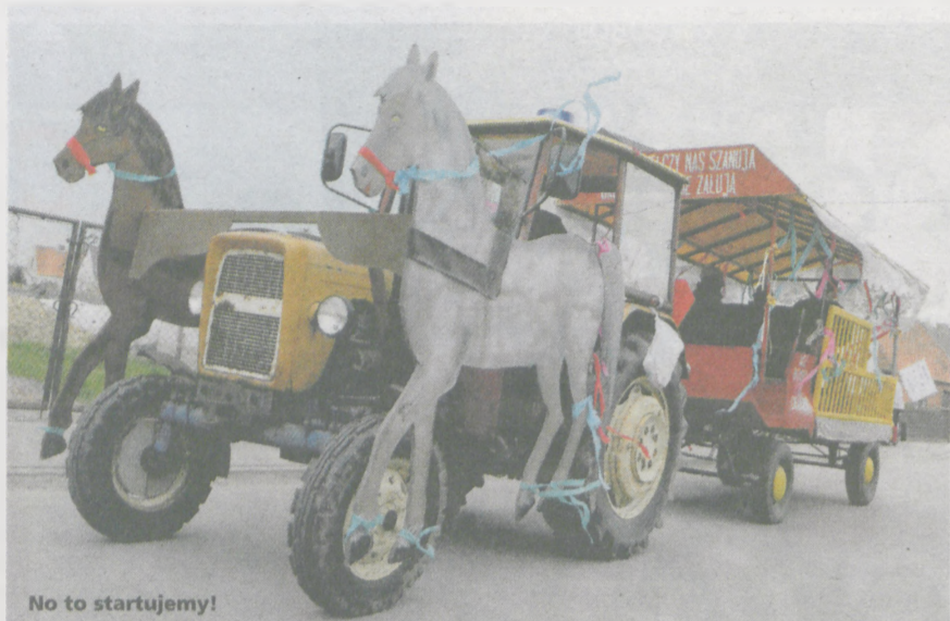
No to startujemy!