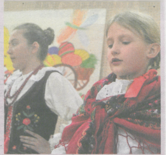
Podczas imprezy wystąpił zespół Noskowiacy