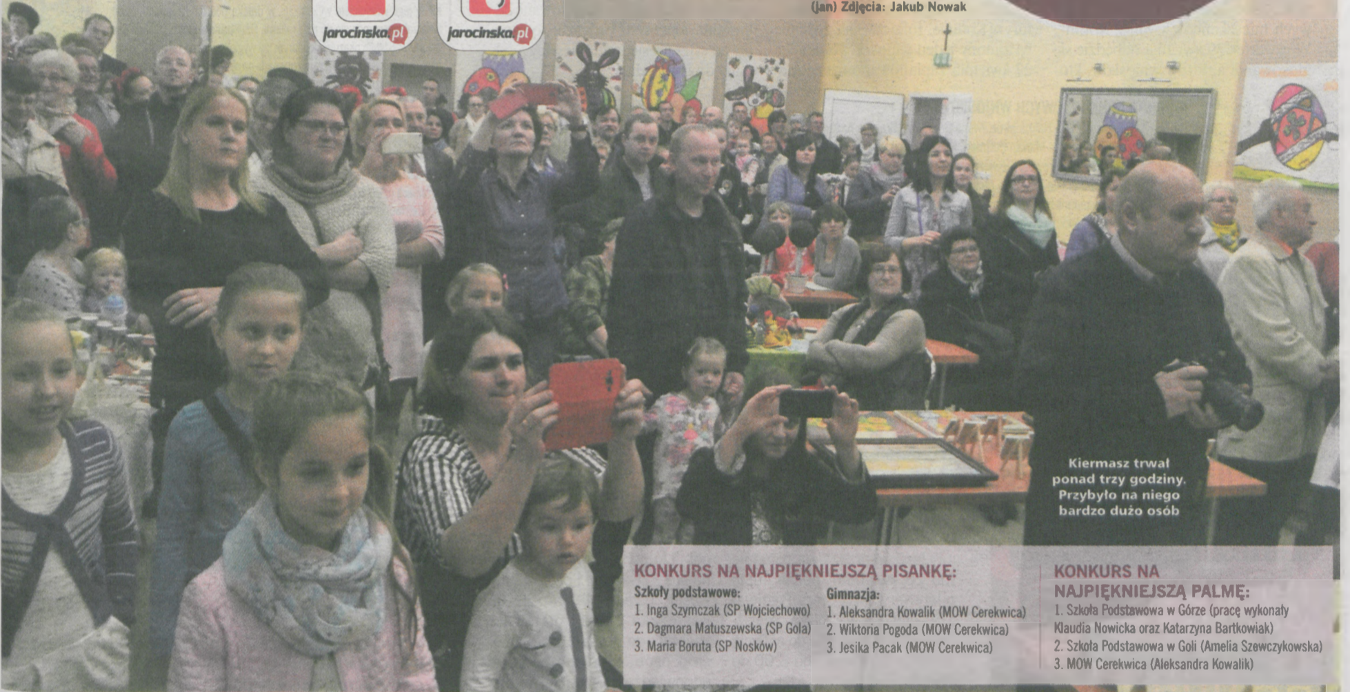
Kermasz trwał ponad trzy godziny. Przybyło na niego bardzo dużo osób