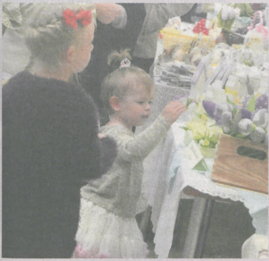
Rękodzieło przyciągało także najmłodszych