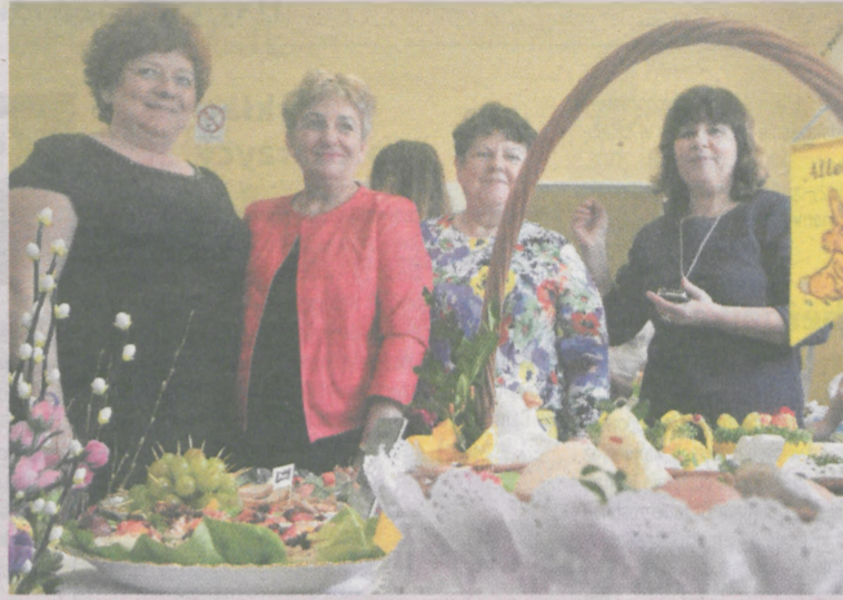
Na stoiskach wystawiły się m.in. Koła Gospodyń Wiejskich