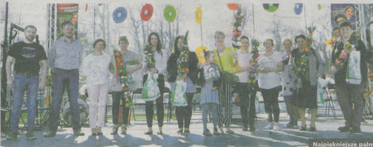
Najpiękniejsze palmy zostały nagrodzone