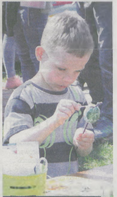
W kreatywnym kąciku

Imprezę zorganizowały Starostwo Powiatowe w Jarocinie oraz Fundacja Wsparcia i Rozwoju „Antrejka”. (akf)