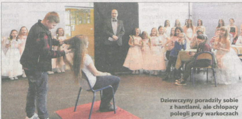
Dziewczyny poradziły sobie z hantlami, ale chłopcy polegli przy warkoczach