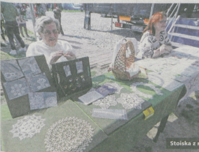
Stoiska z rękodziełem