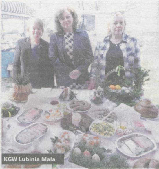
KGW Lubinia Mała