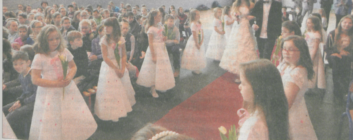
Pokaz, jak na prawdziwą imprezę modową przystało, zwiędziały suknie ślubne