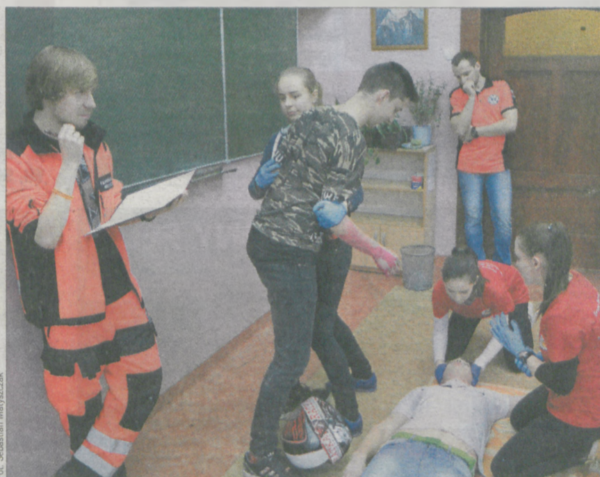
Ratowanie nastolatka pod wpływem dopalaczy było jednym z najtrudniejszych zadań

III. Centrum Kształcenia Zawodowego i Ustawicznego w Środzie Wielkopolskiej 72 pkt.