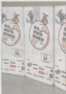
Do takich puszek będą zbierane pieniądze

25 i 26 marca (w sobotę i niedzielę) na terenie powiatu jarocińskiego oraz gminy Nowe Miasto wolontariusze będą zbierać do oznakowanych puszek pieniądze. Każdy wolontariusz będzie miał identyfikator.