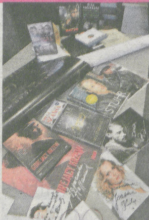
UPOMINKI OD GWIAZD FILMU