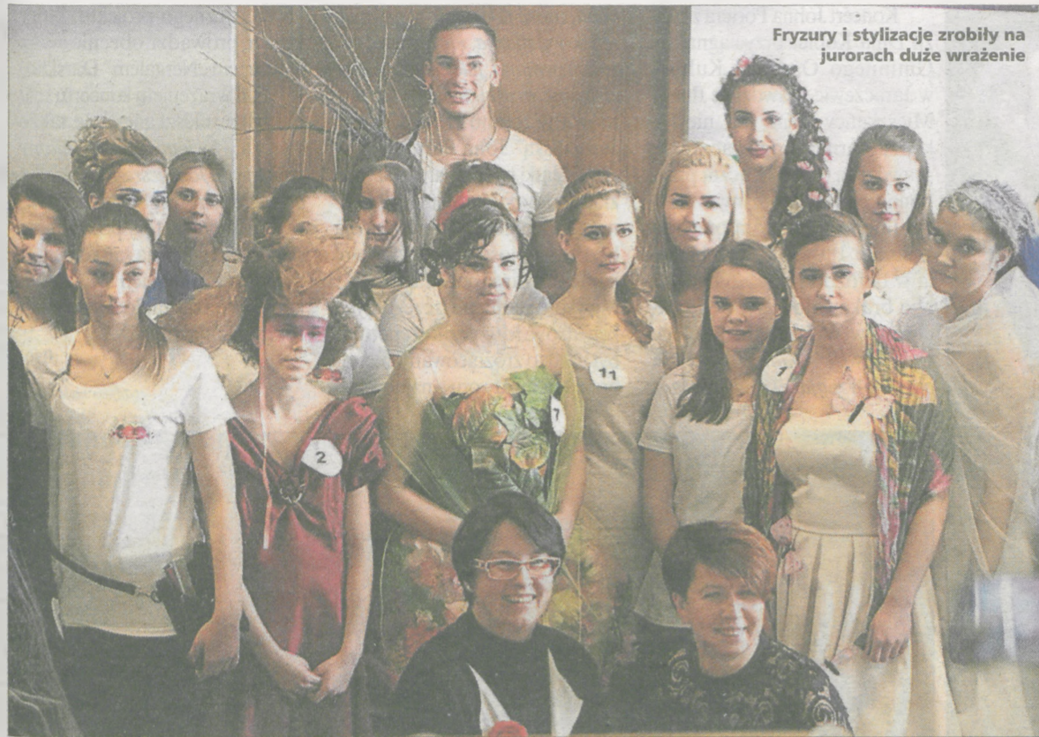
Fryzury i stylizacje zrobiły na jurorach duże wrażenie