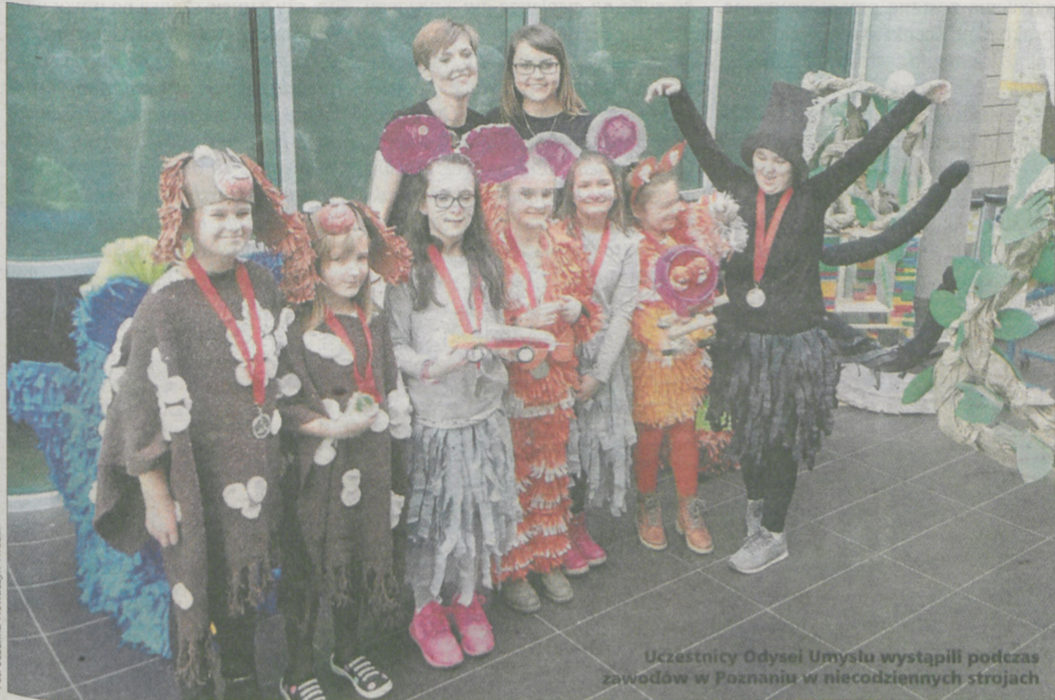
Uczestnicy Odysei Umysłu wystąpili podczas zawodów w Poznaniu w niecodziennych strojach