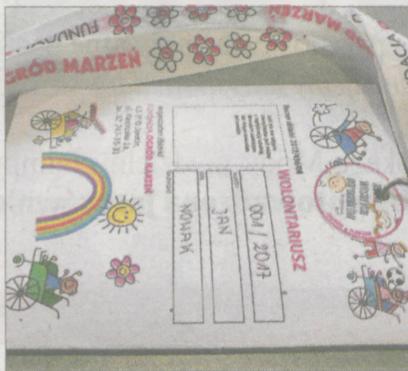
Taki identyfikator musi mieć wolontariusz