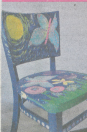
DZIEŁA EWY HEJDUK: KRZESŁO, KOSZULKI