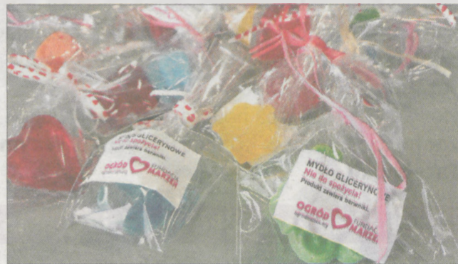
Osoby, które wrzucą papierowy pieniążek mogą otrzymać takie piękne, kolorowe mydelka, które zrobili podopieczni fundacji, ich rodzice i wolontariusze.