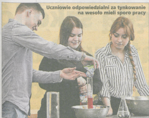
Uczniowie odpowiedzialni za tynkowanie na wesoło mieli sporo pracy