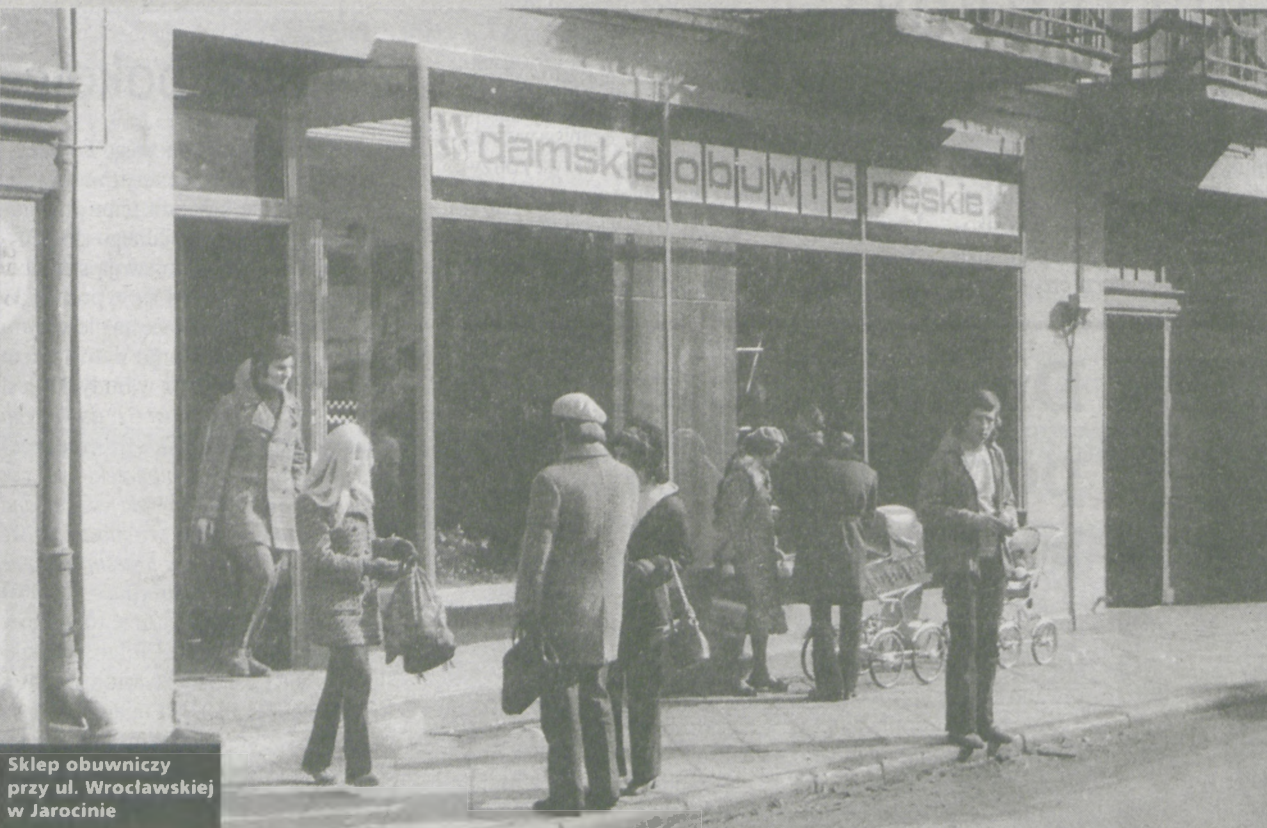
Sklep obuwniczy przy ul. Wrocławskiej w Jarocinie