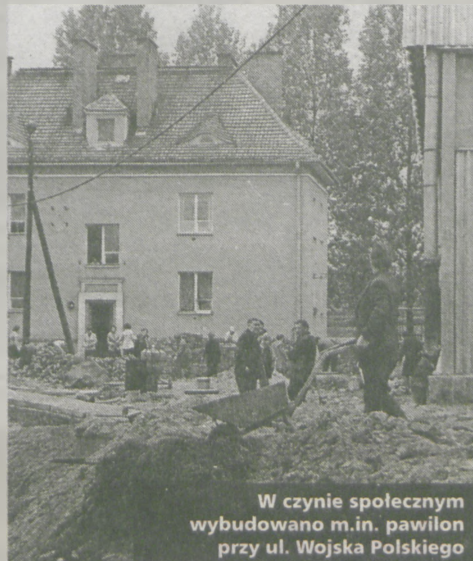
W czynie społecznym wybudowano m.in. pawilon przy ul. Wojska Polskiego

Od 1981 roku zaczęły obowiązywać kartki na mięso, a następnie na masło, mąkę, kasze, ryże, proszek do prania, a nawet papier toaletowy. Po wprowadzeniu stanu wojennego - 13 grudnia 1981 roku - na kartki można było kupić czekoladę, alkohol, papierosy. Trzeba zaznaczyć, że posiadanie kartek nie gwarantowało możliwości dokonania zakupów.