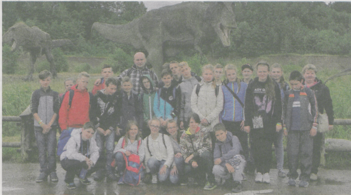
(akf) Dwa lata temu klasa VI ze Szkoły Podstawowej w Goli zwiedziła Wrocław i niezwykle jurajski park w Krasiejowie