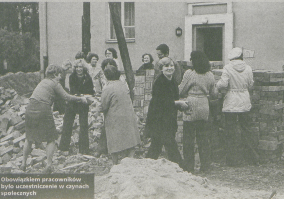
Obowiązkiem pracowników było uczestniczenie w czynach społecznych