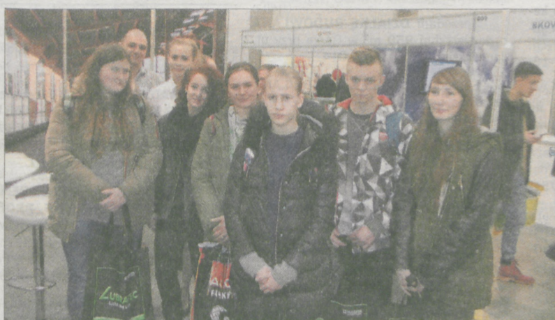
Uczniowie ZSP-B w Tarcach przyjechali z Łodzi z pokazną dawką wiedzy