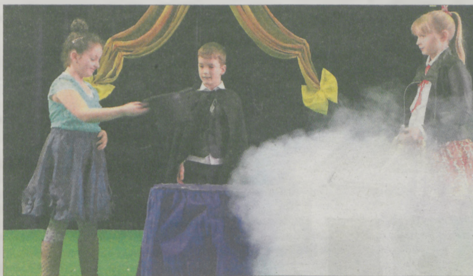
Dzieci okazały się specjalistami w robieniu magicznych sztuczek