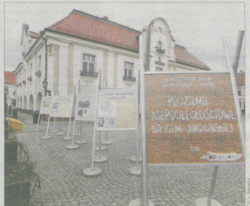
Ekspozycję można oglądać do końca kwietnia