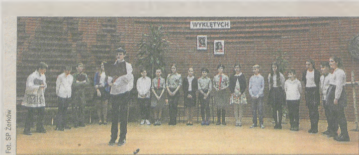
Uczniowie szóstej klasy z dużym zaangażowaniem uczestniczyli w przygotowaniu a potem w samym przedstawieniu