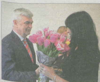
Zwycięzcy naszej zabawy dostali także bukiet kwiatów