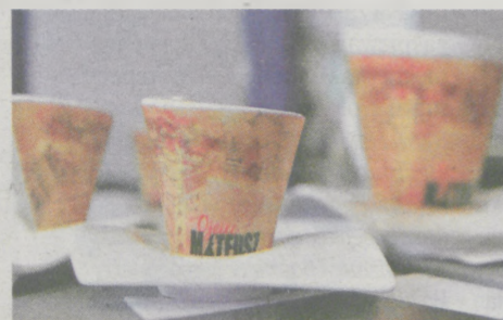
Dzień na planie filmowym serialu „Ojciec Mateusz” oraz filmowe kubki i filiżanki