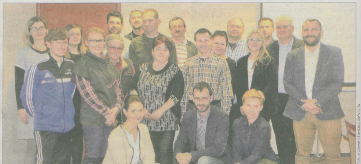
Przedstawiciele lokalnych drużyn w gminie Żerków

► Żerkowska Fundacja „Zerknij Tu” otrzymała ministerialne dofinansowanie, dzięki któremu uda się zrealizować w gminie aż 15 różnych inicjatyw. Turniej piłkarski, warsztaty cyrkowe, szkoła rocka - to tylko kilka z pomysłów.