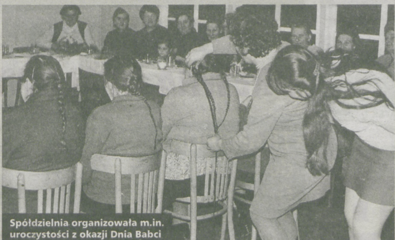
Spółdzielnia organizowała m.in. uroczystości z okazji Dnia Babci

...żyć się w ciepłe posiłki regeneracyjne, kupić ...śniadanie, wypić kawę czy herbatę. W okresie ...biał wielkanocnych i bożonarodzeniowych orga- ...nizowane były pokazy wyrobów garmazeryjnych. ...Zakłady starały się sprowadzić towar dla swoich ...pracowników, a pracownicy spółdzielni pomagali ...w ich rozdzielaniu. Do punktów docierały takie ...deficytowe wyroby jak np. kawa w ziarnach czy ...„tamane” papierosy, które sprzedawane były na ...wagę.