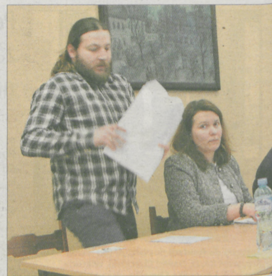
Spóźnialski radny na sesję dotarł w ostatniej chwili