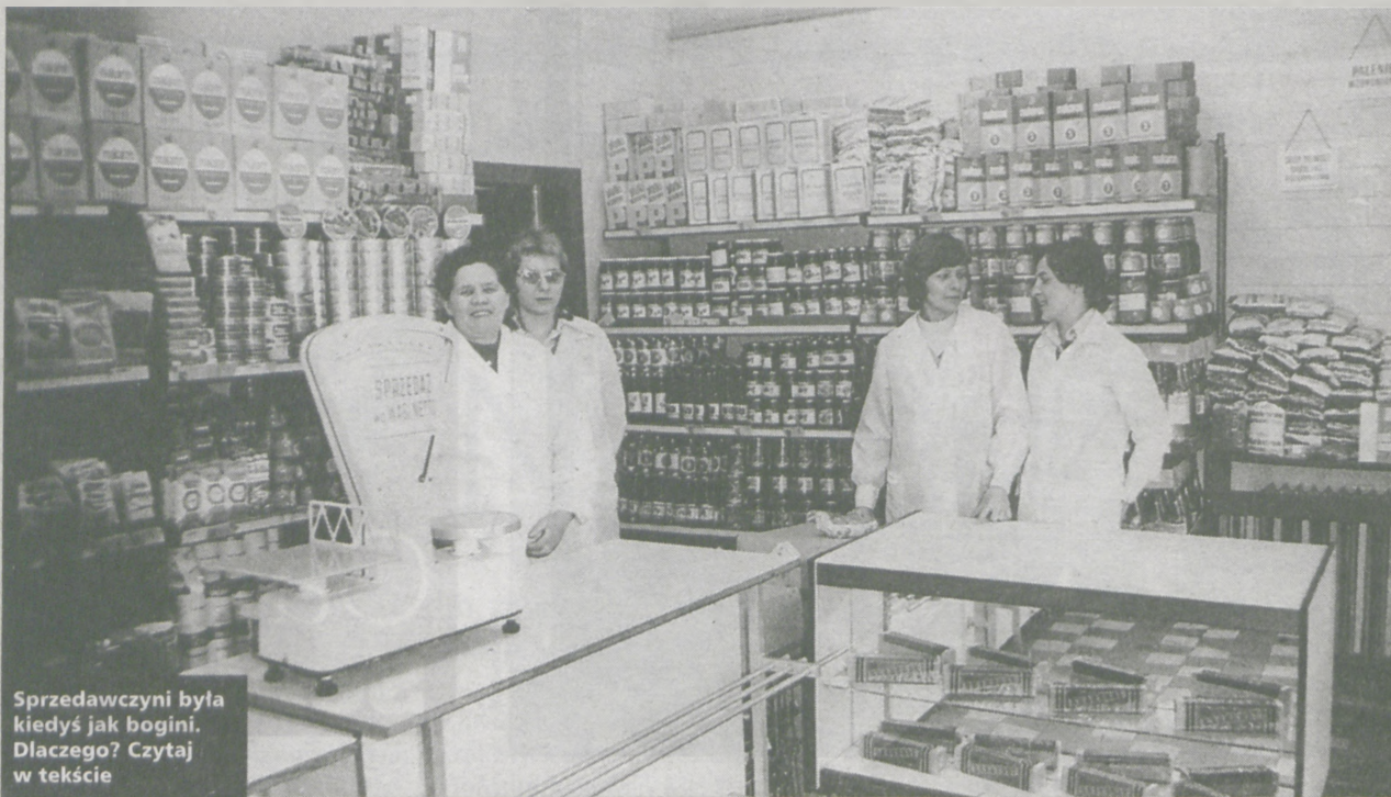
Sprzedawczynie były kiedyś jak bogini. Dlaczego? Czytaj w tekście