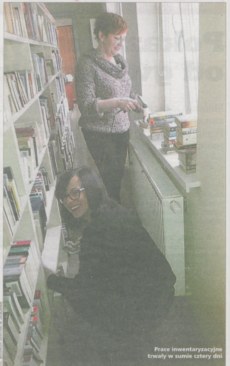
Prace inwentaryzacyjne trwały w sumie cztery dni