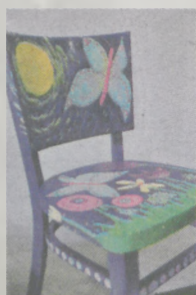
Dziela Ewy Hejduk: krzesło, koszulki