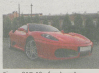
Firma CAR-AS ufundowała przejażdżkę Ferrari (30 minut jako pasażer)