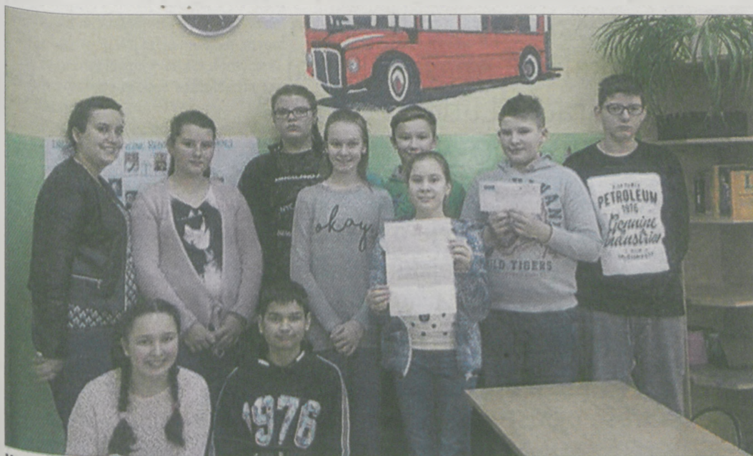
Uczniowie szkoły w Potarzysty nie kryli radości z otrzymanego listu

W ramach zajęć języka angielskiego uczniowie Szkoły Podstawowej w Potarzysty wysłali kartę z życzeniami bożonarodzeniowymi i noworocznymi do Królowej Elżbiety II.