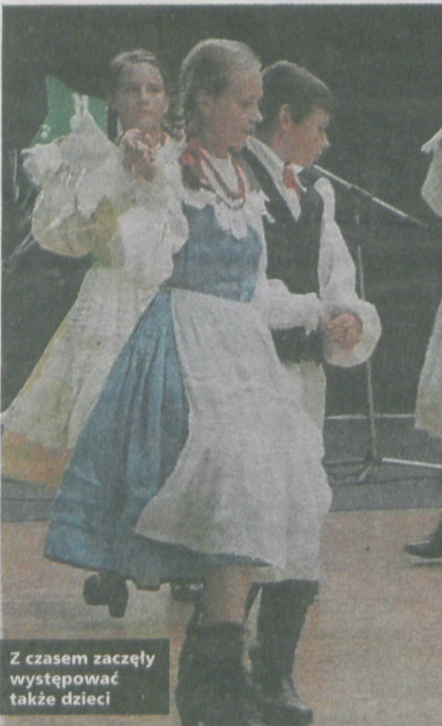
Z czasem zaczęły występować także dzieci