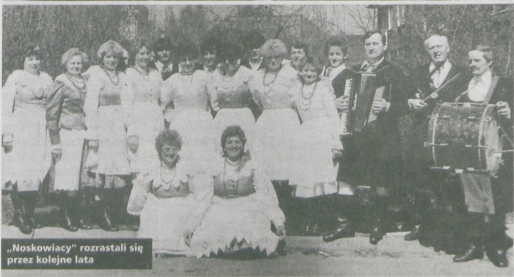
„Noskowiacy” rozrastali się przez kolejne lata