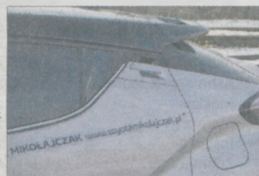
Nietypowo umiejscowiona klamka tylnych drzwi ma wielu przeciwników. Mnie jednak takie rozwiązanie odpowiadało

Konkurencję w swojej klasie ma jednak sporą, bo segment crossoverów