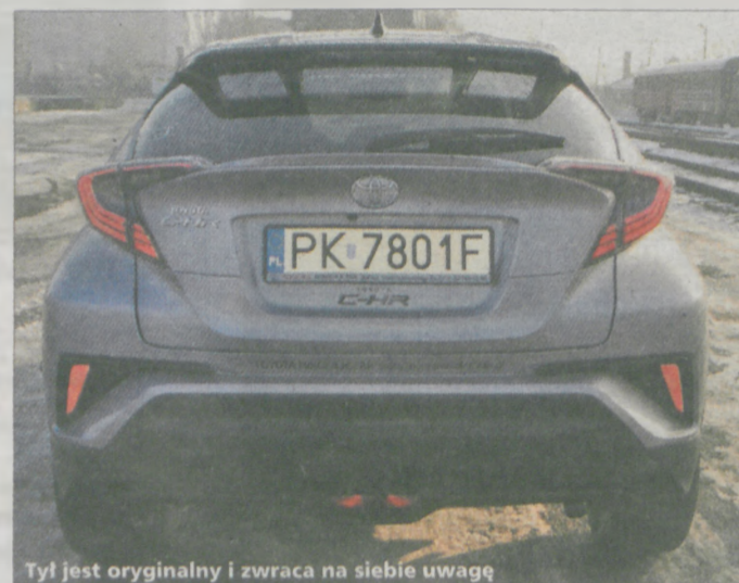
Tył jest oryginalny i zwraca na siebie uwagę