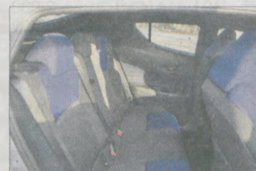
Tylne boczne szyby są nieduże