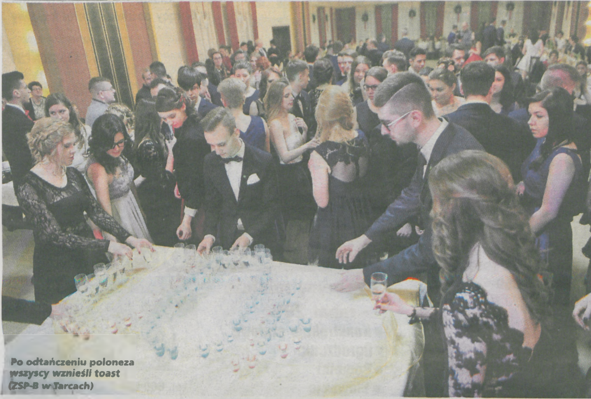
Po odtąnczeniu poloneza wszyscy wzniesli toast (ZSP-B w Tarcach)