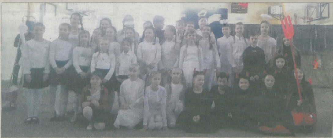
W takich strojach występowali uczniowie podczas jasełek