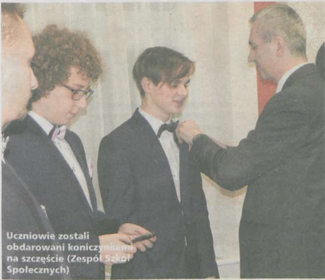
Uczniowie zostali obdarowani koniczynkami na szczęście (Zespół Szkół Społecznych)