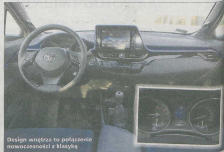
Design wnętrza to połączenie nowoczesności z klasyką