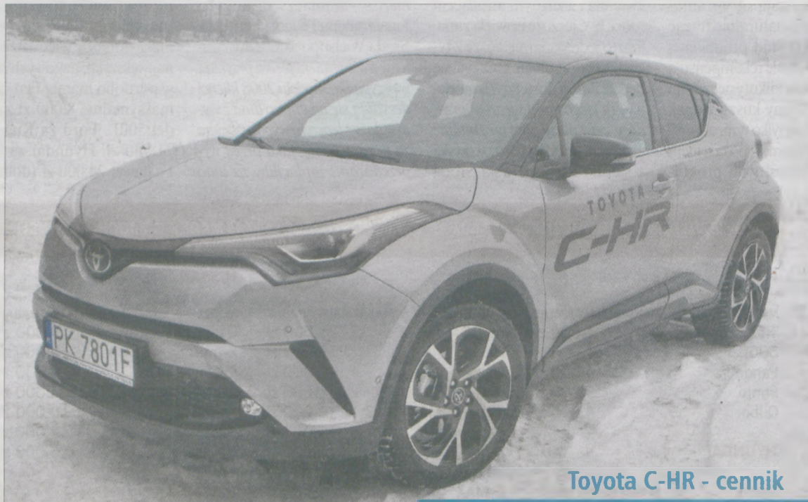
Toyota C-HR - cennik

W tym aucie wszędzie otaczają nas diamenty - to motywy przewodni, występujące w niezliczonej ilości miejsc - na drzwiach, podsufitce, w bagażniku, także przyciski na kierownicy i desce układają się w charakterystyczny kształt. Niepowtarzalnego charakteru dodaje wnętrzu niebieska linia biegnąca od drzwi kierowcy poprzez całą deskę rozdzielczą w kierunku klamki pasażera. Po zmroku wspaniale prezentowały się też wykończenia w ko-