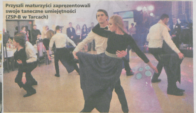
Przyszli maturzyści zaprezentowali swoje taneczne umiejętności (ZSP-B w Tarcach)