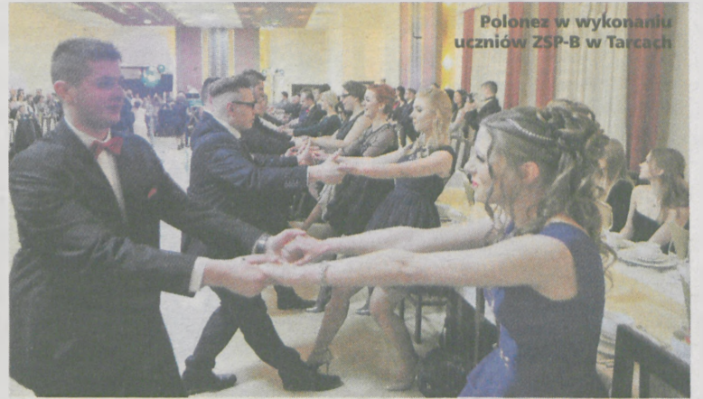
Polonez w wykonaniu uczniów ZSP-B w Tarcach

W piątek 27 stycznia będą się jeszcze bawić w Chwałęcynie uczniowie Zespołu Szkół Ponadgimnazjalnych w Nowym Mieście. (seb)