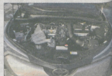
Tak prezentuje się silnik w wersji 1.2