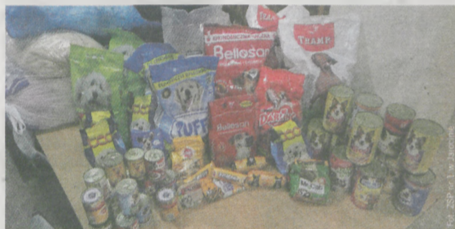
Uczniowie zebrali pokaźną ilość darów

Uczniowie Zespołu Szkół Ponadgimnazjalnych nr 1 w Jarocinie pomogli bezdomnym zwierzętom z radlińskiego schroniska. Szkoła zorganizowała przed świętami zbiórkę niezbędnych da-