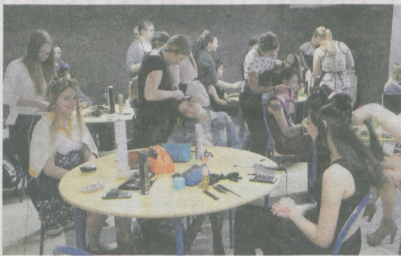
Pomysłów na karnawałowe fryzury było tyle, ilu uczestników konkursu