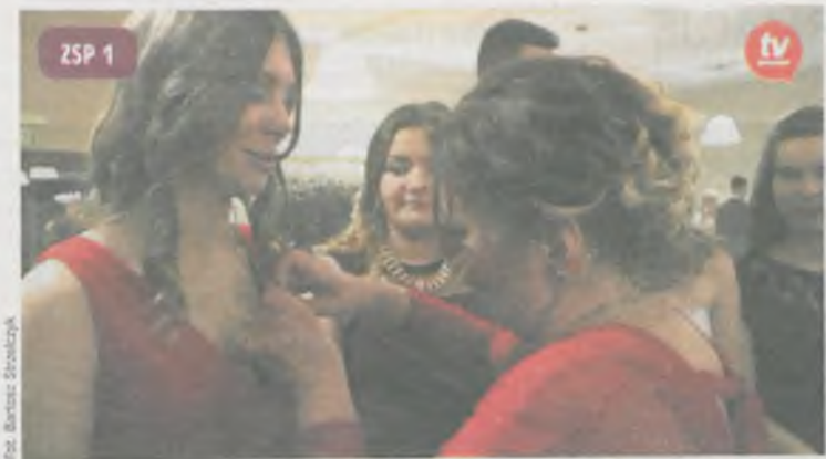
Fot. Bartek Szmalczyk