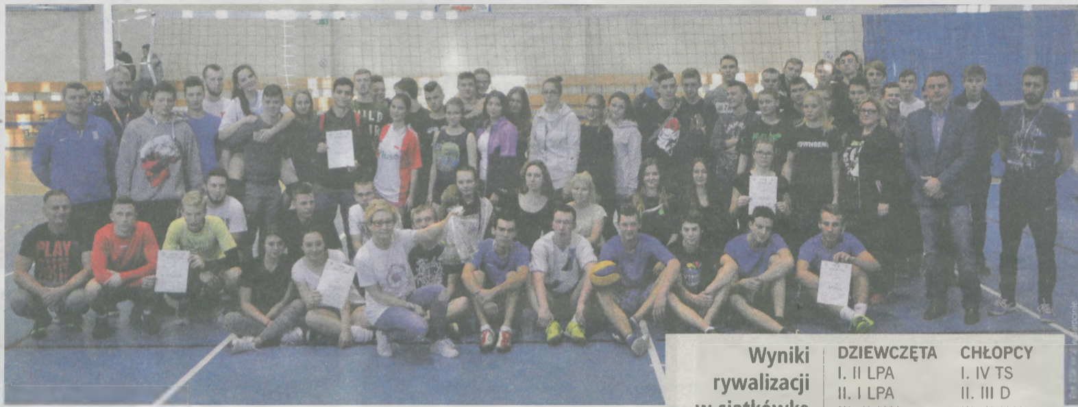
Nie mogło zabraknąć wspólnego zdjęcia po zakończeniu turnieju