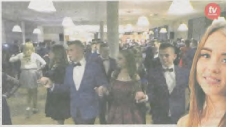
Fot. Bartek Szmalczyk