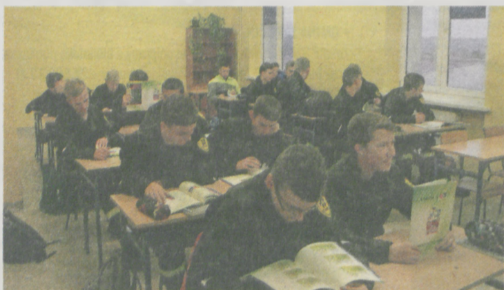
Niektórzy z zaciekawieniem przeglądali materiały o Zakładzie Ubezpieczeń Społecznych

47 uczniów liceum, technikum oraz szkoły zawodowej ZSP nr 2 w Jarocinie wzięło udział w olimpiadzie „Warto wiedzieć więcej o ubezpieczeniach społecznych”.