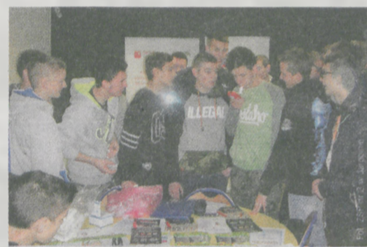
Uczniowie sprawdzają zawartość tlenu węgla w wydychanym powietrzu