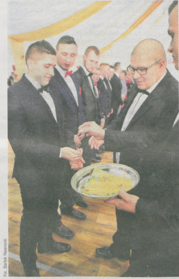
Fot. Bartek Nawrocki