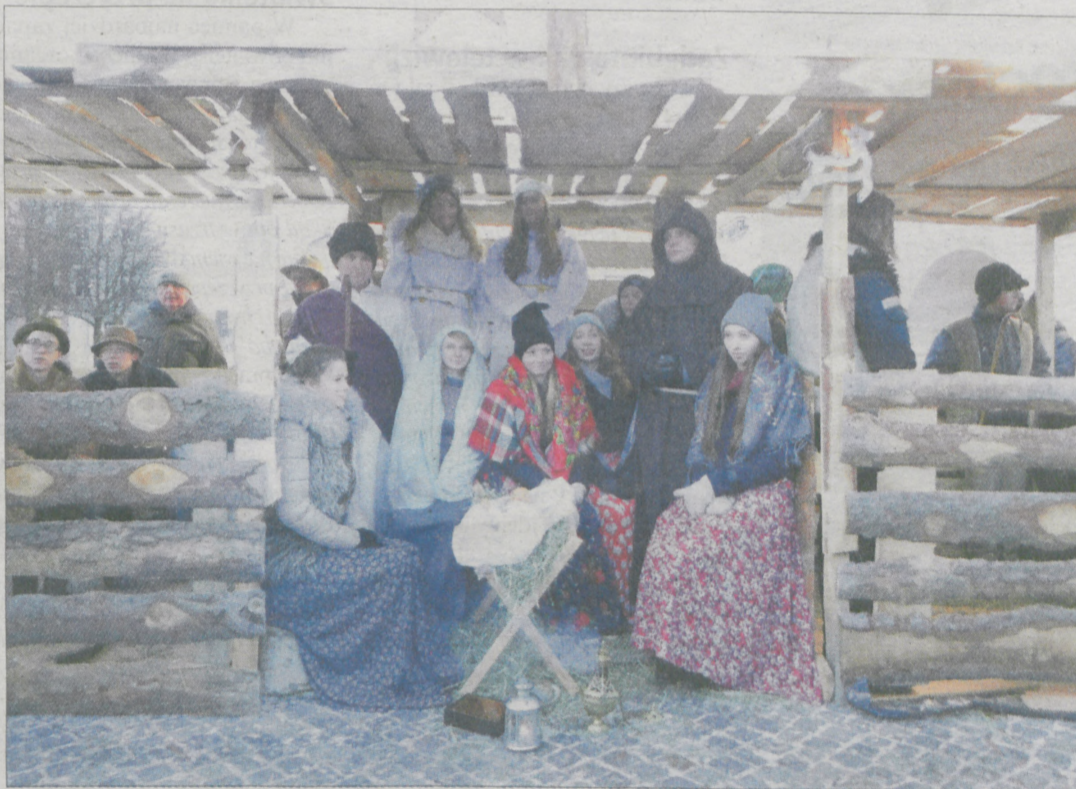
Fot. Lidia Sokowicz