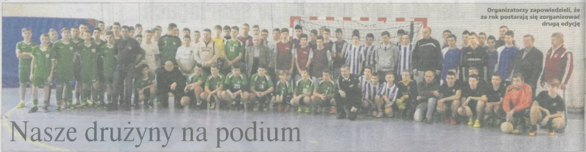
Organizatorzy zapowiedzieli, że za rok postarają się zorganizować drugą edycję