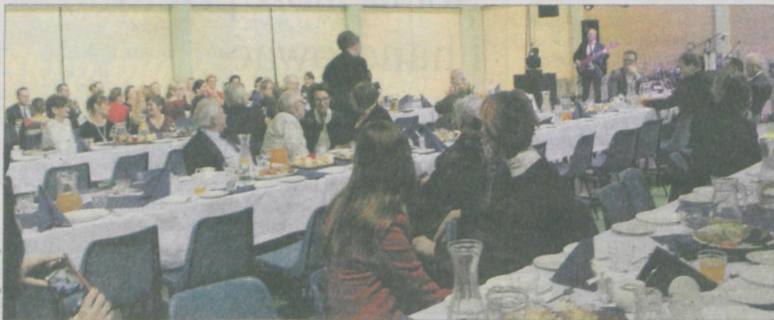
W czasie spotkania wystąpił zespół Pagost ze Śremu

Subwencja, którą otrzymuje gmina - ok. 8 mln zł - wystarcza tylko na wynagrodzenia nauczycieli. Na pensje wszystkich pracowników wydawanych jest ponad 10 mln zł. Wszystkie wydatki pochłaniają 15 mln zł.