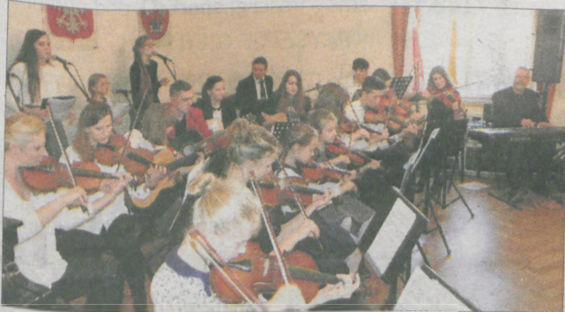
Koncert w wykonaniu uczniów Społecznego Ogniska Muzycznego w Jarocinie