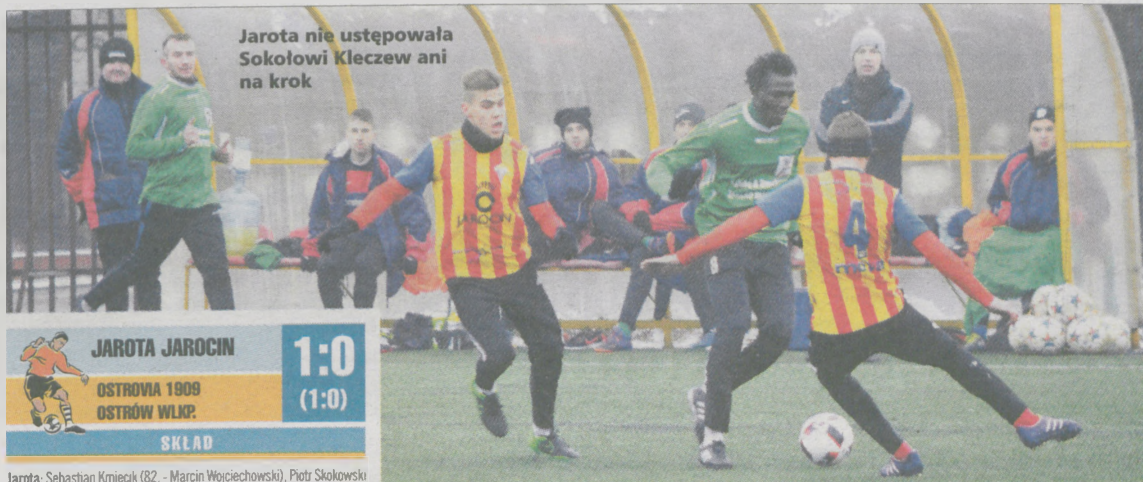
Jarota nie ustępowała Sokółowi Kleczew ani na krok