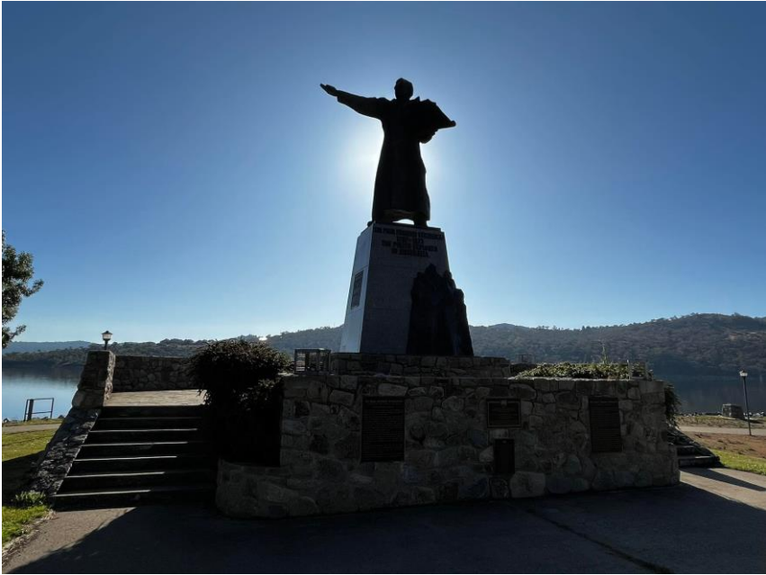
Pomnik P.E. Strzeleckiego w Australii – autor J. Sobociński