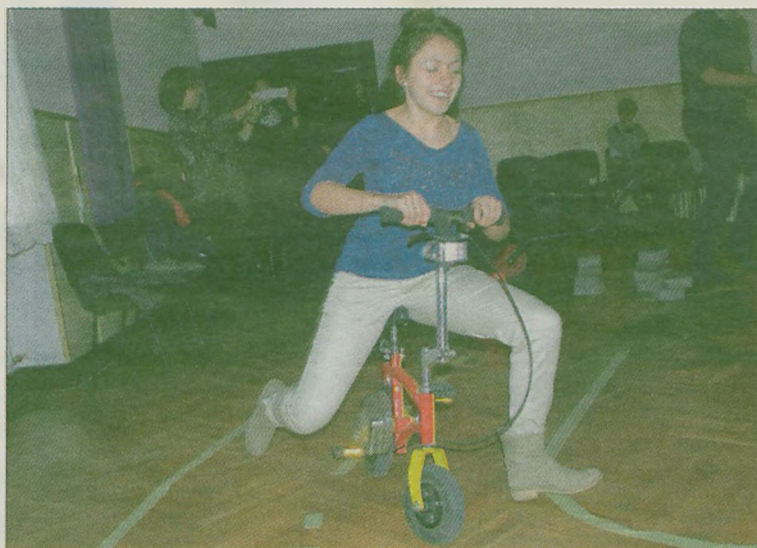
Dziecięcym rowerkiem jechano autostradą do Europy.