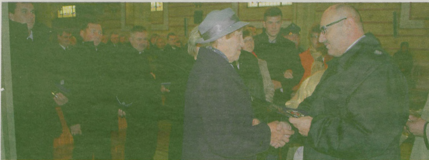
Znaki wręczono członkom rodzin zmarłych, zasłużonych druhów.

Ponownie bardzo wysoko została oceniona Ochotnicza Straż Pożarna w Dobrej. Kontrolę okresową gotowości operacyjnej jednostki będącej w krajowym Systemie Ratowniczo-Gaśniczym przeprowadziła komisja wyznaczona przez Komendanta Powiatowego Państwowej Straży Pożarnej w Turku.