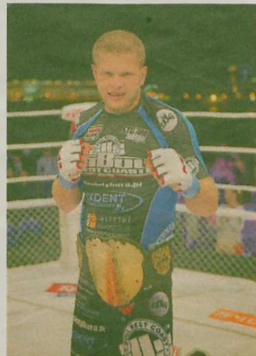
Marcin Tybura we wtorek 25 listopada walczył będzie w obronie pasa mistrzowskiego.

Marcin Tybura wleciał do Pekinu na dziesięć dni przed galą. Powiedział nam, że aklimatyzacja na wschodzie jest trudniejsza niż na zachodzie. Najchętniej spędziłby tam przed walką więcej czasu, ale to organizatorzy gali dyktują warunki. (art)