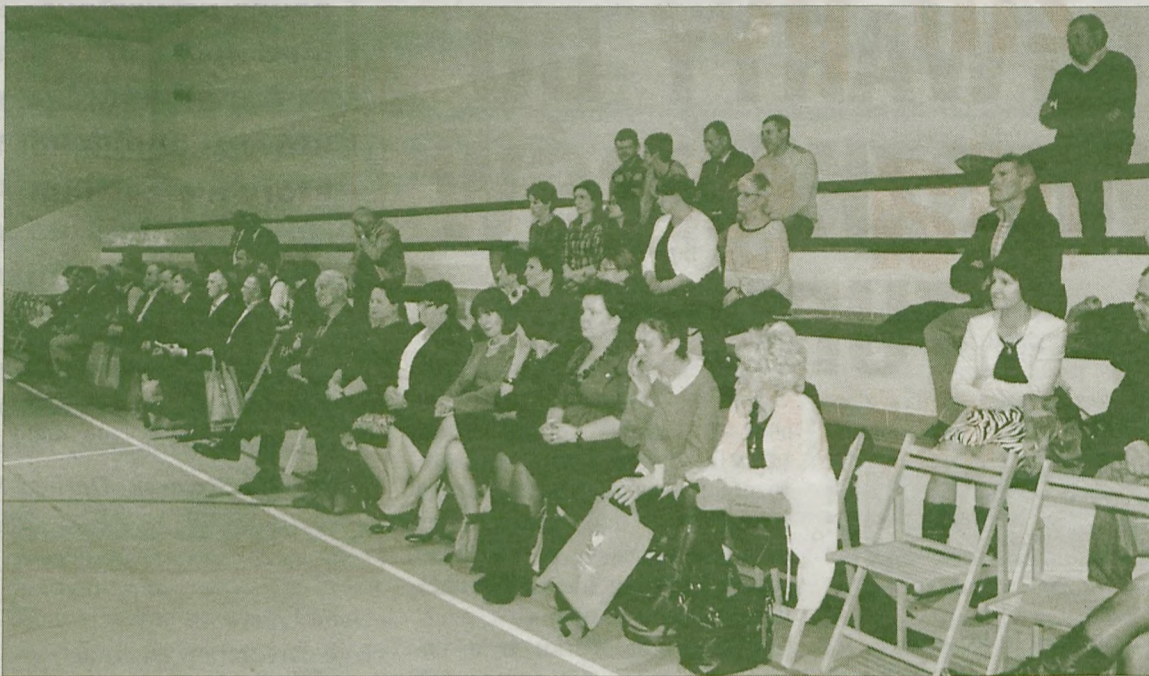
Widownia ostatnich obrad kawęczyńskiej rady Gminy w kadencji 2010-2014.