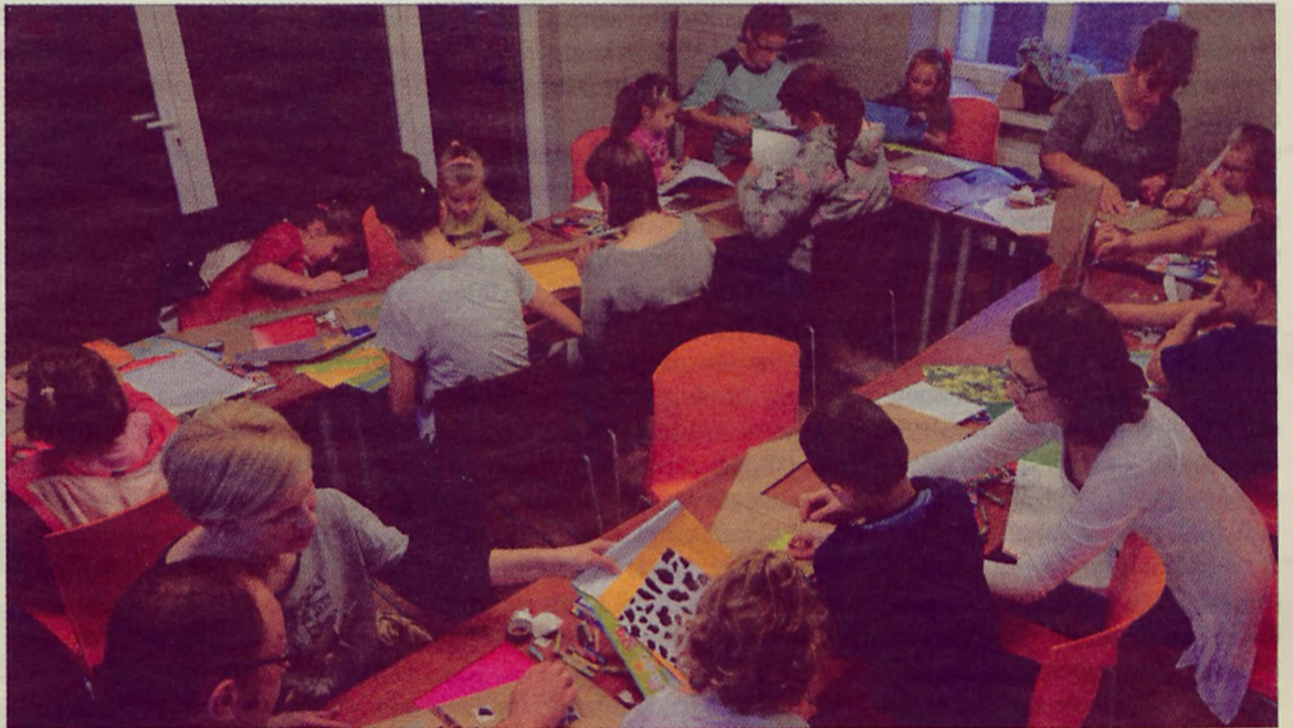
Oprócz wysłuchania fascynujących opowiadań, dzieci wraz z rodzicami mają okazję uczestniczyć w warsztatach plastycznych.