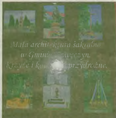
Najnowsze wydawnictwo gminy Kawęczyn.