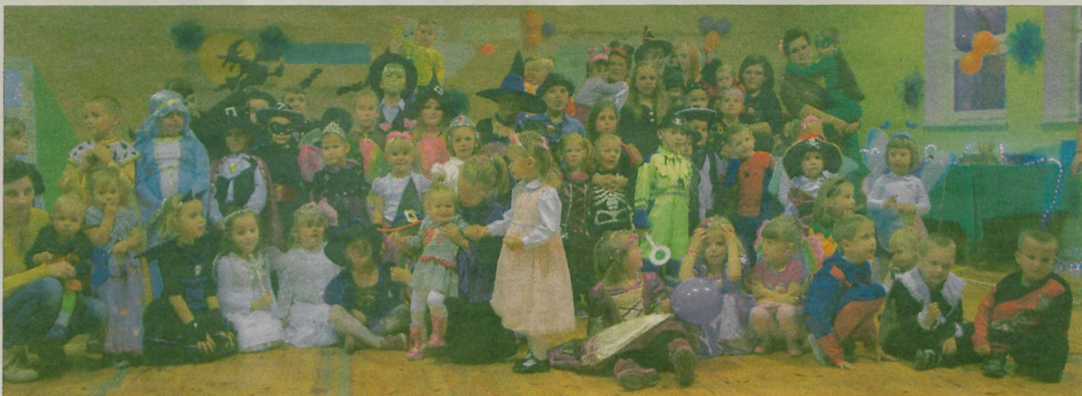
Na pierwszym w historii szkoły w Chylinie balu bawilo się kilkadziesiąt osób.