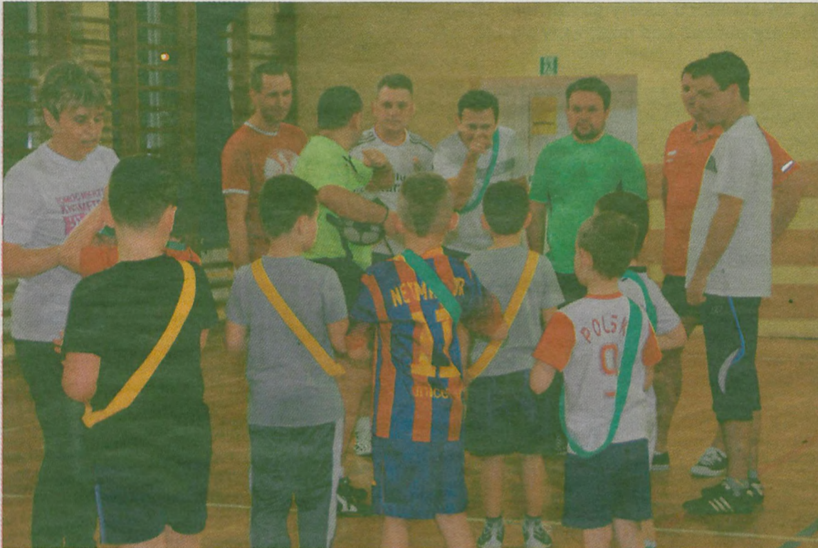
Bojowe nastroje przed meczem.

podobnie jak reguły gry – o ile nie nadwyrężały zasad fair play. Popołudniem w „czwartek” sala gimnastyczna w „czwórce” za-