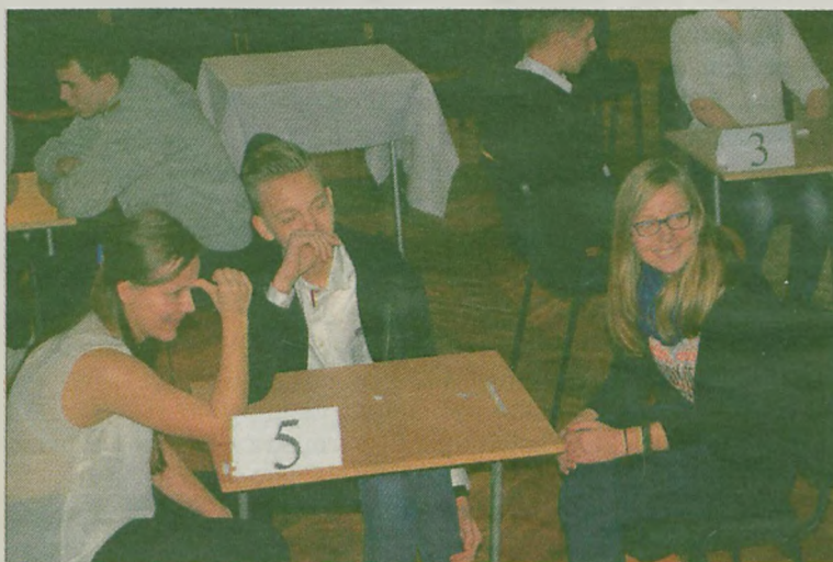
Drużyna nr 5 zajęła drugie miejsce.

kował też nauczycielkom, które zajęły się przygotowaniem konkursu: Sylwii Chruszcz, Angelce Dryjańskiej, Barbarze Piąstkce-Dopieralskiej i Agnieszce Taranowicz. (art)