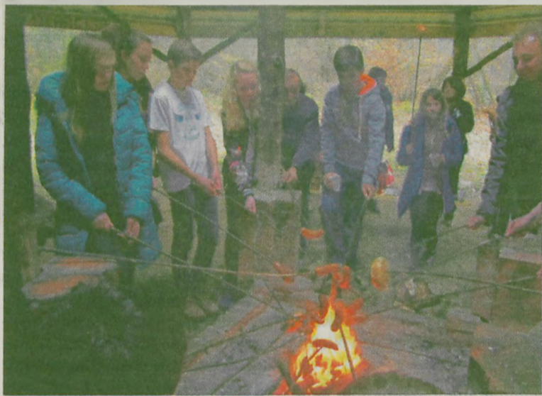
Jedną z wielu atrakcji był pobyt w Uniejowie.