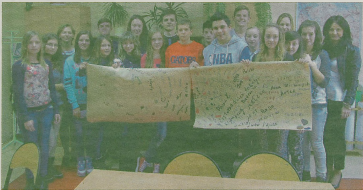
Już pierwszego dnia wizyty młodzież z Ukrainy zaprzyjaźniła się z uczniami z Turku.

W czwartek, 6 listopada, w Turku obchodzono dzień „Turk pędzlem malowany”. Goście z Ukrainy poznali dzieło Mehoffera