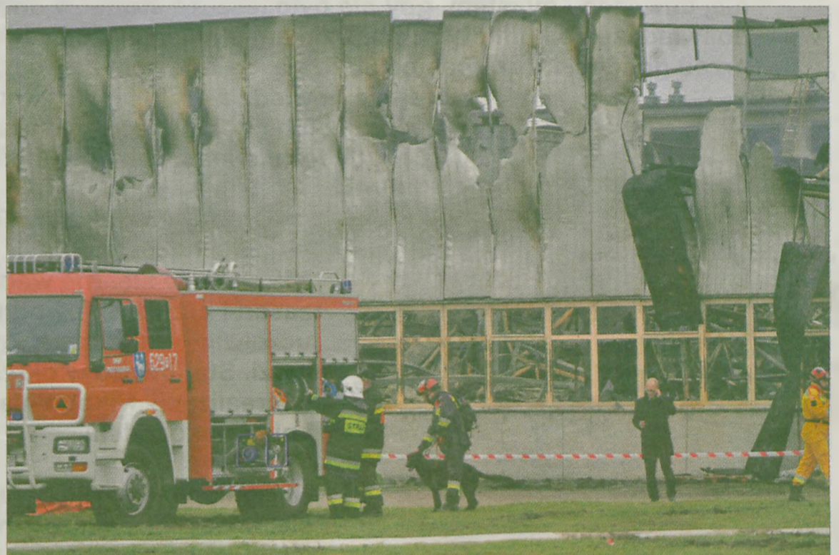
Zgłiszczu przeszukiwali ratownicy z psami.

Przyczyną powstania pożaru, jak mówią strażacy, był zapłon technologiczny, czyli ogień powstał podczas pracy jednej z maszyn tkackich (krosna). Dlaczego się zapaliła, to ma ustalić specjalnie powołana komisja złożona ze strażaków i policjantów. Śledztwo prowadzi też turkowieńska prokuratura, zabezpieczono już dokumenty, a biegły z zakresu elektryki dokonał oględzin spalonej hali.