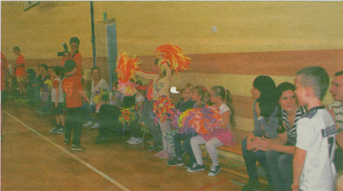
Publiczność z napięciem obserwowала bieg zdarzeń na boisku, spontanicznie reagując na bramki.