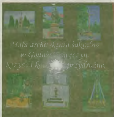
Najnowsze wydawnictwo gminy Kawęczyn.