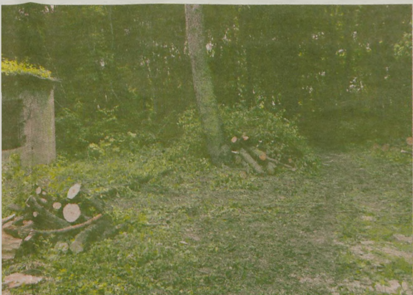
Tem tego roku w parku cięto drzewa. Mieszkańcy mają jednak wątpliwości, czy to było według założonego planu.