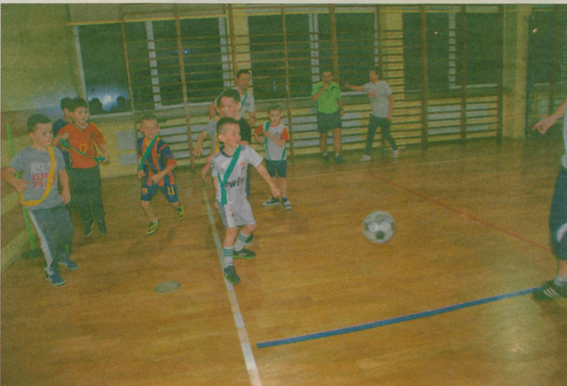
Mobilizacja przed bramką „synów”.

Materiał finansowany przez KW Towarzystwo Samorządowe