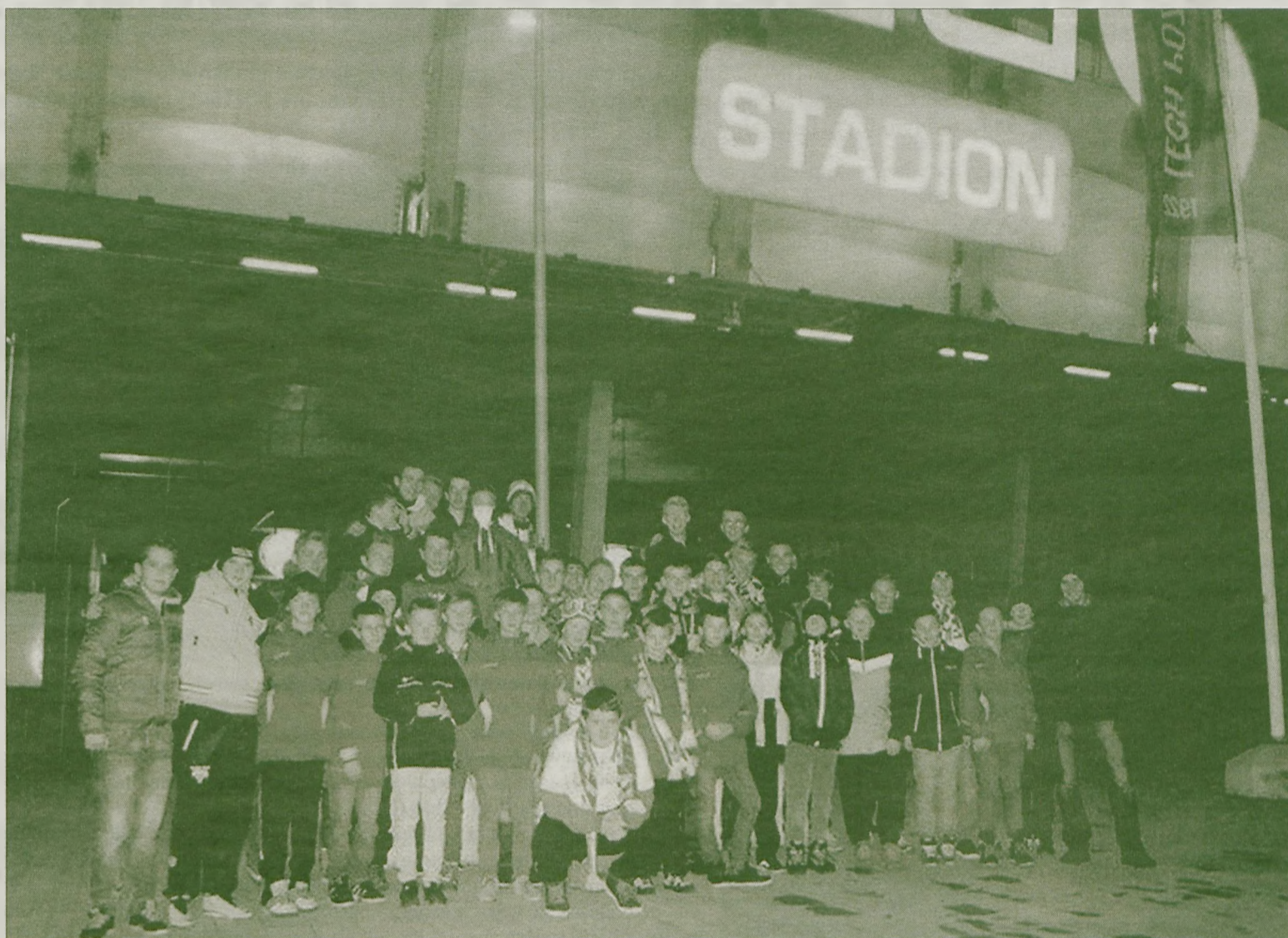
Dzięki świetnym wynikom w rundzie jesiennej drużyny juniora i młodzika starszego miały okazję obejrzeć na żywo mecz Lecha Poznań z Podbeskidziem Bielsko-Biała.