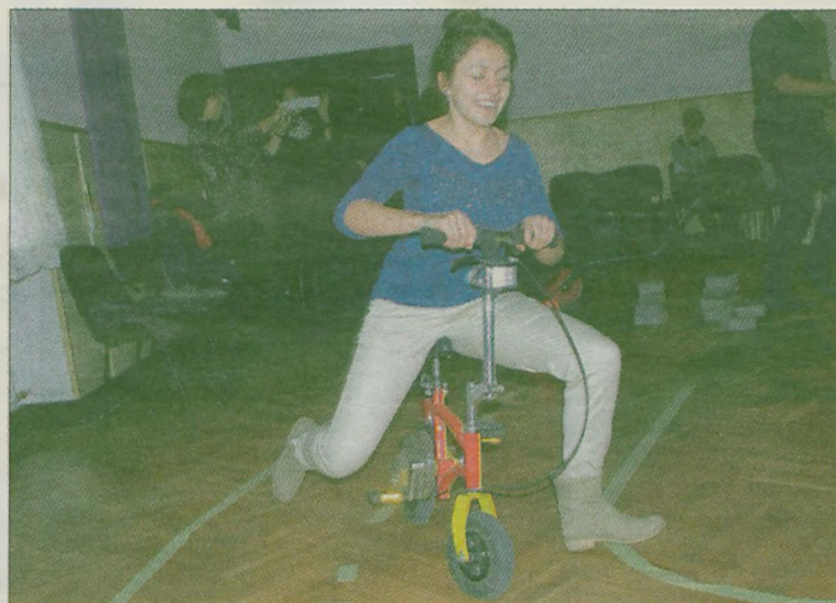
Dziecięcym rowerkiem jechano autostradą do Europy.