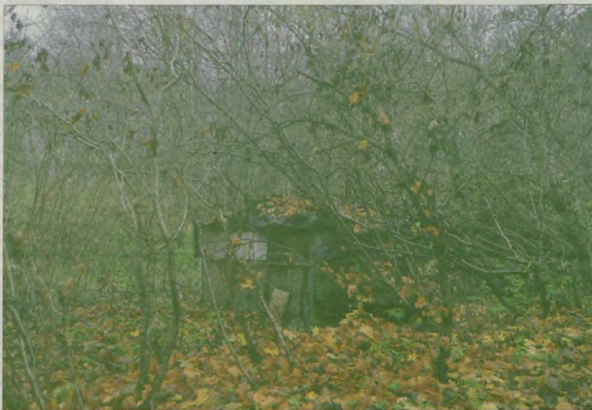
Wątpliwą ozdobą zabytkowego parku są stare, rozsypujące się szopy.

Dociekliwi mieszkańcy Górniczego znaleźli poszerzoną informację na stronie internetowej Urzędu Miejskiego. „Efektem rzeczowym wnioskowanego przedsięwzięcia jest kompleksowo zrewaloryzowane 4,6201 ha parku krajobrazowego. Dzięki całkowitemu usunięciu oraz podcięciu suchych gałęzi obejmującym łącznie 62 drzewa oraz 1500 m 2 krzewu, zwiększyło się także bezpieczeństwo osób przebywających na terenie parku, a co za tym idzie, dostępność do zabytkowej