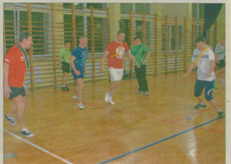
Między sobą dorośli grali w małą piłeczkę.