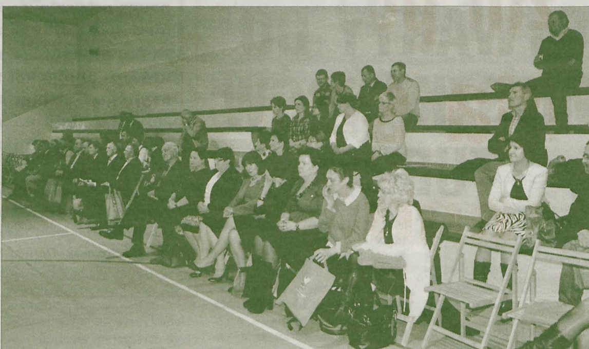
Widownia ostatnich obrad kawęczyńskiej rady Gminy w kadencji 2010-2014.