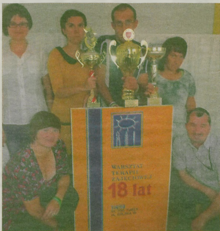
Podopieczni warsztatów przywieźli z Konina kilka pucharów.