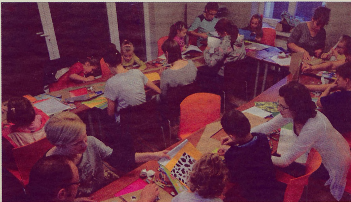
Oprócz wysłuchania fascynujących opowiadań, dzieci wraz z rodzicami mają okazję uczestniczyć w warsztatach plastycznych.