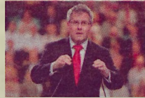
Ryszard Czarnecki wiceprzewodniczący Parlamentu Europejskiego

Znam i cenię Zdzisława Czaplę od lat. Takich ludzi potrzeba dziś polskiemu samorządowi - oddanych, doświadczonych, zaangażowanych. Proszę o głos na Burmistrza Zdzisława Czaplę.