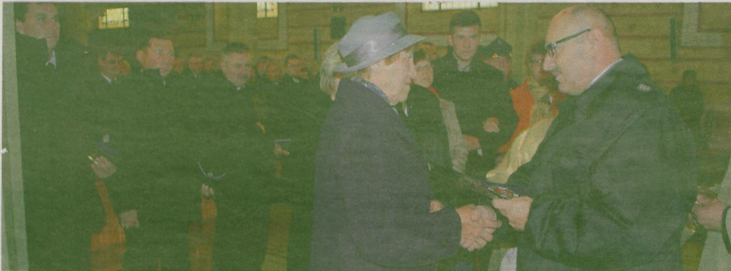
Znaki wręczono członkom rodzin zmarłych, zasłużonych druhów.

Ponownie bardzo wysoko została oceniona Ochotnicza Straż Pożarna w Dobrej. Kontrolę okresową gotowości operacyjnej jednostki będącej w krajowym Systemie Ratowniczo-Gaśniczym przeprowadziła komisja wyznaczona przez Komendanta Powiatowego Państwowej Straży Pożarnej w Turku.