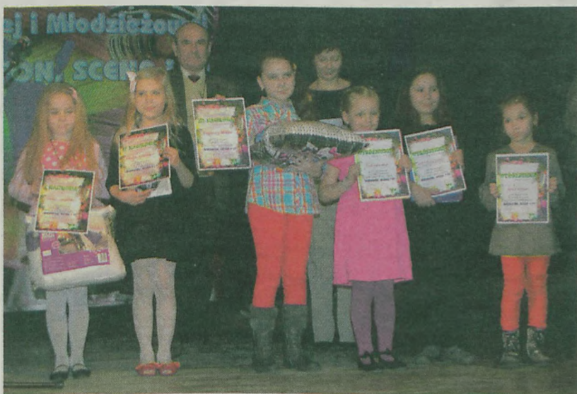
Nagrodzeni uczniowie z klas I-III szkół podstawowych.