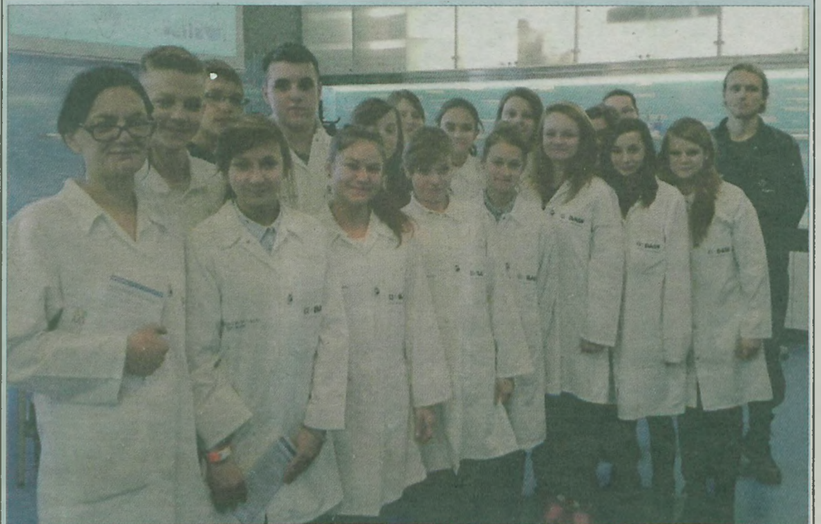
Gimnazjaliści w warszawskim centrum nauki „Kopernik”.

um-zamek i szlachecki dworek w Gosławicach, kończąc swoją wycieczkę seansem filmu „Hobbit” w konińskiej Galerii nad Jeziorem. Dla uczniów Gimnazjum nr 1 był to czas dobrej zabawy, nawiązania nowych znajomości, lepszego poznania swoich kolegów i nauczycieli.