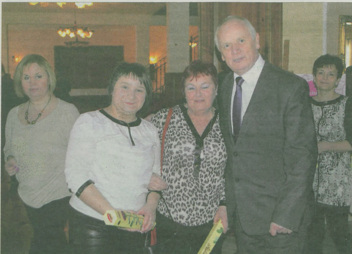
Wójt witał mieszkanki swojej gminy uśmiechem i słodkim „kwiatkiem”.