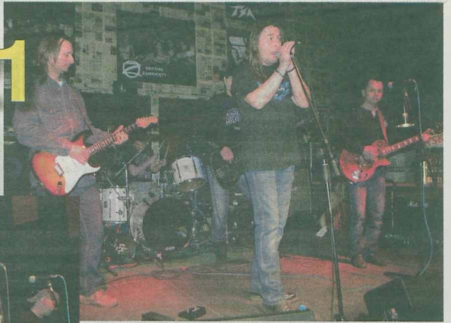
Jako support zagrała turkowska kapela Ray.