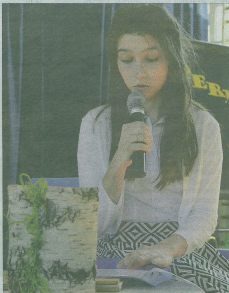
Gimnazjaliści z dwójki zapewniają, że są dumni ze swojego patrona, dlatego tak uroczystie obchodzą jego święto. Z tej okazji przygotowali między innymi konkurs literacki pod hasłem „Wstrzymał Słońce, ruszył Ziemię, młodym twórcom dał natchnienie”.