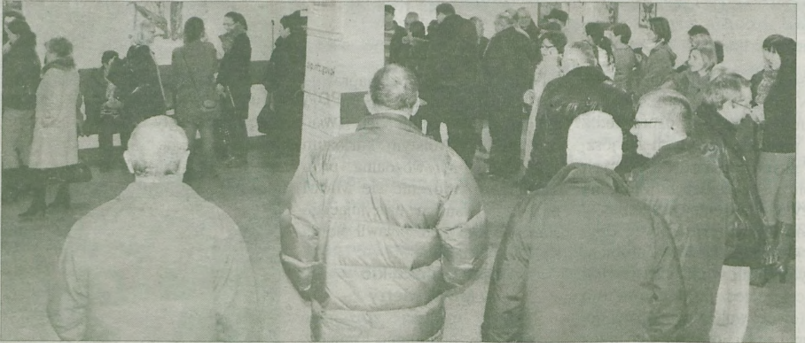
Kolejki w Urzędzie Miejskim nie malały. W trzy dni pracownicy NFZ-u wydali tam ponad 700 indywidualnych loginów i haseł do kont ZIP.

O zintegrowanym informatorze pacjenta czyli ZIP-ie pisaliśmy już w Echu Turku. To nowy system informatyczny NFZ-u, który ma pozwolić pacjentom na wgląd w historię swoich chorób, wizyt u lekarzy i