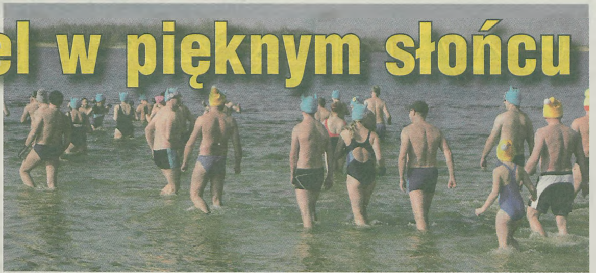
W sobotnie południe do wody weszło około 80 osób, w tym także 3 dzieci.

jezioro przybyło ponad 80 osób z różnych stron Polski, by wspólnie się wykapać. Powiat turecki odwiedzili najliczniej członkowie Wielkopolskiego Klubu Morsów Alaska, Stowarzyszenia Morsy Swarzędz, Kołobrzskiego Klubu Morsów, Leszczyńskiego Klubu Morsów Yeti, Komando Foki z Uniejowa i lodołamacze z Margonina. Nie zabrakło także turkowskich morsów. –My jeździmy do nich, on się rewanzują przyjeżdżając na nasze imprezy. Im nas więcej tym weselej – opowiada Chrostek. W tym roku w zimowej kąpeli uczestniczyło także troje dzieci.