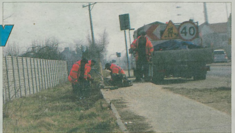
ii Naprawiona została też kostka brukowa.

trawniki zostały uporządkowane. We wtorek, 25 lutego w pierwszej kolejności PGKiM zabezpieczył studzienki na ulicy Leśnej. Dwa dni później na ulicy Łąkowej pojawiła się ekipa sprzątająca.