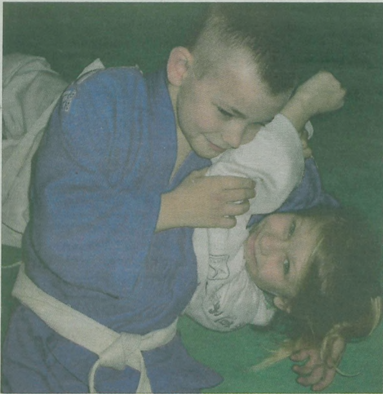
Jak widać i ciężki trening był przyjemnością.