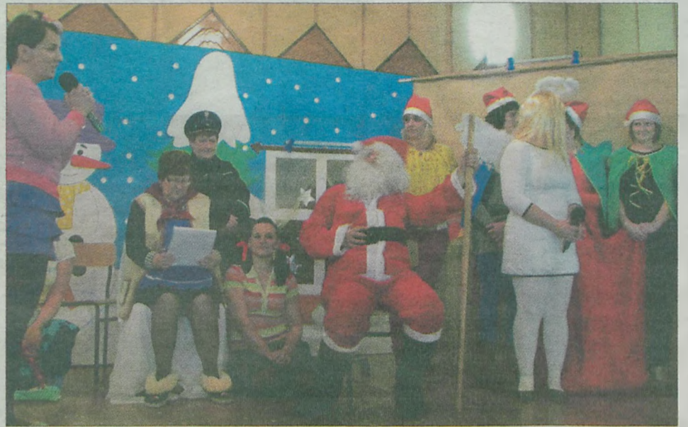
Podczas tegorocznej zabawy karnawałowej w Koźminie na scenie zaprezentowali się także rodzice i... babcia.