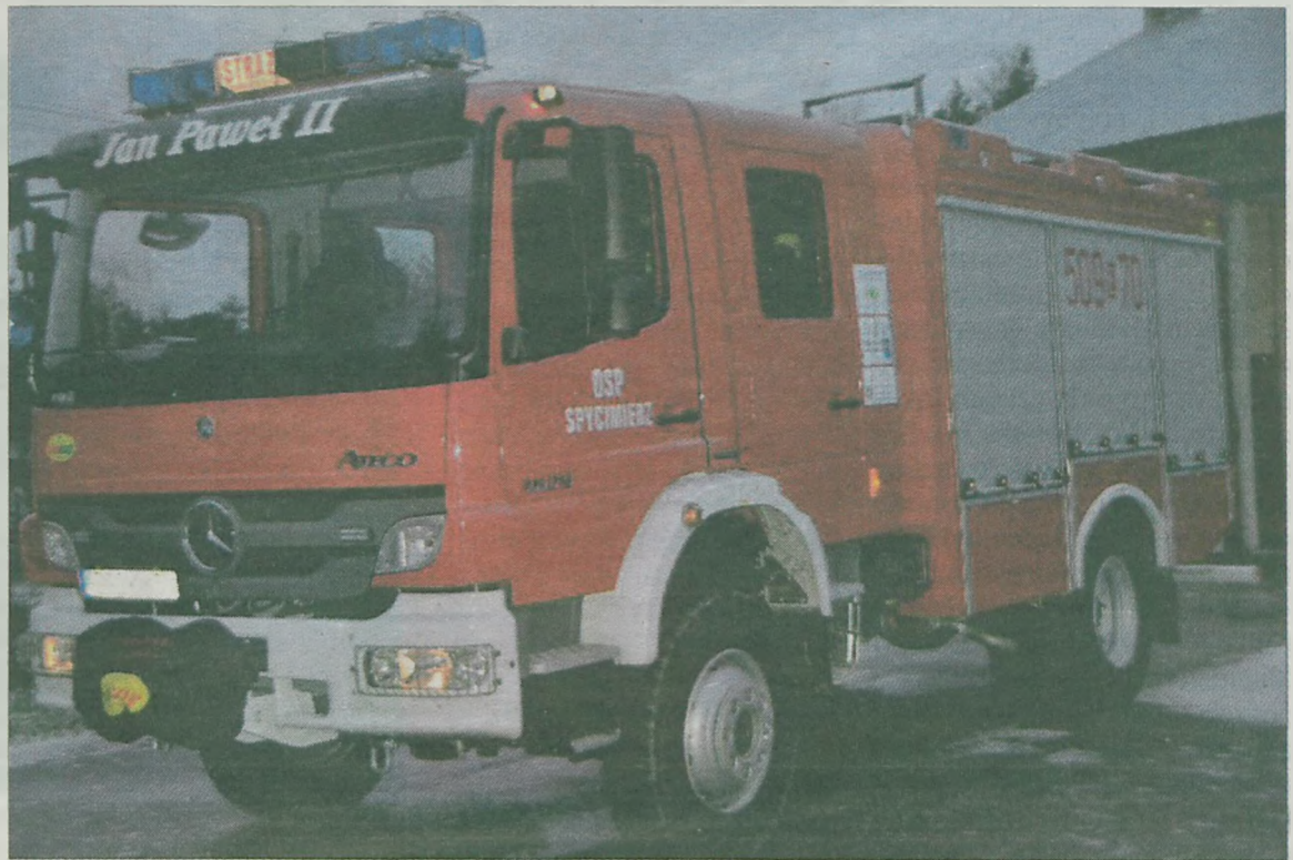
Jan Paweł II gotowy do wyjazdu.

– Posiadanie tego samochodu pozwoli skuteczniej prowadzić akcje ratownicze, polegające na