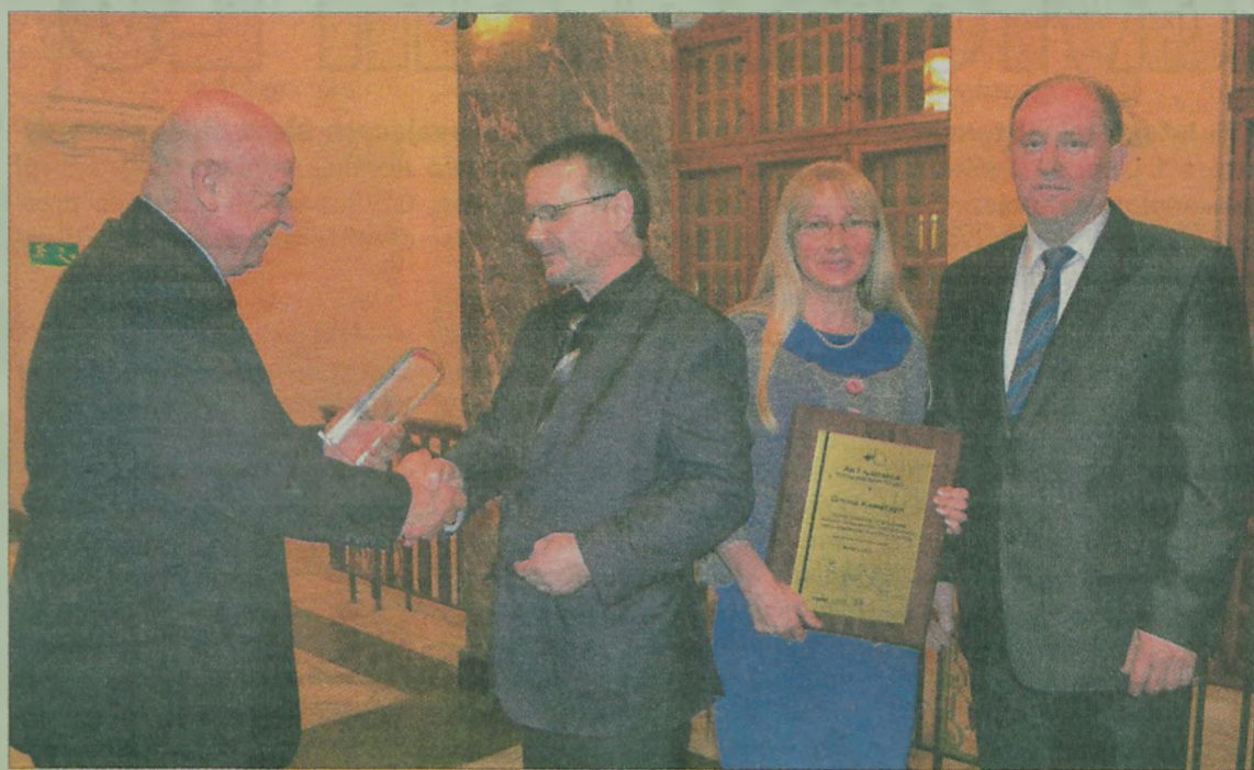
Przedstawiciele gminy Kawęczyn odbierają „hitowe” nagrody.

który zaprezentował kilka pieśni żydowskich. Atrakcją wieczoru był zespół rockowy „Bracia”, który tworzą Piotr i Wojciech Cugowscy. (art)