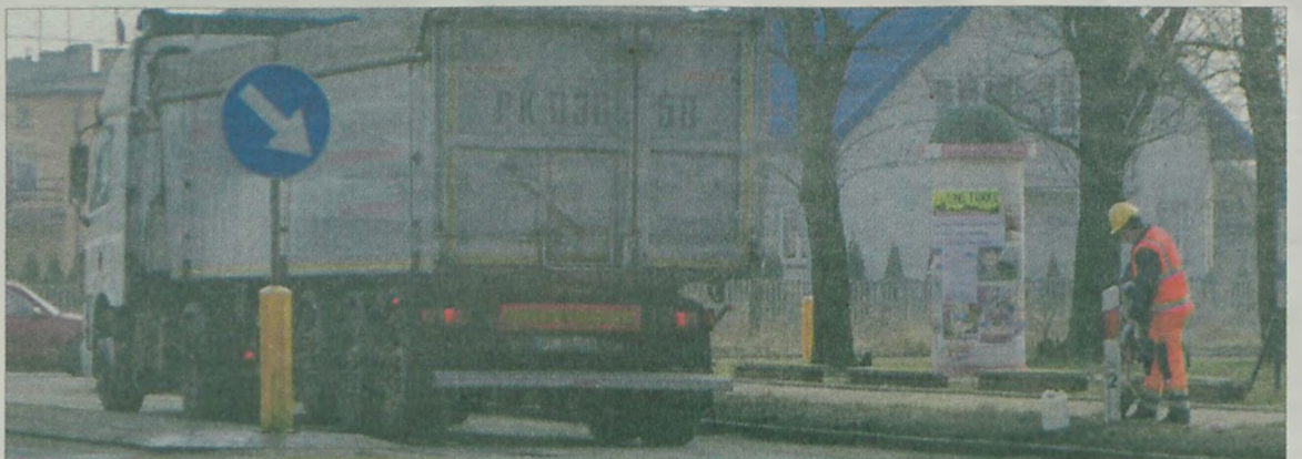
Inni myli znaki.