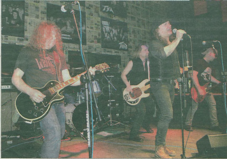
Muzyków z Czterech Szmerów połączyła fascynacja jednym z największych bandów świata - AC/DC.