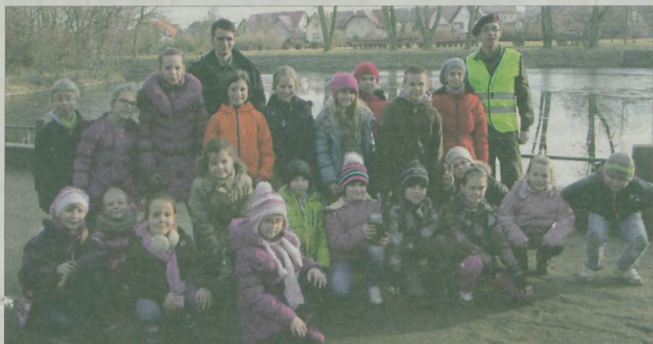
W biwaku uczestniczyli uczniowie turkowskich szkół.

Kolejnym punktem bogatego programu była nauka skomplikowanego układu tanecznego, gry i płyś harcerskie. Wieczorem odbyło się uroczyste świeczkowisko. Przy akompaniamentem gitary harcerze śpiewali do późnych godzin. -Dla nas to był czas szczególnie, w którym mogliśmy się wszyscy razem spotkać i wspólnie przeżywać to ważne dla każdego harcerza święto - mówili uczniowie. ii