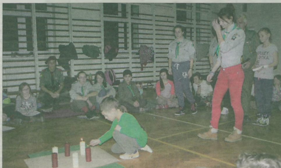
Wieczorem harcerze uczestniczyli w świeczkowisku.