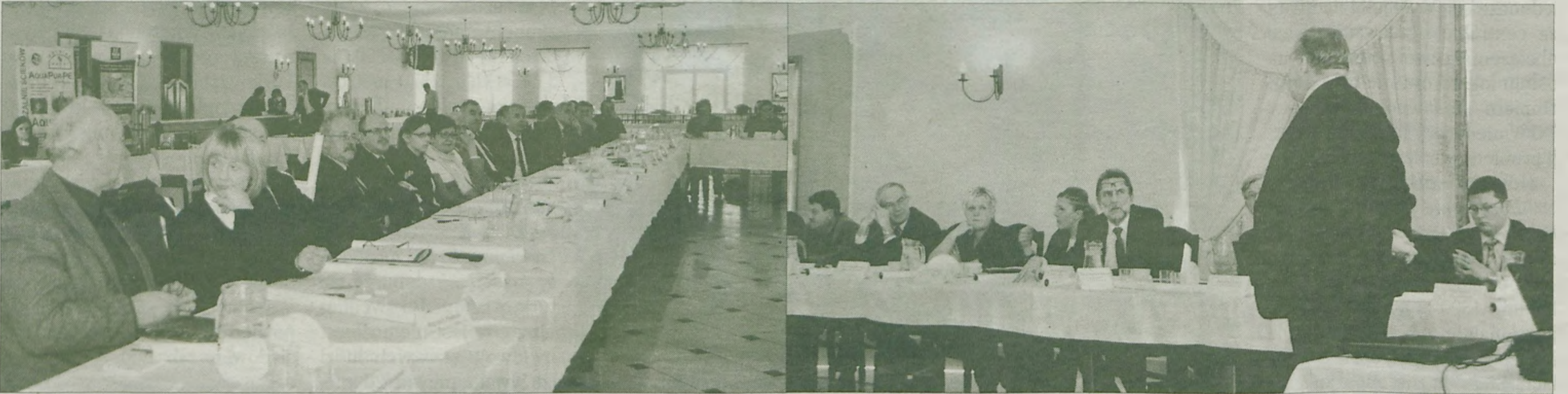
Spora grupa samorządowców z powiatu tureckiego wzięła udział w przygotowanym przez tureckie starostwo seminarium ściekowym.

Jednak i tak największy spór między wykładowcą a siedzącymi na sali słuchaczami powstał w debacie o przetargach. Świigoń przekonywał że to na wóldarzach