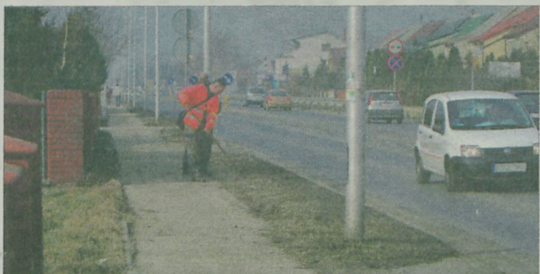
Jedni grabili i siali trawę zniszczoną przez maszynę zgarniającą śnieg z chodników.