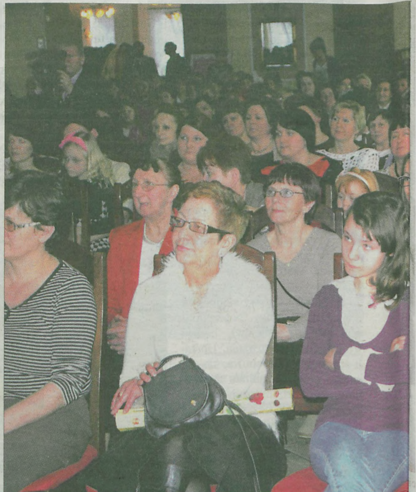
Sala po brzegi wypełniła się paniami w wieku od kilku do kilkudziesięciu