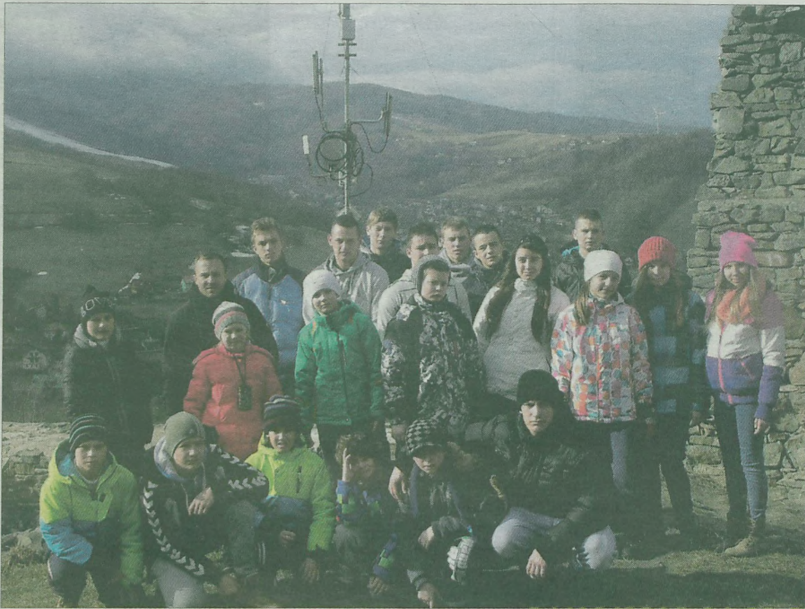
Podczas wycieczki do zamku.

Obozowy dzień judocy rozpoczęli o godzinie 7.00, od porannego rozruchu w myśl zasady „nic tak nie stawia na nogi, jak poranny bieg w ośnieżonych górach”. Po powrocie brano poranny prysznic oraz konsumowano śniadanie. Następnie judocy poprzez zabawę i rozrywkę doskonalili znajomość języka angielskiego. Po zajęciach edukacyjnych sportowcy spotykali się na macie, aby usprawnić techniki rzutów „tachi waza”.