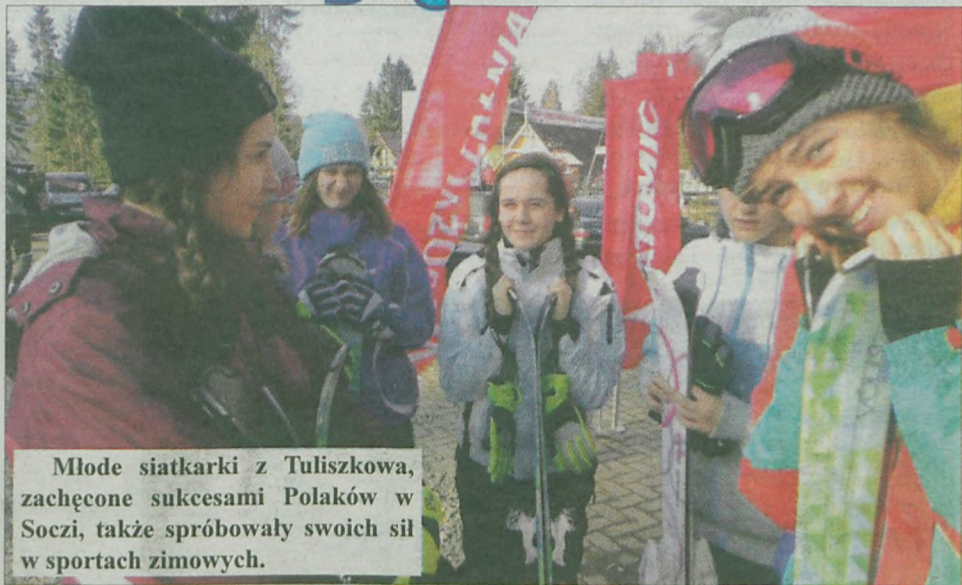
Młode siatkarki z Tuliszkowa, zachęcane sukcesami Polaków w Soczi, także spróbowały swoich sił w sportach zimowych.

Rywalkami dziewcząt z Tuliszkowa były drużyny Victorii Cieszyn, TRS Siły Ustroń oraz BKS-u Bielsko Biala. Udało się wygrać z dwoma pierwszymi, za każdym razem 3:1. Także wynikiem 3:1 zakończył się sparing z bielszczankami, z tym że tutaj górą były Góralki.