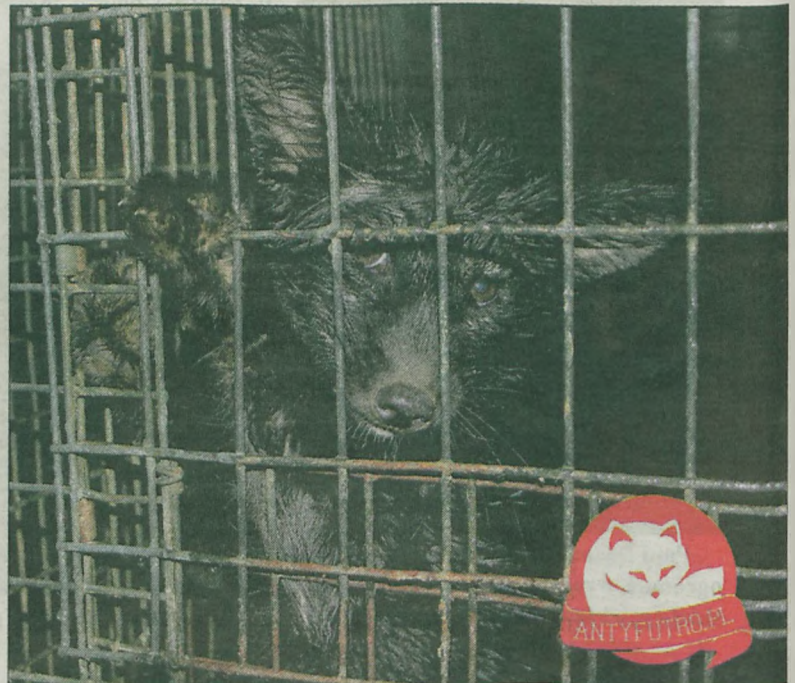
Przemysł futrzarski ma wyjątkowo okrutne, nieludzkie oblicze.