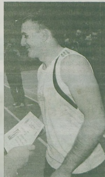
Puchar za zajęcie pierwszego miejsca odbiera kapitan drużyny OSP Linne II.