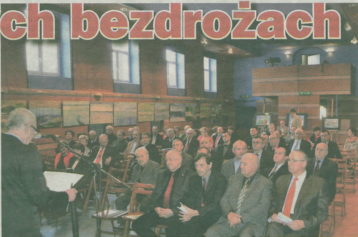
W obradach Konwencji Powiatowej SLD uczestniczyło siedemdziesięciu członków lokalnych struktur tego ugrupowania. Jednak sam przebieg i dorobek Konwencji może rozczarowywać. Słowem uprawiana przez aktualne kierownictwo partii polityka sprowadza turkowską lewicę na polityczne bezdroża.