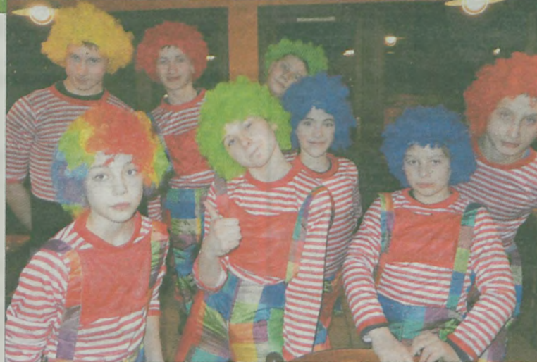
Wśród wiwatujących tłumów w strojach clownów uczniowie z sarbickiej prezentowali się wesoło i kolorowo.

To był kolejny punkt w programie działań, jakie uczniowie z polskiej szkoły wraz z kolegami ze szkoły partnerskiej francuskiej i niemieckiej realizowali w ramach projektu Comenius. Program był bardzo bogaty, francuscy koledzy zaprosili swoich polskich i niemieckich partnerów do zajęć muzycznych, sportowych a także artystycznych. Poznawali więc uczniowie z Sarbic regionalne i narodowe tańce i piosenki francuskie, aktywnie uczestnicząc w zajęciach muzycznych. Brali udział w zajęciach sporto-