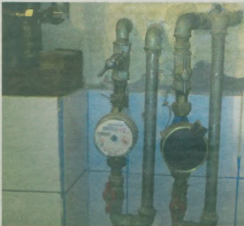
Koszt założenia licznika nie jest duży, ale wymaga dodatkowego remontu.

Ta inwestycja spłaca się zresztą w ciągu roku, bo ryczałt