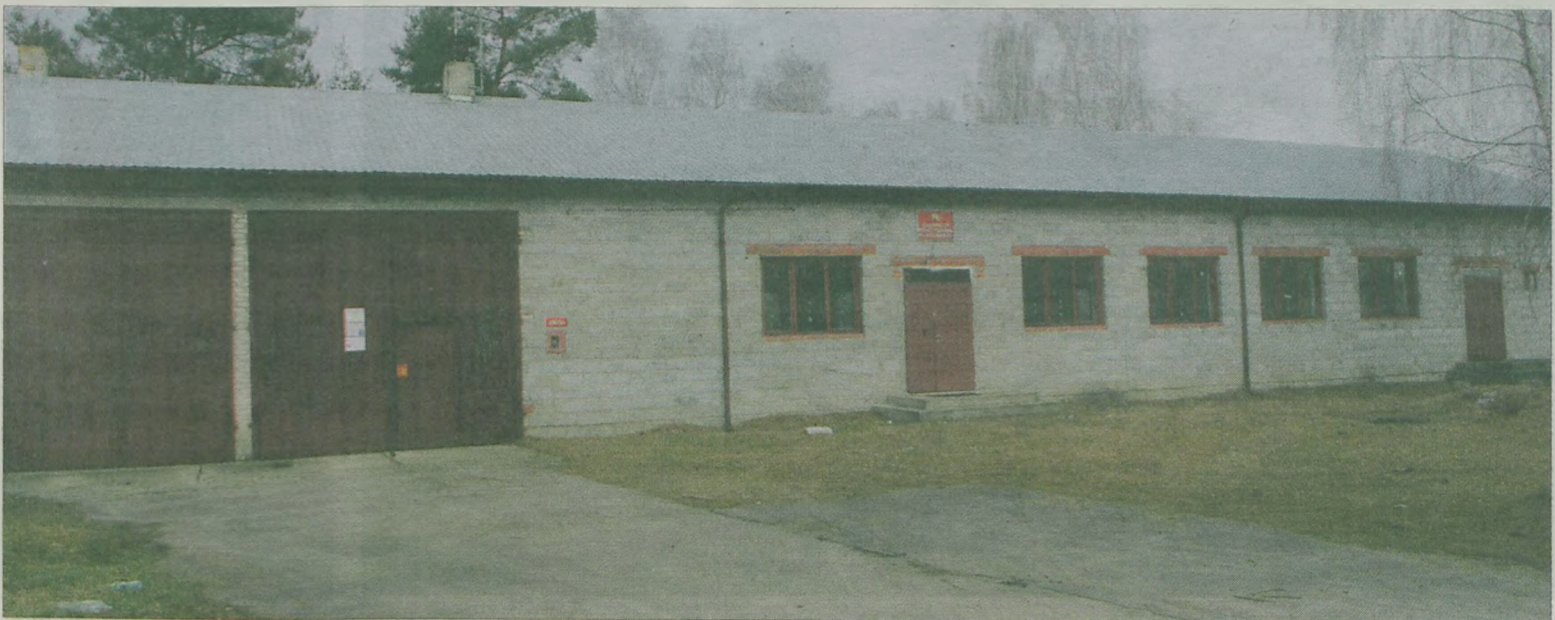
Remiza w Spycimierzu już w maju będzie nie do poznania.