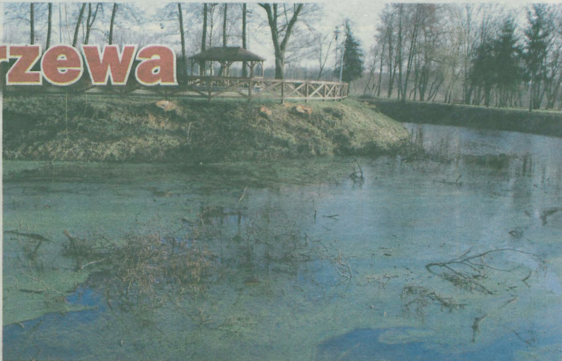
Gałęzie zalegają w fosie.

unikatowa w skali Polski ośmio-kątna wieża mieszkalno-obronna. Pozostałością jest kopiec (zwany tutaj wyspą) otoczony fosą. Obok znajduje się okazały