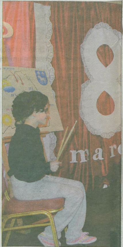
Koncert życzeń w TV Przykonia.

by ich pociechy miały gdzie spędzać wolny czas. W imieniu swoim i całej męskiej społeczności gminy życzył paniom, aby Dzień Kobiet był dla nich przez 365 dni w roku.