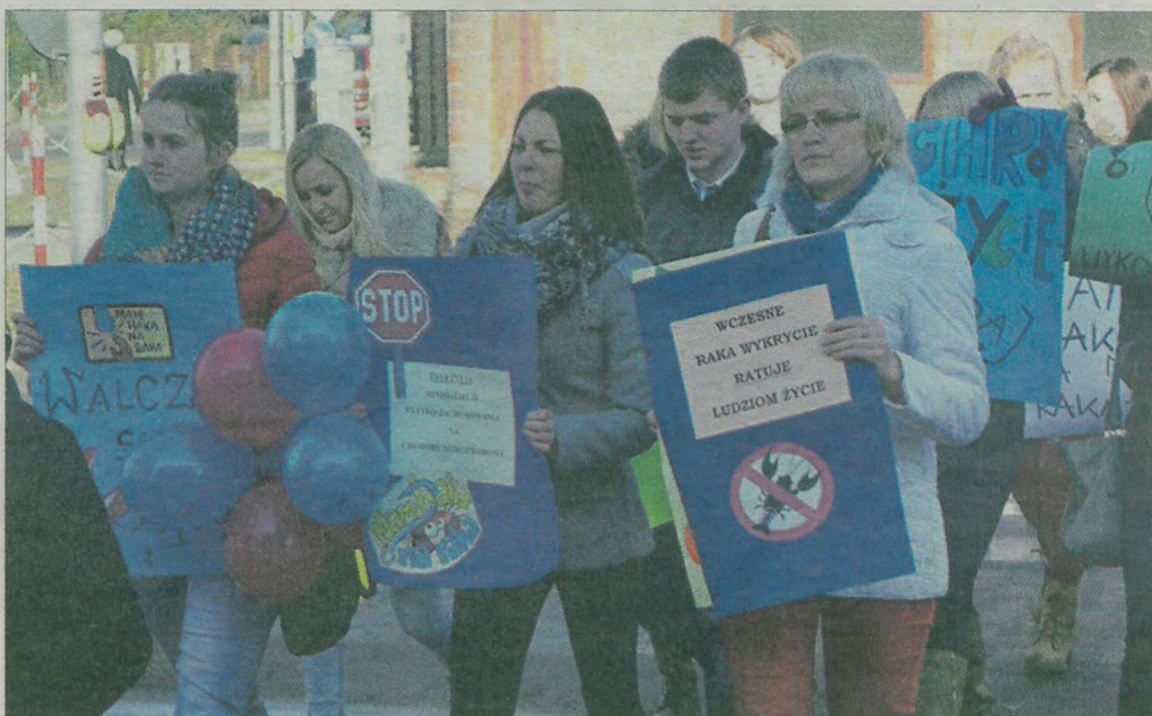
Młodzież z ZST podczas Marszu Hakowicza.