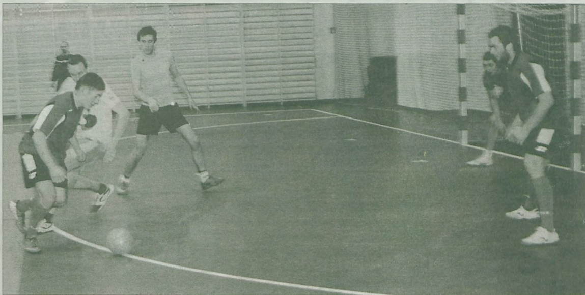
Walka na boisku była zażarta, ale fair play.