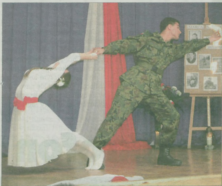
Uczniowie szkoły w układzie tanecznym z patriotycznymi akcentami.