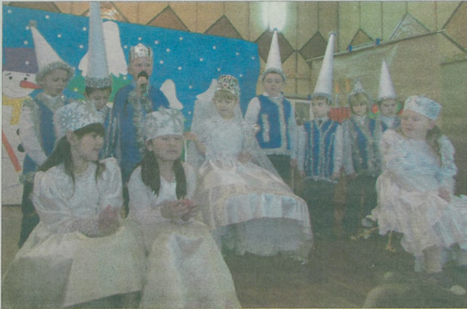
Dzieci ze szkoły w Koźminie.