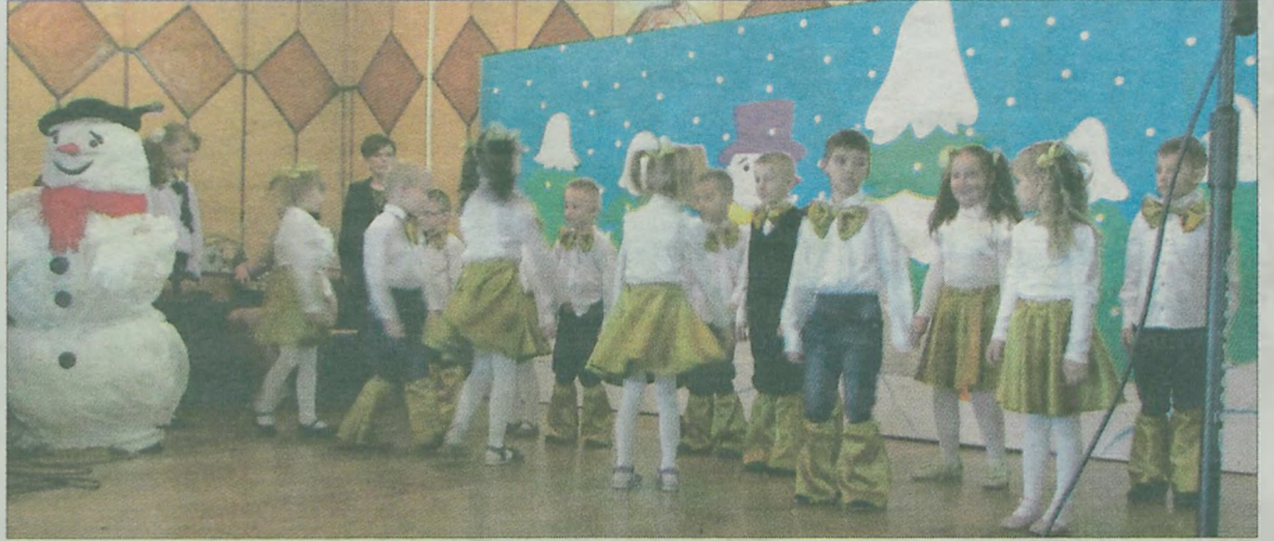
Występy dzieci ze szkoły filialnej w Krwonach.

Gratulacjom udanego występu zarówno dziecięcym, jak i dorosłym aktorom nie było koń-