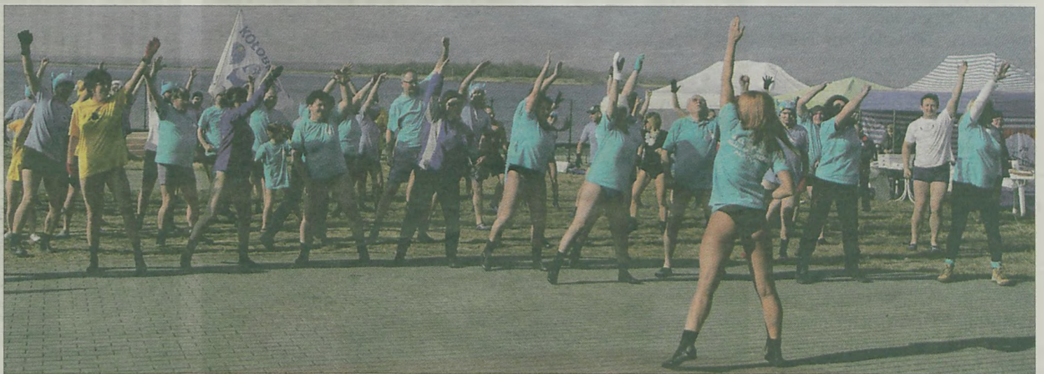
Instruktor fitness poprowadziła rozgrzewkę, bo zanim morsy wskoczyły do wody musiały się dokładnie rozruszać.