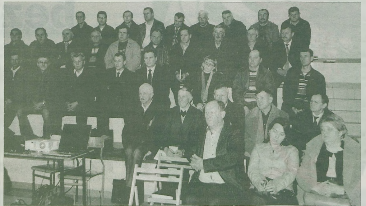
W zebraniu wzięło udział około siedemdziesięciu osób.

Uczestnicy spotkania mieli szereg pytań np. „Czy jeżeli się nie skorzysta tych pieniędzy to przepadną? Pani trenerka, zamiast odpowiedzieć krótko – Nie!, długo i mętnie tłumaczy-