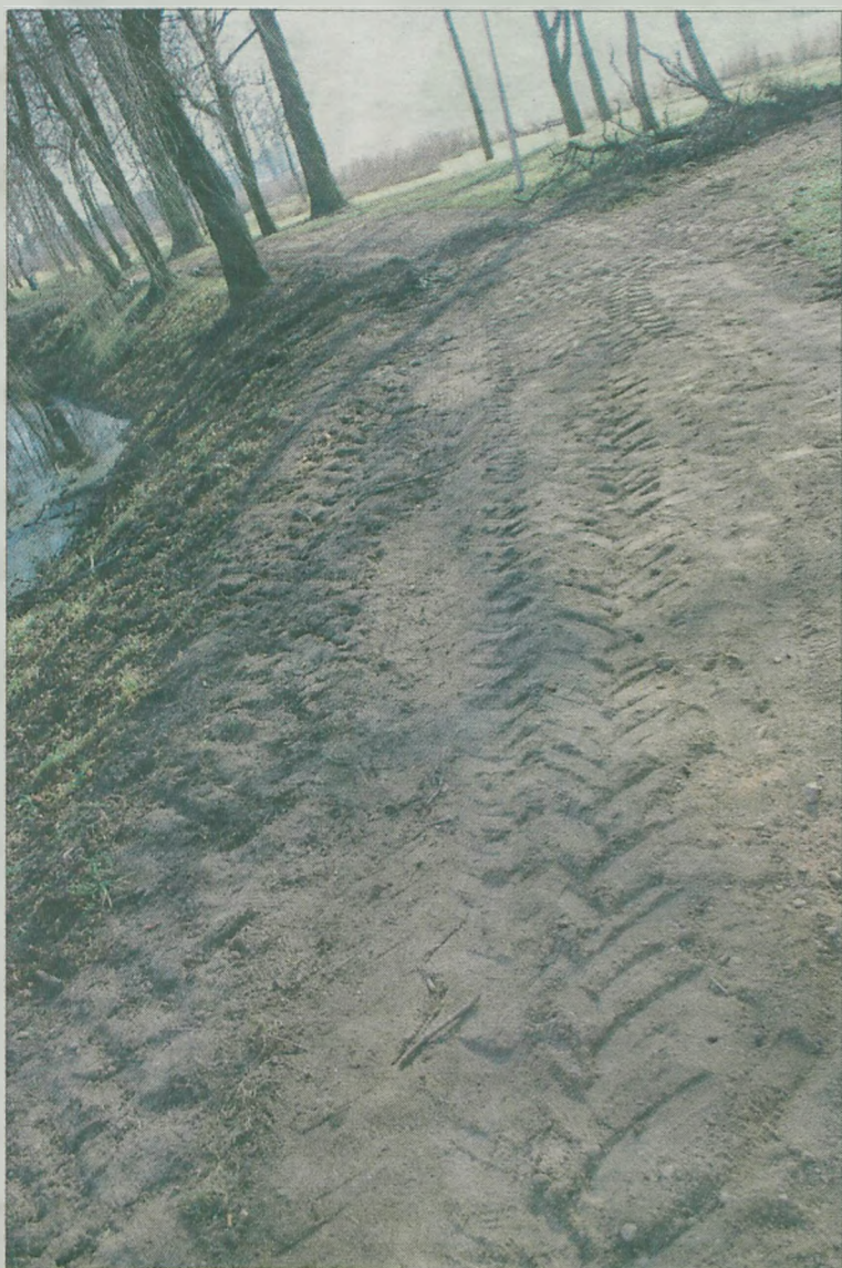
Rozjechane parkowe alejki.