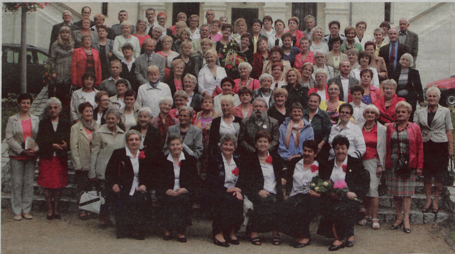
Pamiątkowe zdjęcie studentów pierwszego roku.

wykładowcom i sponsorom. Wyraziła nadzieję, że będą wspomagały Uniwersytet Trzeciego Wieku w Uniejowie, także w następnych latach. Zamkową uroczystość oświetlił swoim występem Chór „Kantylena” złożony w większości ze studentek UTW. (art)