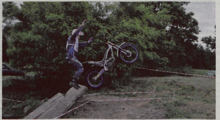
Pokonywanie przeszkód nie zawsze kończyło się sukcesem