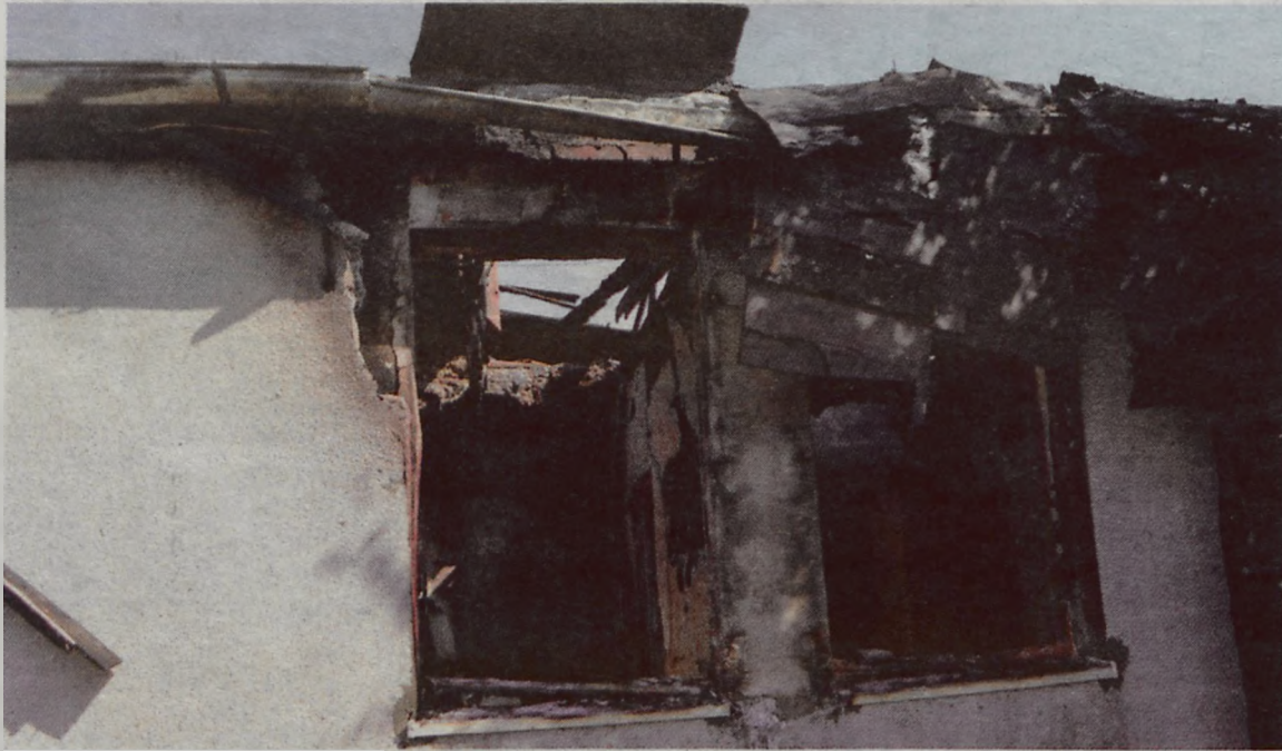
Ogień powstał od niedopałka papierosa, który jeden z lokatorów baraku położył na pufie.

stał na pufie. Po czym wraz z gościem, który przyszedł w „odwiedziny” błogo zasnęli. Obudziło ich dopiero walenie do drzwi. Gdyby nie czujność mieszkanki „15”, biesiadnicy spłonęliby żywcem, a w najlepszym razie zaczęliby się wcześniej.