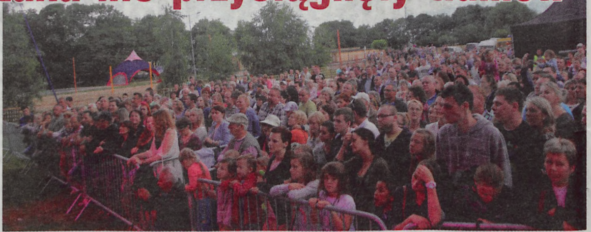
Choć na pierwszy rzut oka wydaje się, że w niedzielę na OSiR przyszły tłumy, nie było ich widać podczas kulinarnych pokazów.