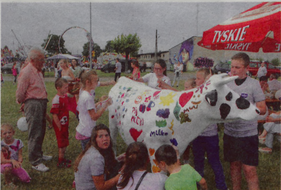
Dzieciaki malowały krowę turkowskiej mleczarni.