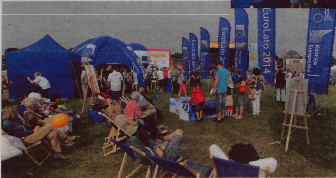
Można było również zagrać w bule, czy po prostu zrelaksować się na leżakach.