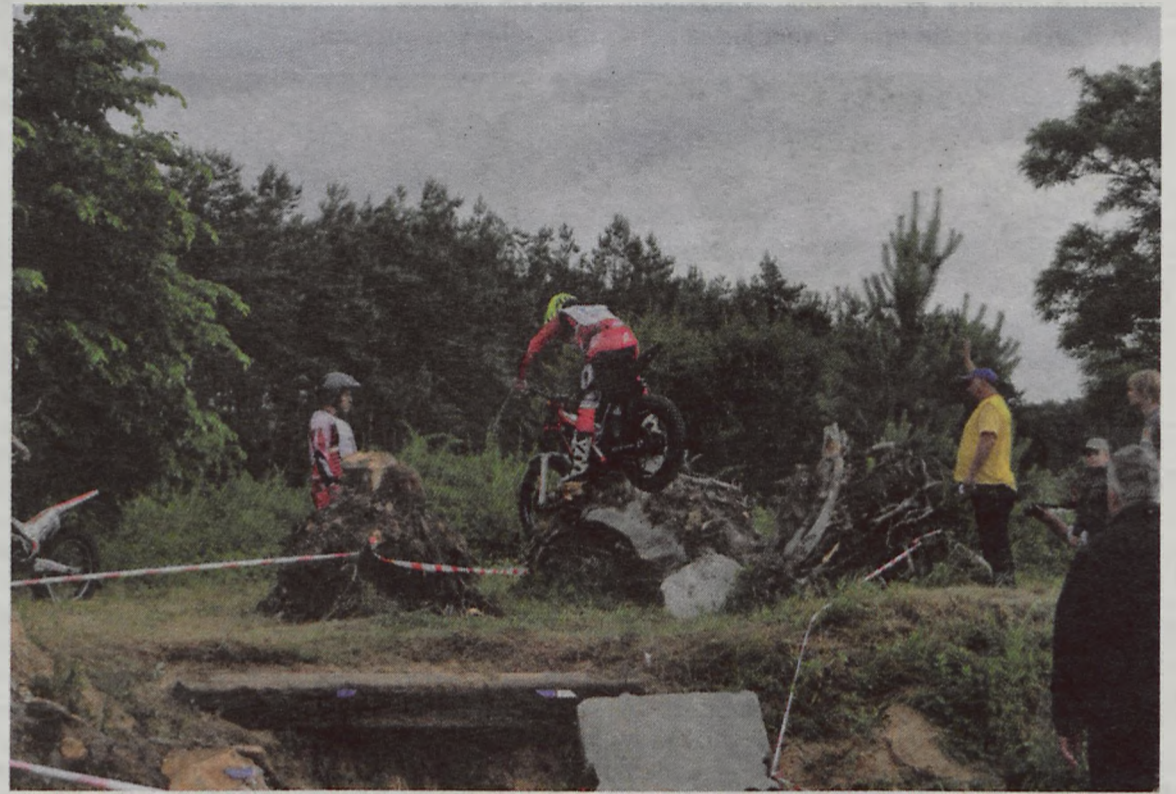
Zawodnicy musieli zmierzyć się z wymagającymi przeszkodami, między innymi konarami drzew.