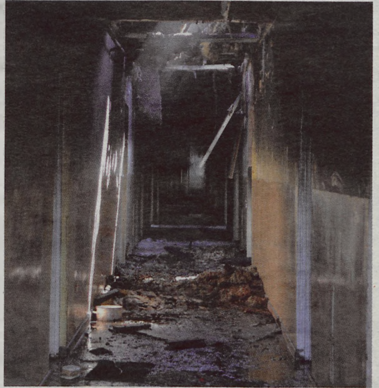
Do pożaru baraku przy ulicy Polnej doszło w piątkową (26 czerwca) noc.

Przyczyną pożaru, jak wynika ze wstępnych oględzin i przesłuchań świadków, był niedopałek papierosa, który mieszkaniec nieszczęsnej „trzynastki” zo-