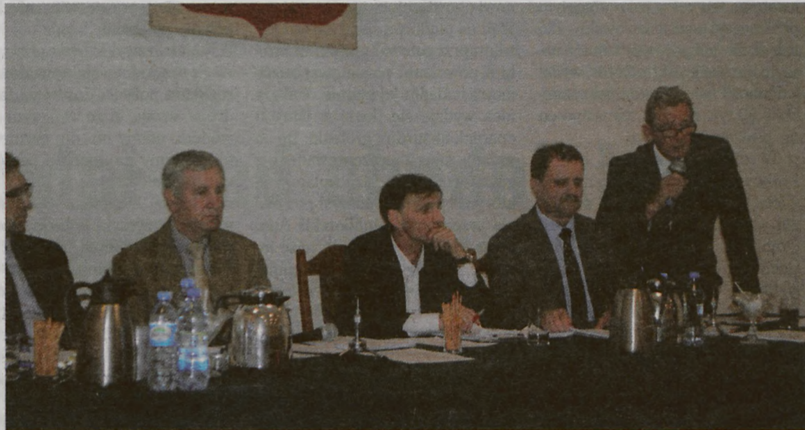
Zabrakło jedynie absolutorium, bo chyba oraz pierwszy w historii powiatu, nawet Regionalna Izba Obrachunkowa, przychyliła się do wniosku komisji rewizyjnej, by go nie udzielić włodarzowi gminy.

niepotrzebne koszty obsługi prawnej z tym związane, wypłacanie diet członkom orkiestry dętej, kolejne źle rozliczone fundusze sołectkie – tym razem w Małoszynie czy zatrudnienie radcy prawnego na czas nieokreślony. Poruszyli oni też temat narażenia gminy na straty w związku z budową Orlika (nad którą to sprawą zastanawia się też sąd, ale stoi ona w miejscu ze