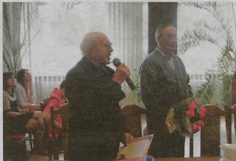
Były kwiaty i laurki...

–Komisja rewizyjna stwierdziła, że ta analiza daje podstawy do wyrażenia negatywnej opinii o wykonaniu budżetu gminy Władysławów oraz do wystąpienia do Rady