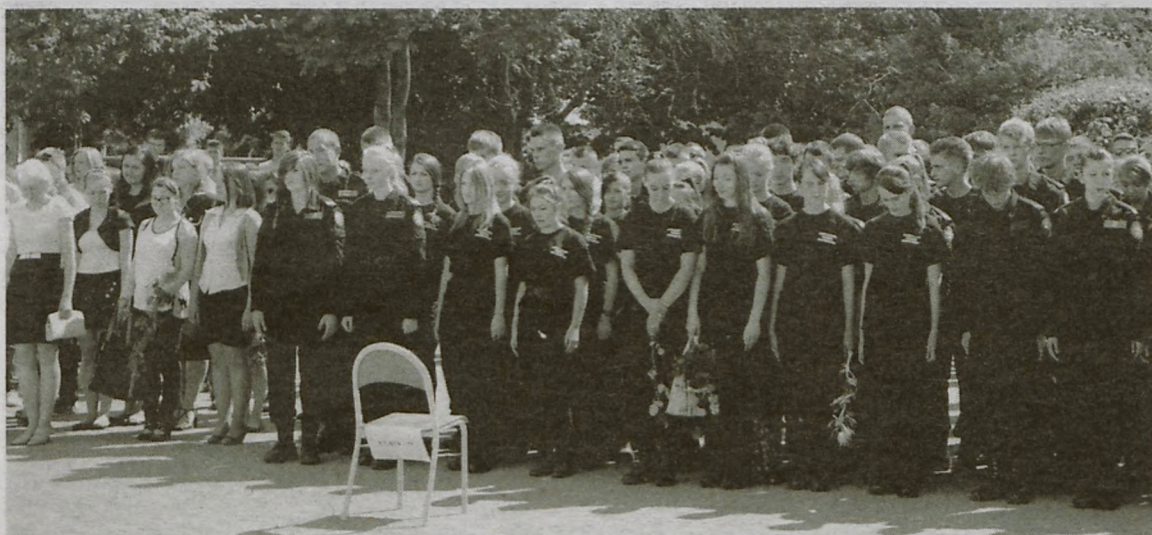
Uroczystość zakończenia roku szkolnego odbyła się na placu apelowym.

Uczniowie Zespołu Szkół Rolniczych w Kaczkach Średnich, pożegnali w miłym nastroju stary rok szkolny. Przed końcowym apelem udało się jeszcze obejrzeć pracownię językową, której wyposażenie ufundowała jedna z firm udzielających pożyczek.