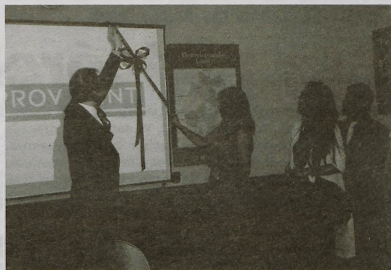
Oddano do użytku nowe wyposażenie sali językowej.