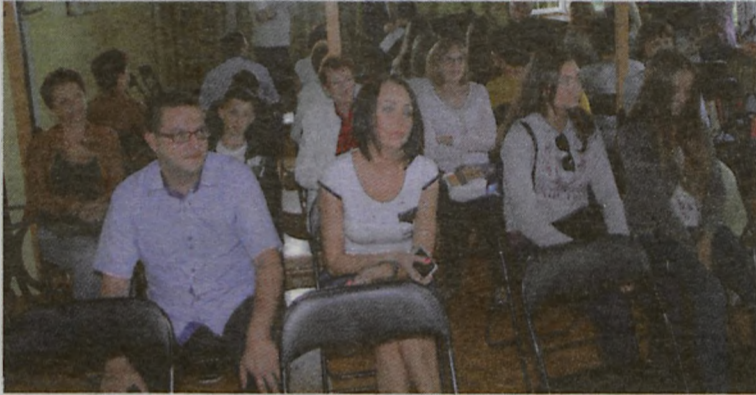
Egzamin miał charakter otwarty.

Nie ogranicza się tylko do nauki śpiewu klasycznego, ale także muzyki rozrywkowej, na którą jak twierdzi młodzi ludzie bardziej się otwierają. Stara się uczyć bezstresowo, dzięki czemu uczennice nie straciły entuzjazmu.