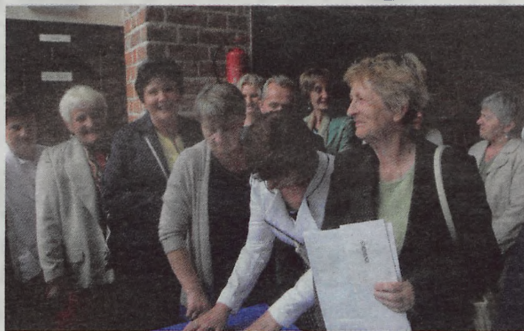
Ostatni przed wakacjami podpis na liście obecności.

można było również zagrać w bule, czy po prostu zrelaksować się na leżakach.