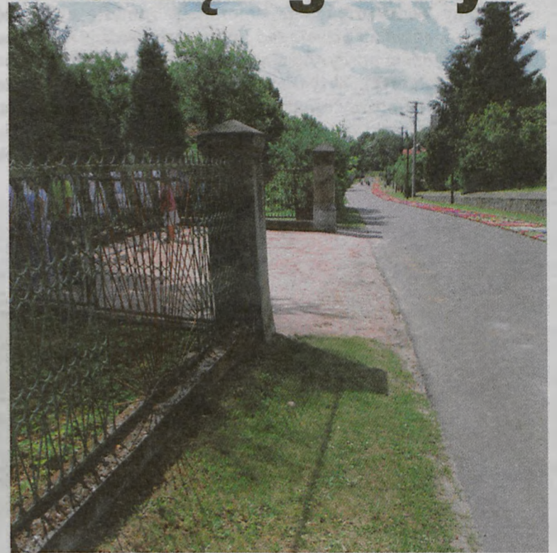
Tutaj miał być chodnik na Boże Ciała.