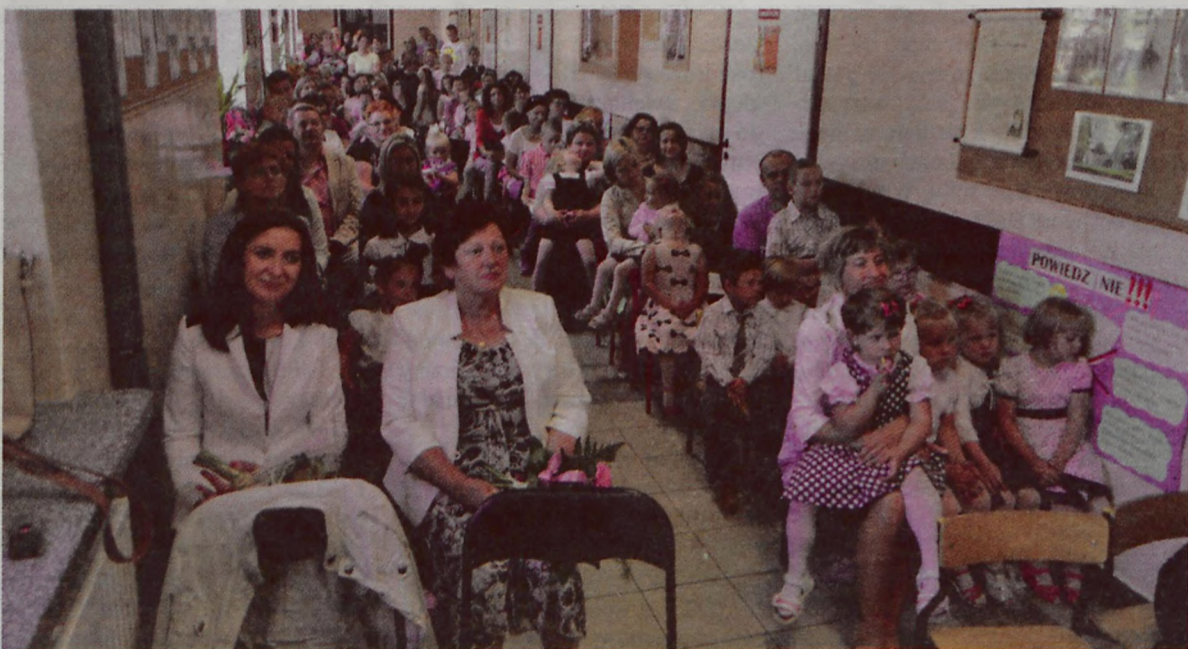
Pelen korytarz dzieci i rodziców podczas zakończenia roku szkolnego.

O aktywności uczniów z Turkowic może świadczyć też liczba nagród, jakie otrzymali na koniec roku. -Rodzice mogli się przekonać o tym w Dniu Laureata. Pomyliłam się niewiele, kiedy zapowiadałam, że chyba pięć godzin będę wręczać