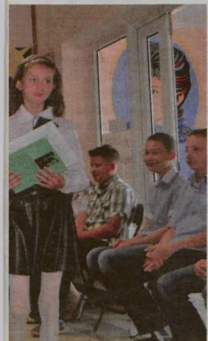
y Rady Rodziców wręczali nagrody