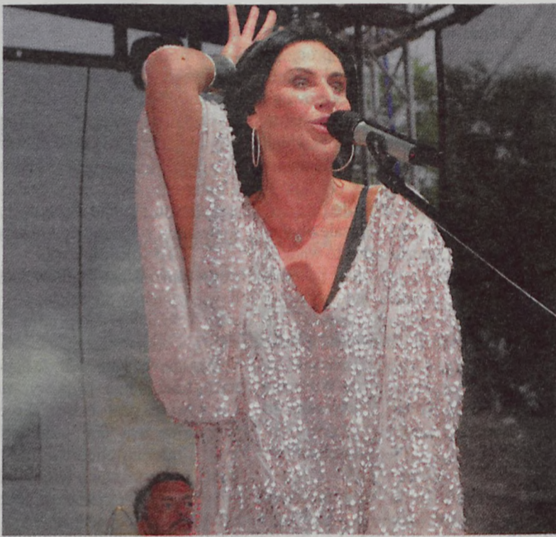
Bardzo smaczną, muzyczną ucztę zapewniła Kayah.