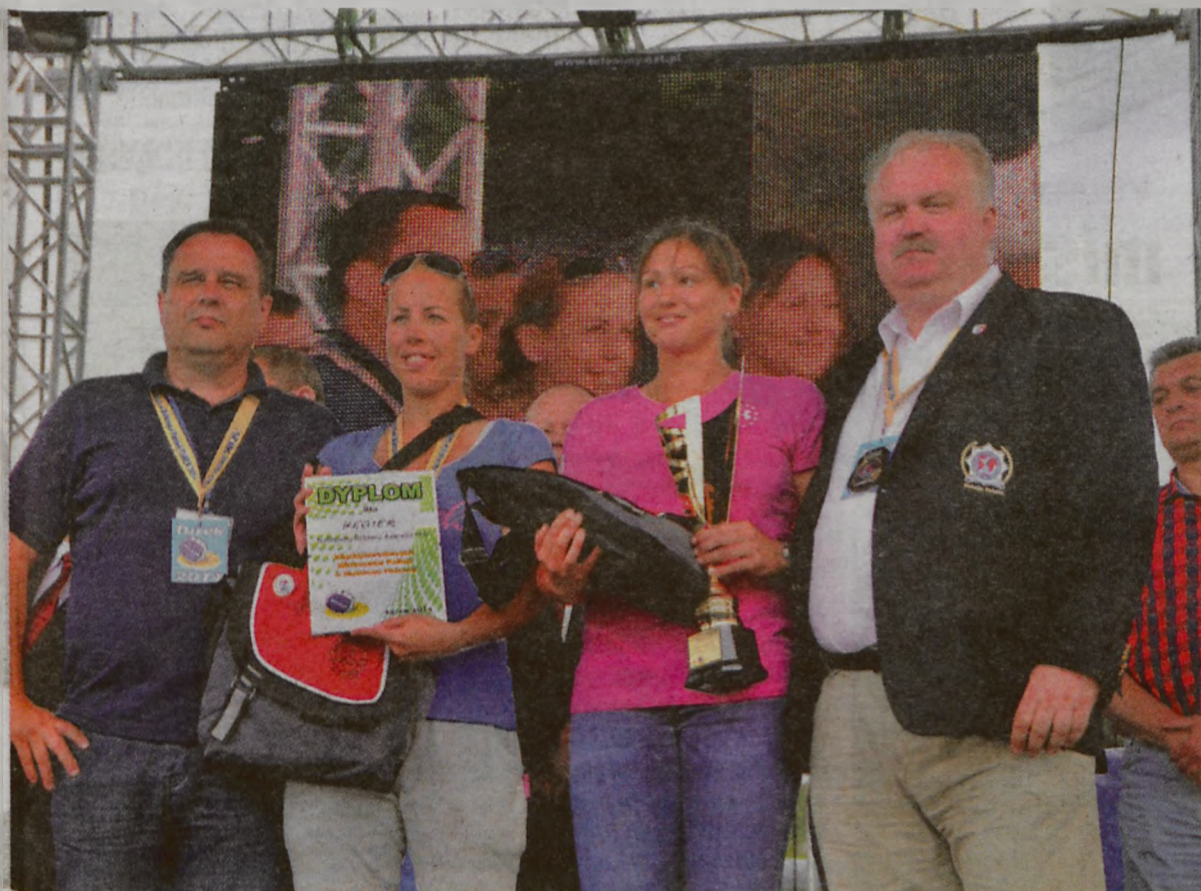
Najlepszą drużyną zagraniczną zdaniem organizatorów został team z Węgier.