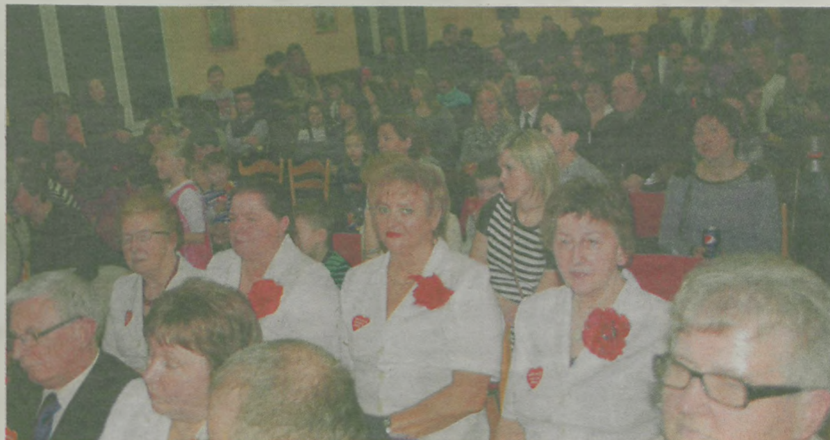
Sala wypełniła się chętnymi do wsparcia akcji.