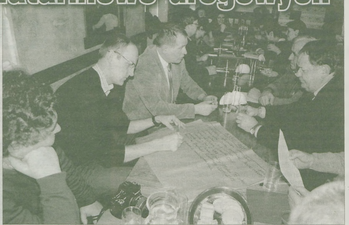
W warsztatach wzięło udział około sześćdziesięciu osób. Dobre i złe strony gminy Kawęczyn spisywano na arkuszach szarego papieru.

mocnych i słabych stron gminy Kawęczyn. Podglądaliśmy, co też piszą. Wśród mocnych stron wymieniono między innymi: zwodociągowanie gminy, dobre położenie, miejsce pamięci martyrologii żydowskiej, bliskie położenie uzdrowiska Uniejów, promocję gminy i osiągnięcia drużyn sportowo-pożarniczych. Dobre położenie wydaje się stwierdzeniem trochę na wyrost. Nie ma tutaj przecież kolei, nie mówiąc nawet o lotnisku, a mały fragment drogi krajowej wydaje się znikomym atutem „dobrego położenia”. Nigdzie nie zauważyłem np. tak istotnej sprawy jak posiadanie trzech stadnin koni i wyznaczonych tras konnych i rowerowych. Nie wspomniano też nic o czystym środowisku przyrodniczym. Wprost przeciwnie, w słabych stronach jedna z grup stwierdziła brak walorów przyrodniczych. Zapomniano o wspólnych terenach bagiennych pomiędzy Gozdowem, a Lipiczem, gdzie gnieźdzą się liczne gatunki ptaków wodno-błotnych oraz że-