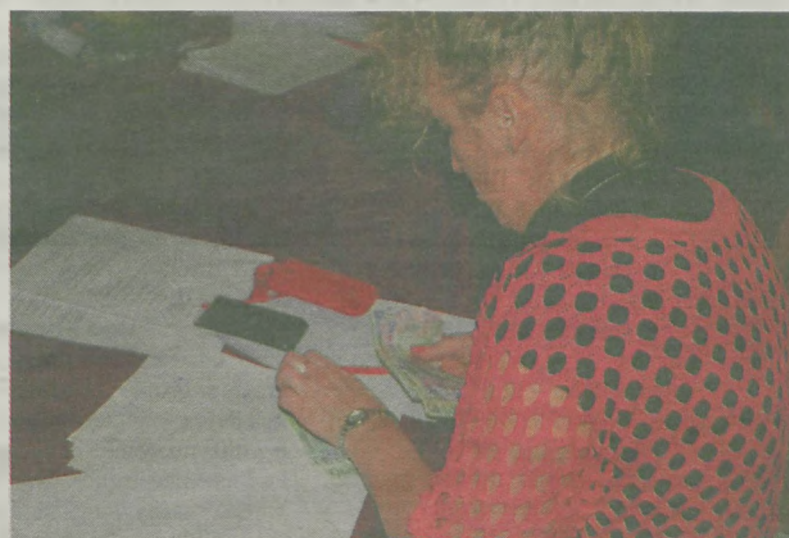
Główna księgową liczyła skrupulatnie każdą setkę.