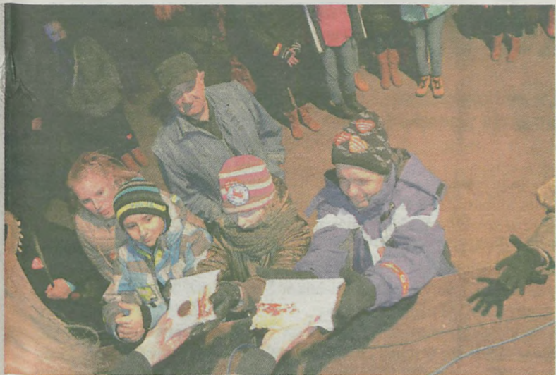
Turkowską tradycją stało się już rozdawanie wylicytowanych tortów, w tym roku słodkosciami dzielił burmistrz i starosta.