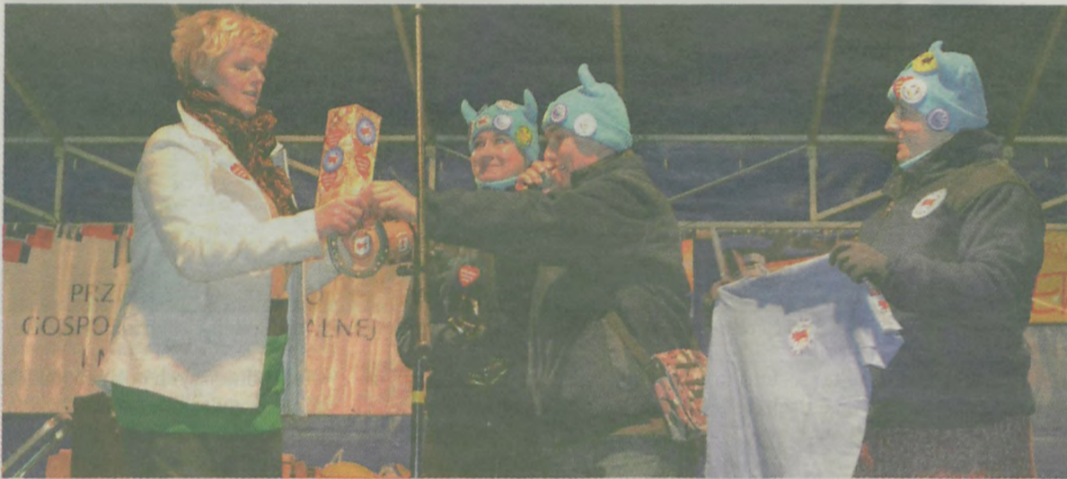
W niedzielne przedpołudnie turkowskie morsy wykopały się w przykońskim zbiorniku, później oddały też gadżety na licytację - klubową koszulkę, kubek i podkowę.