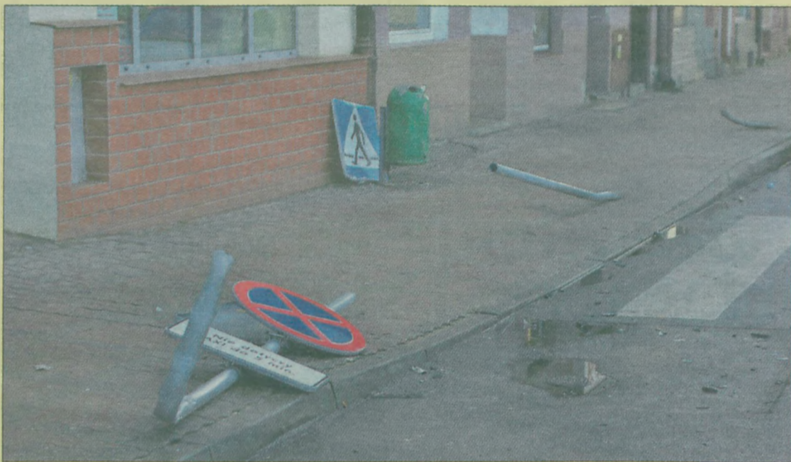
Pijany 17-latek mercedesem wjechał w kamienicę, ścinał trzy znaki i zatrzymał się w żywoptocie.