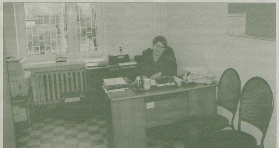
Zburzono ściankę z okienkiem, tworząc obszerny sekretariat.