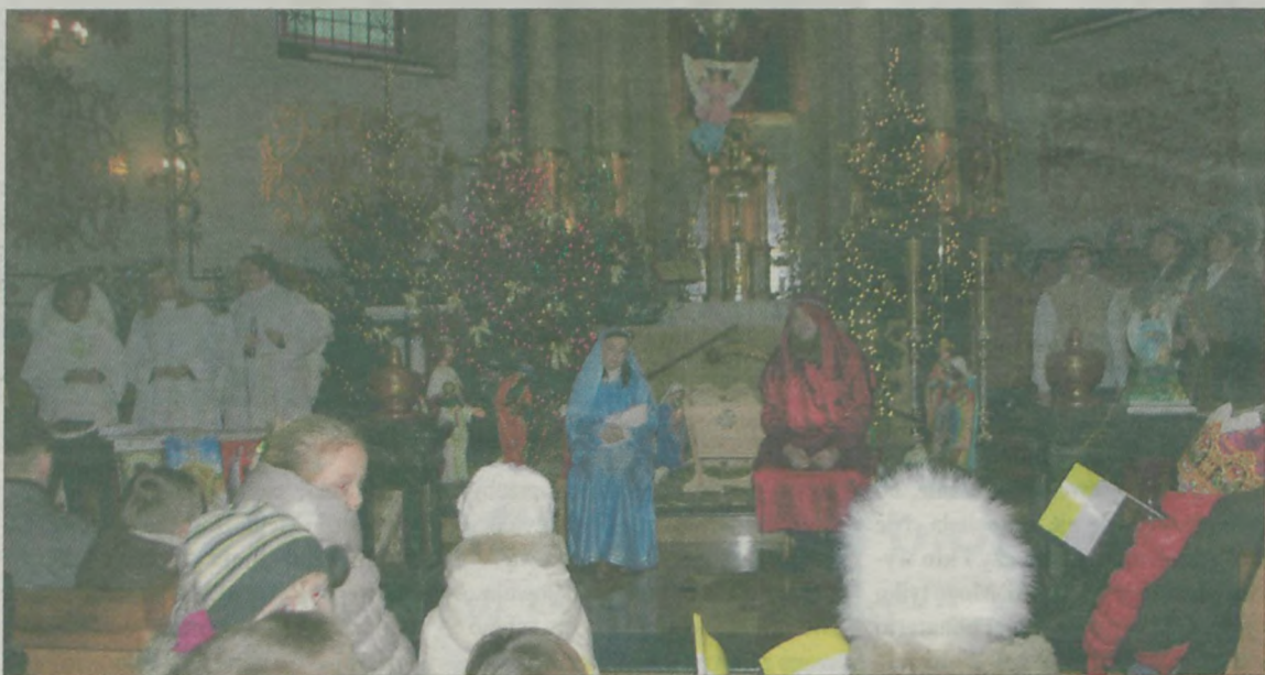
Przedstawienie przygotowali rodzice brudzewskich przedszkolaków.

Już od lat w Trzech Króli, w całej Polsce organizowane są przemarsze ulicami miast. W tym roku, święto postanowiono uczcić też w Brudzewie. W poniedziałkowe popołudnie, 6 stycznia, mieszkańcy miasta i gminy zbrali się w kościele, gdzie Kacper, Melchior i Baltazar złożyli dary Dzieciątku Jezus.