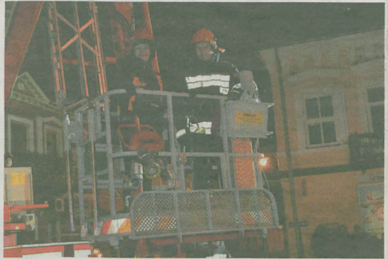
Jedna z fanek zimnych kąpeli, członek stowarzyszenia morsów, kupiła sobie przejażdżkę strażackim wysięgnikiem.