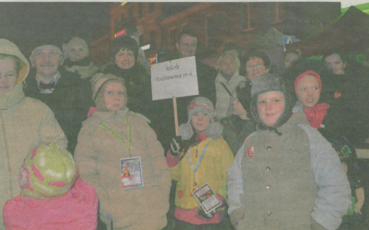
Uczniowie Szkoły Podstawowej nr 4 dzielnie podnosili tabliczkę, spędzili przed sceną kilka godzin, by wydać uzbieraną wcześniej tysiąc złotych.

zapłacili 1500 zł za słodkości – trzy serniki serca.