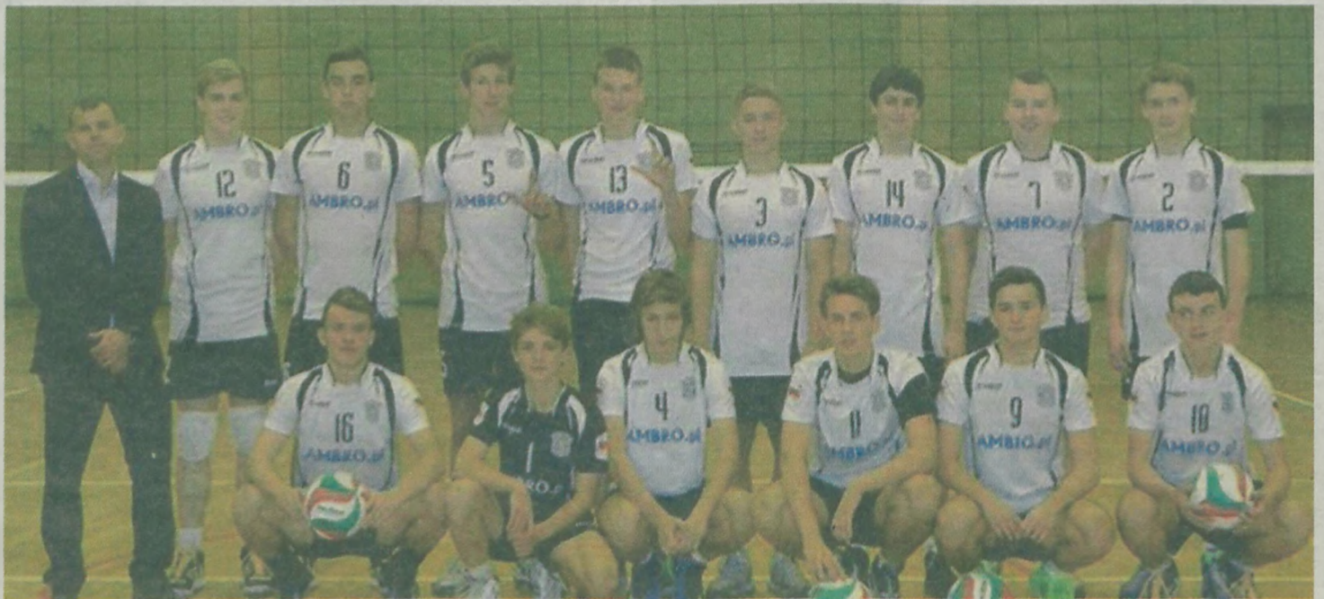
Drużyna kadetów MKS MOS Turek.