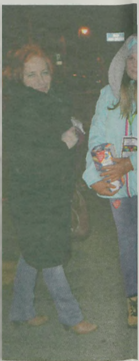
Aktywnie licytowali ta