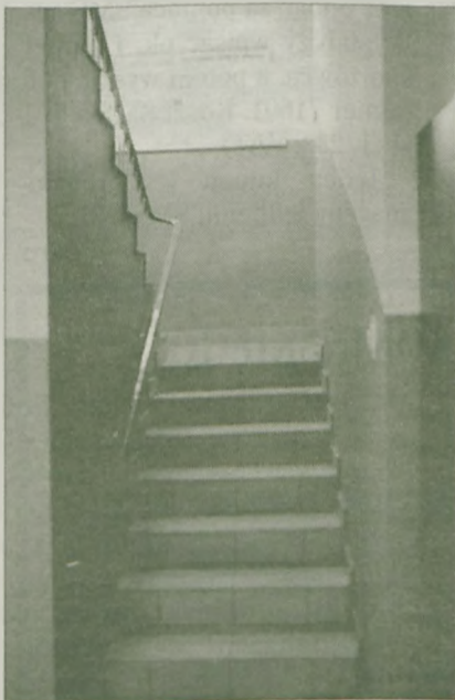
Wyremontowana klatka schodowa.