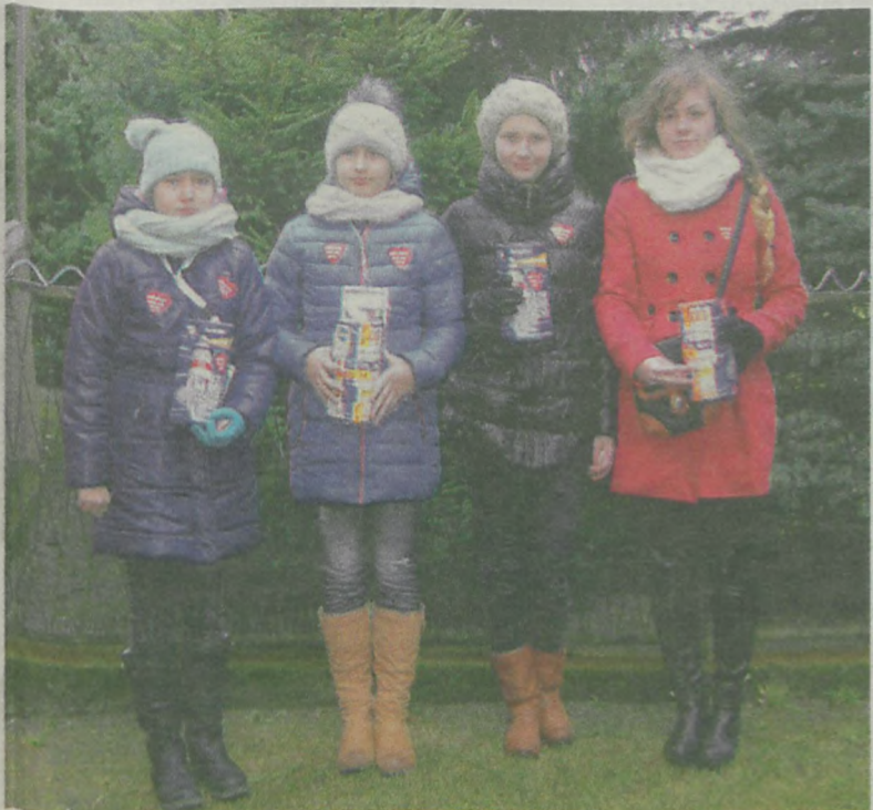
Wolontariuszki z Wyszyń nie narzekały na brak hojności.

Po raz piętnasty zagrała w Dobrej Wielka Orkiestra Świątecznej Pomocy. Dla tutejszego sztabu pracowali wolontariusze z czterech gmin. W Dobrej i dwóch sąsiednich gminach zebrano 13.227,26 złotych. Wszystko wskazuje na to, że kiedy wpłyną pieniądze z Władysławowa zostanie pobity ubiegłoroczny rekord.