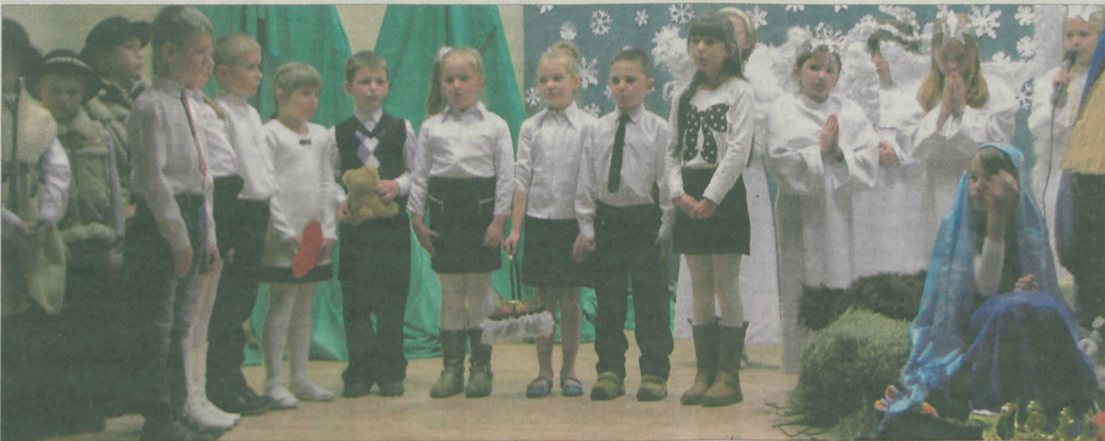
W przedstawieniu grali uczniowie klas I-V.