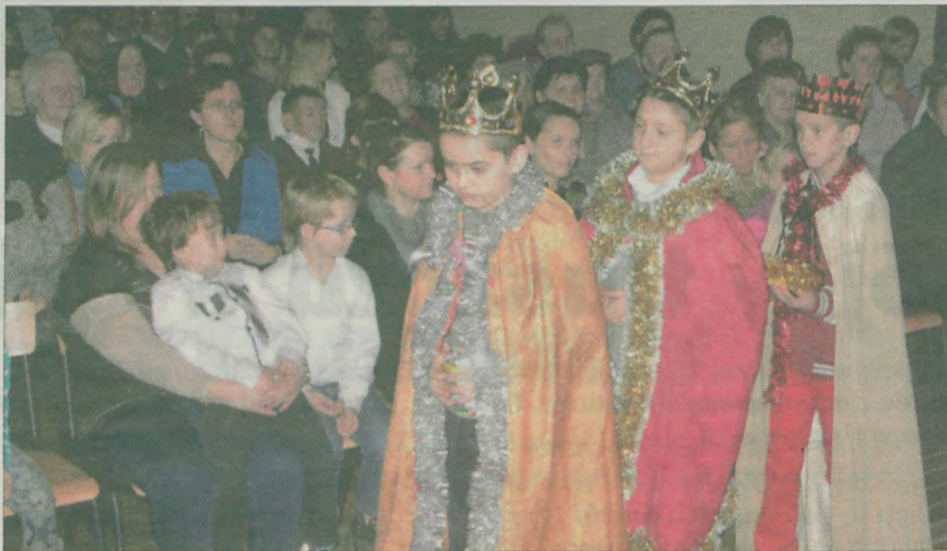
Przed pełną widownią przemaszerowali Trzej Królowie.