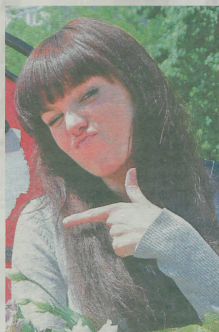
Ewa Farna została czwartym jurorem w programie „X Factor”. W 2010 roku zasiadła na ławeczce „Przeglądu Konińskiego”

Ruszyły castingi do popularnego programu emitowanego przez TVN. Skład jury się powiększył – obok Kuby Wojewódzkiego, Tatiany Okupnik i Czesława Mozila w tym sezonie zobaczymy Ewę Farną.