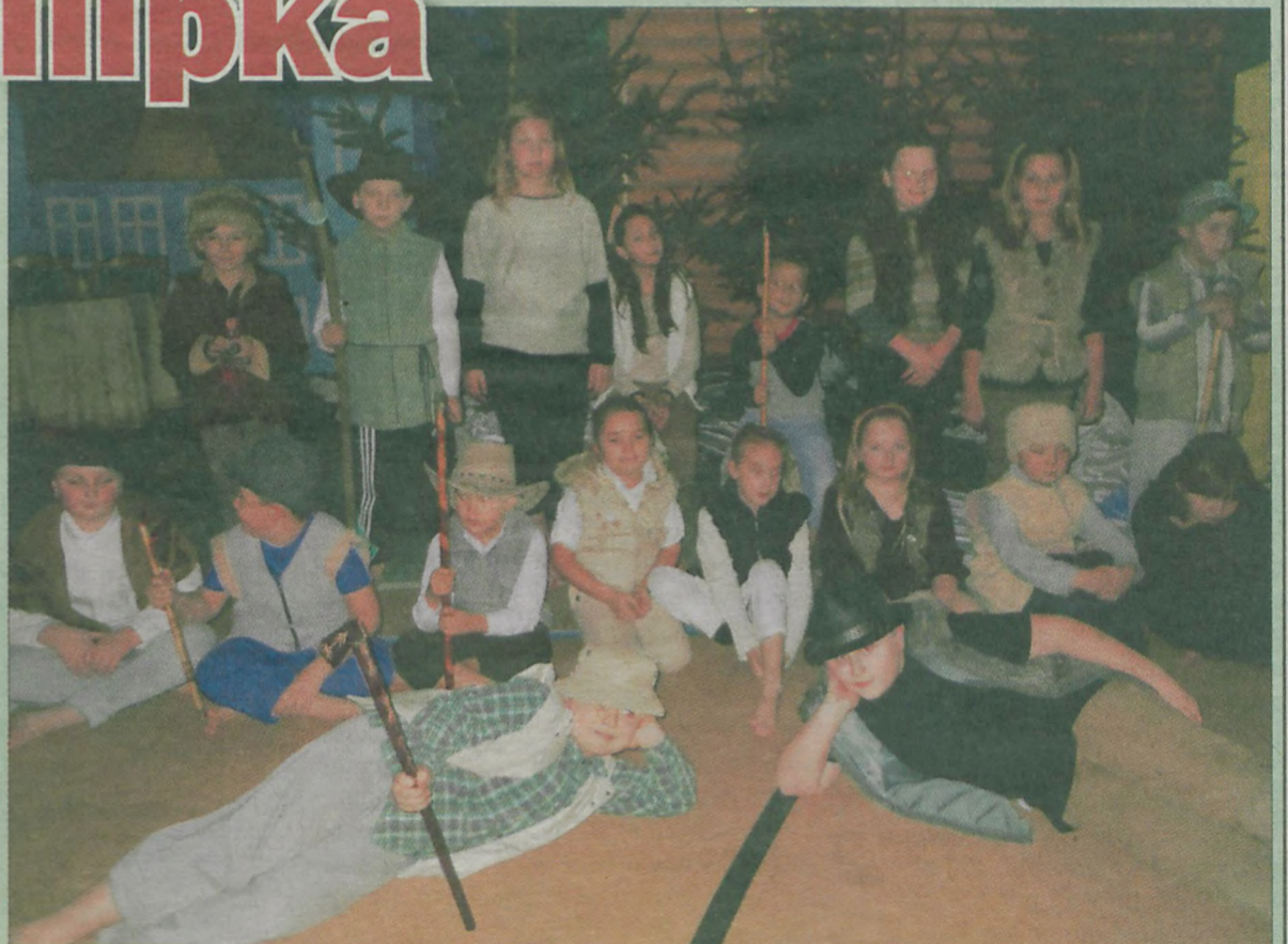
Jasełka „Jest taki dzień”, które odbyły się zarówno w szkole, jak i w kościele w Kunach.