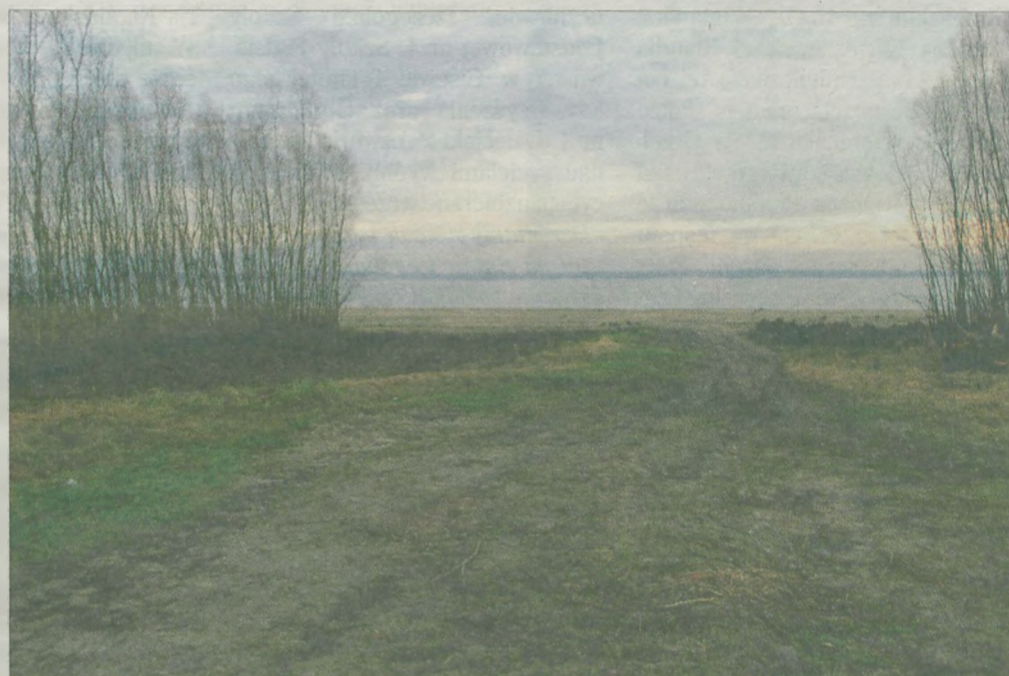
Mieszkańcy odkrzaczyli fragment zarośli obok starej drogi, odsłaniając zbiornik Jeziorsko.