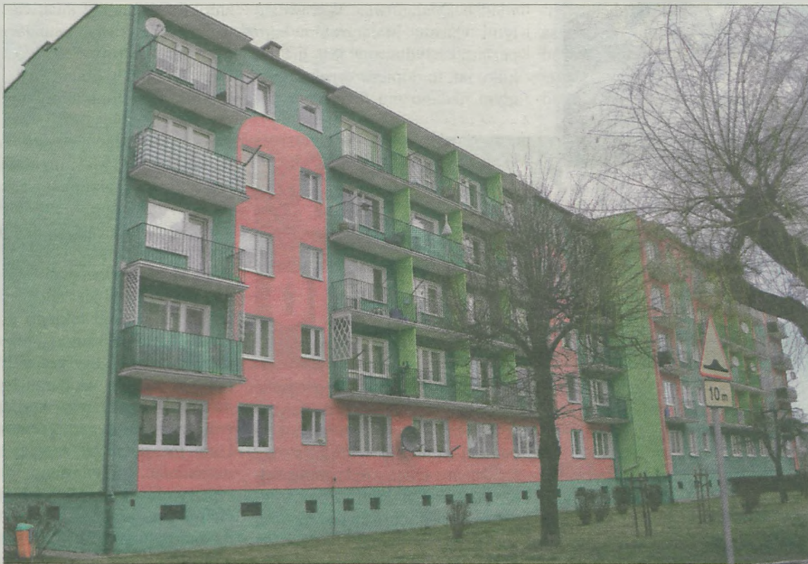
W kontekście wydarzeń jakie działy się w tym bloku przed wigilią trudno zgodzić się ze słowami piosenki „Jak dobrze mieć sąsiada”.

Wtedy to oni wezwali funkcjonariuszy. Jak przyznaje kobieta, dopiero po interwencji policjanta,