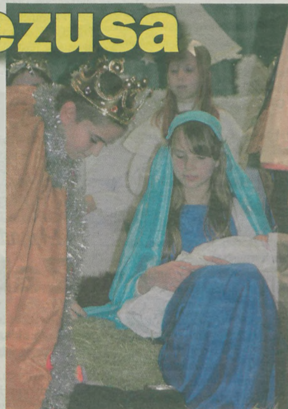
W ubogiej stajence.