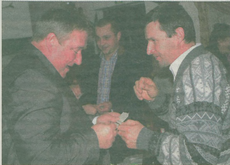
Ludowy łamali się opłatkiem i składali sobie noworoczne życzenia.

Pochodzący z Łowicza wicewojewoda Bejda podziękował uniejowskim działaczom za wszystko dobre, co robią na rzecz gminy Uniejów, powiatu poddębickiego i województwa łódzkiego. Przywiózł też, jak powiedział, „dobrą wiadomość” od wicepremiera Janusza Piechocińskiego. Otóż rząd zdecydował, że zamiast planowanych 250 mln zł, na budowę i remont dróg lokalnych przeznaczy okrągły miliard. Apelowal również o uczestnictwo w wyborach do parlamentu europejskiego. Zaznaczył przy tym, że osiemdziesiąt procent