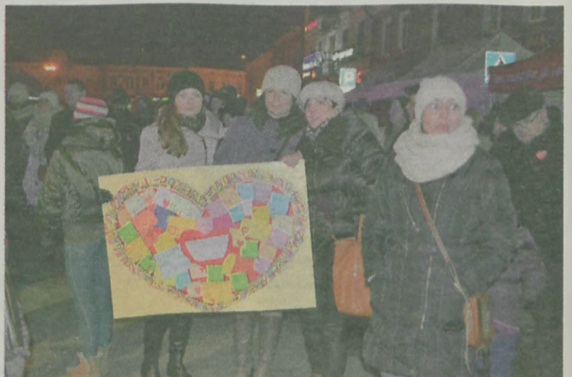
Kupione przez urzędniki za składkowe pieniądze dzieła sztuki zawisną na ścianach turkowskiego magistratu.

Pieniądze wpływały też bezpośrednio do sztabu: z SP nr 5, Przedszkola Samorządowego nr 5, od nowego stowarzyszenia „Przyjacie-