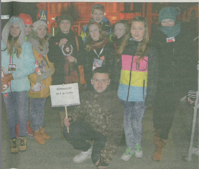
Wali także gimnazjaliści z „jedyńki”.

le Sportu” ze Słodkowa (286,10 zł), od związku zawodowego górników kopalni Adamów (300 zł), z turkowskiego basenu (154,73 zł) oraz z meczu, który odbył się w niedzielne przedpołudnie na hali sportowej (2193,43 zł).