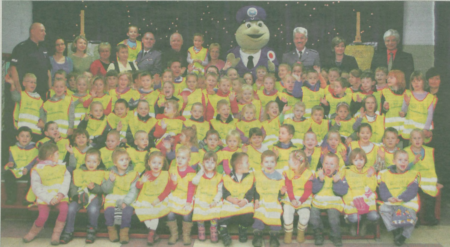
Odblaskowe dzieci ze Szkoły Podstawowej i Przedszkola w Przykonie.