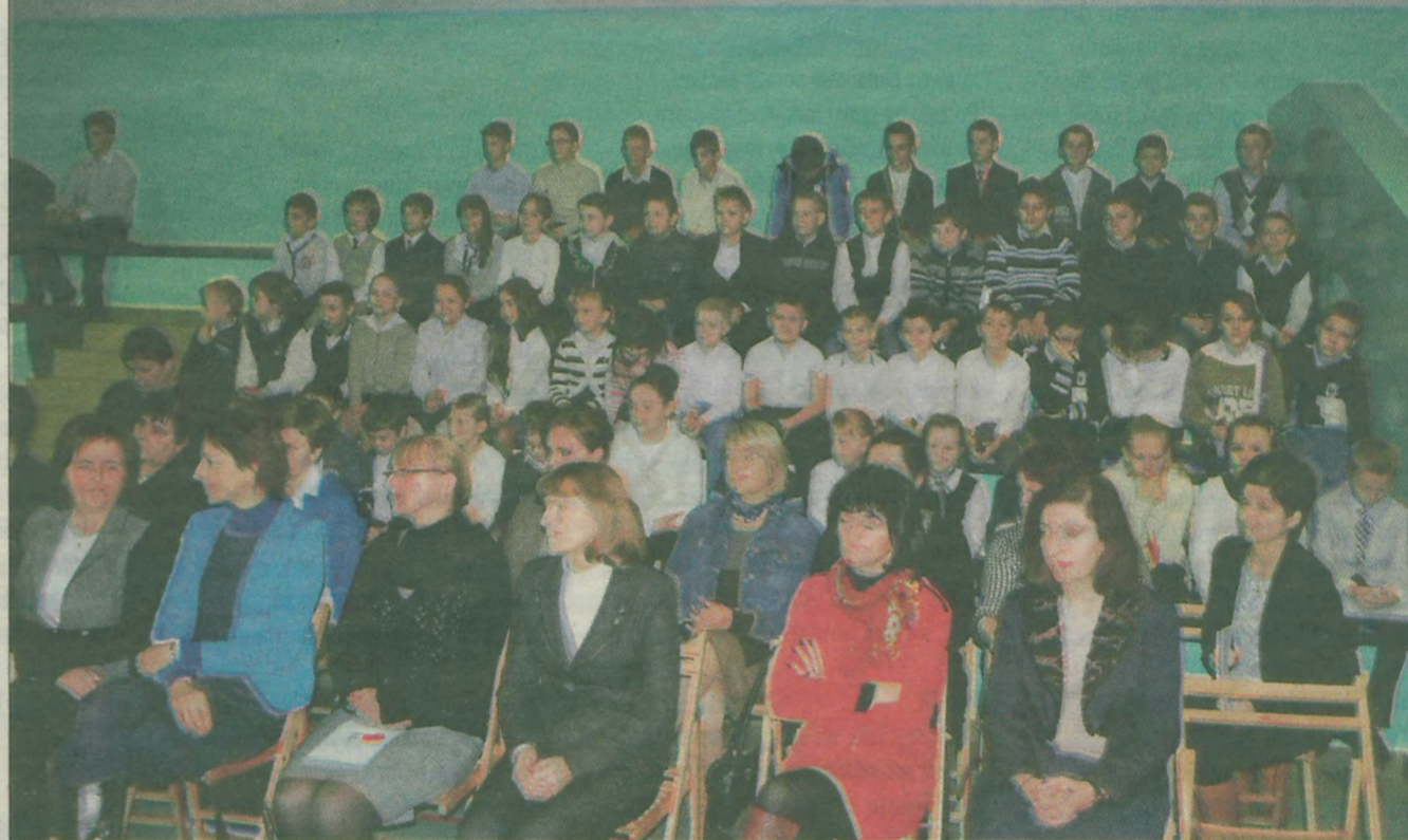
Widownia zapełniła się uczniami, nauczycielami i gośćmi.