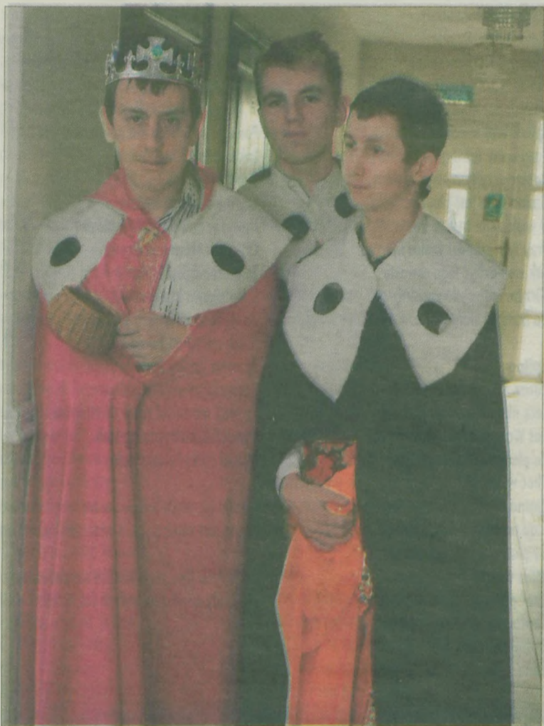
Trzej królowie w oczekiwaniu na swoje wejście.