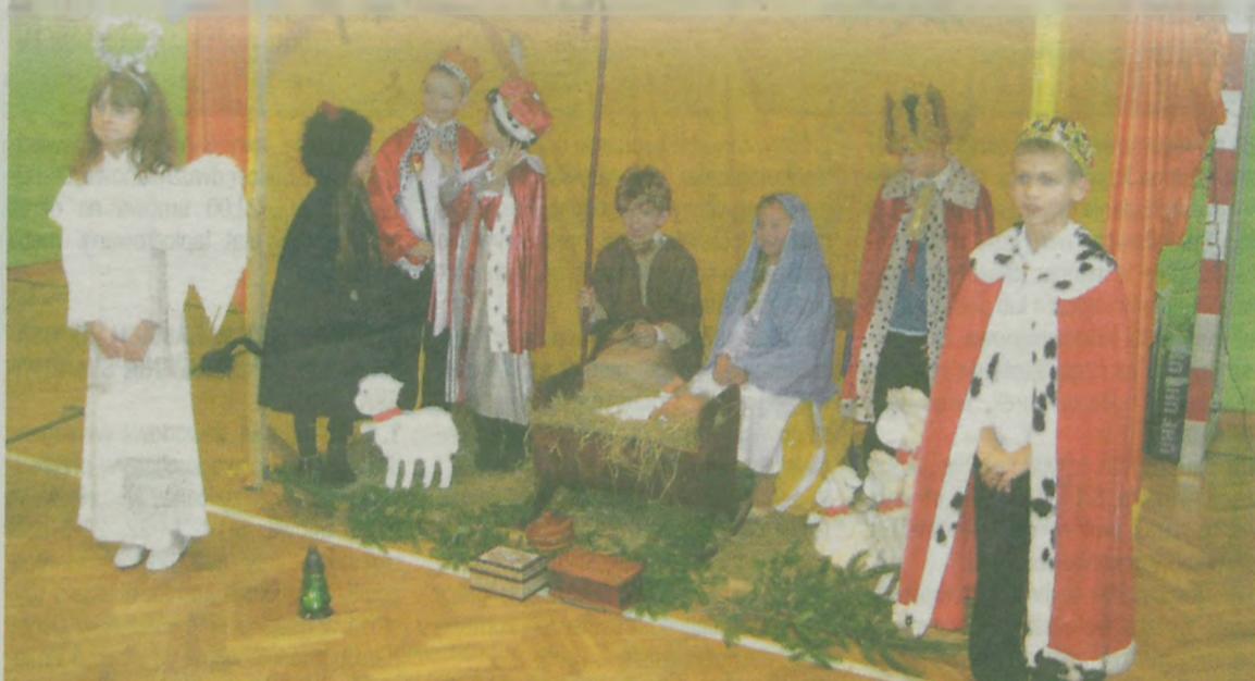
W tym roku Jasielka przygotowali uczniowie klas III i IV Szkoły Podstawowej w Wyszynie.