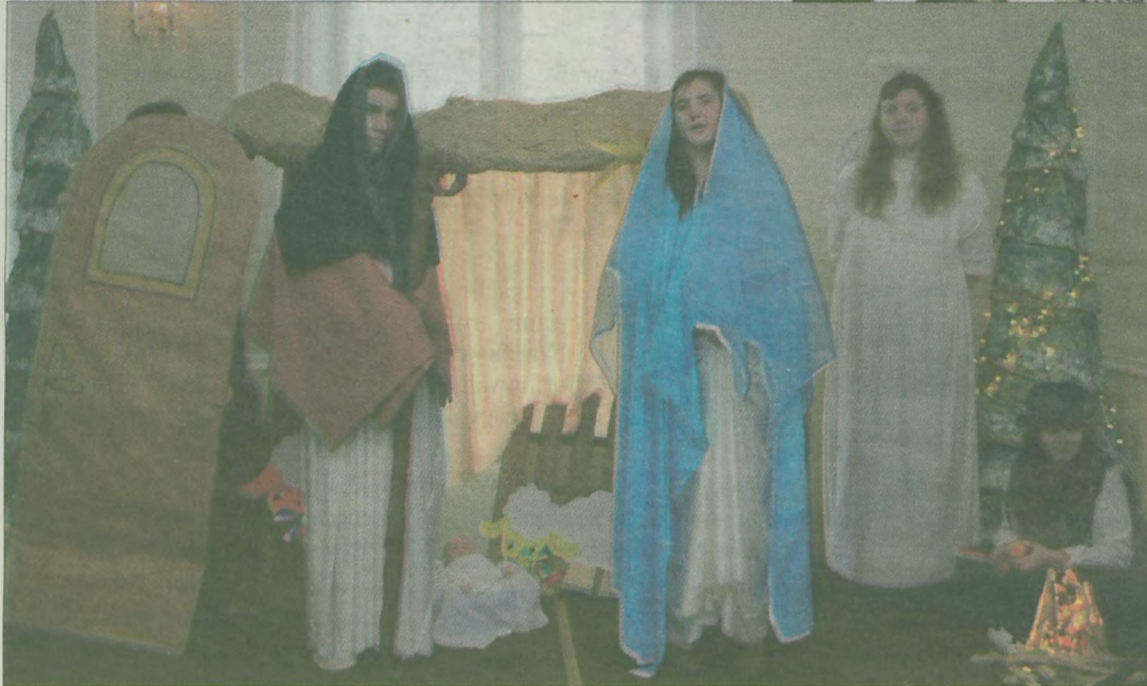
Obejrzano jasełka w wykonaniu wychowanków Specjalnego Ośrodka Szkolno Wychowawczego w Turku.