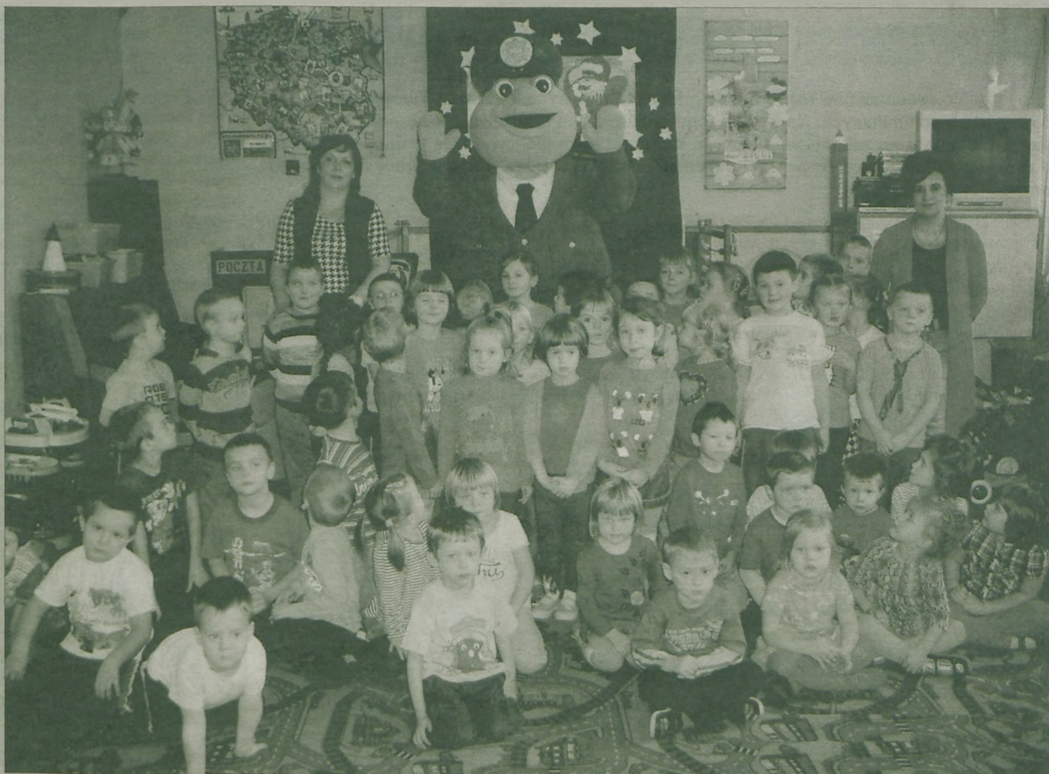
Maskotka wielkopolskiej policji – Pyrek wraz z dziećmi z Przedszkola Gminnego w Kowalch Pańskich.

z osobami nieznanymi. Tego dnia nie mogło zabraknąć wspólnych zabaw z Pyrkiem i pamiątkowego zdjęcia. boxa