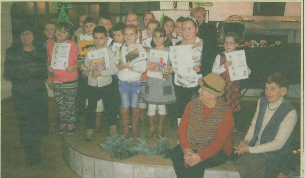
Laureaci konkursu z jurorkami.