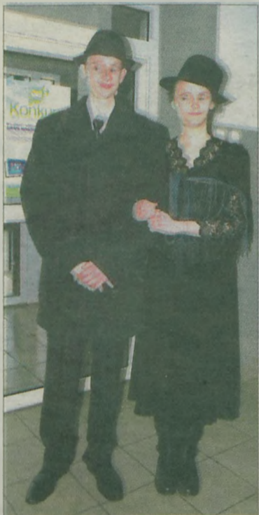
Przychodzących witali Maria i Piotr Curie.