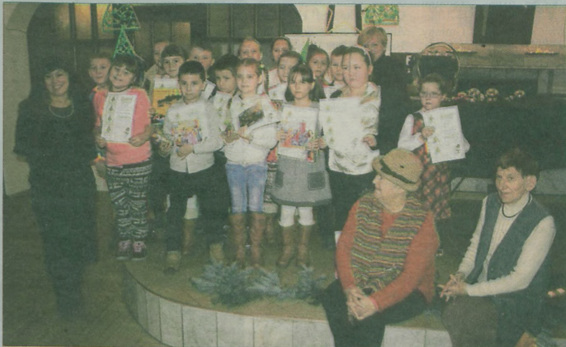
Laureaci konkursu z jurorkami.

Miejsko-Gminny Ośrodek Kultury w Uniejowie i Miejsko-Gminna Biblioteka Publiczna w Uniejowie. (art)