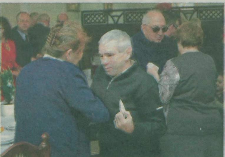
Łamano się opłatkiem i składano sobie życzenia.