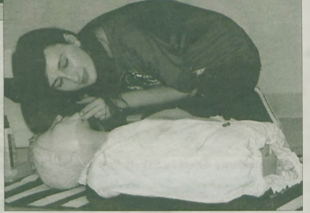
Najciekawsze były zajęcia z fantomem.