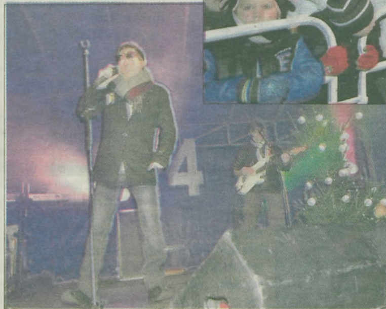
Gwiazdą sylwestrowej nocy był zespół Big Magic.

zespół, o czym świadczyła liczba osób zgromadzonych przed sceną.