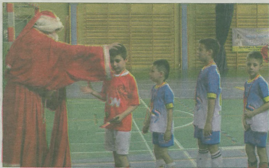
W kolejce do Mikołaja.