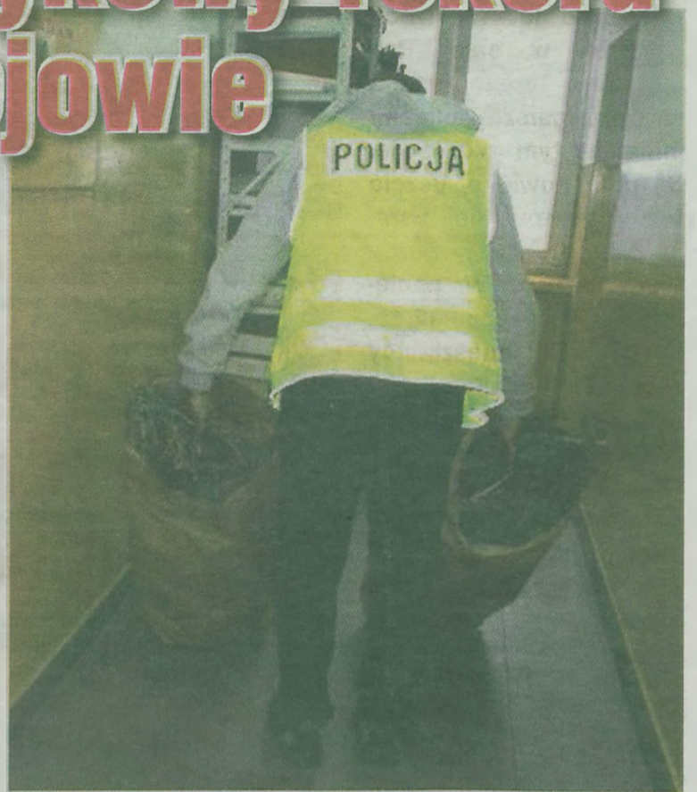
Policjant z dwoma workami przejętego suszu.

W dniu 11 grudnia 2013 roku kilkudziesięciu policjantów z Wydziału Kryminalnego Komendy Powiatowej w Poddębicach oraz Komendy Wojewódzkiej Policji w Łodzi, wczesnym rankiem, dotarło jednocześnie pod kilka adresów na terenie gmin Aleksandrów Łódzki i Uniejów. Podczas przeszukania u 33 letniego mieszkańca Uniejowa policjanci znaleźli dwa worki z marihuaną o łącznej wadze 3660 gramów, co jest największą jak dotychczas ilością narkotyku odnalezioną w Uniejowie. Jej wartość czarnorynkowa to około 100.000 zł. Mężczyzna został zatrzymany i odpowie za posiadanie znacznej ilości środków odurzających. Grozi mu za to kara pozbawienia wolności do 10 lat. (art)