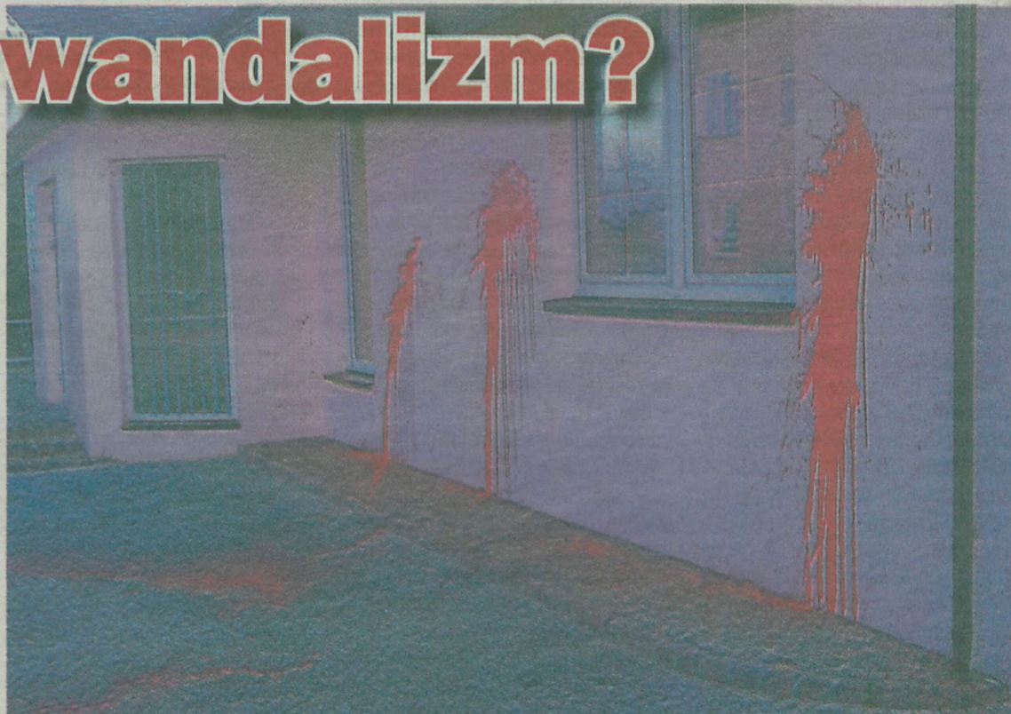
Właścicielka przychodni straty oszacowała na 13 tysięcy złotych.