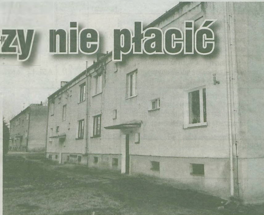
Za wywóz śmieci nie płacą mieszkańcy czterech bloków w Chylinie. Problem dotknął 18 rodzin, które od pół roku czekają na zmianę decyzji wójta.