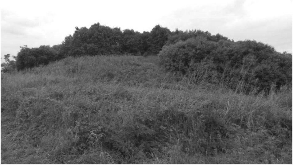
Il. 4. Bnin – grodzisko stożkowate w 2012 r.

oparta na podwalinie z bierwion dębowych, na których posadowiono konstrukcje skrzyniowe wypełnione piaskiem. Stabilizowały one piaszczysty nasyp, który od strony południowej i północnej zabezpieczono dodatkowo palisadowym płotem. Na tak przygotowanym wyniesieniu zbudowana została drewniana wieża mieszkalno-obronna otoczona palisadą, która uległa spaleniowi i jej bryły nie można już odtworzyć. Gruba warstwa spalenizny pozwala sądzić, że była to jednoprzestrzenna, kilkupoziomowa budowla, jakie w tym czasie zaczęto wznosić na ziemiach polskich 20 . Wieże mieszkalno-obronne budowano w zachodniej Europie od 1000 roku (najstarsza z nich to dwór na kopcu hrabiów Blois w departamencie Loir-et-Cher we Francji 21 ). Z terenu północnej Francji idea wznoszenia dworów obronnych została przeniesiona do Niemiec i Danii; ich formy stały się wzorem dla siedzib „panów gruntowych” w państwie Piastów. Jak to ujął Stanisław Kołodziejski: „budowle te wznoszono w centrach prywatnych majątków ziemskich, były funkcjonalnie z nimi związane, zapewniały właścicielom włości mieszkanie i ochronę, a zarazem stanowiły ośrodki administracyjne kluczy majątkowych” 22 . Dodać należy, że