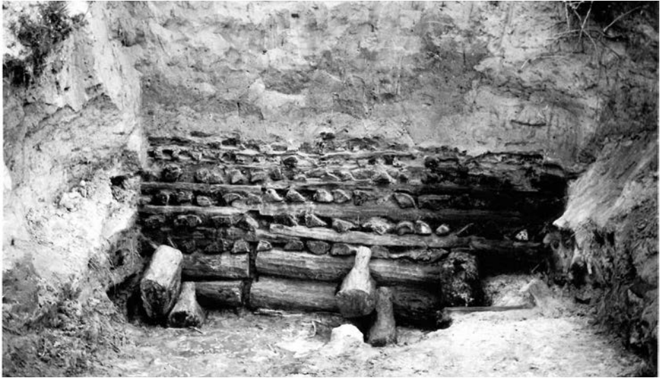
Il. 3. Bnin – grodzisko wczesnośredniowieczne; dolne partie konstrukcji dębowych wału obronnego.

się dachy. Zabudowę uzupełniały urządzenia gospodarcze, zapewniające samowystarczającą egzystencję mieszkańcom tej osady, opartą na uprawie roli i chowie zwierząt, uzupełnianym łowiectwem i rybołówstwem.