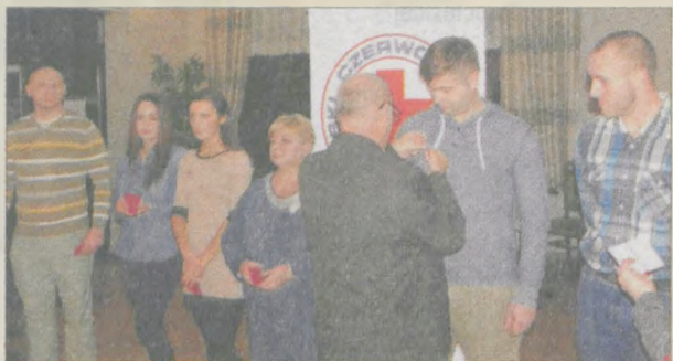
Z okazji święta krwiodawców kilkadziesiąt osób otrzymało odznaki honorowe. Ich stopień zależy od ilości oddanych litrów

► KLUB HONOROWYCH DAWCÓW KRWI przy oddziale rejonowym PCK w Jarocinie zaplanował w 2017 roku sześć jednodniowych akcji pobierania krwi, które odbędą się w salce dolnego kościoła ojców franciszkanów: 8 stycznia, 5 marca, 30 kwietnia, 25 czerwca, 20 sierpnia i 8 października. Krew można oddawać też w każdy wtorek w godz. 8.00-11.00. Franciszkanie od wielu już lat udostępniają na ten cel jedno z pomieszczeń klasztornych. Za tę pomoc zarząd PCK jest bardzo wdzięczny zakonowi i parafii św. Antoniego Padewskiego w Jarocinie.