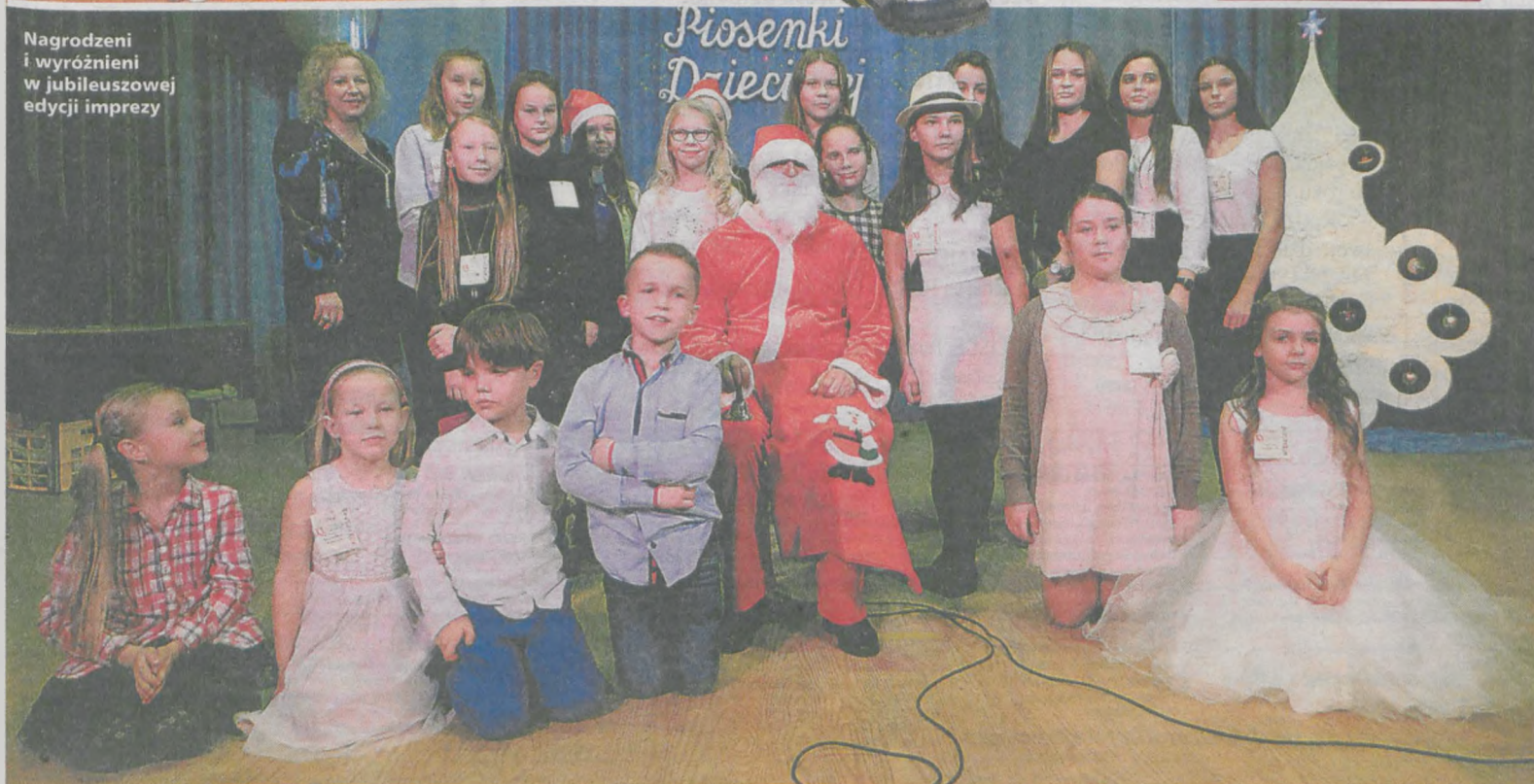
Nagrodzeni i wyróżnieni w jubileuszowej edycji imprezy