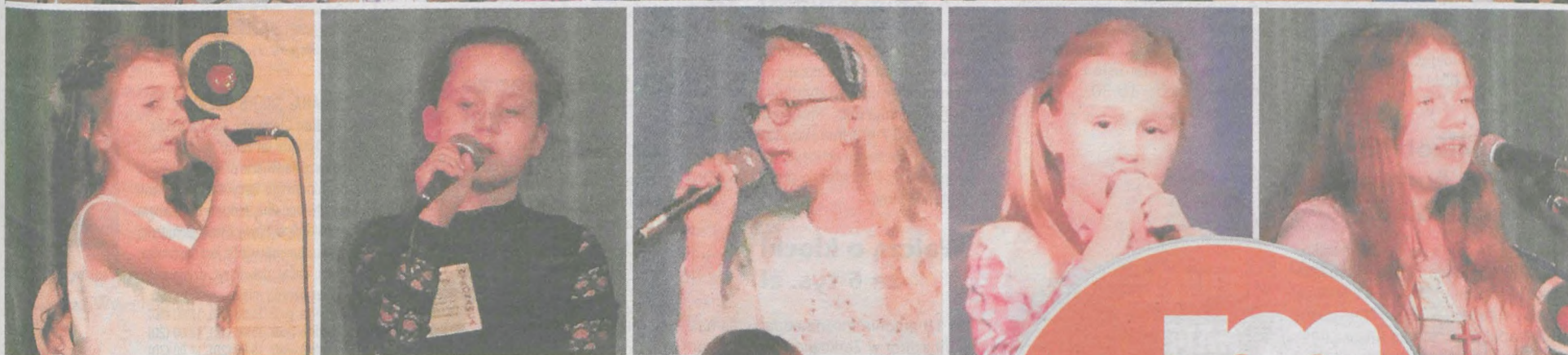
Finalistki i laureatki