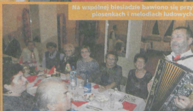
Na wspólnej biesiadzie bawiono się przy piosenkach i melodiach ludowych