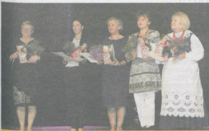
Twórcy ludowi, kierownicy zespołów zostali obdarowani przez przedstawicieli powiatu upominkami