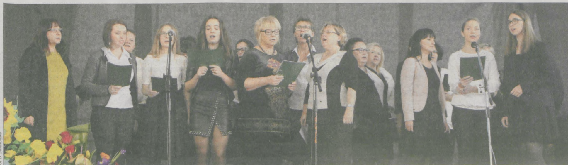
Piosenki, które wykonywał chór absolwentek, śpiewała cała widownia