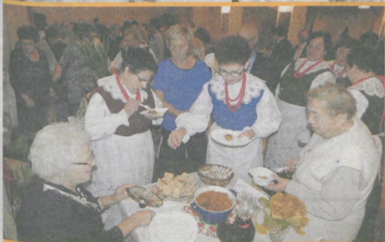
Druga część przeglądu odbywała się w sali wiejskiej w Potarzysty. Biesiadzie towarzyszyła degustacja potraw regionalnych