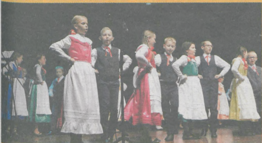
„Szwajcaria Żerkowska” działająca przy Szkole Podstawowej w Żerkowie na początku lipca została zaproszona do udziału w XIX Międzynarodowych Spotkaniach Folklorystycznych. W październiku po raz pierwszy zaprezentowała się na przeglądzie powiatowym