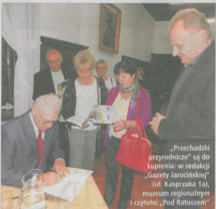
„Przechadzki przyrodnicze” są do kupienia: w redakcji „Gazety Jarocińskiej” (ul. Kasprzaka 1a), muzeum regionalnym i czytelnicy „Pod Ratuszem”