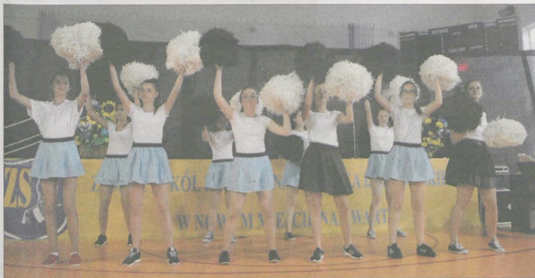
Podczas uroczystości zaprezentowały się szkolne cheerleaderki