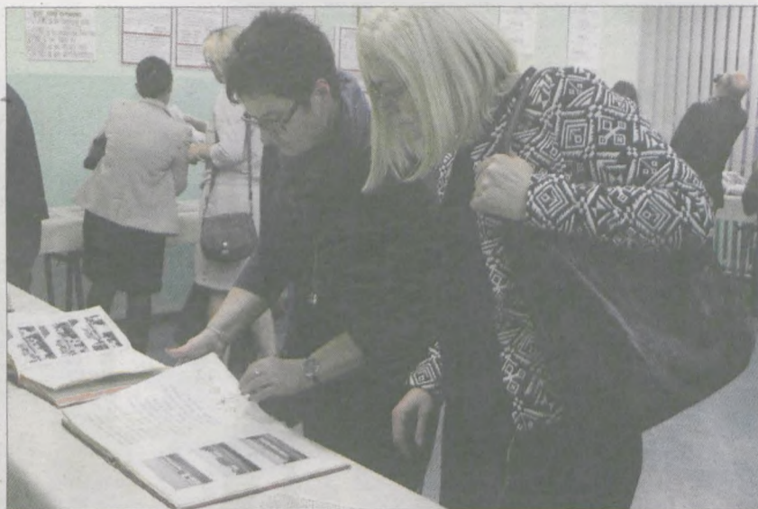
Dużym zainteresowaniem cieszyły się archiwalne kroniki szkolne