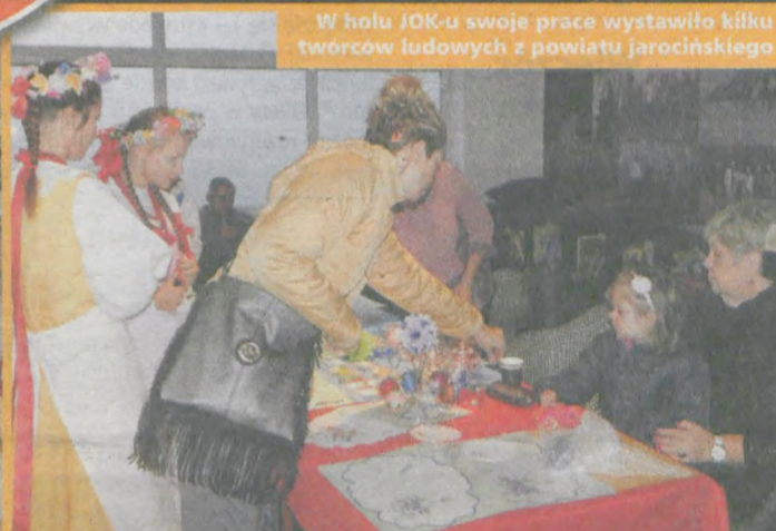
W holu JOK-u swoje prace wystawiło kilku twórców ludowych z powiatu jarocińskiego