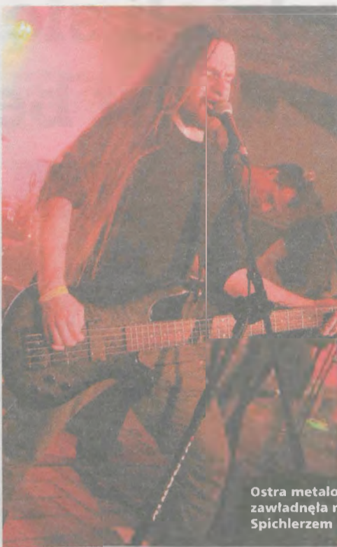
Ostra metalowa muzyka zawładnęła na kilka godzin Spichlerzem