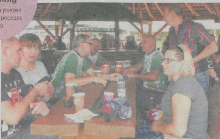
Odpoczynek i kawa po przyjeździe do Hermanowa