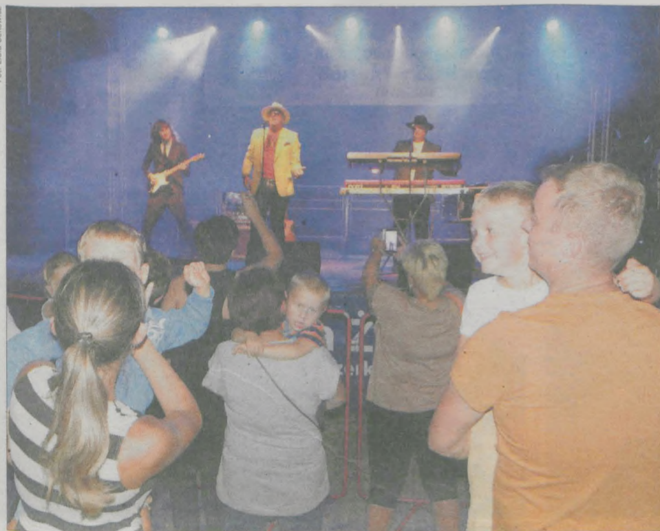
Najwięcej widzów przybyło do żerkowskiego amfiteatru na ostatni z koncertów i zabawę taneczną