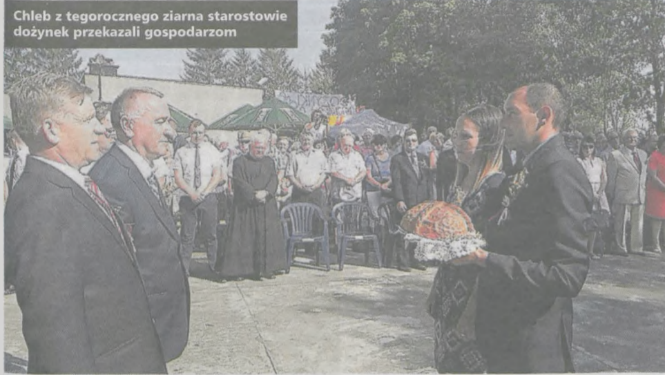
Chleb z tegorocznego ziarna starostowie dożynek przekazali gospodarzom