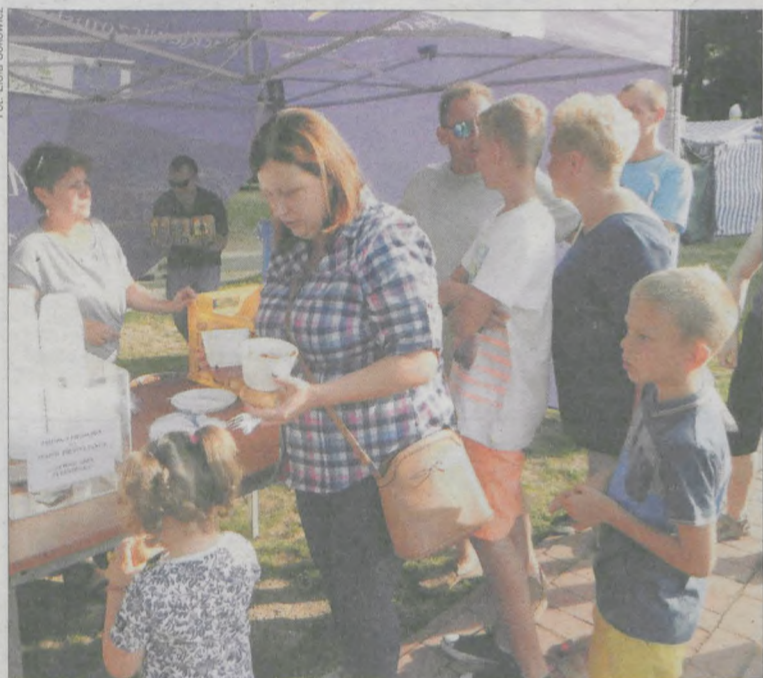
Bigos i grochówka smakowały osobom, które przyszły na imprezę z okazji pożegnania lata

O oficjalnej części obchodów 70-lecia Koła Łowieckiego nr 26 „Borsuk” w Żerkowie w następnym numerze „GJ”.