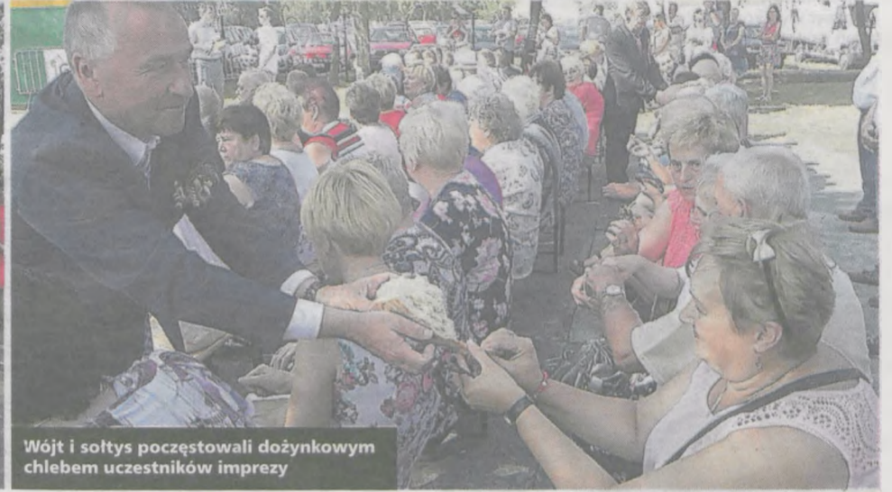
Wójt i sołtys poczęstowali dożynkowym chlebem uczestników imprezy