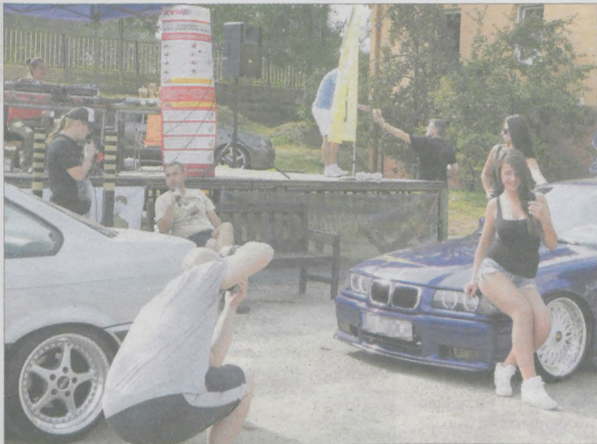
Przez cały weekend w Mickiewiczowskim Centrum Turystycznym w Żerkowie odbywał się zlot Tuning Camp OWLA 5 Friends. W trakcie właściciele samochodów opowiadali o modyfikacjach, jakie wprowadzili w swoich pojazdach