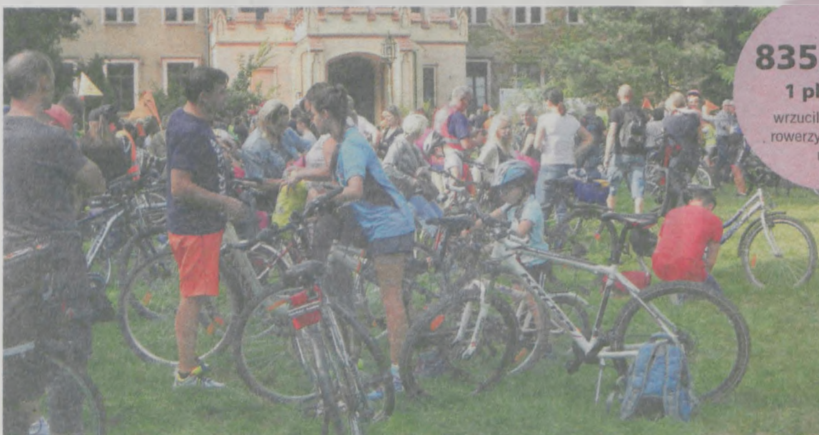
Przed pałacem Radolińskich zebrało się ok. 300 rowerzystów

wrzucili do puszek rowerzyści podczas rajdu