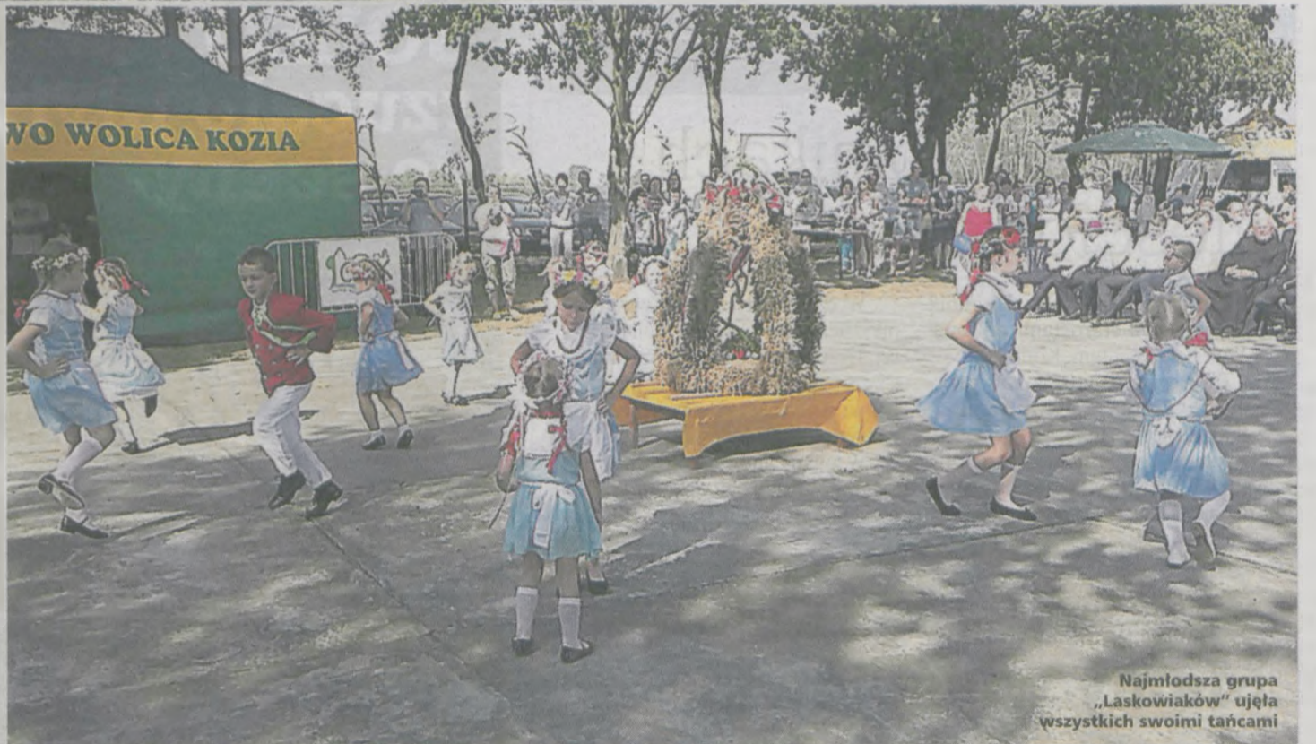
Najmłodsza grupa „Laskowiaków” ujęła wszystkich swoimi tańcami