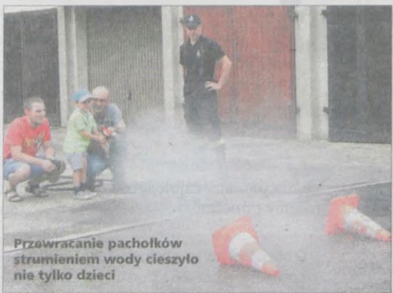
Przewracanie pacholek strumieniem wody cieszyło nie tylko dzieci