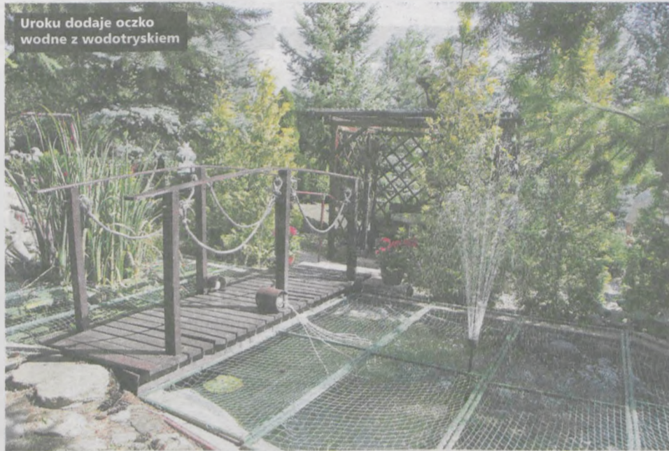
Uroku dodaje oczko wodne z wodotryskiem

Obaj mężczyźni zgodnie twierdzą, że w ogrodzie jest bardzo dużo pracy, tym bardziej, że nie stosują zbyt wielu środków ochrony. Sami