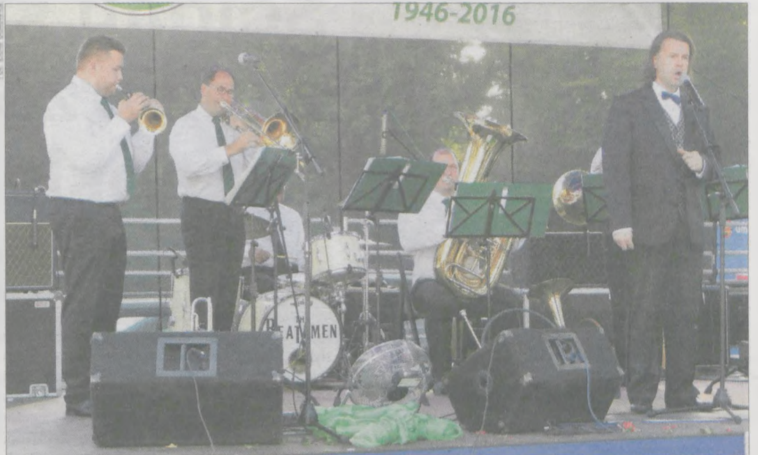
Capella Zamku Rydzynskiego zapewniła oprawę mszy św. jubileuszowej, a po niej data godzinny koncert, podczas którego oprócz pieśni myśliwskich zabrzmiało m.in. słynne „O Sole mio”