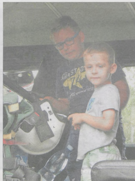
Zwiedzanie wozu strażackiego było punktem obowiązkowym chłopców z Bogusławia

Wieczorem mieszkańcy bawili się przy muzyce Illegal Boys. imprezę zakończyło wspólne ognisko.