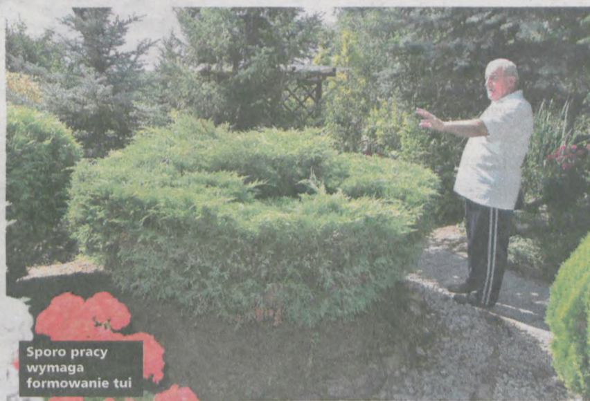
Sporo pracy wymaga formowanie tui