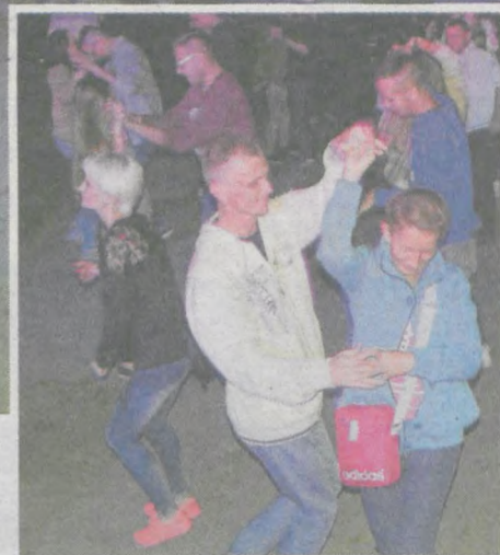
Wśród publiczności znaleźli się amatorzy tańca