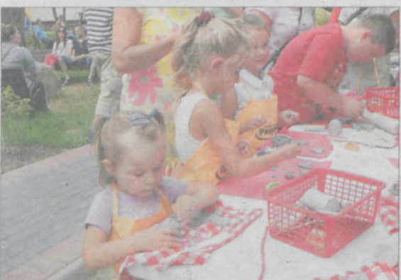
Gliniane budowle stanowiły atrakcje szczególnie dla najmłodszych