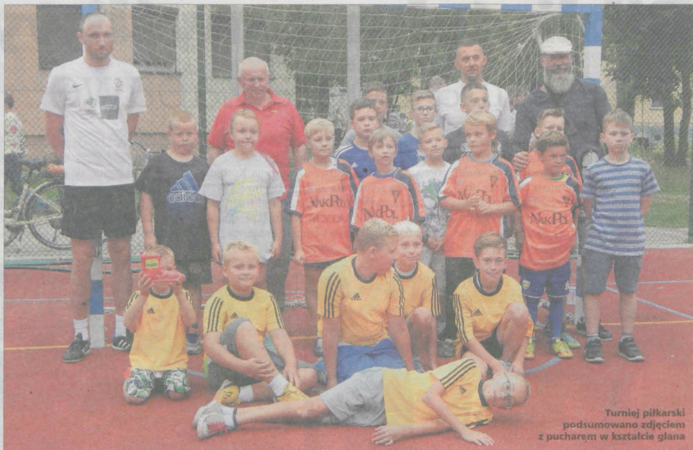
Turniej piłkarski podsumowano zdjęciem z pucharem w kształcie glana