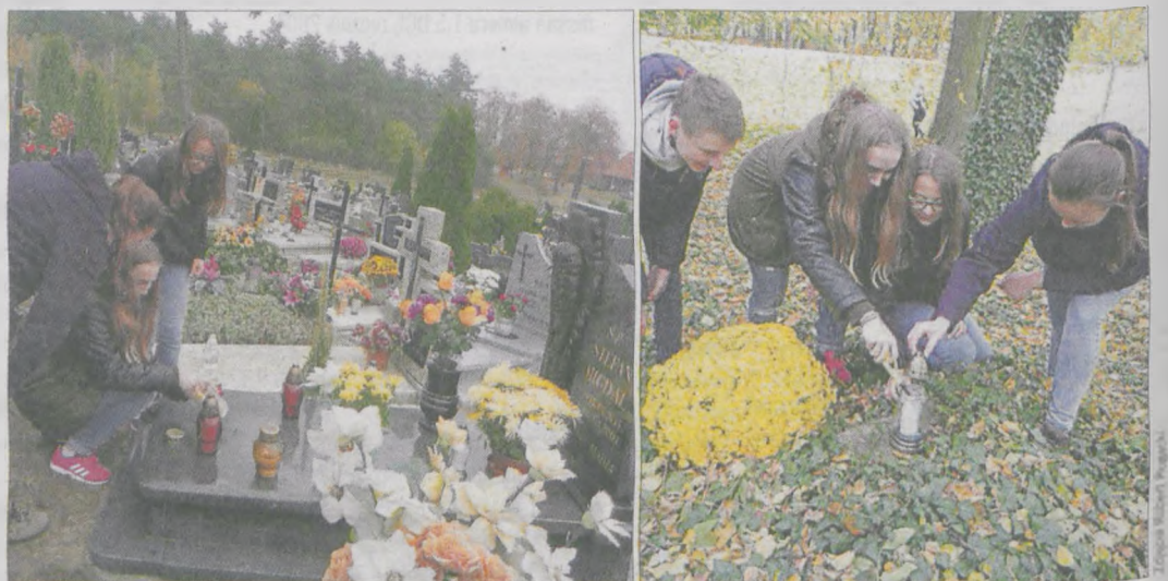
Uczniowie odwiedzili zarówno cmentarz, jak i teren dawnego kirkutu w lesie