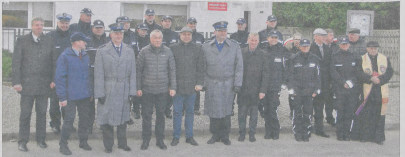
Wspólne zdjęcie funkcjonariuszy i zaproszonych gości