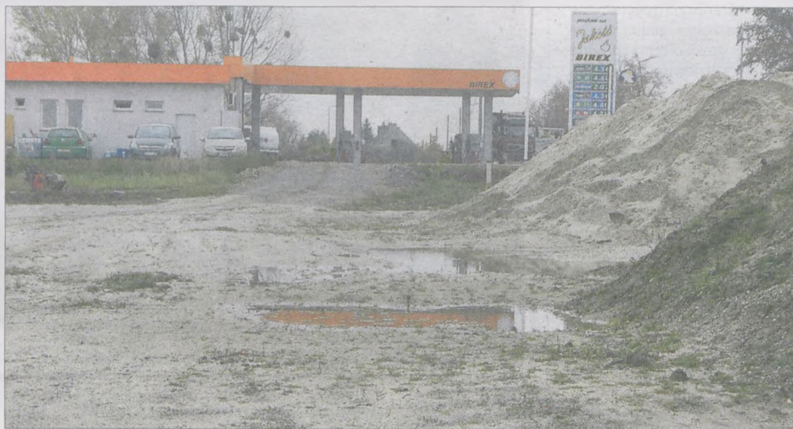
W bliskim sąsiedztwie stacji paliw ma stanąć nowy jarociński hotel