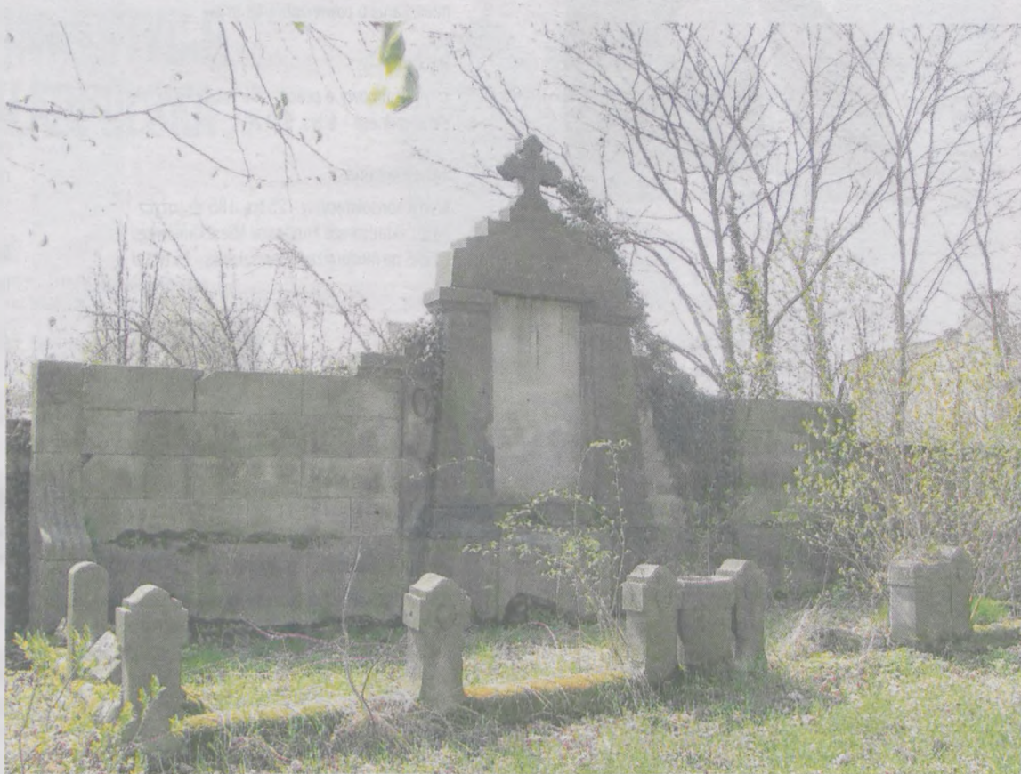
Grobowiec na cmentarzu ewangelickim w Jarocinie

► Cmentarz to miejsce wielkiego pojednania ludzi, niezależnie od poglądów, wyznania czy statusu społecznego. Ze względu na pamięć o umarłych, nie mówi się o nich źle. Aby utrwalić nasz pietyzm, stawiamy na ich grobach pomniki i staramy się, aby były zadbane, a same cmentarze posiadają szczególny status miejsca świętego.