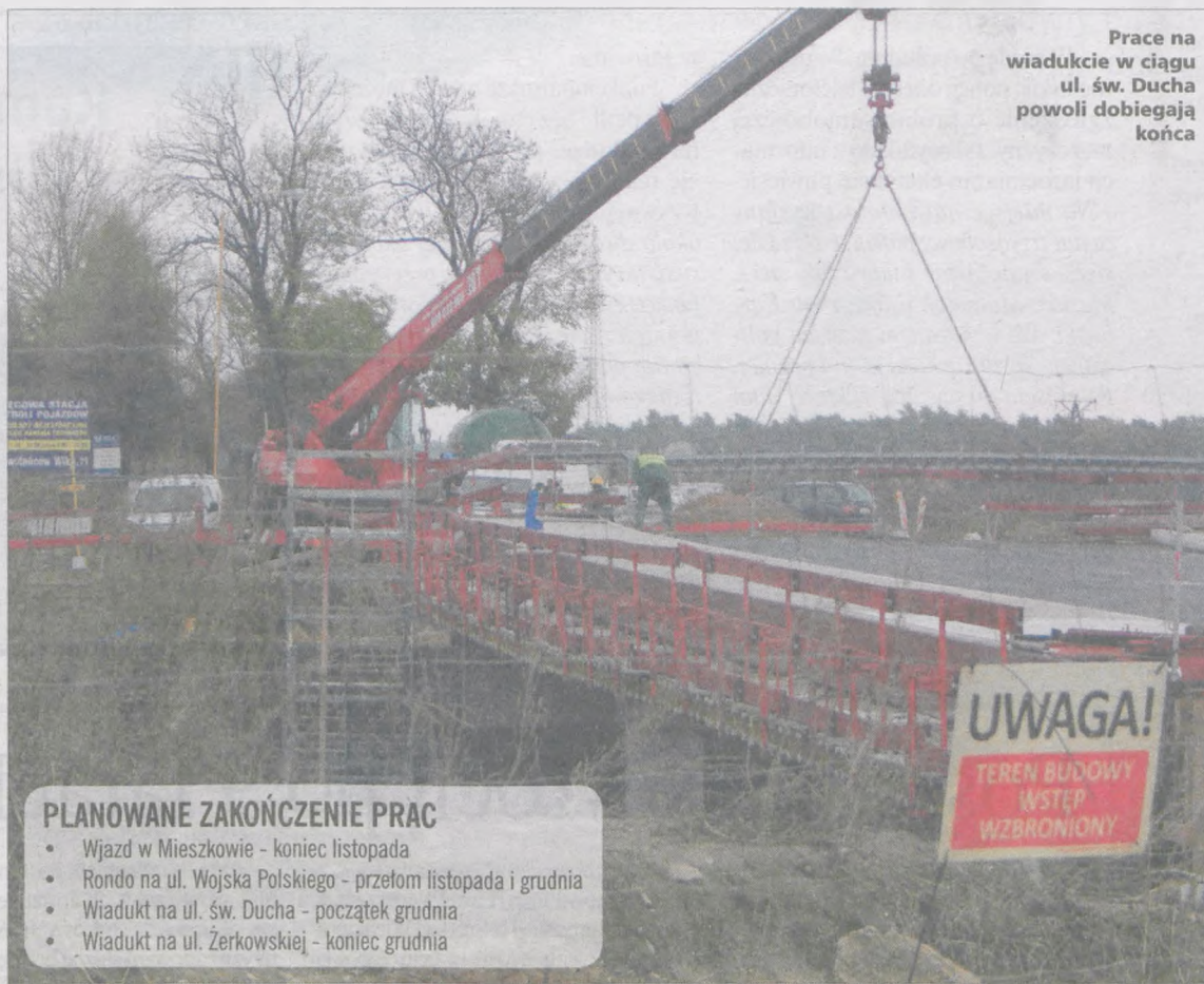
Prace na wiadukcie w ciągu ul. św. Ducha powoli dobiegają końca

Osoby jeżdżące w stronę Poznania, od pewnego czasu poruszają się objazdem, bo trwa łączenie „11” z po-